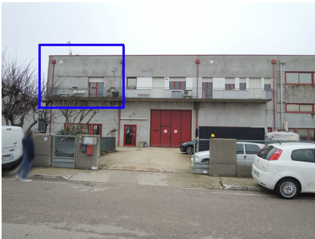
Foto 17 - veduta esterna da via Ettore Bugatti dell'edificio con individuazione dell'u.i. residenziale al piano primo di cui al CORPO B

tel 041-7241027 C.F GLL CRL 58L19 L736O - P.I.: 02230210276