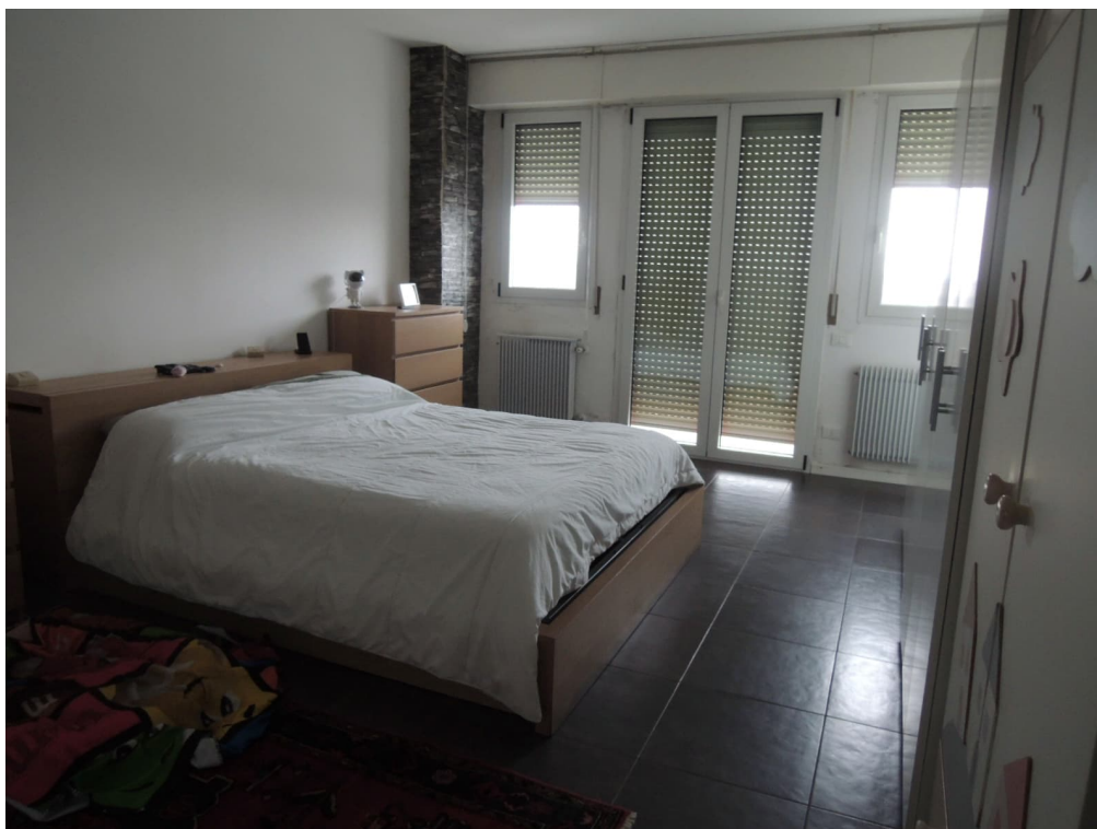
Foto 15 – magazzino piano primo adibito illegittimamente ad appartamento (corpo A)

tel 041-7241027 C.F GLL CRL 58L19 L7360 - P.I.: 02230210276