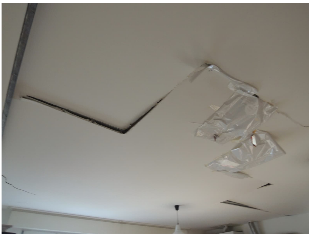
Foto 16 – magazzino piano primo adibito illegittimamente ad appartamento (corpo A)