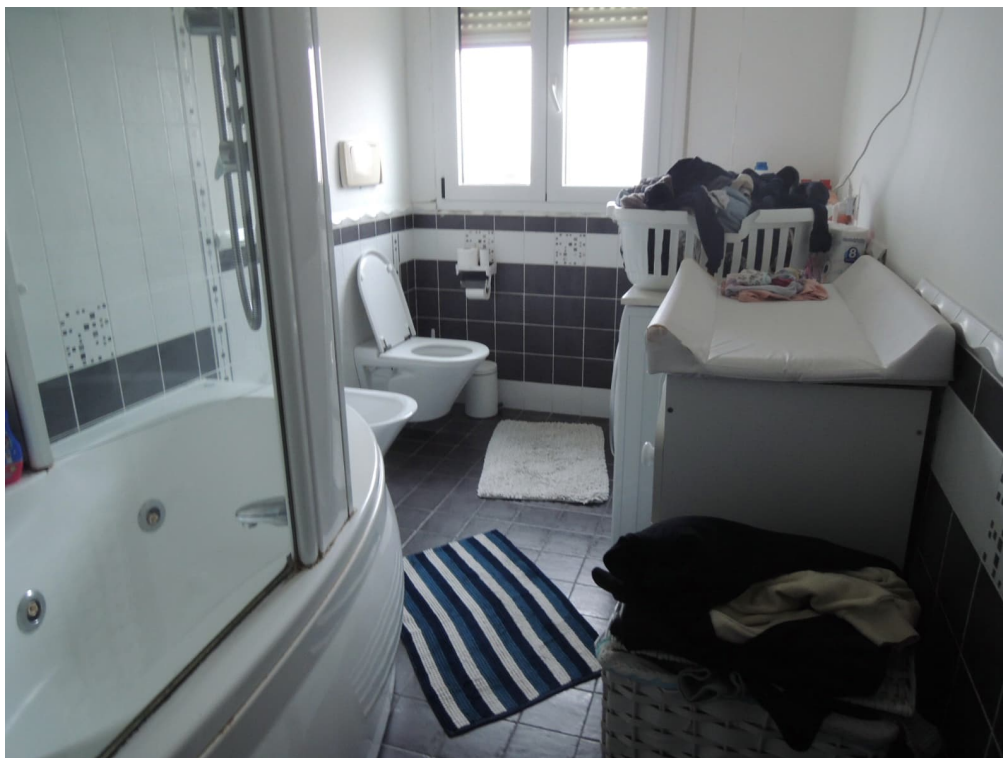
Foto 14 – magazzino piano primo adibito illegittimamente ad appartamento (corpo A)