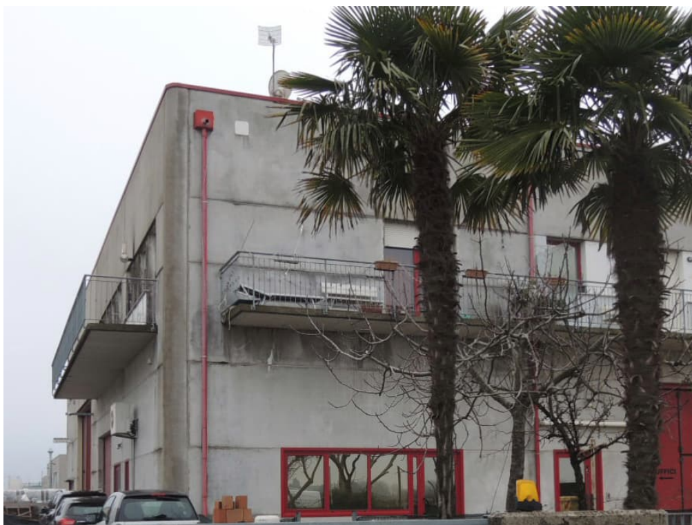
Foto 18 - veduta esterna dell'edificio nella zona d'angolo ove ubicato l'appartamento al piano primo (corpo B)