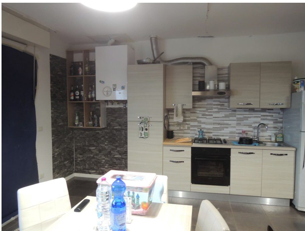
Foto 12 – magazzino piano primo adibito illegittimamente ad appartamento (corpo A)