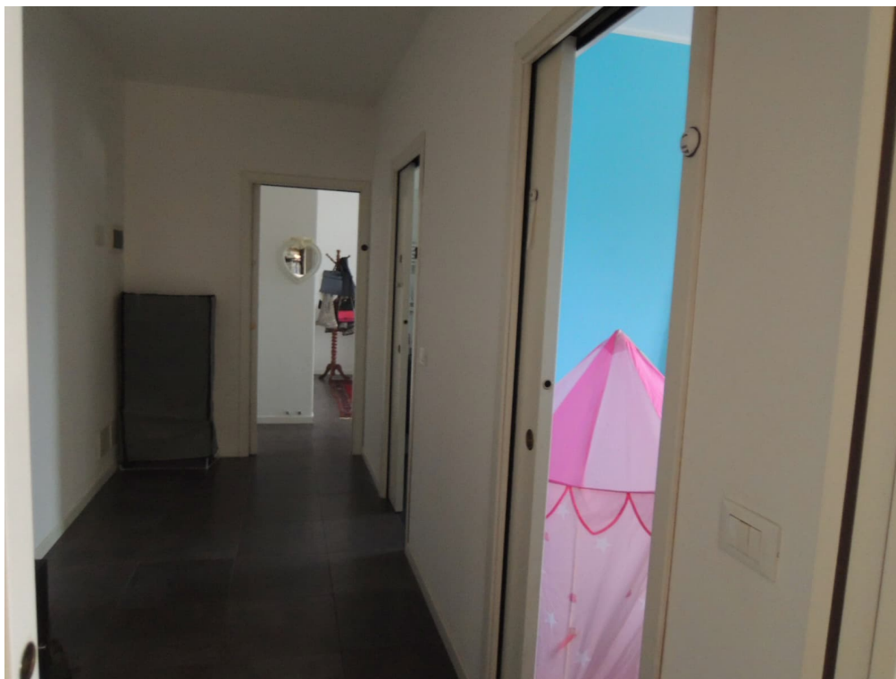
Foto 13 – magazzino piano primo adibito illegittimamente ad appartamento (corpo A)

tel 041-7241027 C.F GLL CRL 58L19 L736O - P.I.: 02230210276