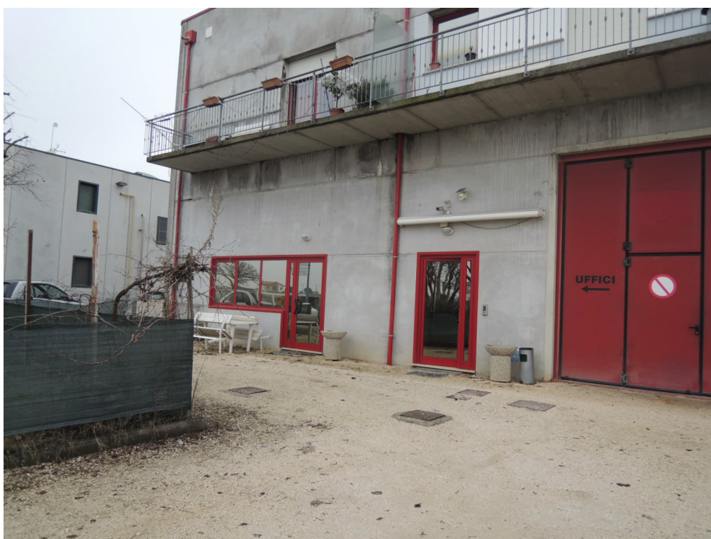
Foto 2 - veduta esterna dell'u.i. artigianale - corpo A