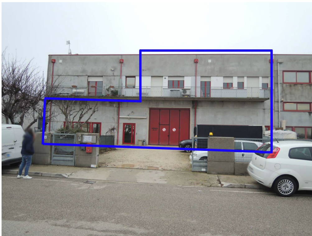
Foto 1 - veduta esterna da via Ettore Bugatti dell'edificio con individuazione dell'u.i. artigianale di cui al CORPO A