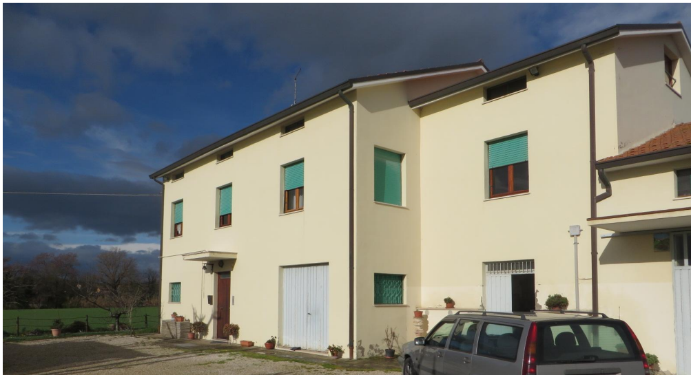
Edificio in cui vi sono i due appartamenti e i magazzini