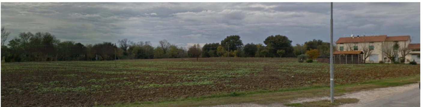
Terreni limitrofi all'immobile