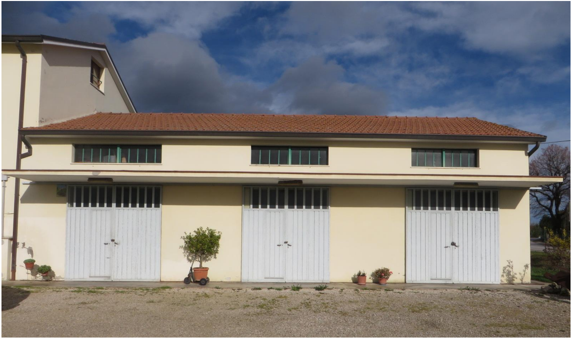
Magazzini – prospetto principale