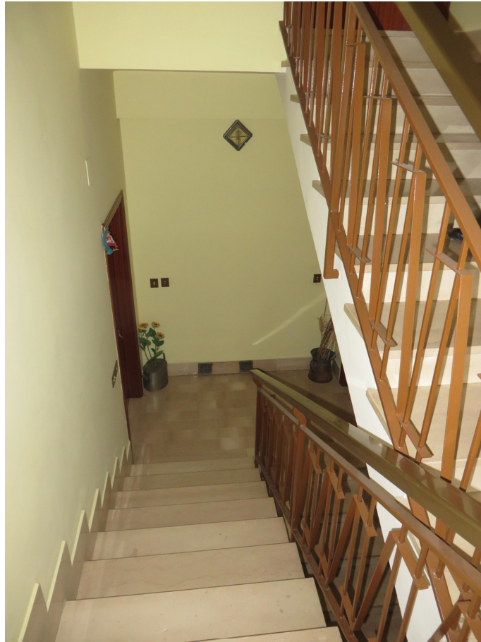
Scala interna condominiale