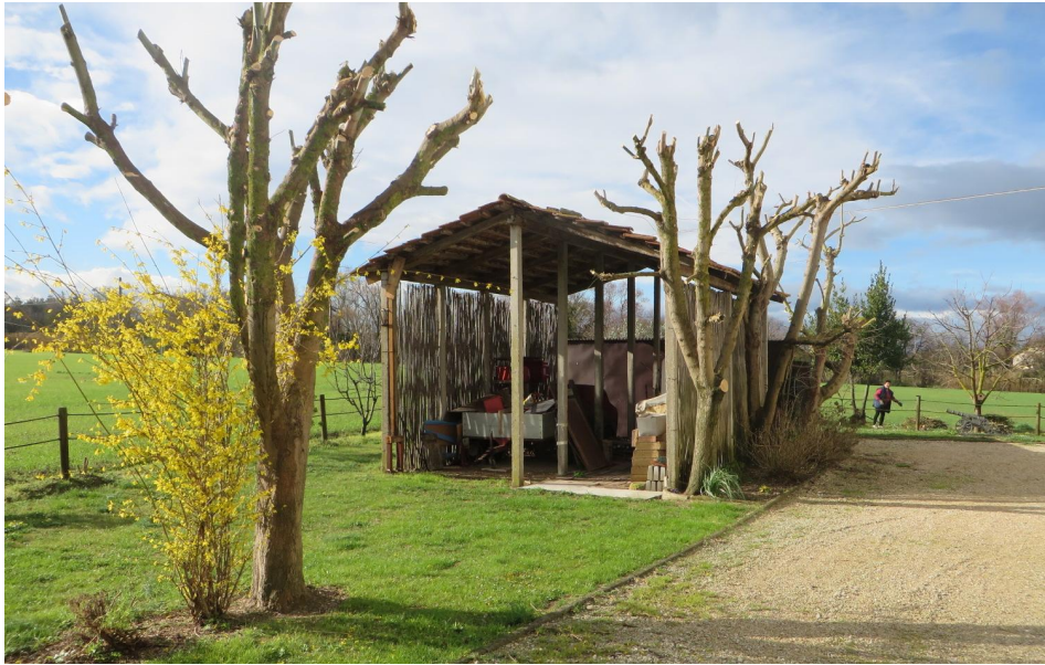
Capanna di pertinenza dell'appartamento situato al piano terra (Bene n. 6)