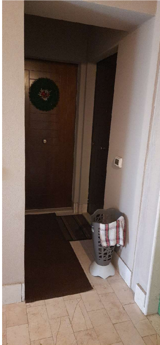
FOTO 7_VISTA ESTERNA- INGRESSO DELL'APPARTAMENTO