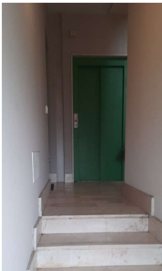
FOTO 6_VISTA ESTERNA- ARRRIVO AL PIANO PRIMO MEDIANTE SCALA B DI RISALITA ED ACENSORE