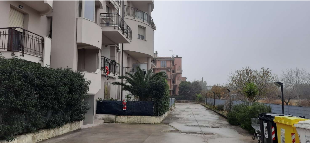
FOTO 3_VISTA ESTERNA- SCORCIO DELLA CORTE ESTERNA CONDOMINIALE