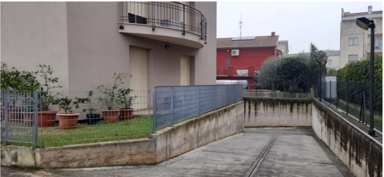
FOTO 4_VISTA ESTERNA- SCORCIO DELLA RAMPA DI ACCESSO AL PIANO INTERRATO DOVE SONO POSIZIONATI I GARAGE PRIVATI