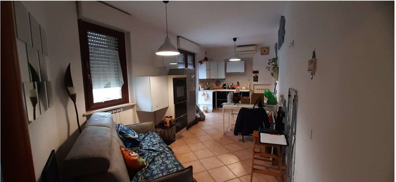
FOTO 8_VISTA INTERNA- ZONA GIORNO CON ANGOLO CUCINA