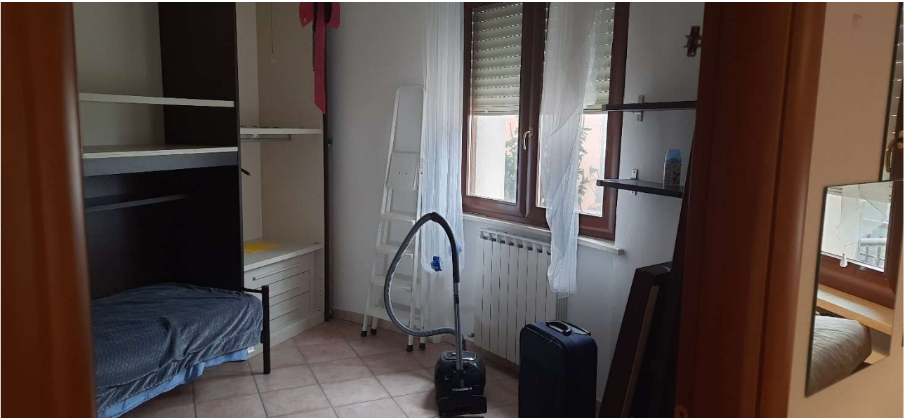
FOTO 9_VISTA INTERNA- CAMERA