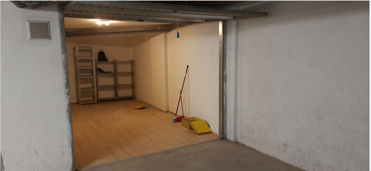
FOTO 15_VISTA INTERNA- VISTA DEL LOCALE GARAGE