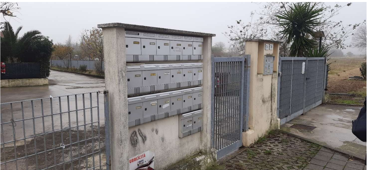
FOTO 2_ VISTA ESTERNA-INGRESSI CONDOMINIALI, PEDONALE E CARRABILE DA VIA CHE GUEVARA