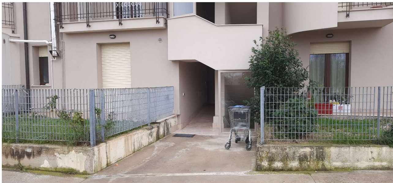
FOTO 5_VISTA ESTERNA- INGRESSO ALLA SCALA ESTERNA B DI RISALITA