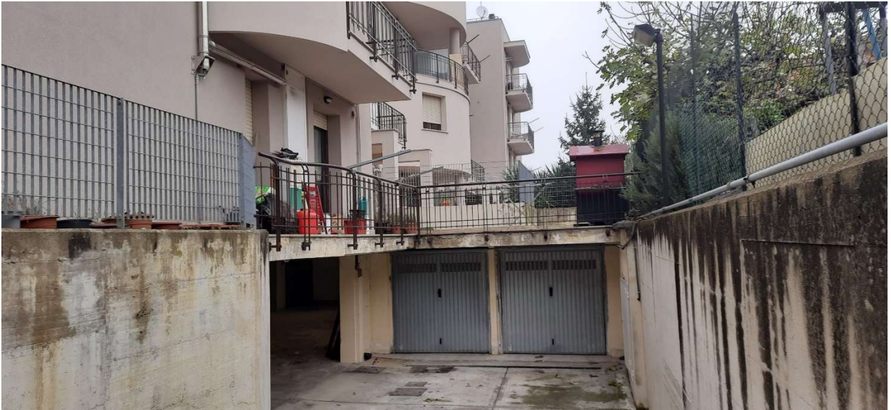
FOTO 13_VISTA ESTERNA- INGRESSO CARRABILE AI LOCALI INTERRATI (AUTORIMESSE)