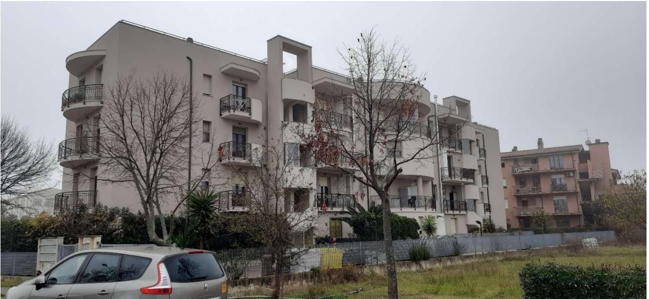
FOTO 1_ VISTA ESTERNA FABBRICATO RESIDENZIALE LATO NORD OVEST