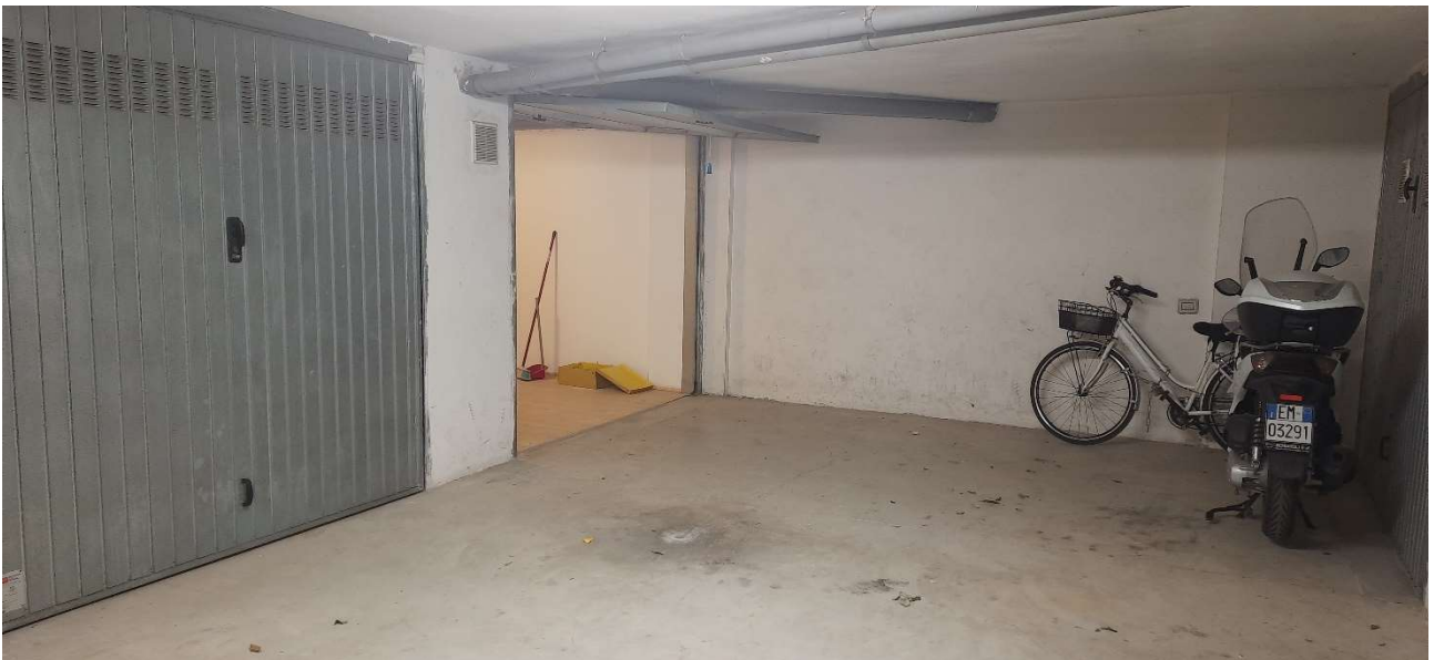
FOTO 14_VISTA INTERNA- INGRESSO AL LOCALE GARAGE DA SPAZIO DI MANOVRA CONDOMINIALE