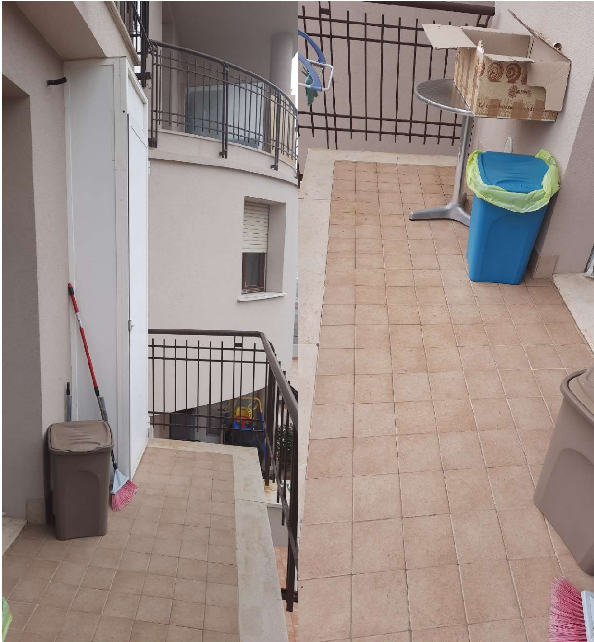
FOTO 11 E 12_VISTA ESTERNA- BALCONE