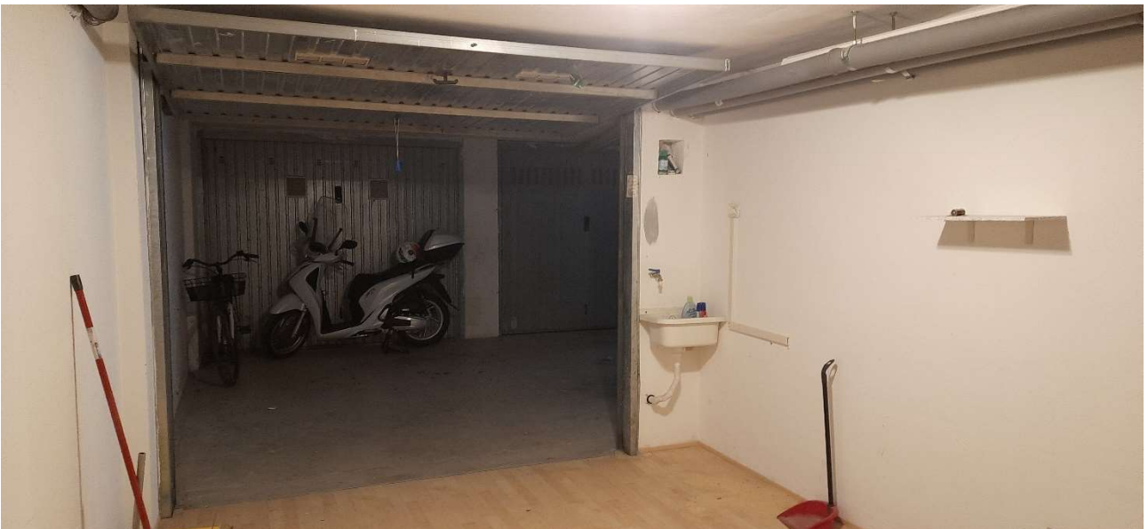
FOTO 16_VISTA INTERNA- VISTA DEL LOCALE GARAGE