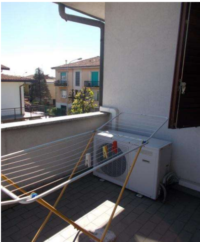
terrazzino stanza 4