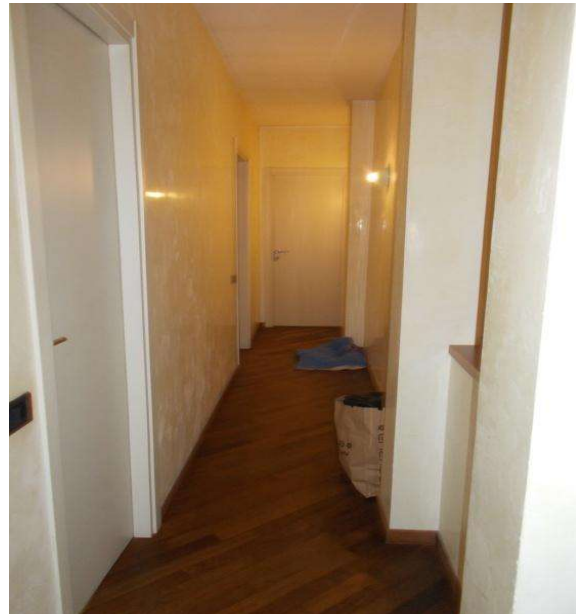
P1: pianerottolo e corridoio