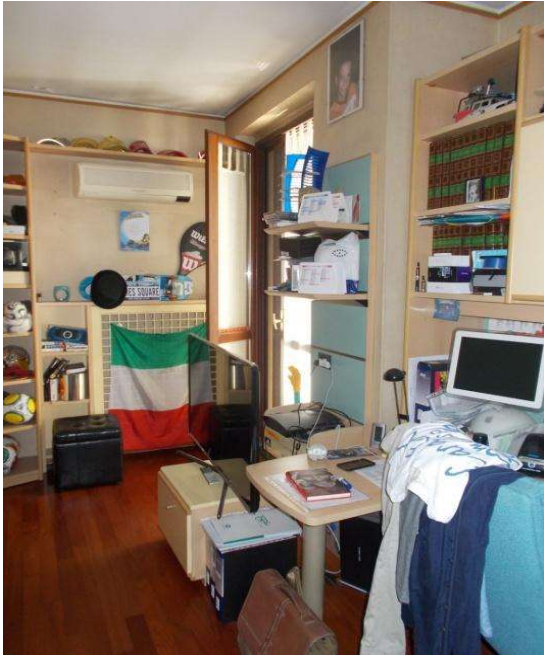
P1 stanza 4