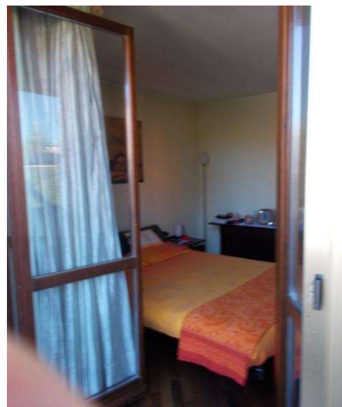
P1 : stanza da letto padronale