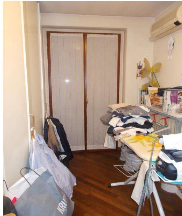
P1 stanza 3