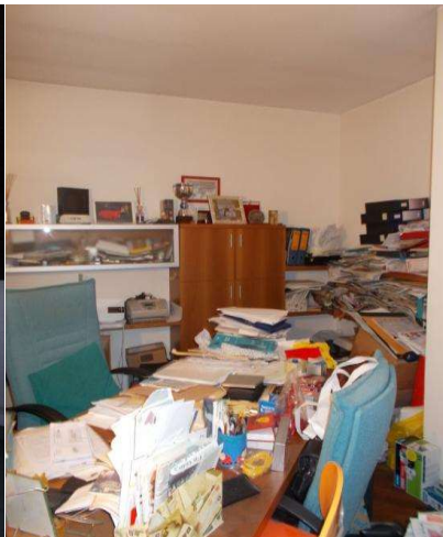
p1 stanza 5