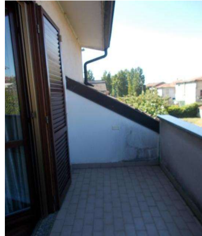
P1: stanza da letto padronale e terrazzo collegato