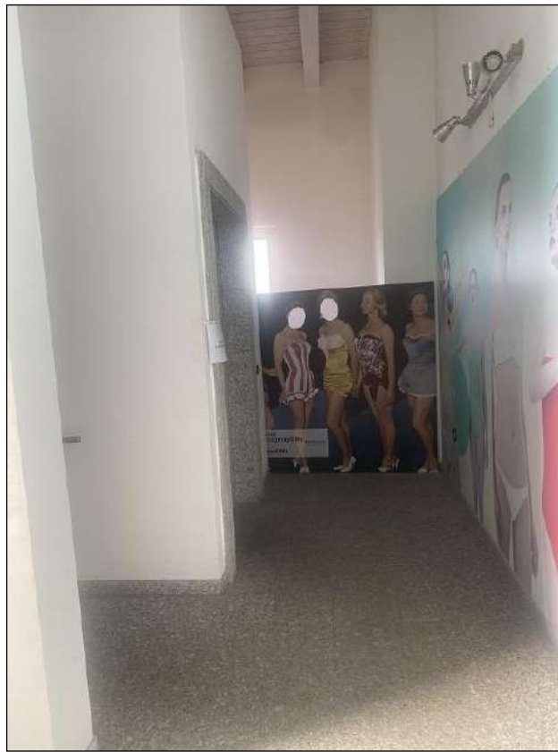
SBARCO ASCENSORE - VISTA FOTOGRAFICA 48)