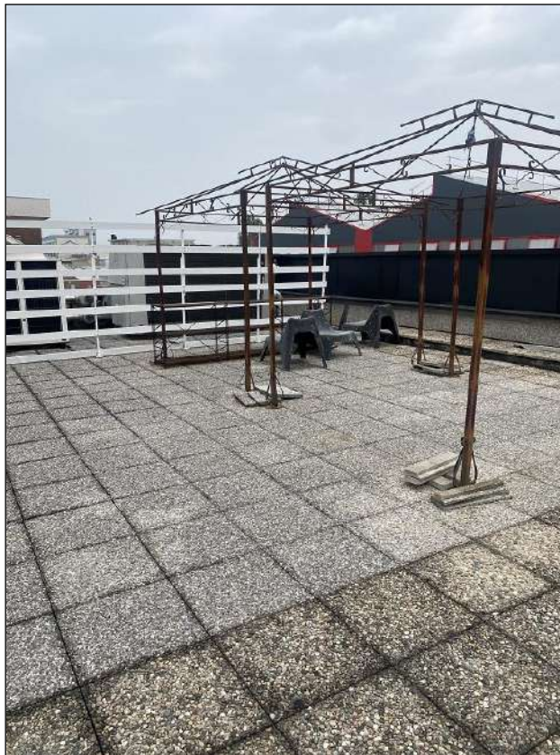
TERRAZZO - VISTA FOTOGRAFICA 53)