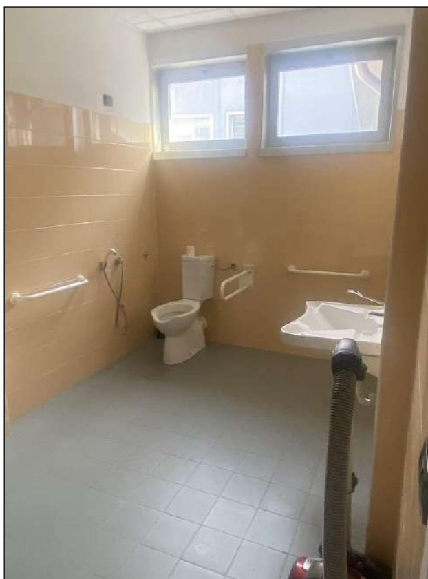
SERIZIO IGIENICO - VISTA FOTOGRAFICA 50)