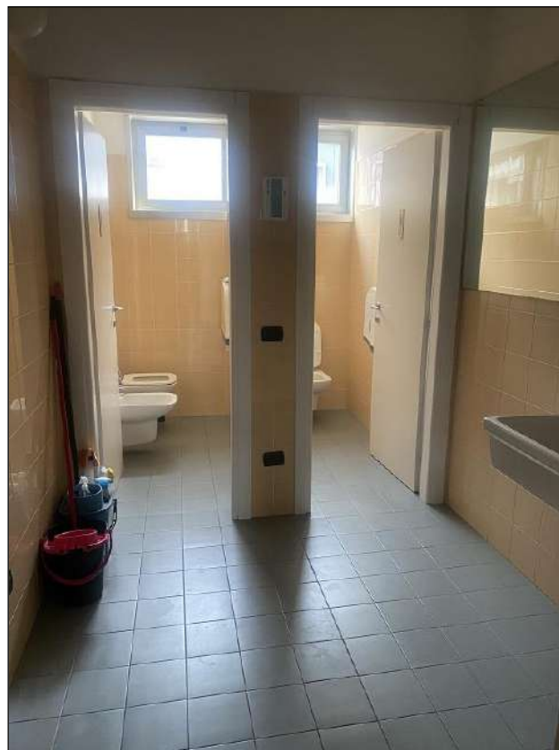
SERIZIO IGIENICO - VISTA FOTOGRAFICA 49)