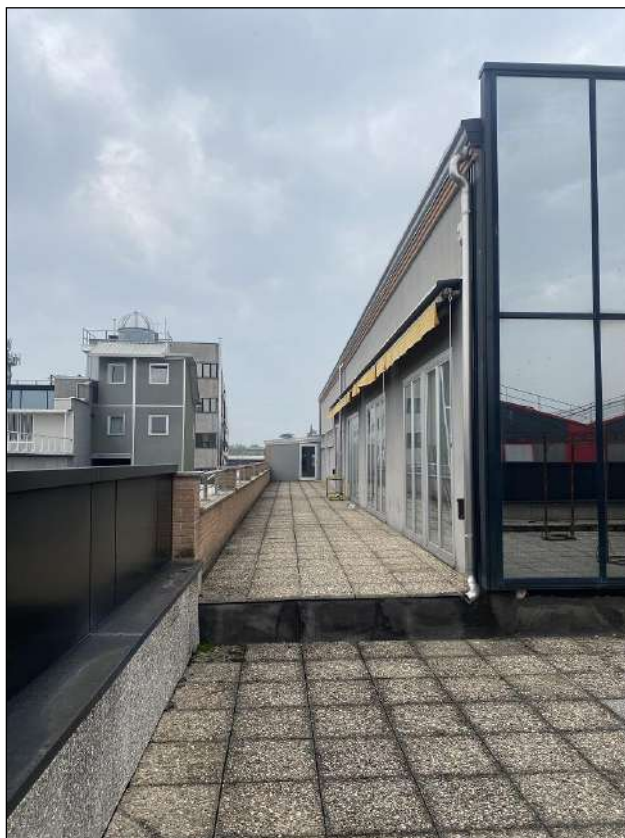
TERRAZZO - VISTA FOTOGRAFICA 54)