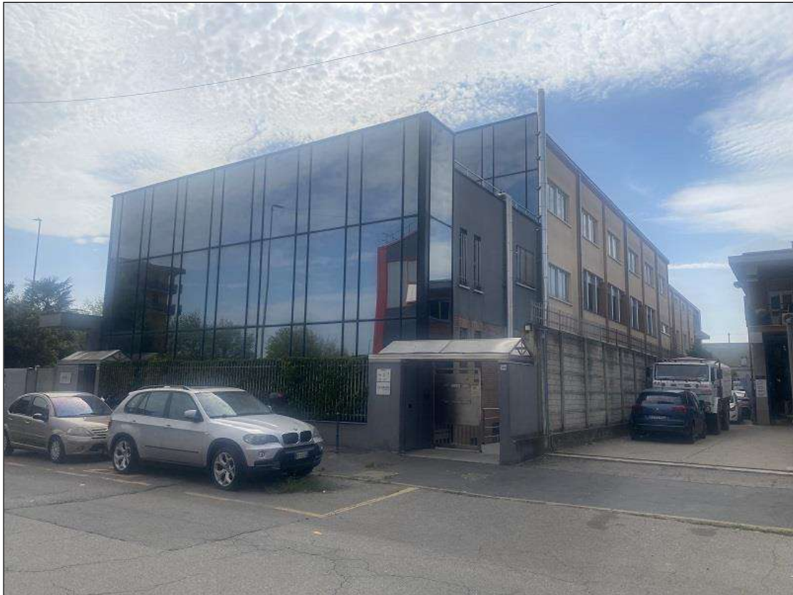
PROSPETTO NORD/EST SU VIA C. COLOMBO – VISTA FOTOGRAFICA 1)