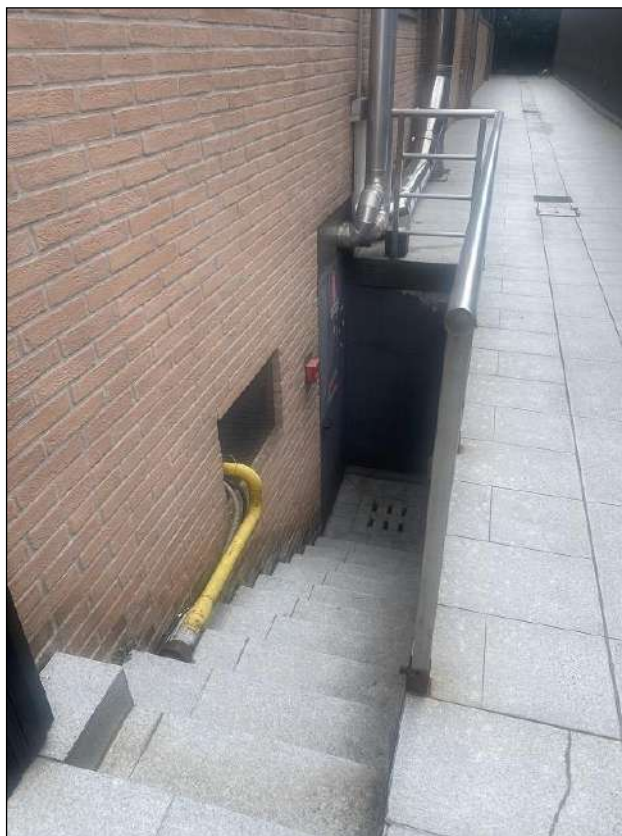
INGRESSO/ INTERNO LOCALE CALDAIA - VISTA FOTOGRAFICA 3)