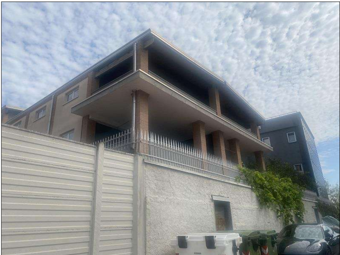
PROSPETTO OVEST- VISTA FOTOGRAFICA 5)