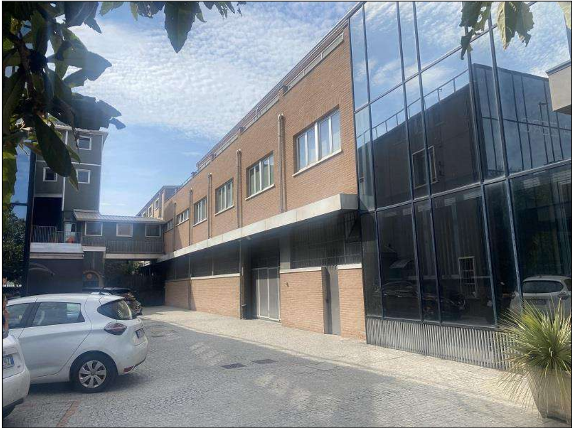
PROSPETTO SUD- VISTA FOTOGRAFICA 4)