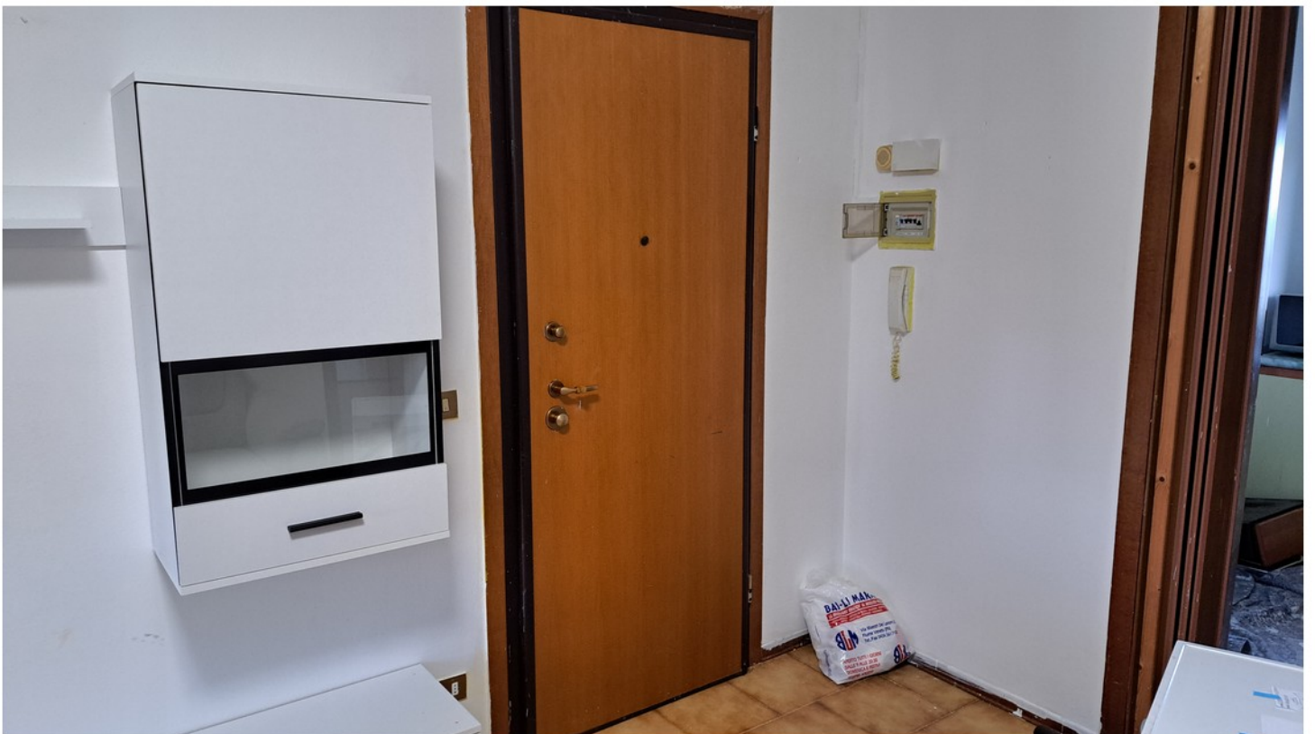
8 - soggiorno ingresso