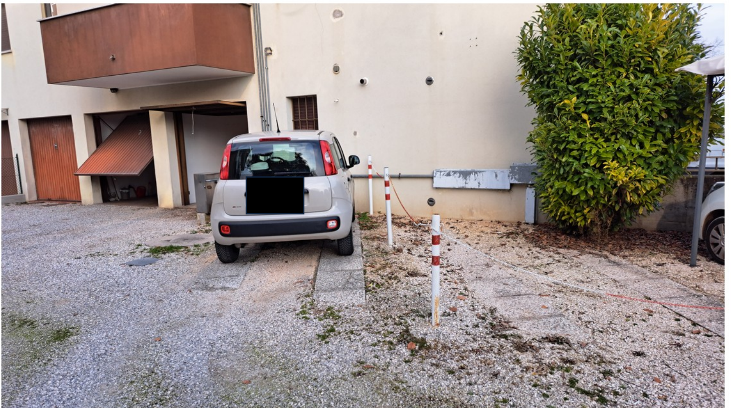
28 - posto auto