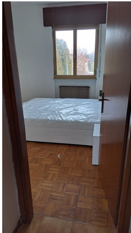
14 - camera matrimoniale