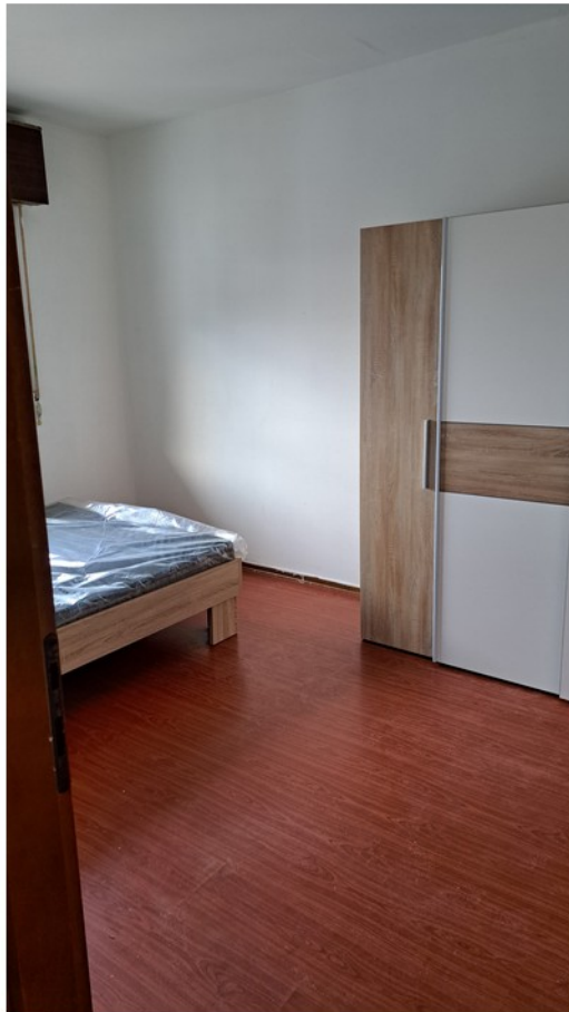
18 - camera