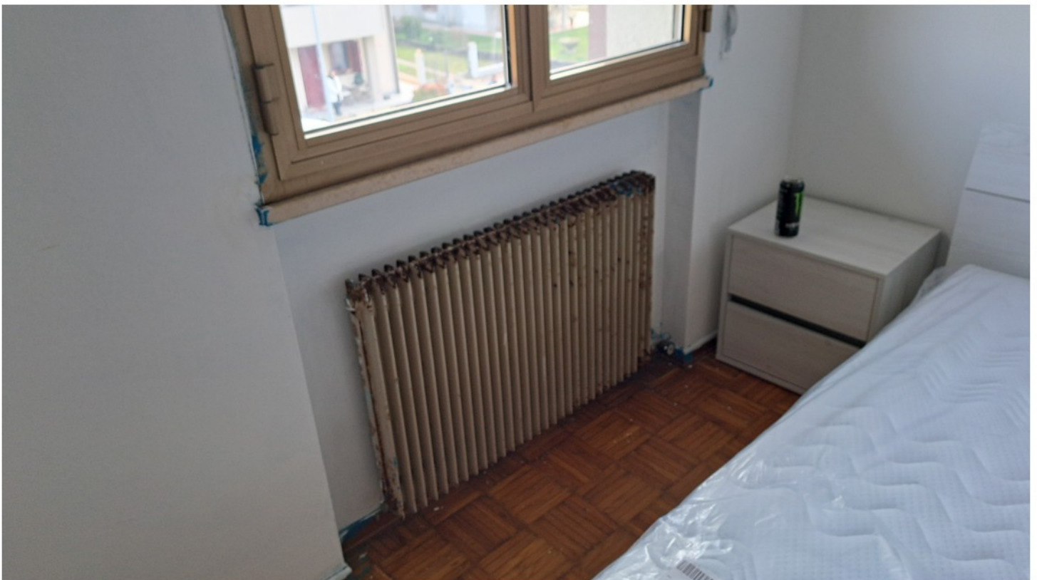
16 - particolare radiatore