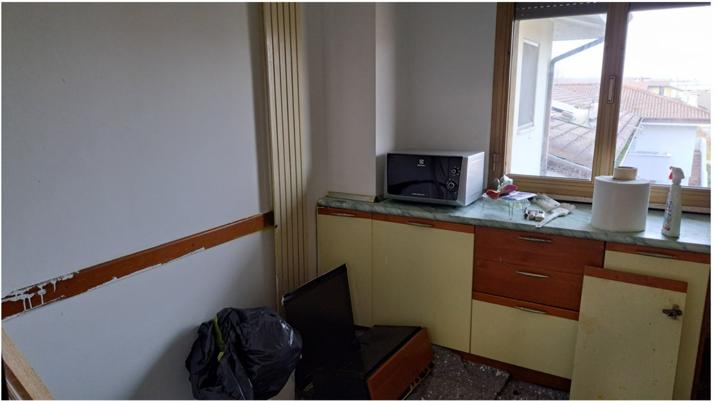
11 - cucina