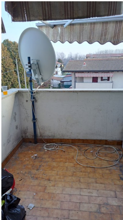
20 - terrazzo