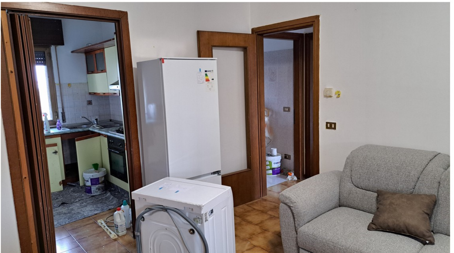
6 - soggiorno