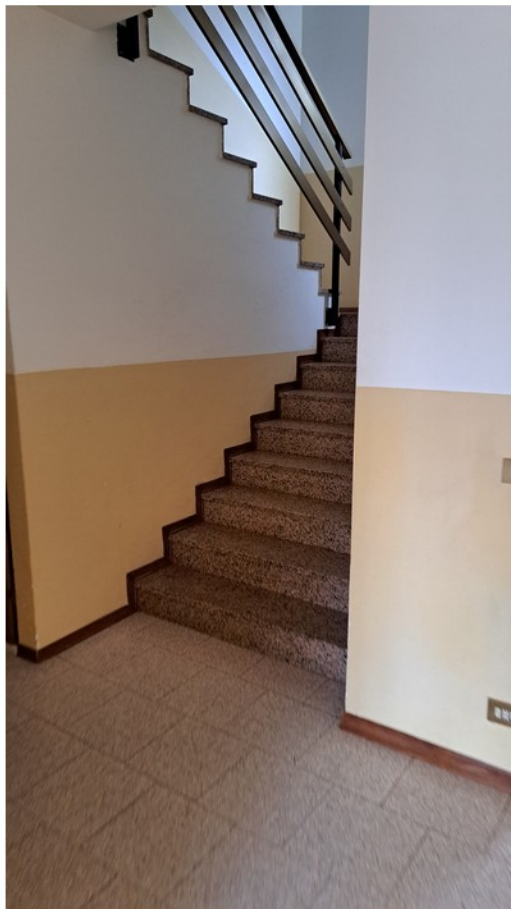
4 - scala comune