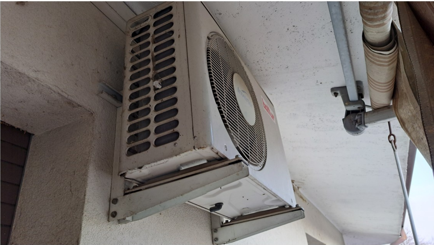
21 - cmimatizzatore