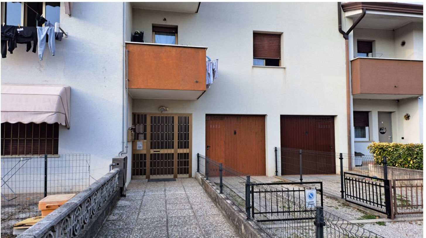
2 - atrio ingresso condominio