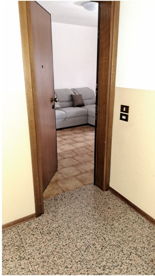
5 - ingresso