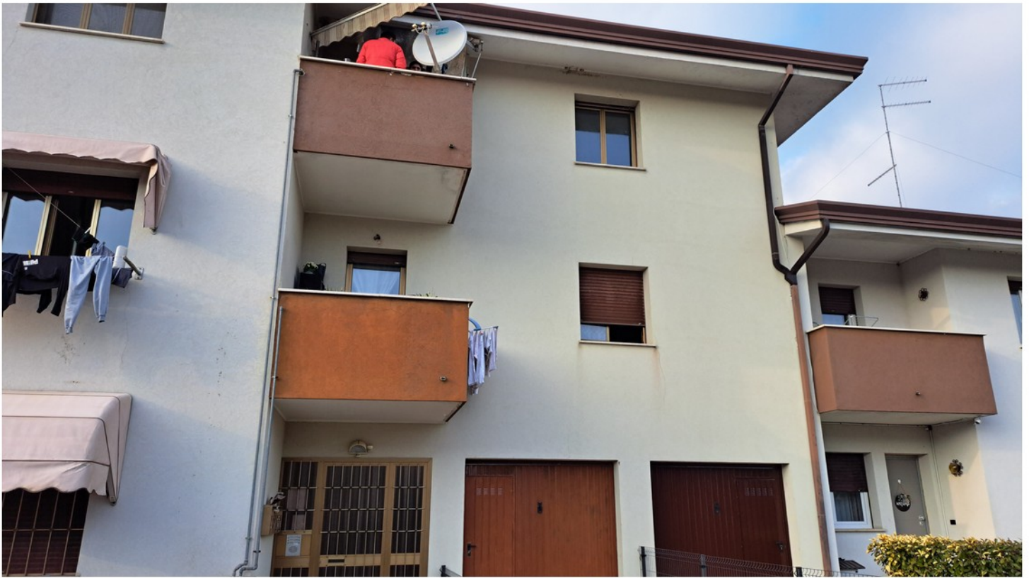
1 - fronte sud esterno