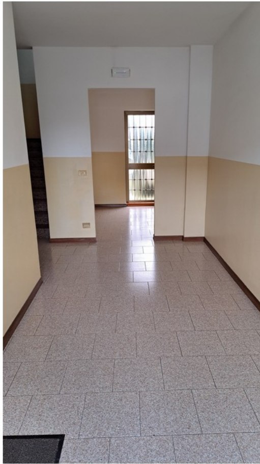
3 - atrio ingresso