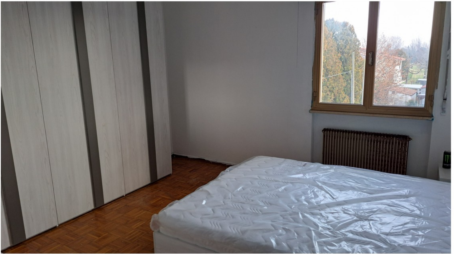
15 - camera matrimoniale