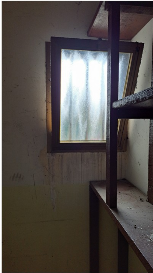
27 - cantina