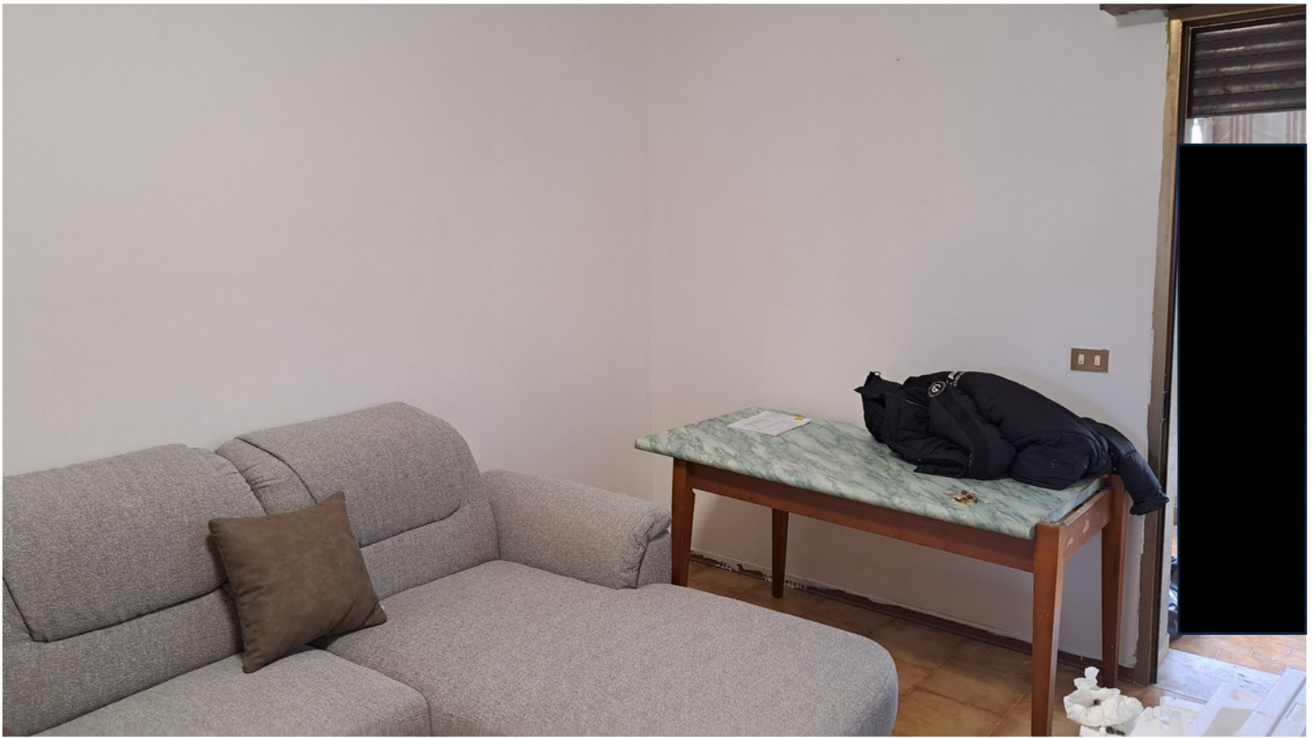
9 - soggiorno