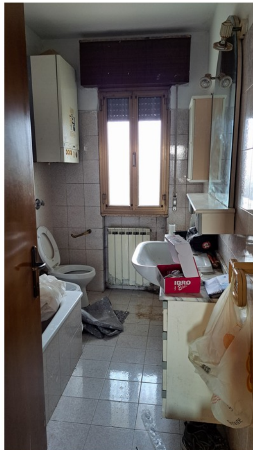
12 - bagno