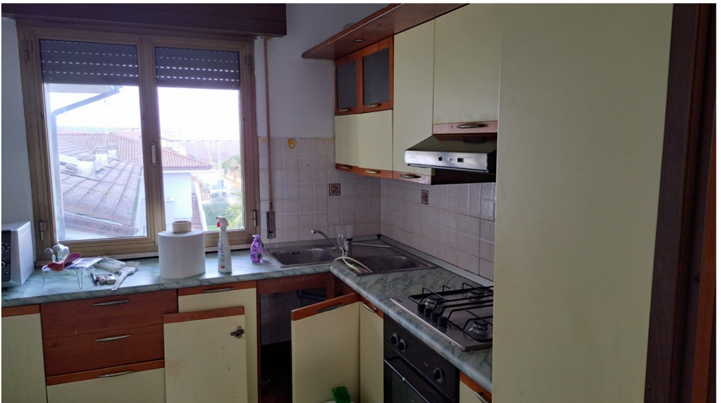
10 - cucina