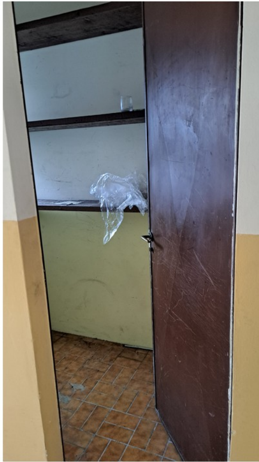
25 - cantina