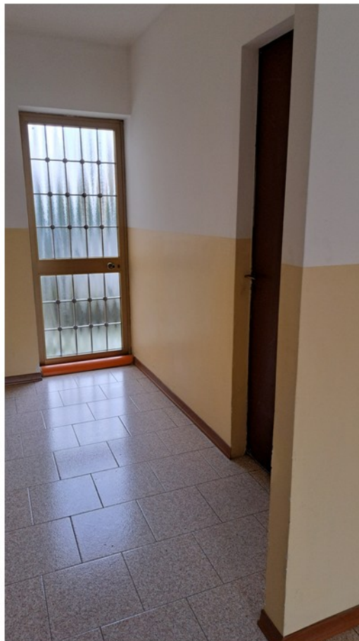
24 - accesso cantina