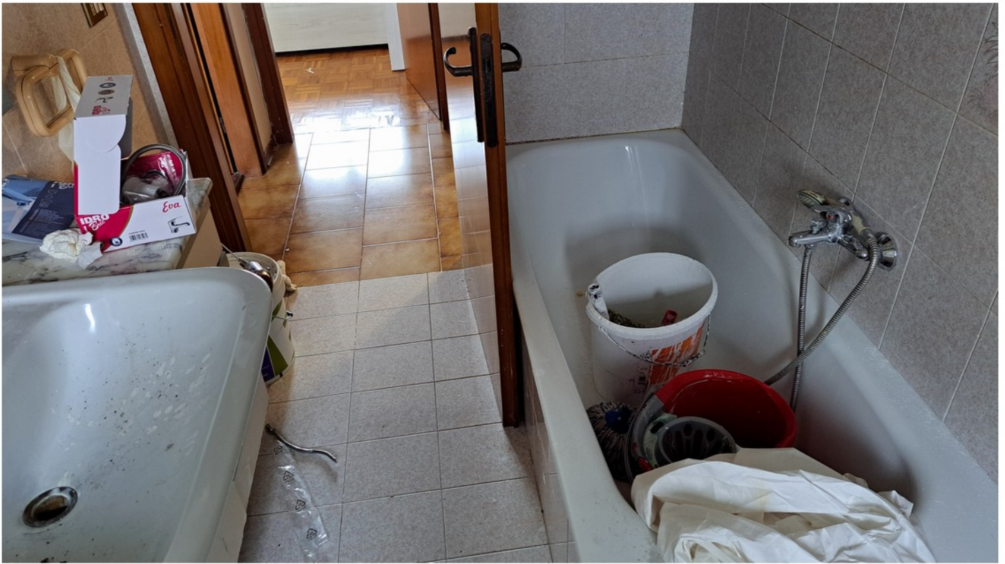
13 - bagno