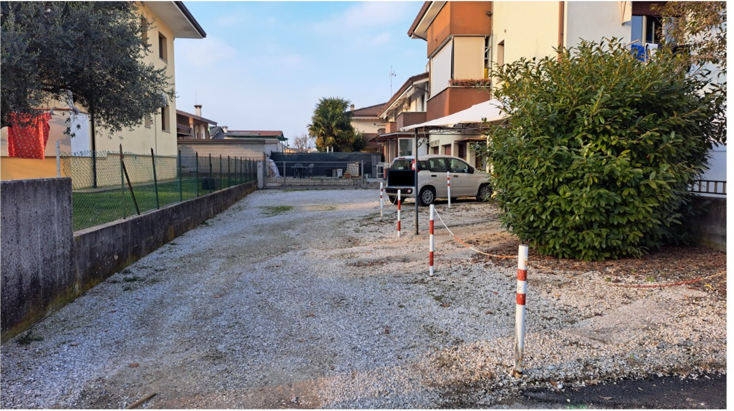
29 - accesso e posto auto