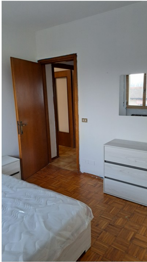
17 - camera matrimoniale corridoio