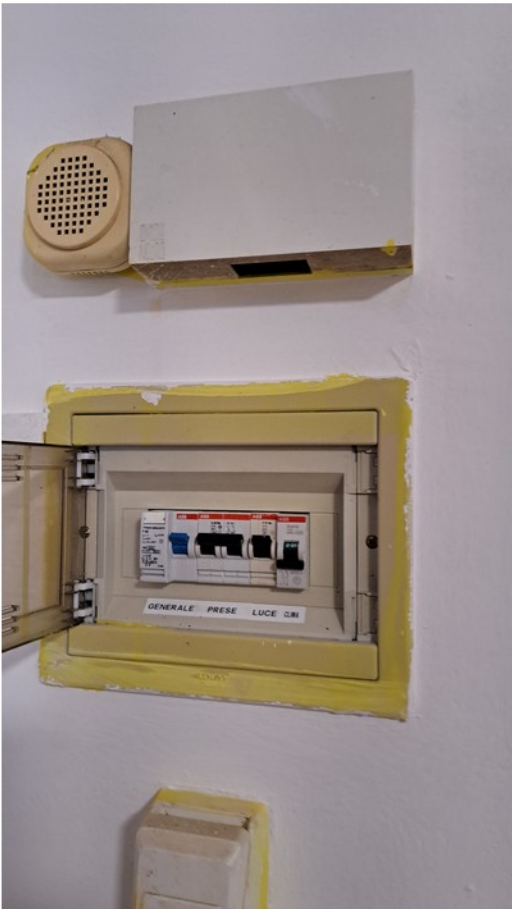
22 - quadro elettrico