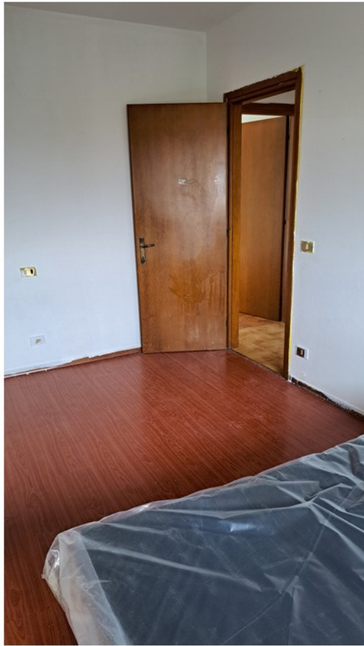
19 - camera