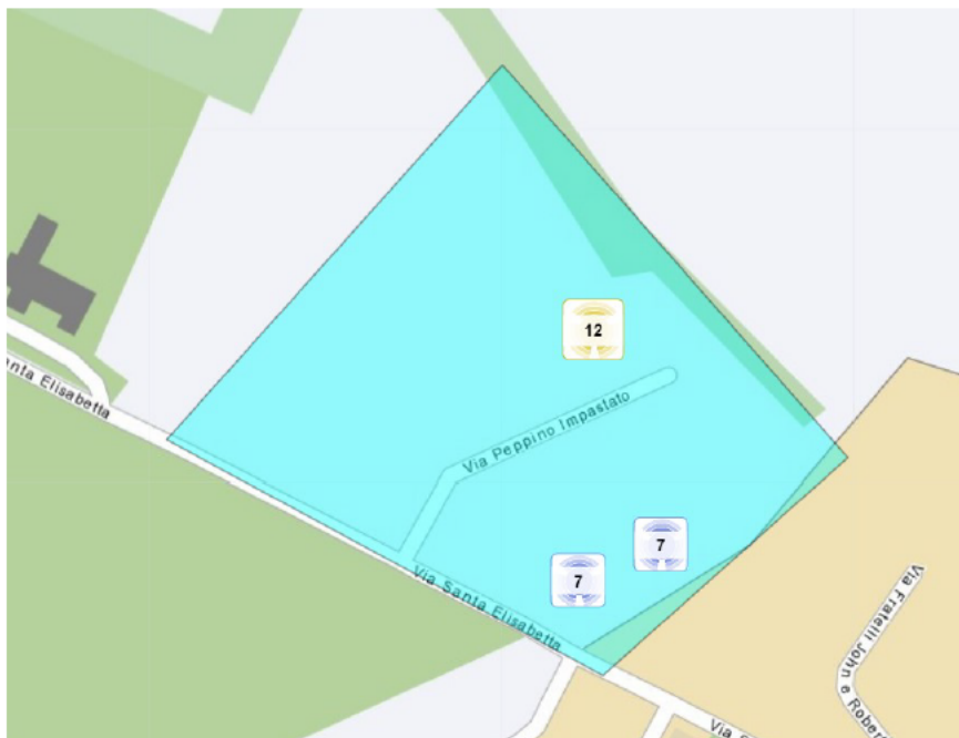
Agenzia delle Entrate. Area urbana oggetto di interrogazione

Saggio di variazione annuale del mercato immobiliare: -1,00%