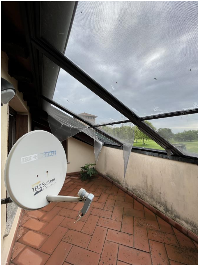
Immagine 19. Il terrazzino a filo di falda che affaccia sull'interno della corte.