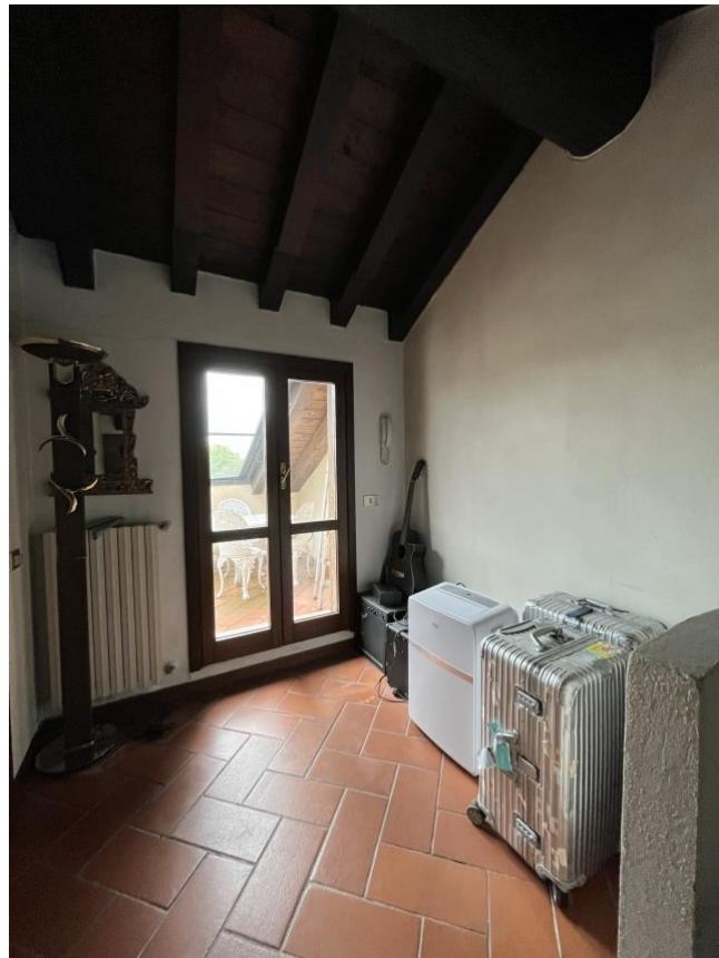
Immagini 15 e 16. Lo sbarco della scala al piano superiore mansardato. Al di fuori, sul fondo un terrazzino.