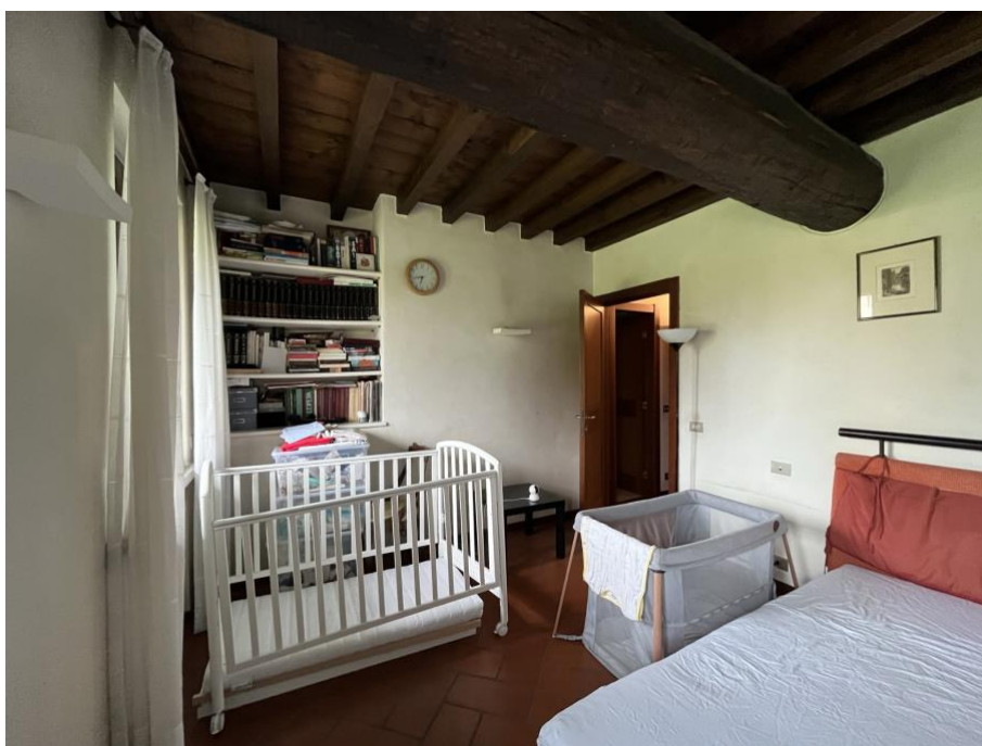
Immagini 9 e 10. La camera da letto.