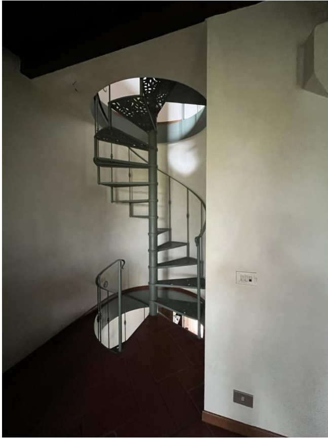
Immagine 14. La scala che dal soggiorno porta al piano superiore. Tale scala in verità corrisponde ad una analoga scala che proviene dal piano sottostante (diversa unità immobiliare non oggetto di valutazione né di pignoramento).