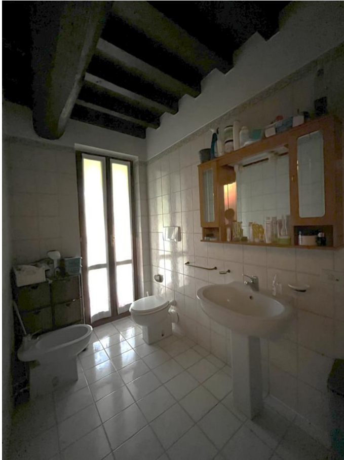
Immagine 11. Il bagno che si apre su un balconcino.