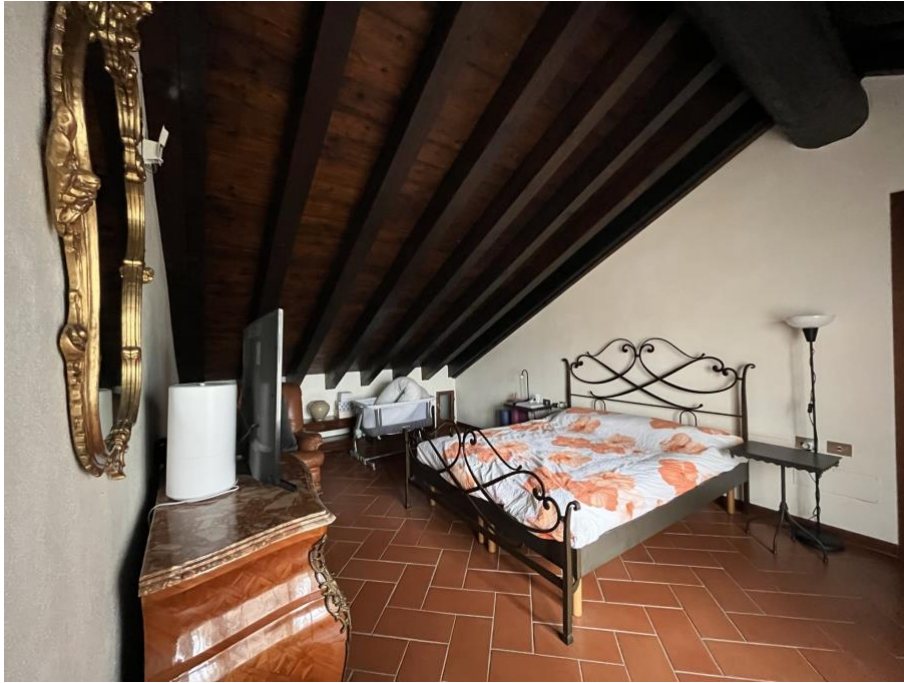
Immagine 17. Il locale principale della mansarda adibito a camera da letto; Le parti al di sotto di 1,50 m dal pavimento nono sono state chiuse con partizioni o arredi fisso come prescrive il Capitolato allegato al Regolamento di condominio (vedi Atto di provenienza ).