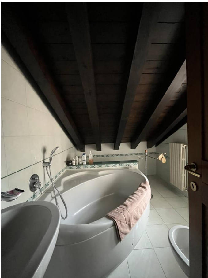
Immagine 18. Il bagno aerato al secondo piano.