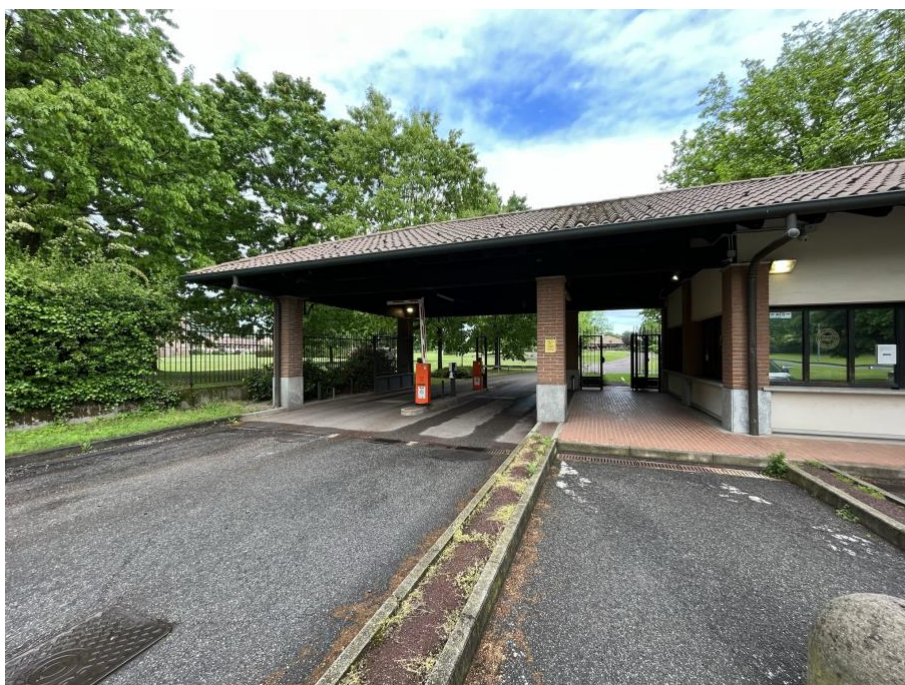
Immagine 0. L'accesso al complesso del golf all'interno del quale si trovano i corpi di fabbrica residenziali di nuova costruzione.