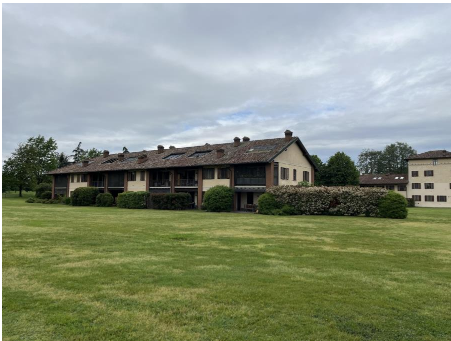
Immagini 2 e 3. Il fabbricato identificato come Corpo A all'interno del quale si trova l'unità oggetto di valutazione.