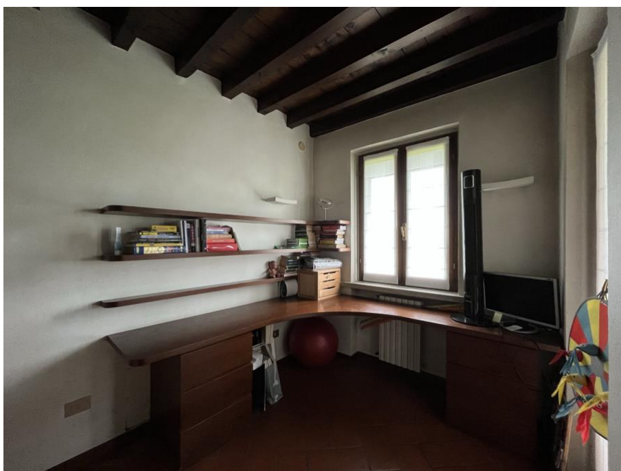
Immagine 7. A fianco del soggiorno un secondo locale che potrebbe essere una cucina.