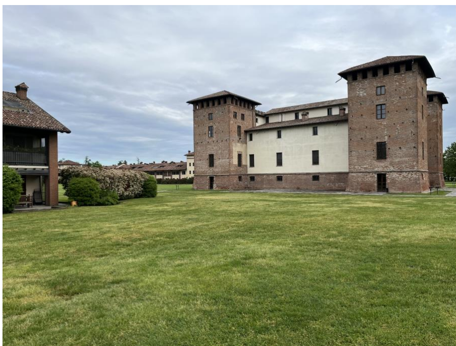
Immagine 1. Il cinquecentesco Castello di Tolcinasco oggetto di un recupero contestuale alla lottizzazione che ha permesso la costruzione dei fabbricati residenziali all'interno del complesso del golf.