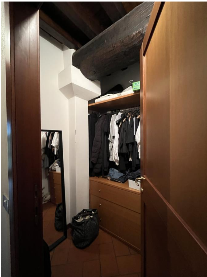
Immagine 8. La cabina armadio / ripostiglio.