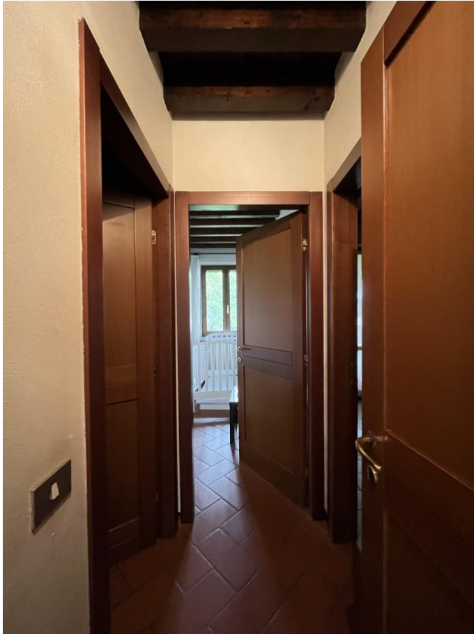
Immagine 8. Disimpegno verso la camera da letto.