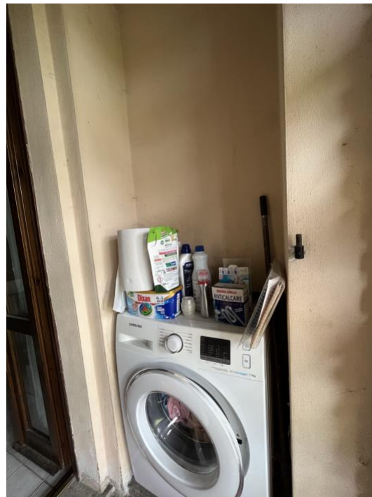
Immagini 12 e 13. Il terrazzino in cui sono previsti gli attacchi per la lavatrice. Si notano le schermature in mattoni tipiche della tradizione lombarda rurale dei fienili.