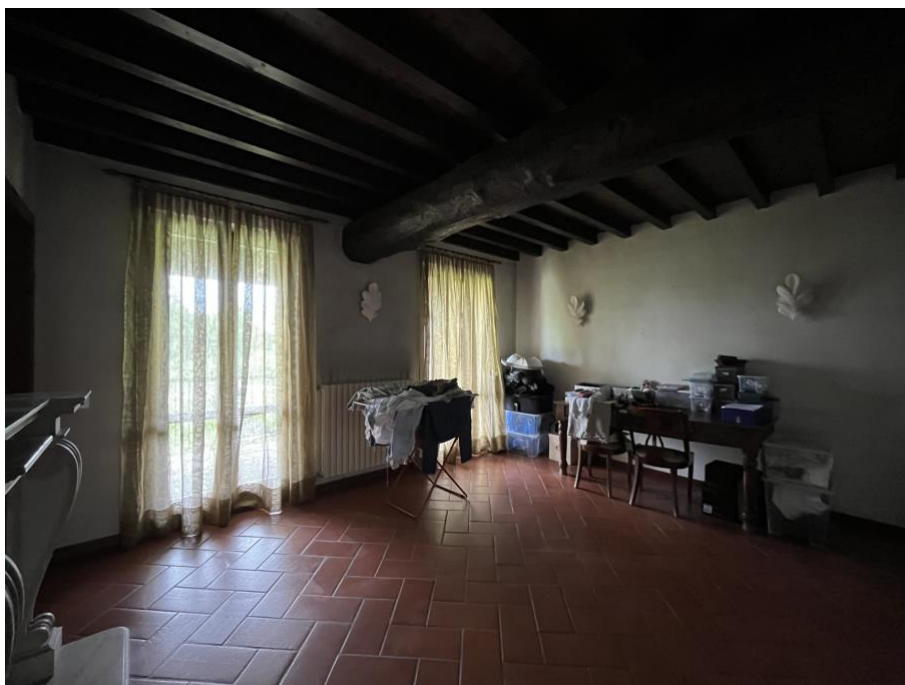
Immagine 6. Il soggiorno cui si accede da un piccolo ingresso dopo il pianerottolo.