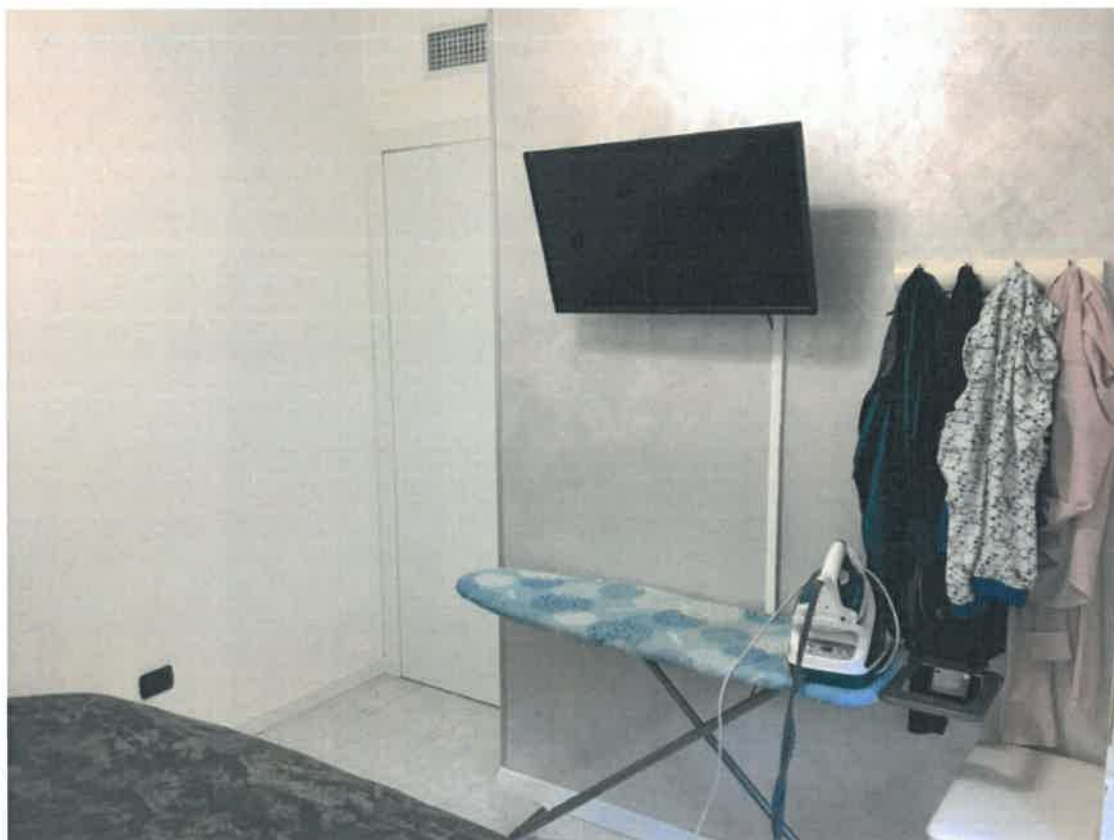
Foto 18 - Camera