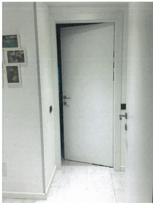
Foto 16 - Disimpegno