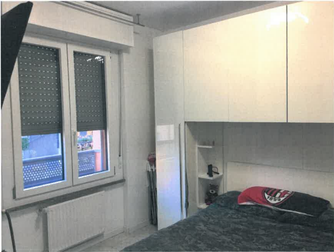
Foto 17 - Camera