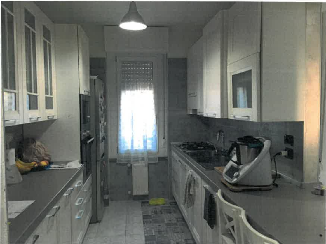
Foto 12 - Cucina a vista