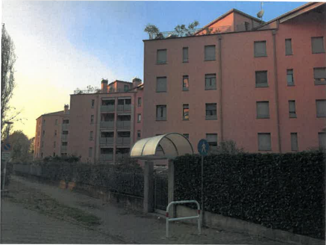
Foto 03 - Il fabbricato sul retro