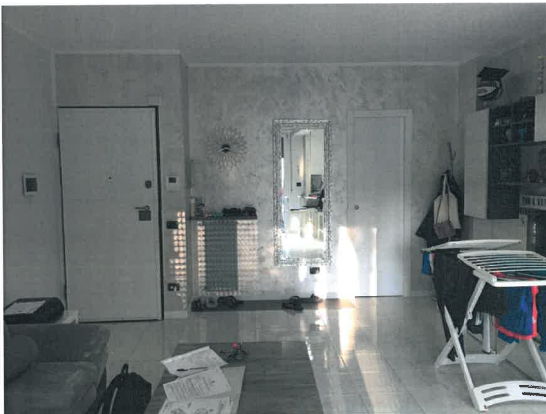
Foto 09 - Soggiorno