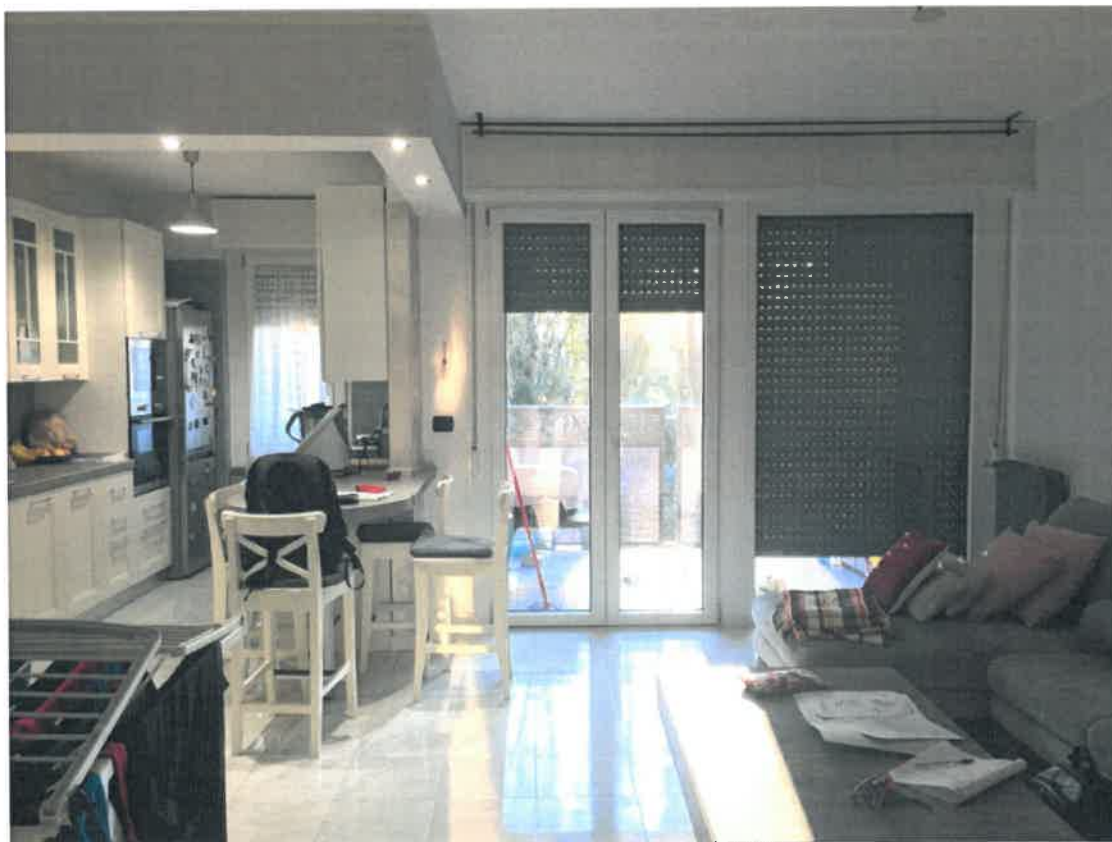
Foto 10 - Soggiorno