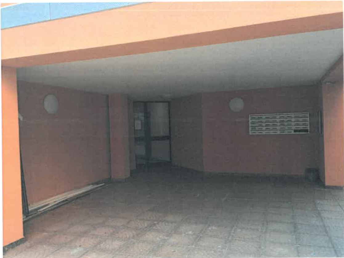
Foto 06 - Accesso alla scala A del fabbricato