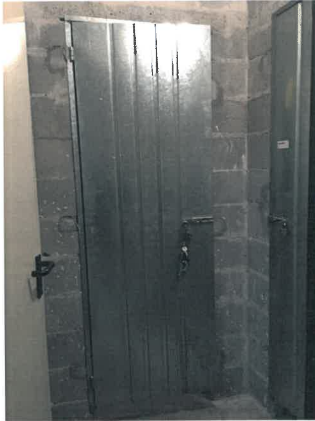
Foto 25 - Cantina