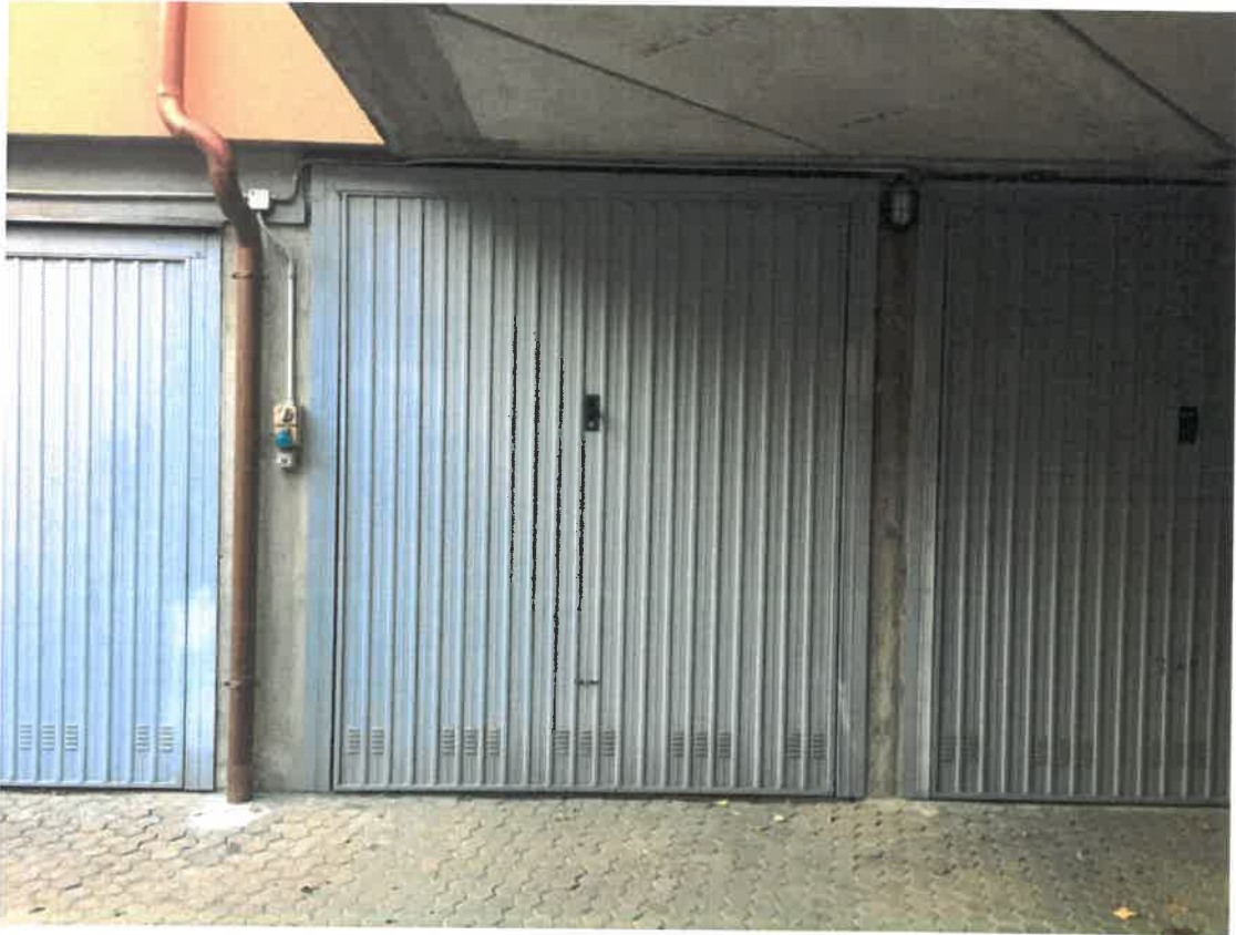
Foto 27 - Box