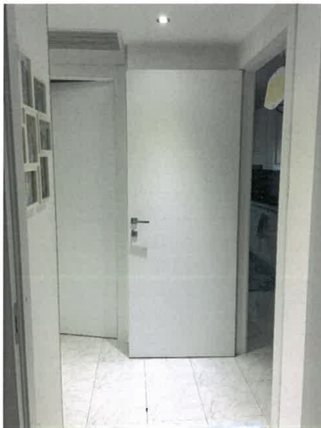
Foto 15 - Disimpegno