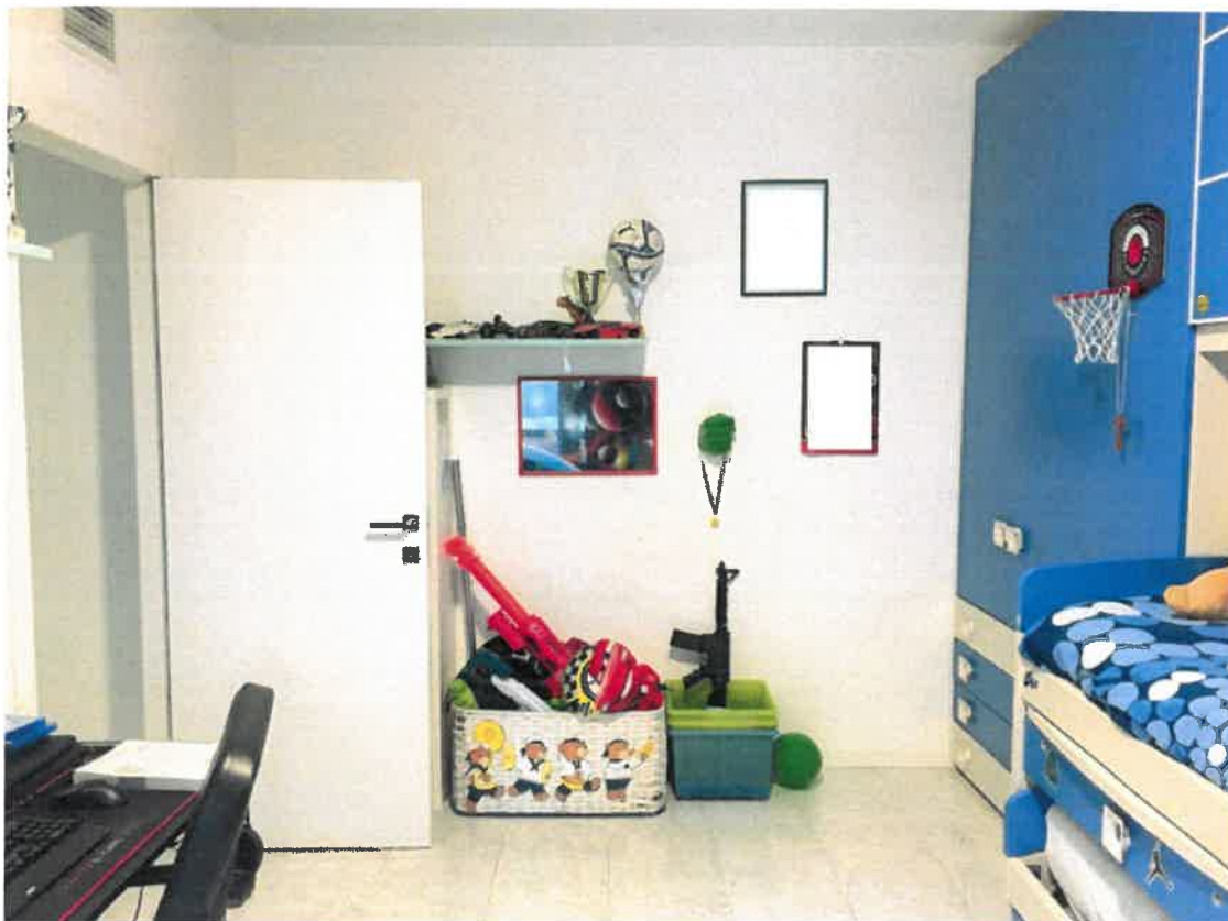
Foto 20 - Camera