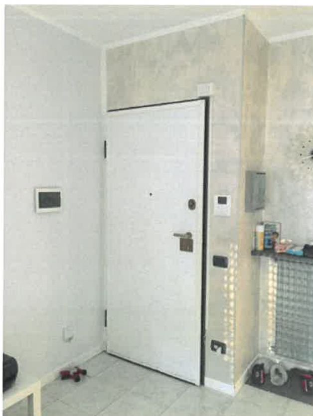
Foto 08 - Ingresso