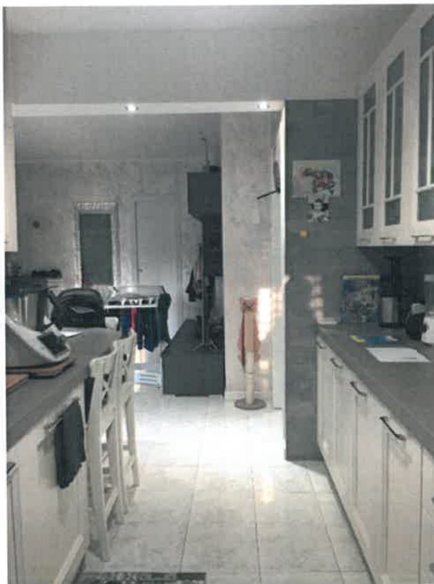
Foto 13 - Cucina a vista