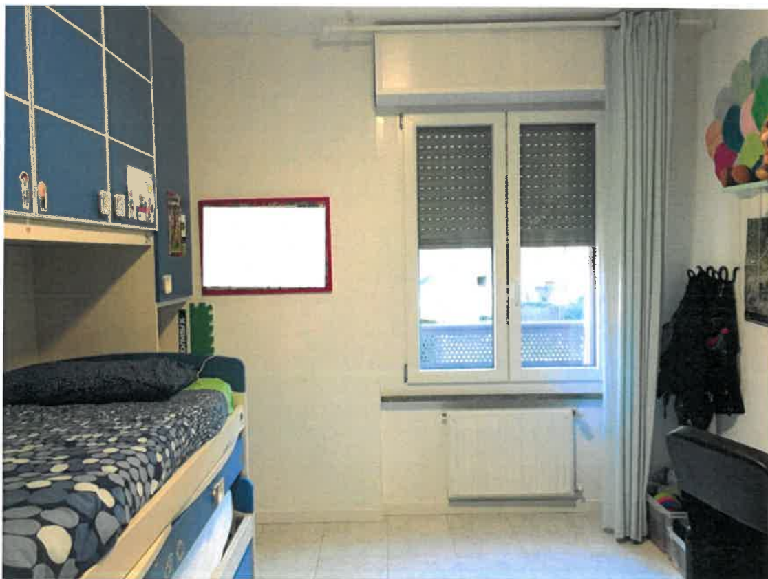
Foto 19 - Camera