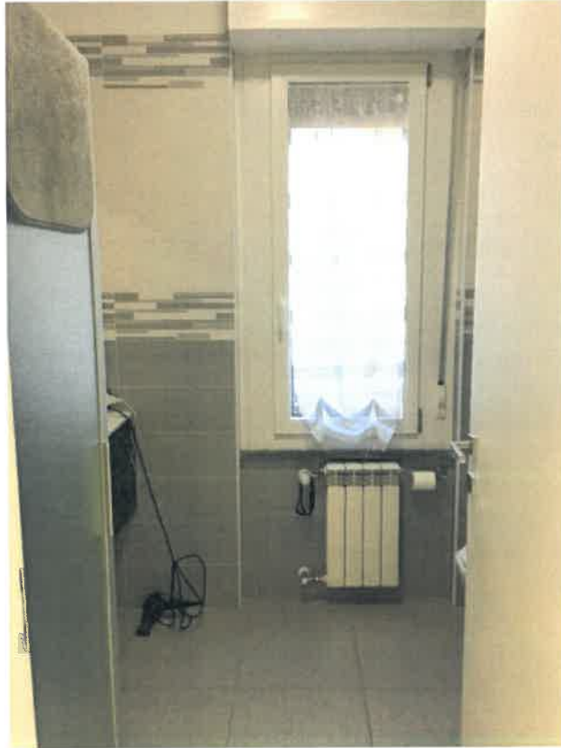
Foto 21 - Bagno