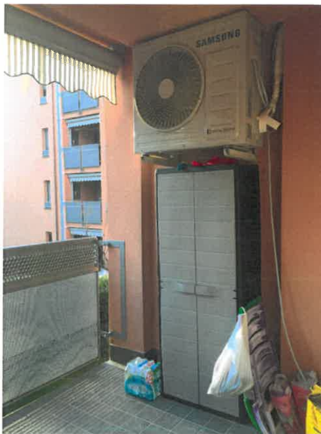
Foto 23 - Balcone