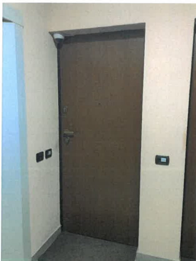
Foto 07 - Ingresso all'unità dal pianerottolo