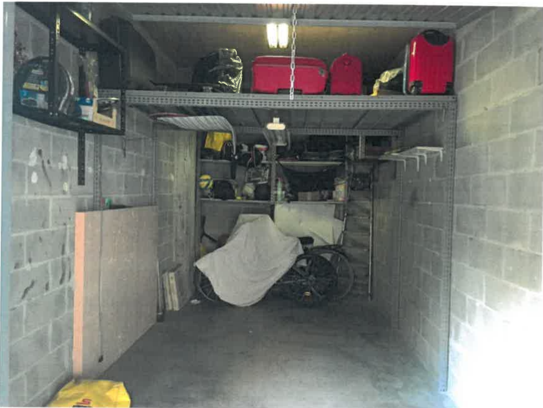
Foto 28 - Box