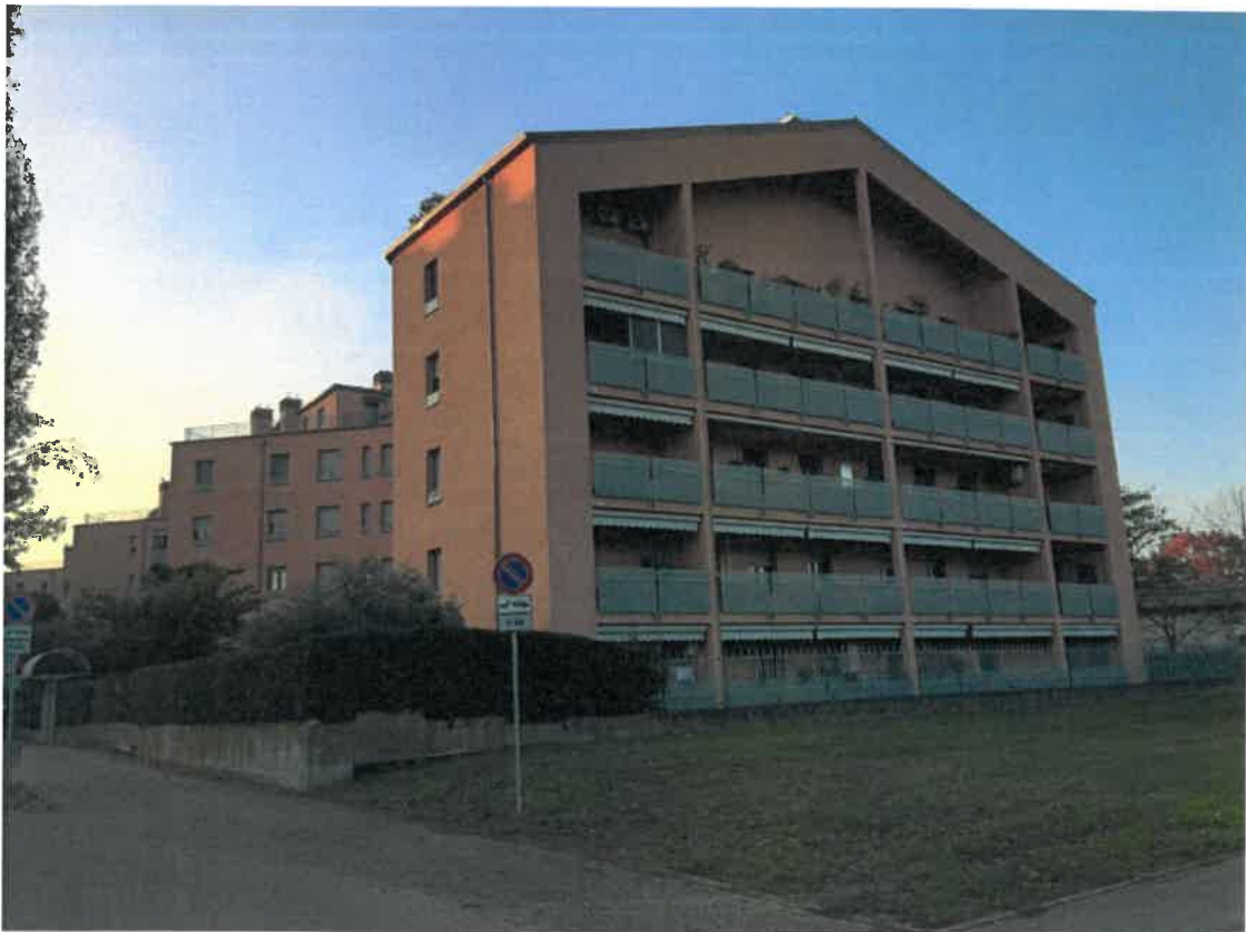
Foto 04 - Il complesso immobiliare da via Attimo