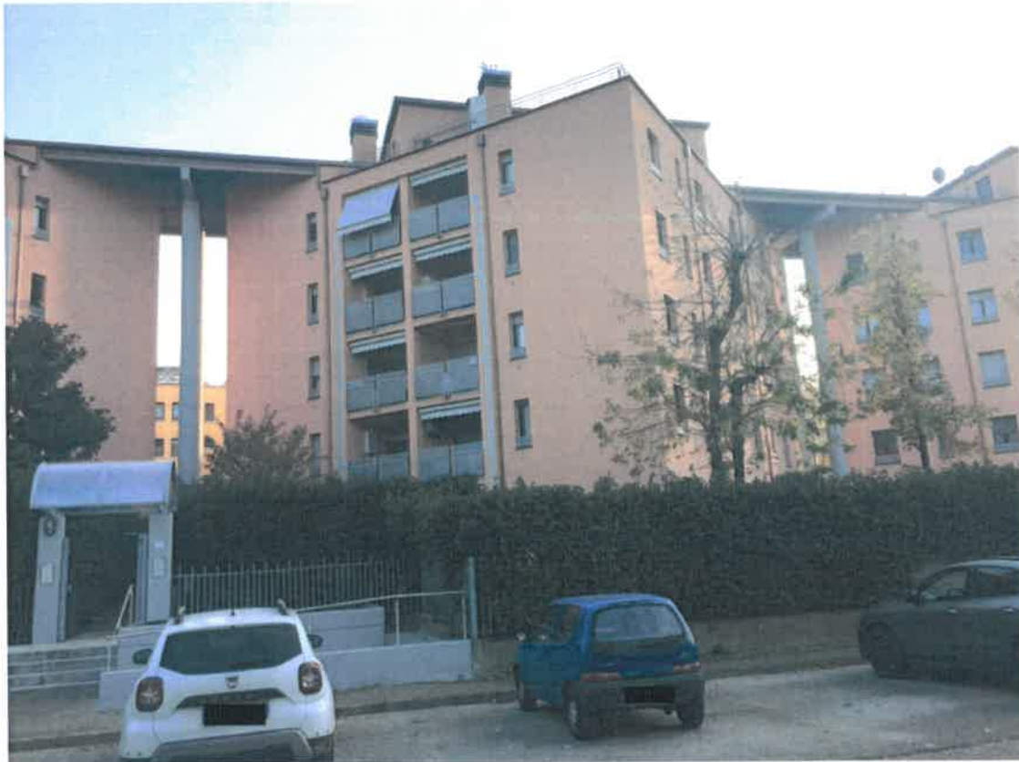
Foto 02 - Il fabbricato su via Gianni Riccardi