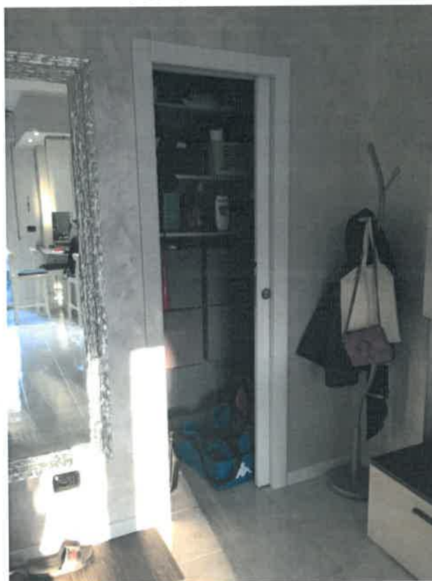
Foto 14 - Ripostiglio