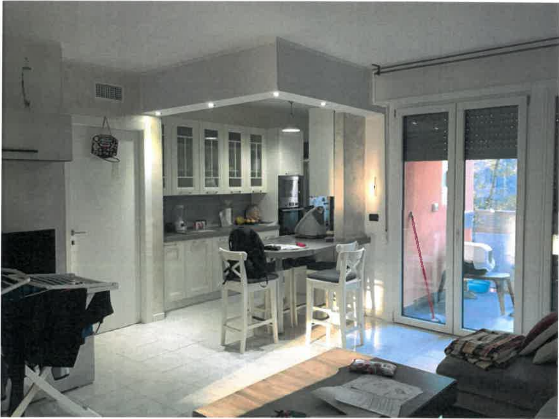
Foto 11 - Soggiorno