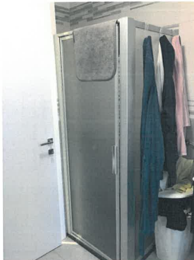
Foto 22 - Bagno