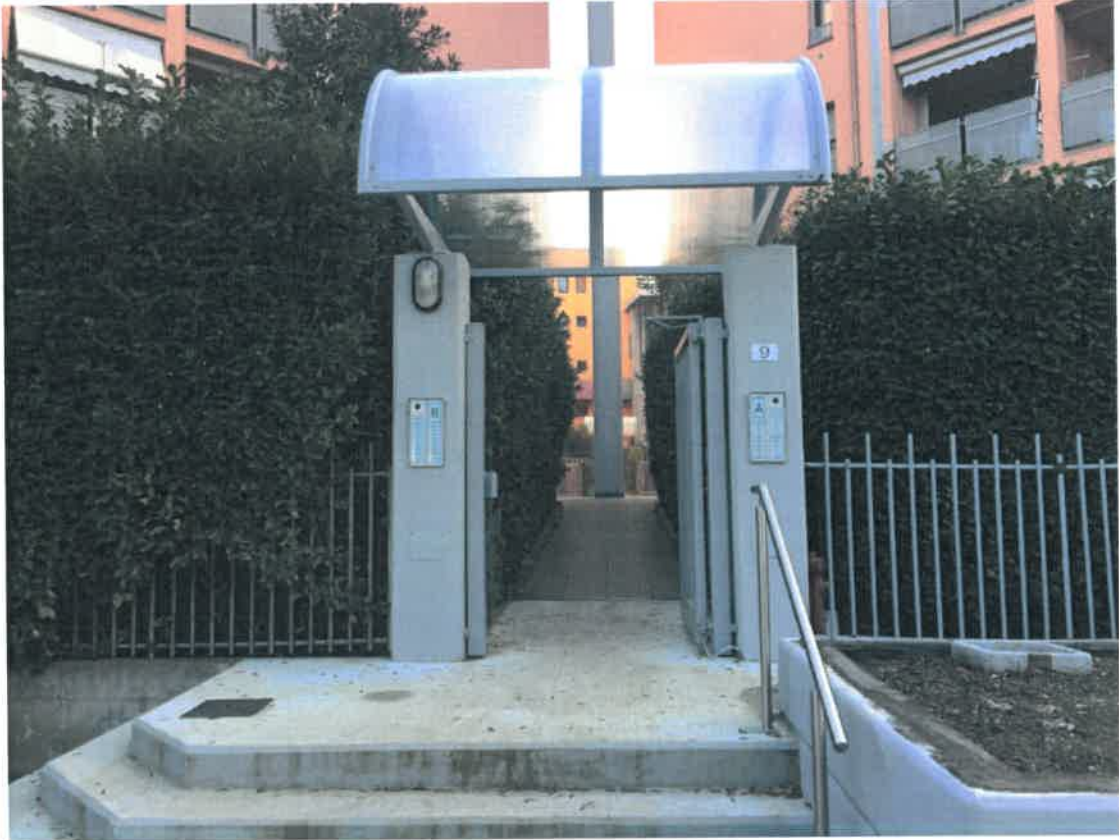
Foto 05 - Accesso al fabbricato dal civico 9 di via Gianni Riccardi