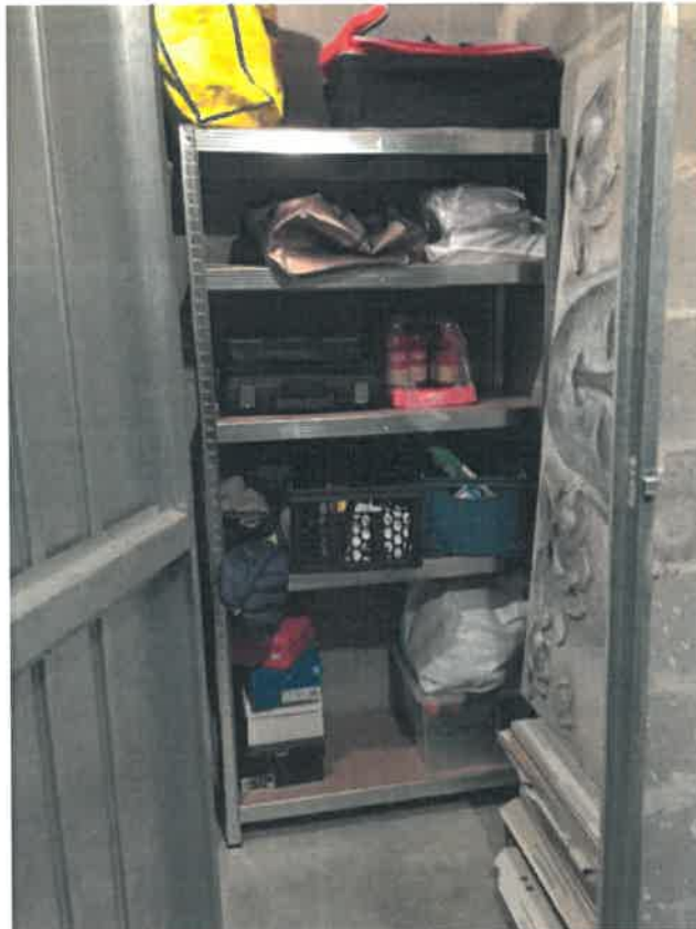
Foto 26 - Cantina