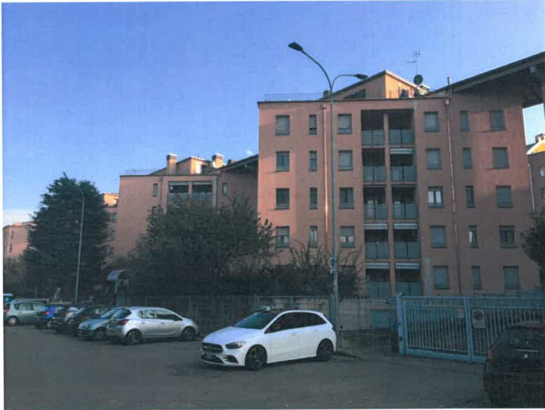
Foto 01 - Il fabbricato su via Gianni Riccardi