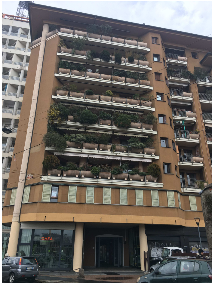
Stabile di via Valenza 5