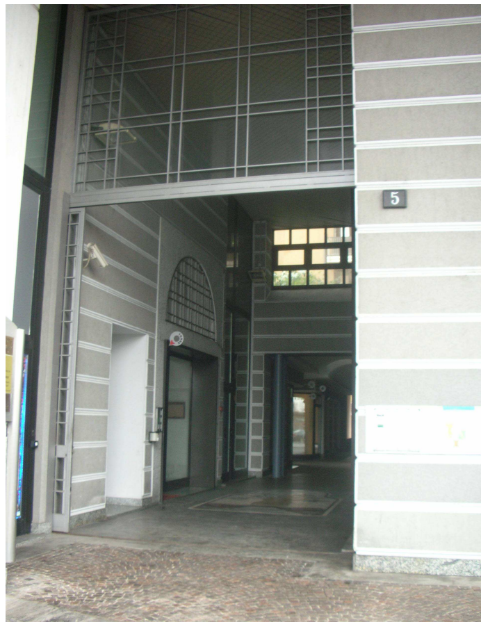
Entrata al complesso di via Valenza 5