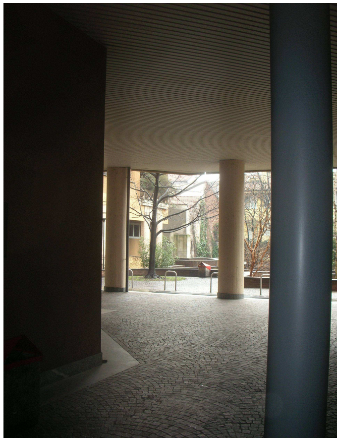
Passaggi pedonali pubblici che conducono alle tre scale che compongono il complesso di via Valenza 5

Perito Estimatore: arch. D. Borgoglio Motta