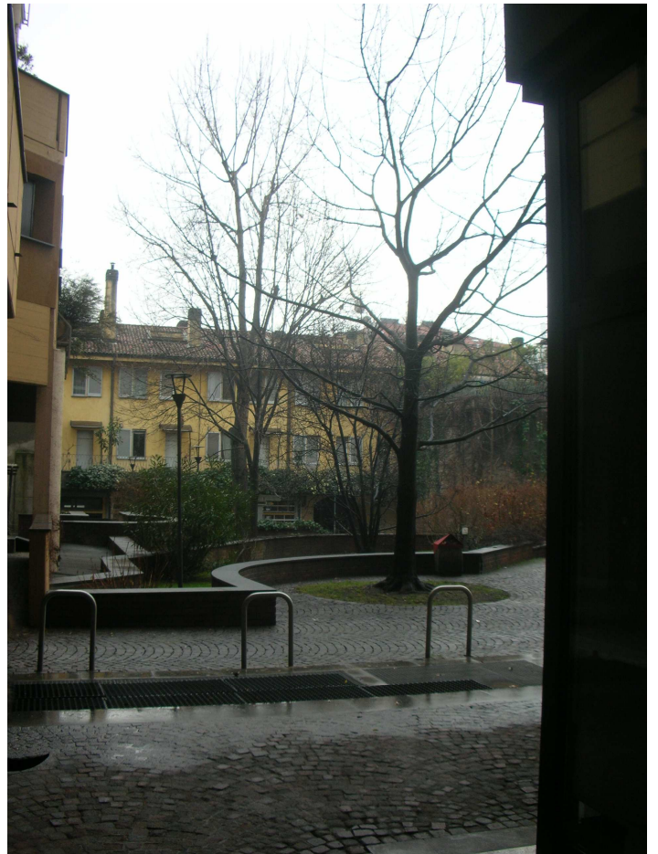
Spazi condominiali interni