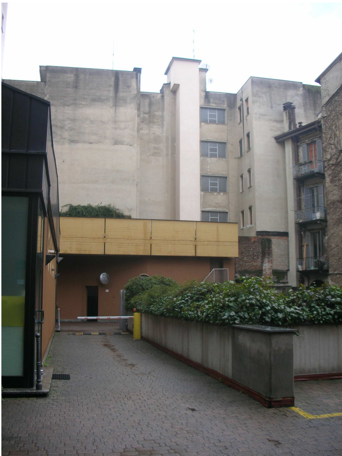
Accesso ai box