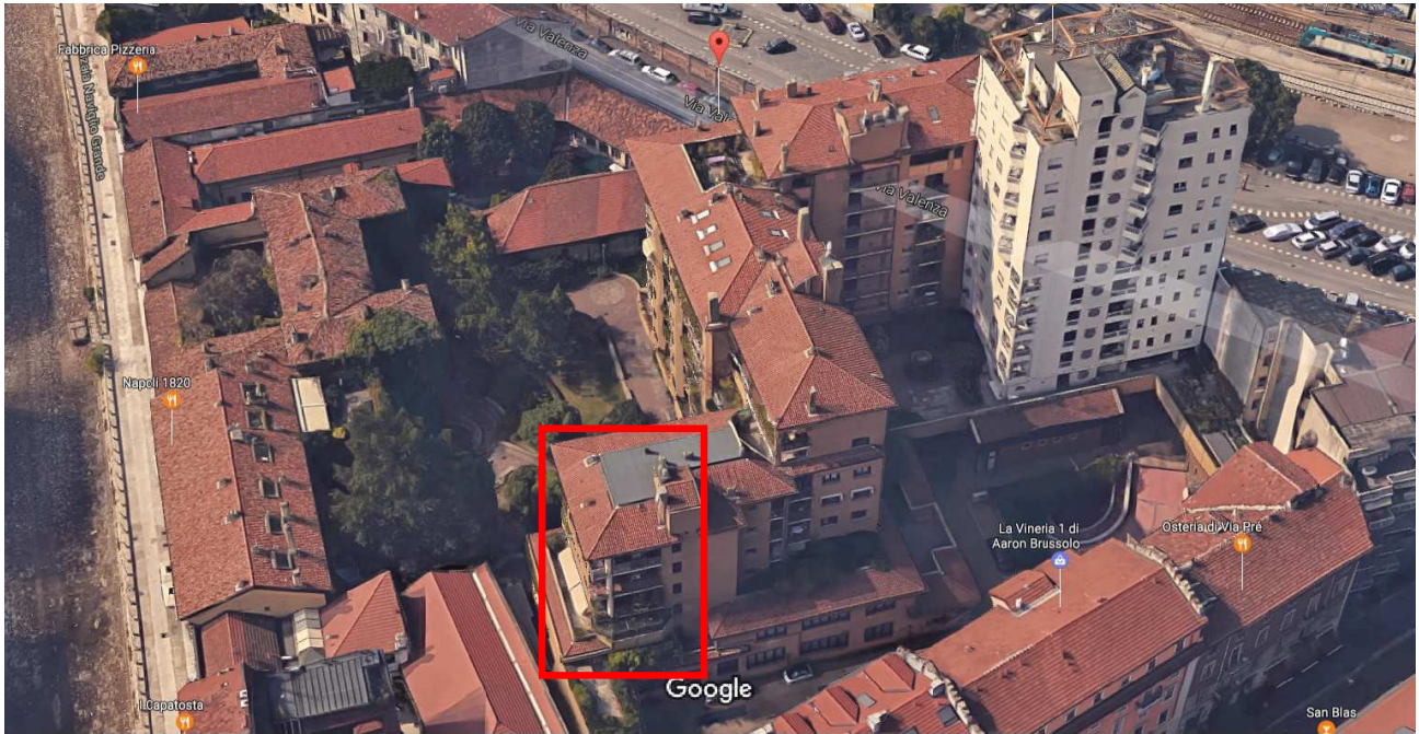
Complesso di via Valenza 5