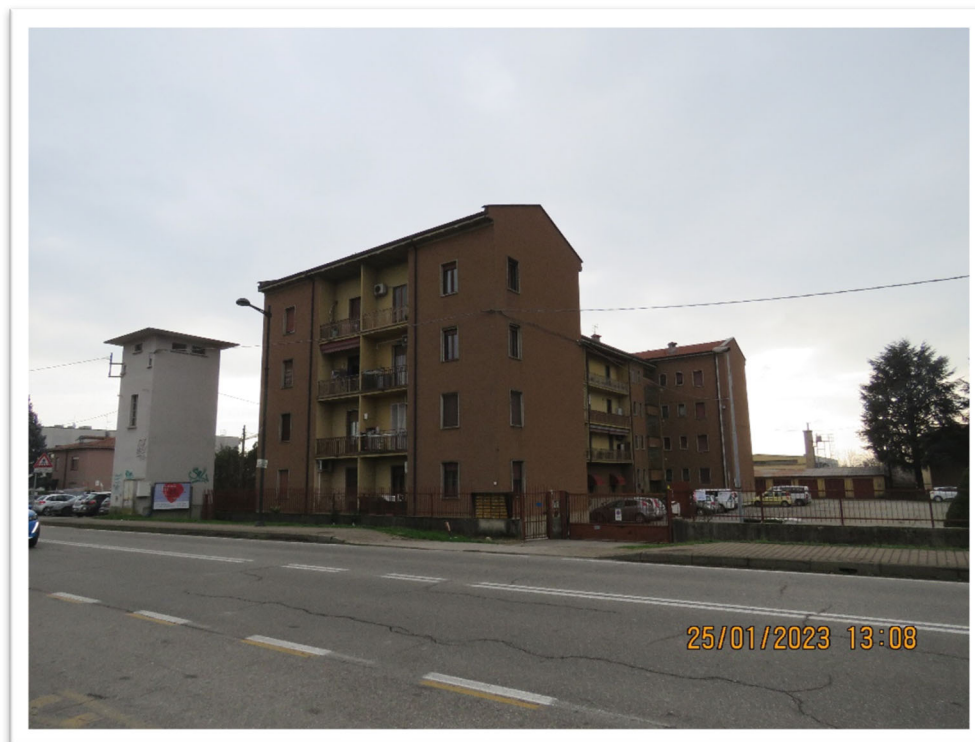
Vista della palazzina condominiale da via Brasca e particolare dell'ingresso.