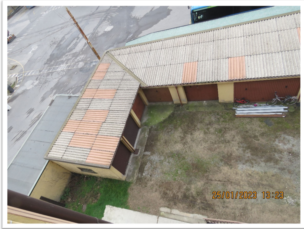
Vista delle coperture in fibrocemento dei boxes presenti in cortile e particolare della caldaia a gas presente in cucina.