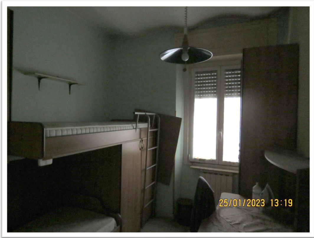
Camera n. 1.