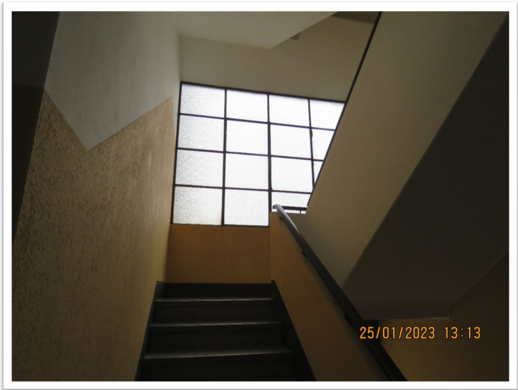
Vano scale e pianerottolo del 3° piano.