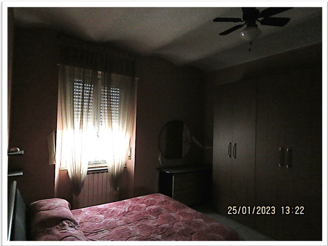
La seconda camera.