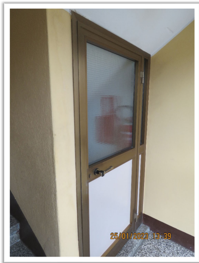
L'ingresso alle cantine e cortile.