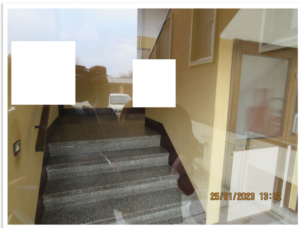
Ingresso al vano scale.