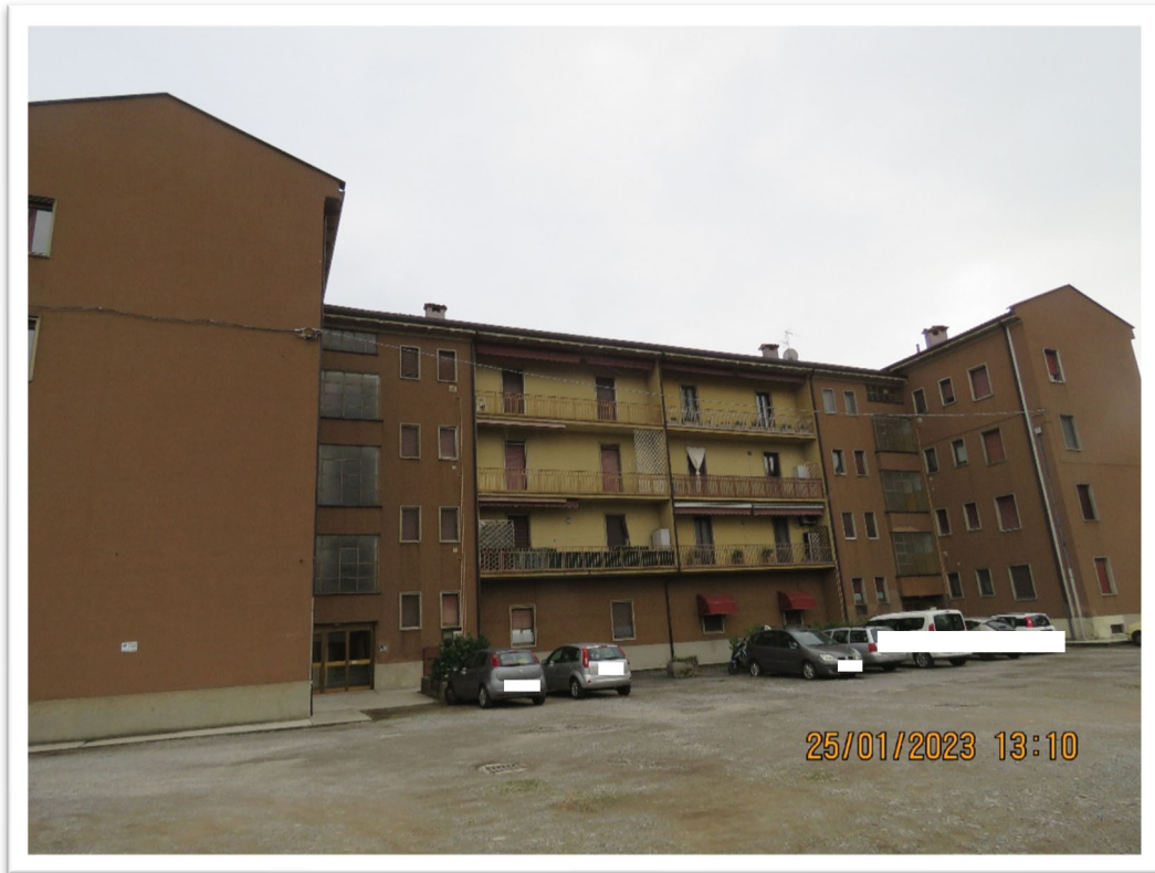
Il cortile e l'ingresso al vano scale.