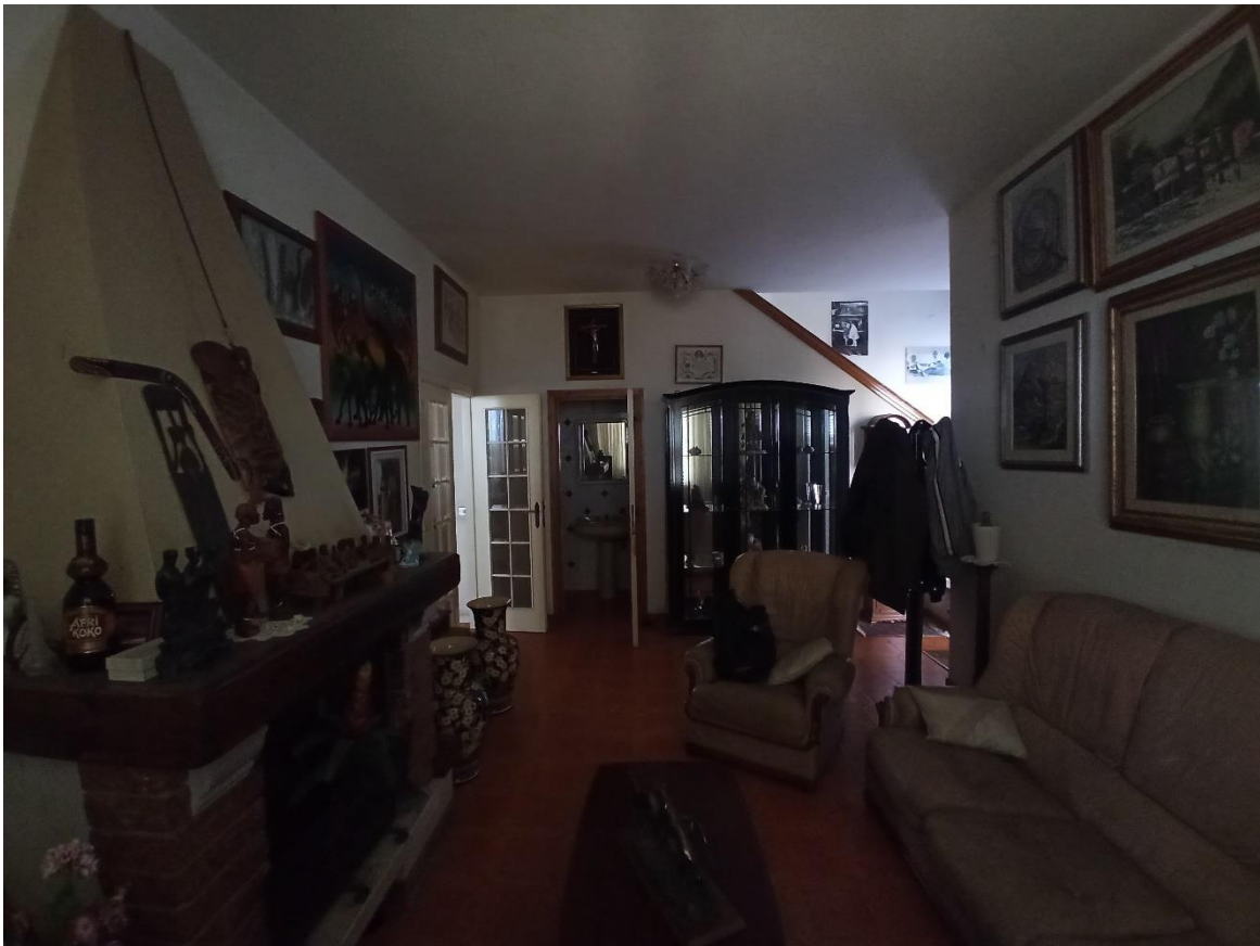
foto 6 – Bene n° 1 – appartamento – piano terra (ingresso/salotto)