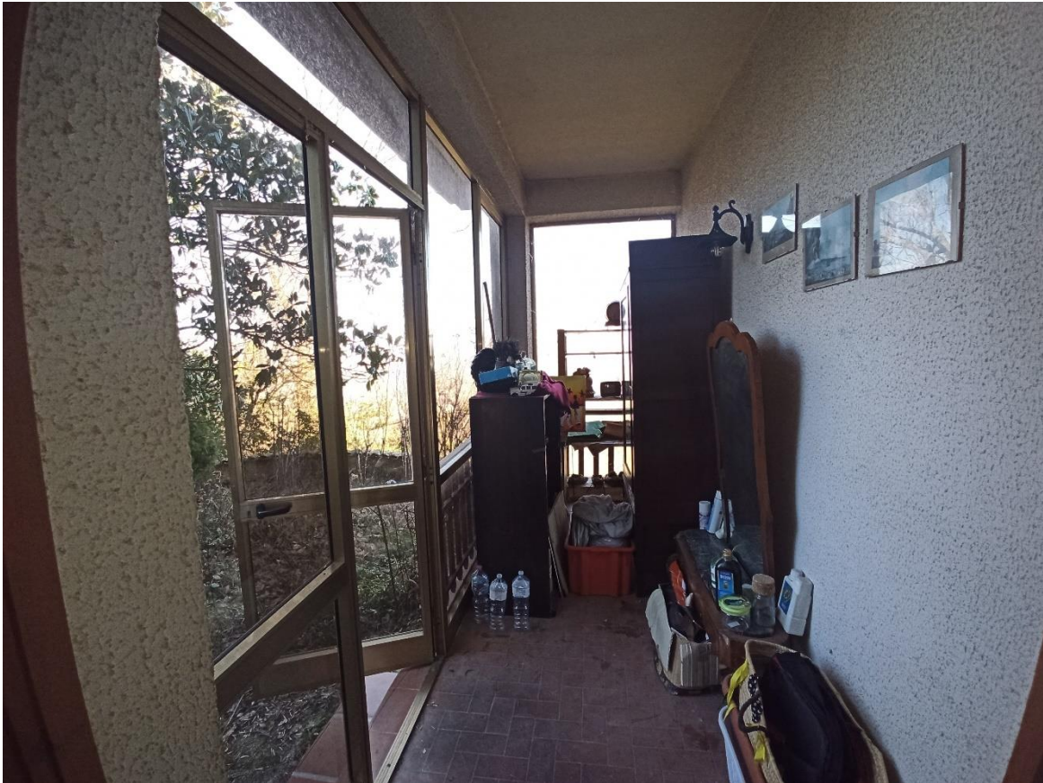
foto 5 – Bene n° 1 – appartamento – piano terra (veranda d'ingresso)