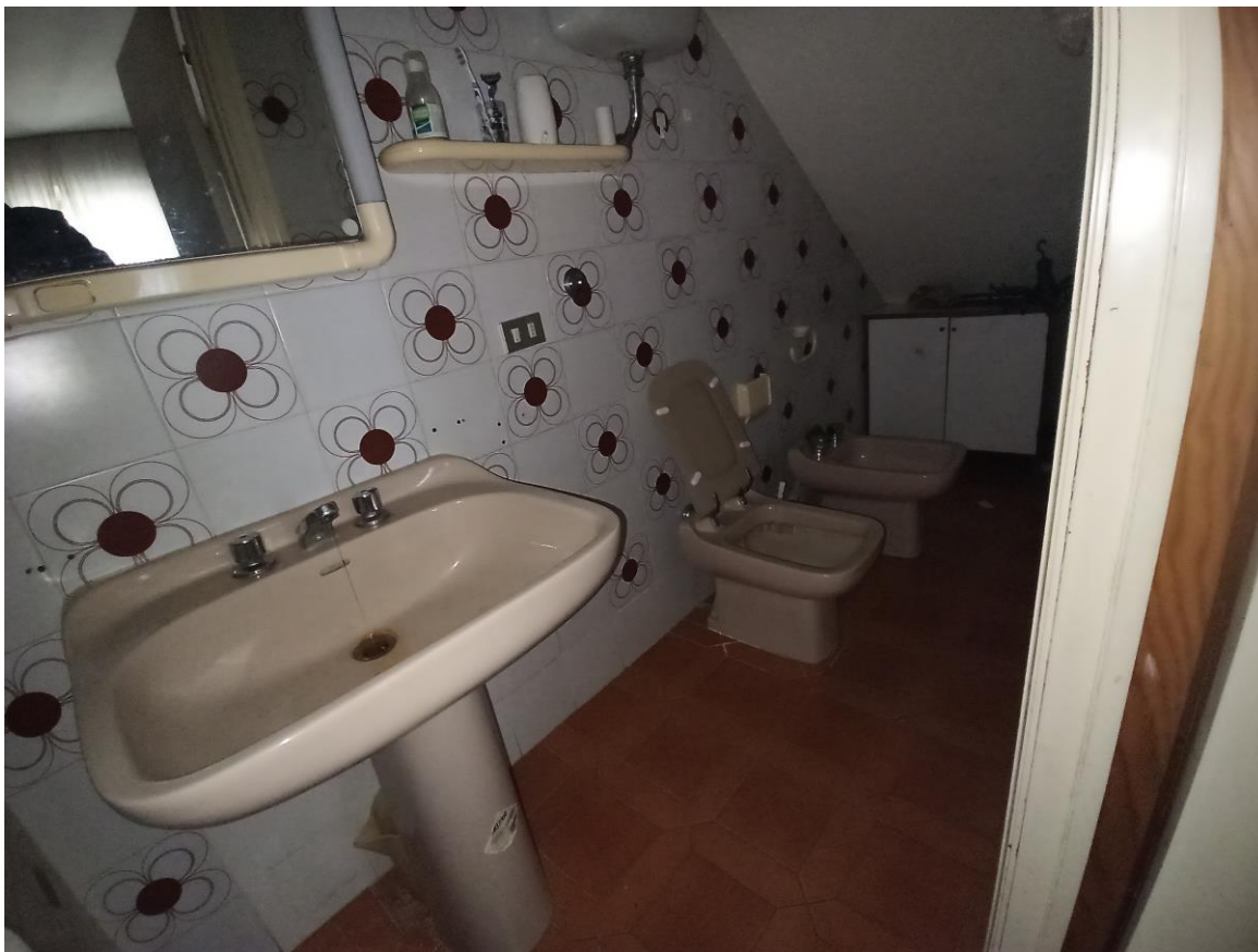
foto 7 – Bene n° 1 – appartamento – piano terra (bagno nel sottoscala)