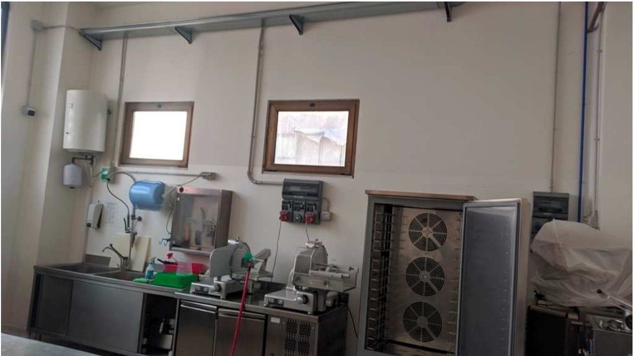
Locali zona magazzino