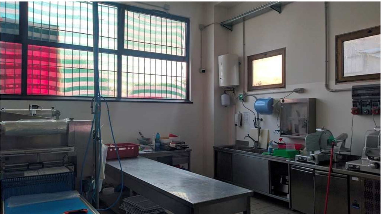
Locali zona magazzino