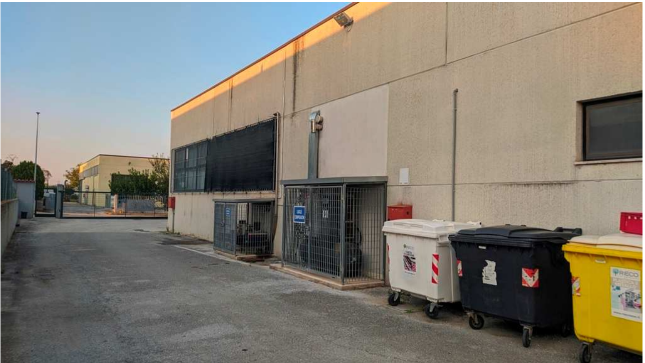
Parete laterale dell'edificio destinato a laboratorio e magazzino