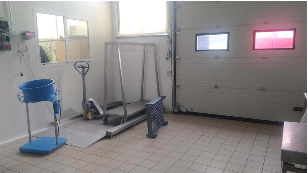
Porta di carico in zona magazzino (spedizioni)