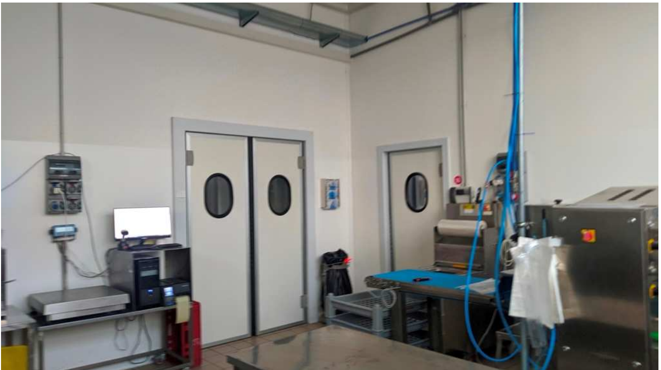
Locali zona magazzino