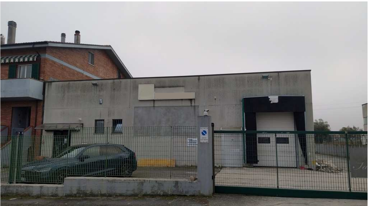
Ingresso carrabile ed accesso alla parte destinata a laboratorio e magazzino