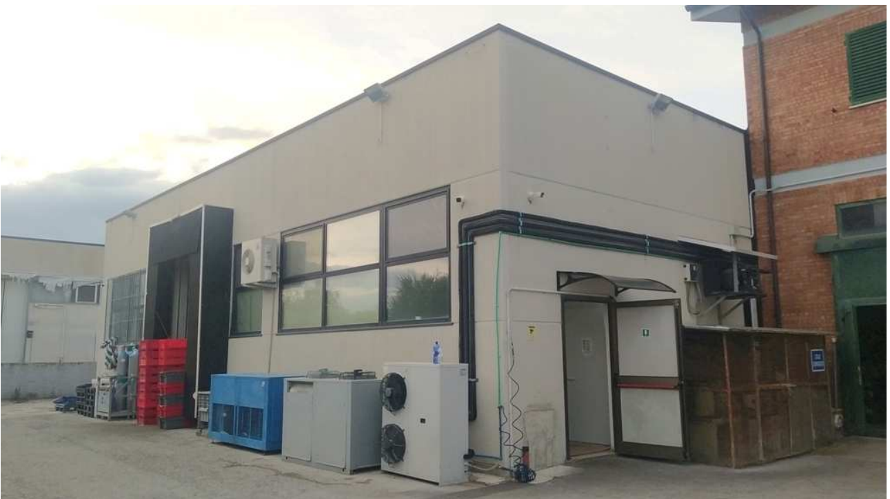
Parete posteriore dell'edificio destinato a laboratorio e magazzino