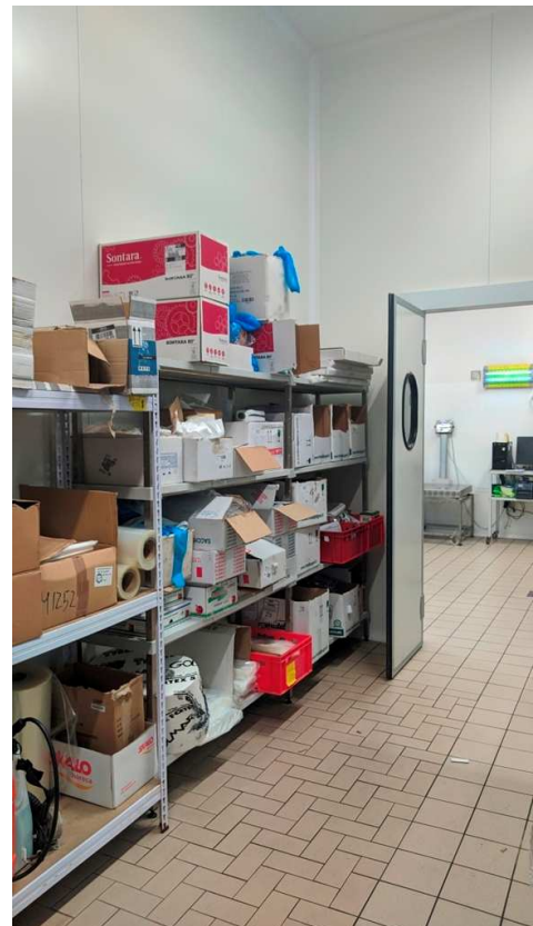
Locali magazzino e deposito merci per imballaggio