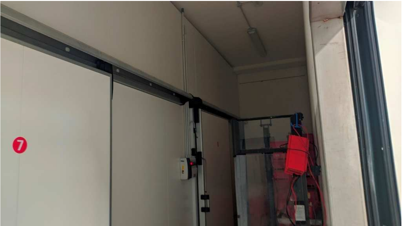
Celle frigorifere in zona magazzino