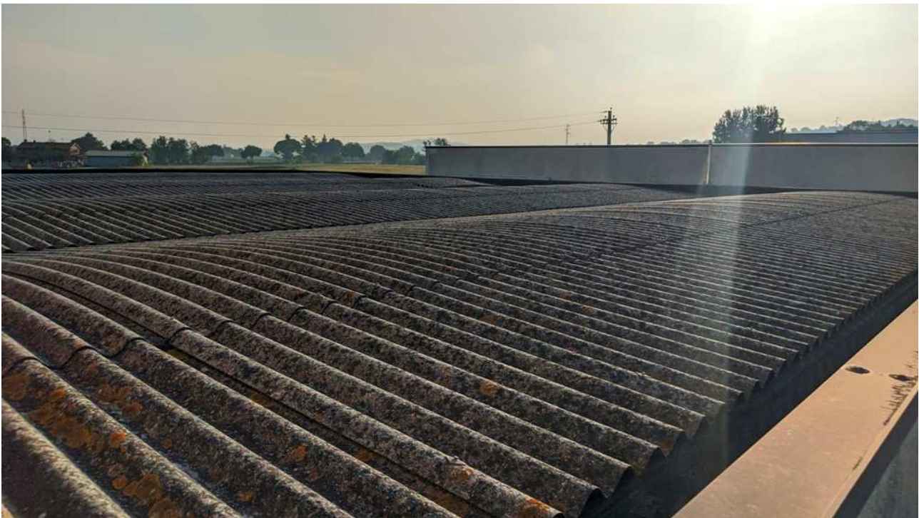
Copertura del capannone, destinato a laboratorio e magazzino, immagine scattata dall'adiacente abitazione