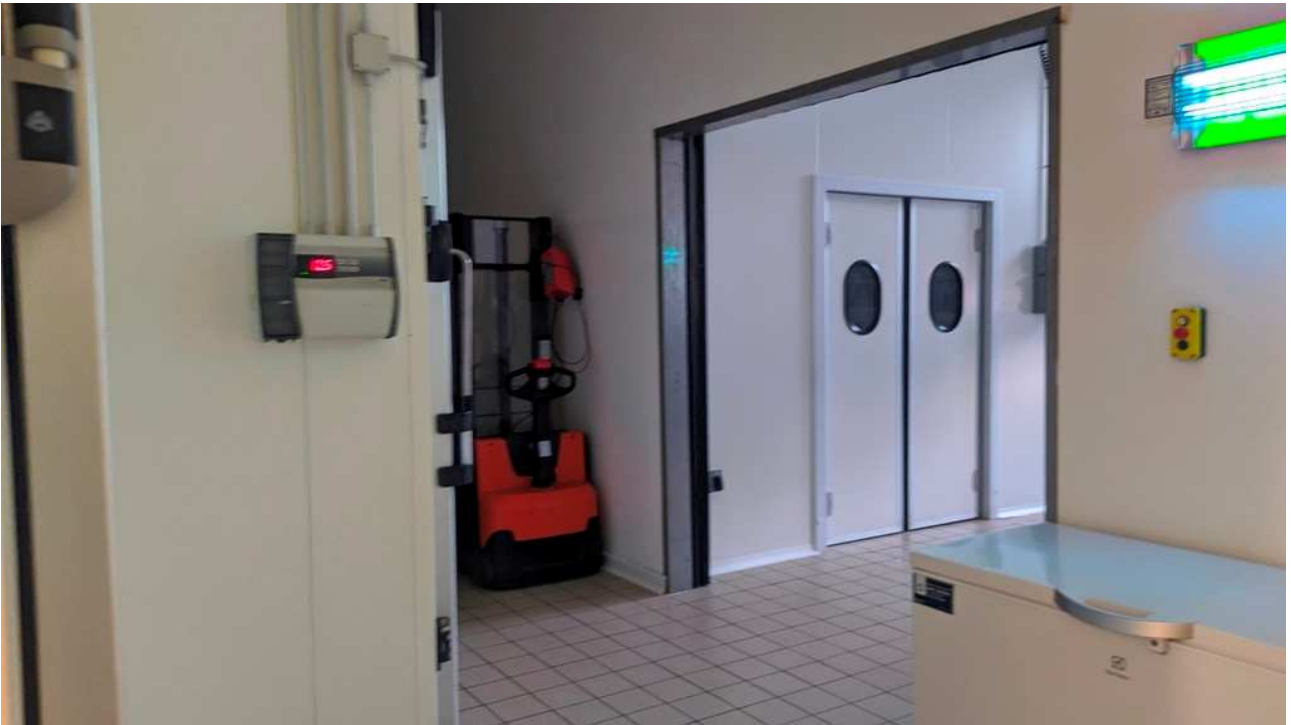
Locali zona magazzino