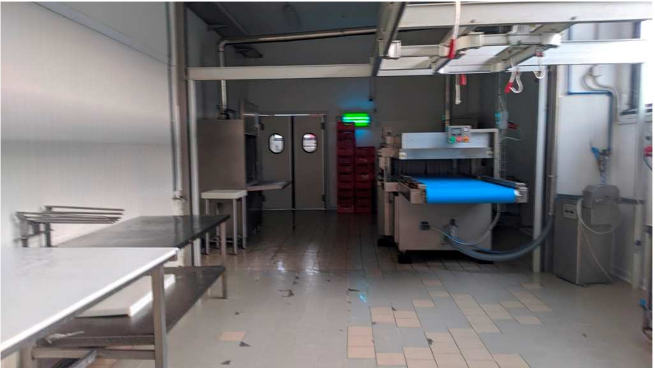
Ambiente di passaggio tra magazzino e laboratorio (nello stesso capannone)