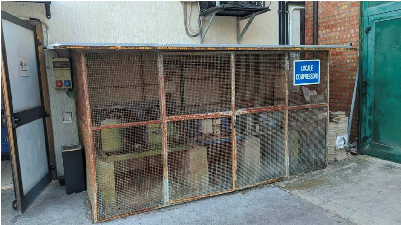
Dettaglio compressori esterni all'edificio, a servizio dell'attività