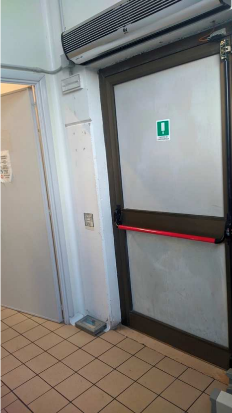
Ingresso pedonale in zona magazzino (spedizioni)