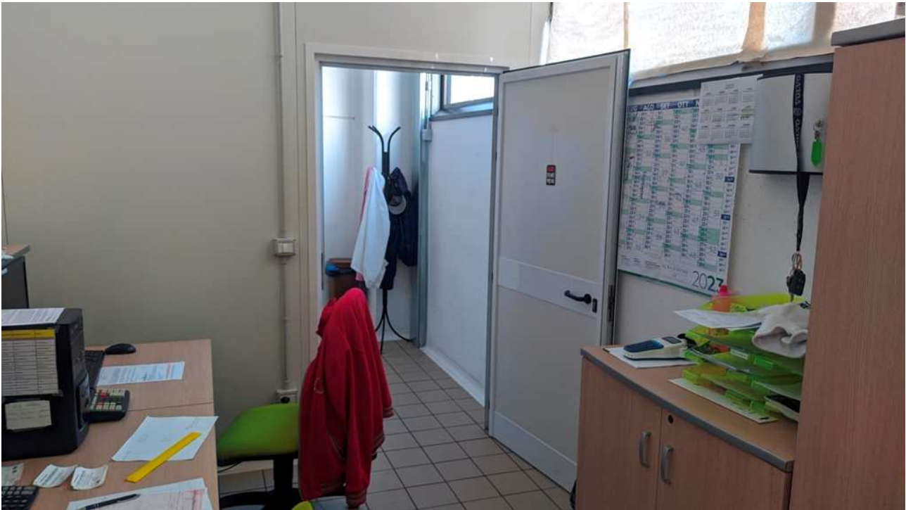
Locale destinato ad ufficio spedizioni