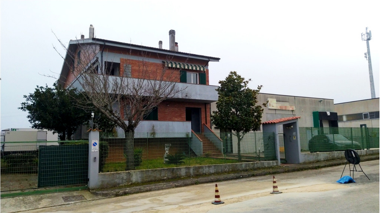
COMPLESSO ARTIGIANALE CON UFFICI ED ABITAZIONE – vista generale dalla strada di accesso