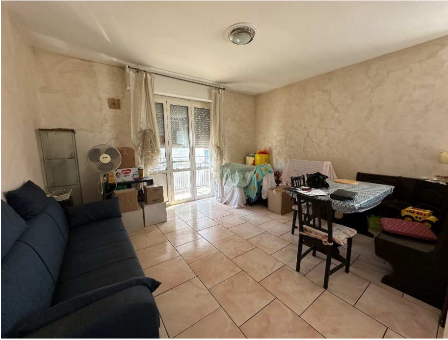
13. Vista del soggiorno.