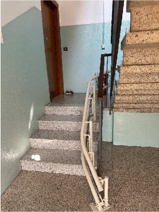
9. Vista della scala condominiale.