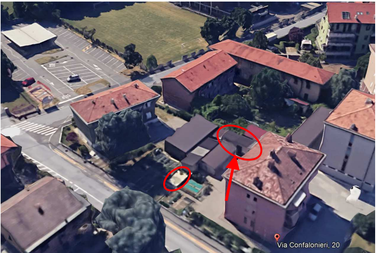
4. Vista aerea con individuazione dell'orticello e del rustichetto.