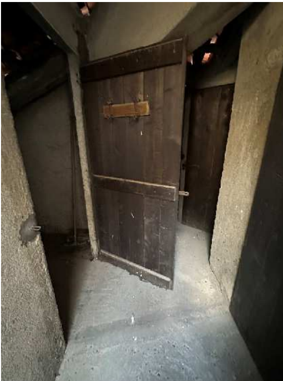
20. Vista del solaio.