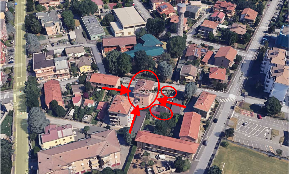
3. Vista aerea del contesto con individuazione dell'edificio, degli affacci dell'alloggio, del rustichetto e dell'orticello.