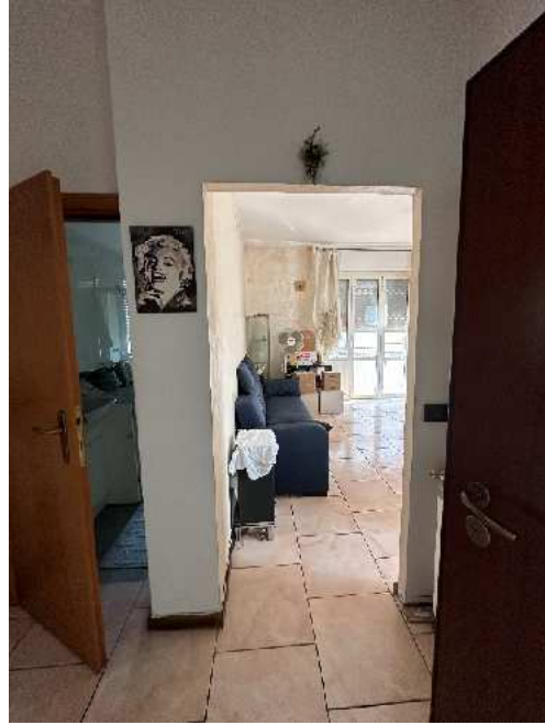
11. Viste dell'ingresso e del varco dove è stato eliminato il serramento.