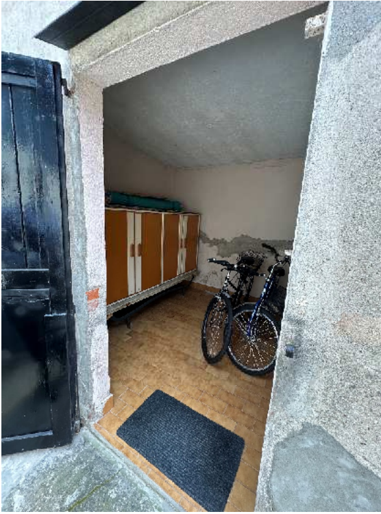
5. Vista dell'interno del rustichetto.