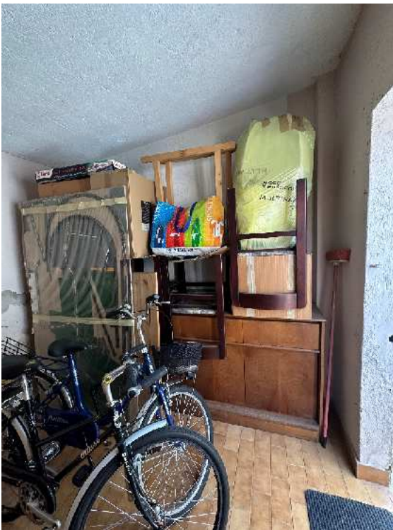
6. Vista dell'interno del rustichetto.