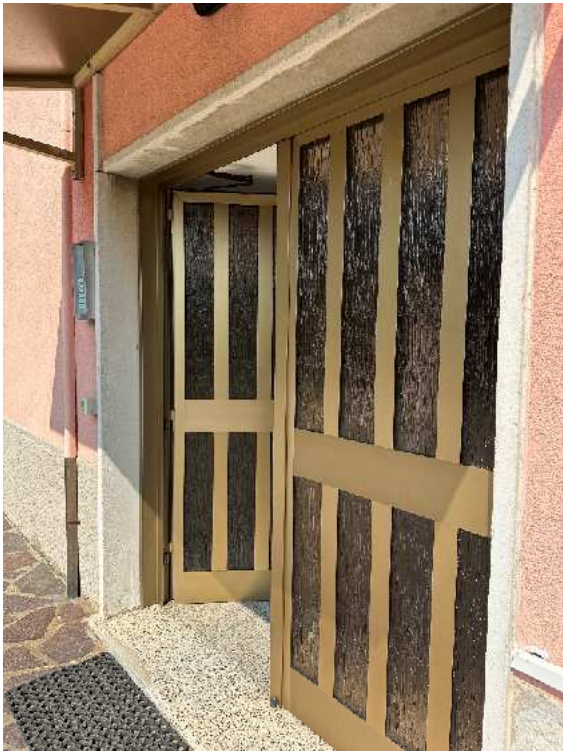
8. Vista del portone di accesso alla scala di pertinenza.