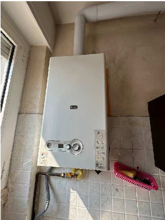
18. Dettaglio della caldaia.