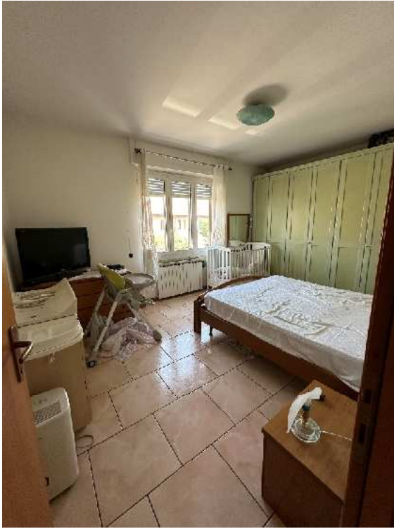
17. Vista della camera.