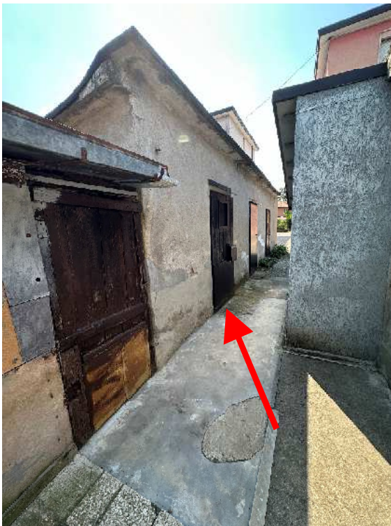
4. Vista del rustichetto ed indicazione della porta di accesso della pertinenza.