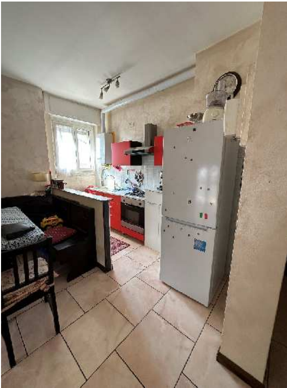
12. Vista dell'angolo cottura.