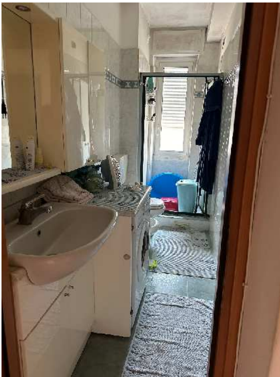
16. Vista del bagno.