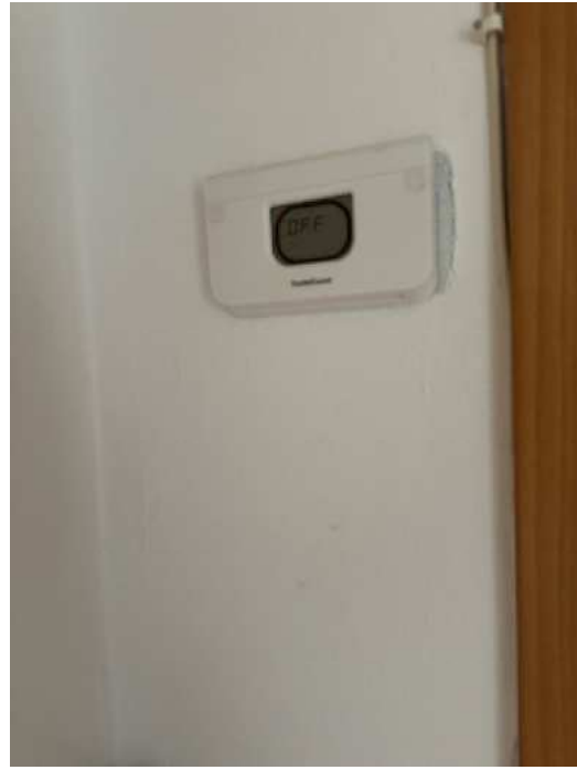
19. Dettaglio degli impianti.