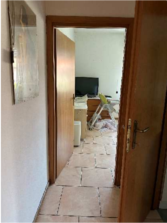
15. Vista del disimpegno verso la camera da letto.