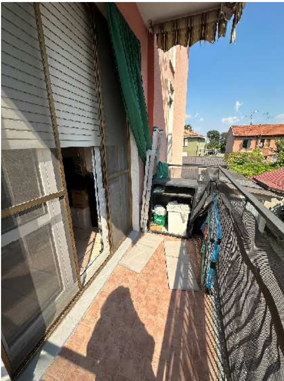
14. Vista del balcone.