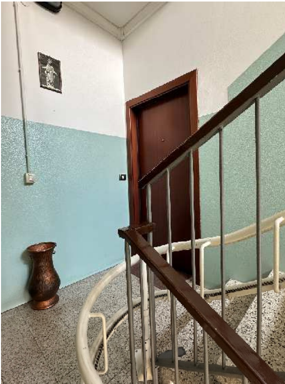
10. Individuazione della porta di accesso dell'alloggio.