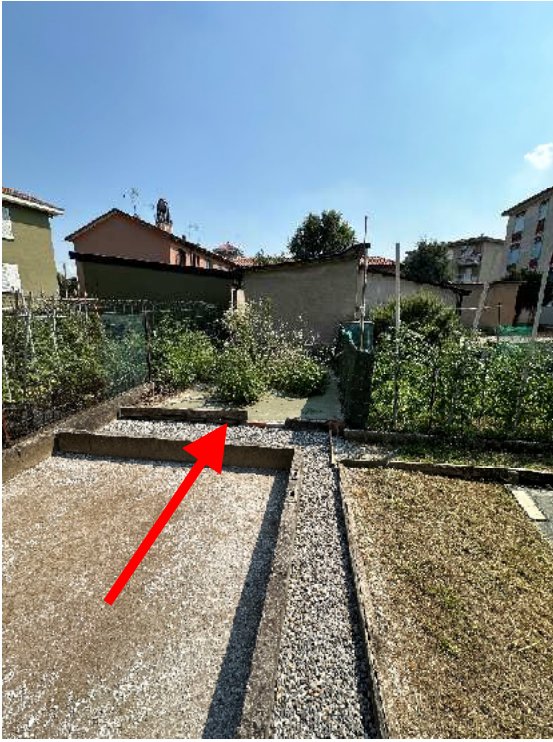
3. Vista ed indicazione dell'orticello.