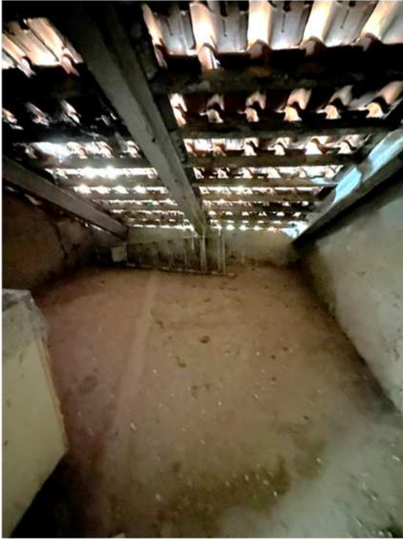
21. Vista interna del solaio.