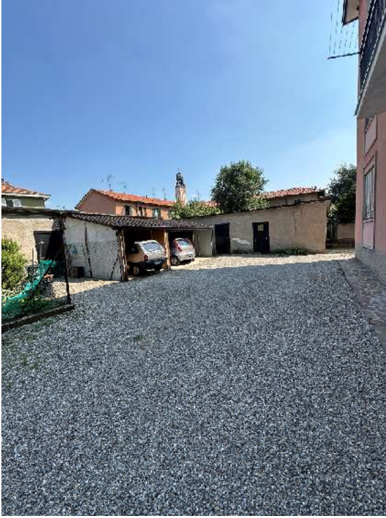
7. Vista del cortile verso il rustichetto.