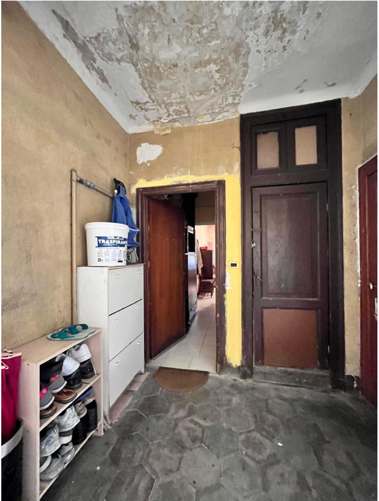
Immagine 6. Il pianerottolo con a sinistra l'accesso all'appartamento oggetto di relazione e, sulla destra, la porta del gabinetto comune. Si nota che il plafone è danneggiato verosimilmente da infiltrazioni di acqua dal tetto che è subito sopra.