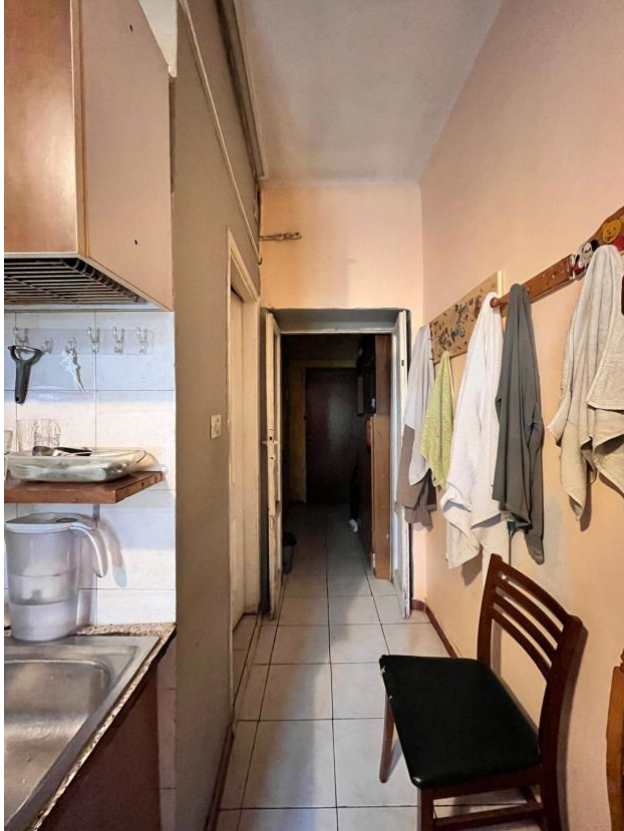
Immagine 7. L'ingresso visto dall'interno.