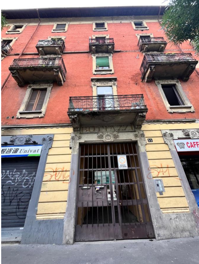
Immagine 0. Vista del fabbricato dalla pubblica via