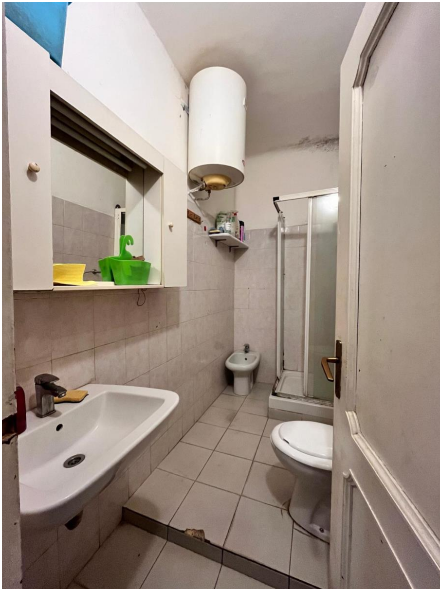
Immagine 11. Il bagno cieco a cui si accede dall'ingresso che funge da disimpegno; si notano il gradino a pavimento e anche qui mufte conseguenti ad infiltrazioni di acqua dal tetto.