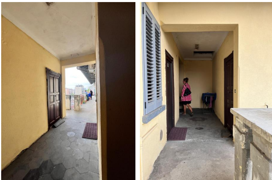
Immagini 4 e 5. Passaggio coperto tra il ballatoio al quarto piano e il grande pianerottolo che distribuisce agli alloggi d'angolo.