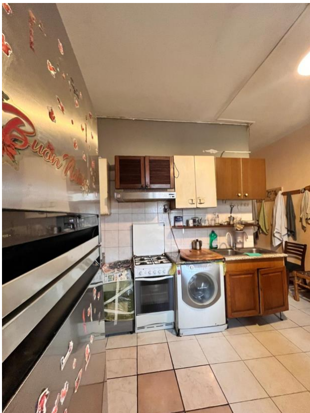
Immagine 8. Il locale soggiorno cucina pranzo.