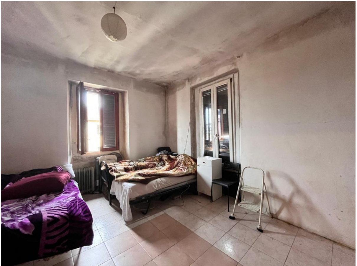
Immagini 9 e 10. La camera che ha due finestre poste su pareti ad angolo. Si notano anche in questo caso danni da infiltrazioni dal tetto e ponti termici.