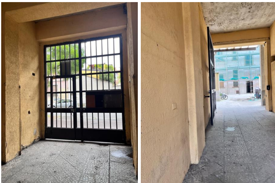
Immagini 1 e 2. Vista del cancello dall'interno dell'androne e dell'androne verso il cortile interno.