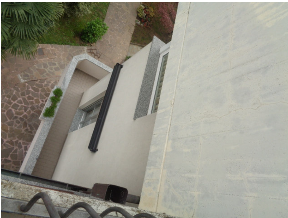
38. affaccio del balcone al piano sottotetto