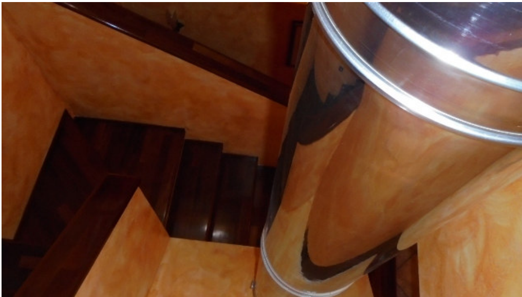
21. la canna fumaria “a vista” che attraversa il volume dell’abitazione fin oltre il sottotetto