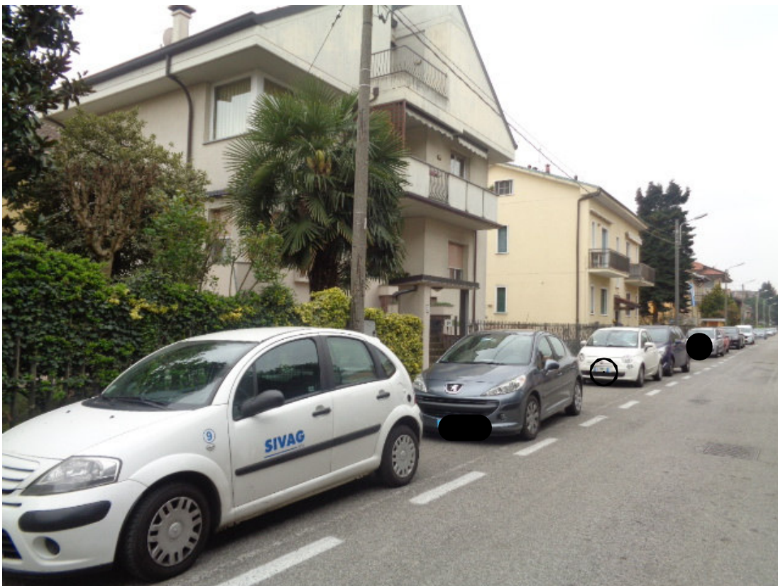
2. veduta prospettica lungo la via Nazario Sauro e dell'edificio in cui è sita l'unità immobiliare pignorata