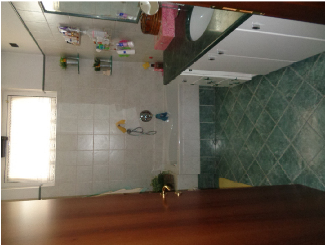
17. l'interno del bagno