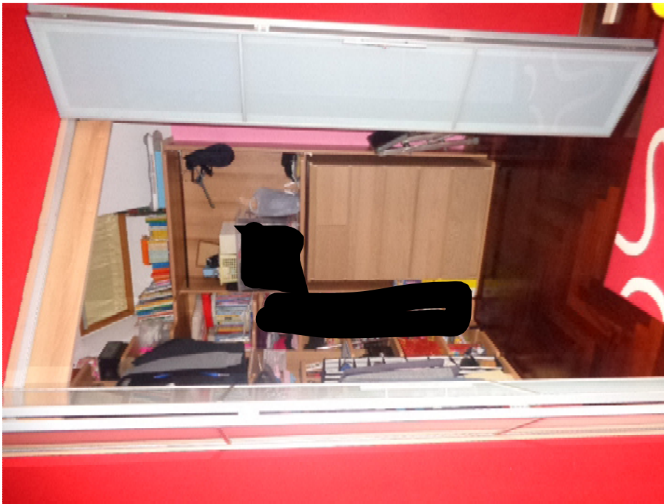
29. l'interno del locale guardaroba