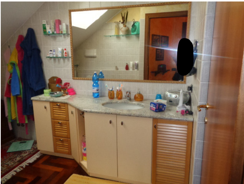
44. particolare della zona del lavabo