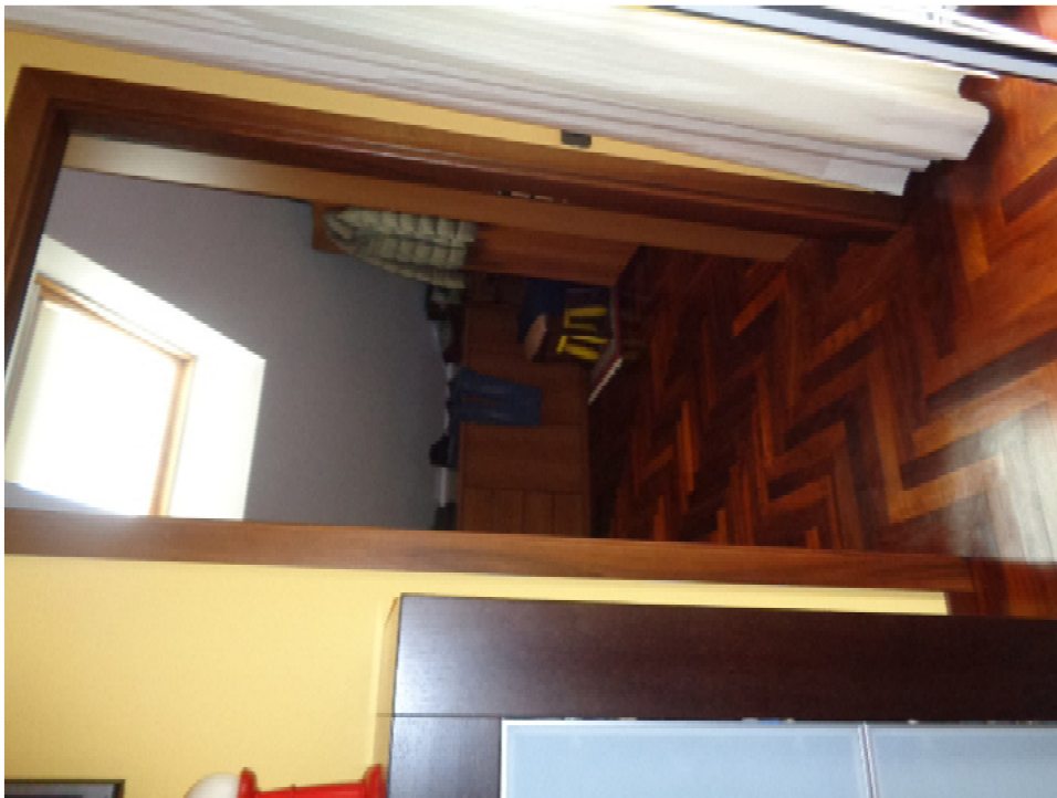
34. vista del locale guardaroba all'interno della camera matrimoniale