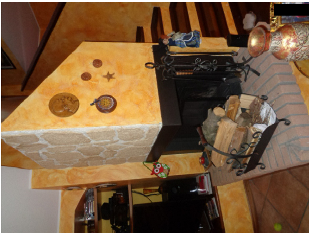
20. particolare del caminetto caratterizzante il soggiorno