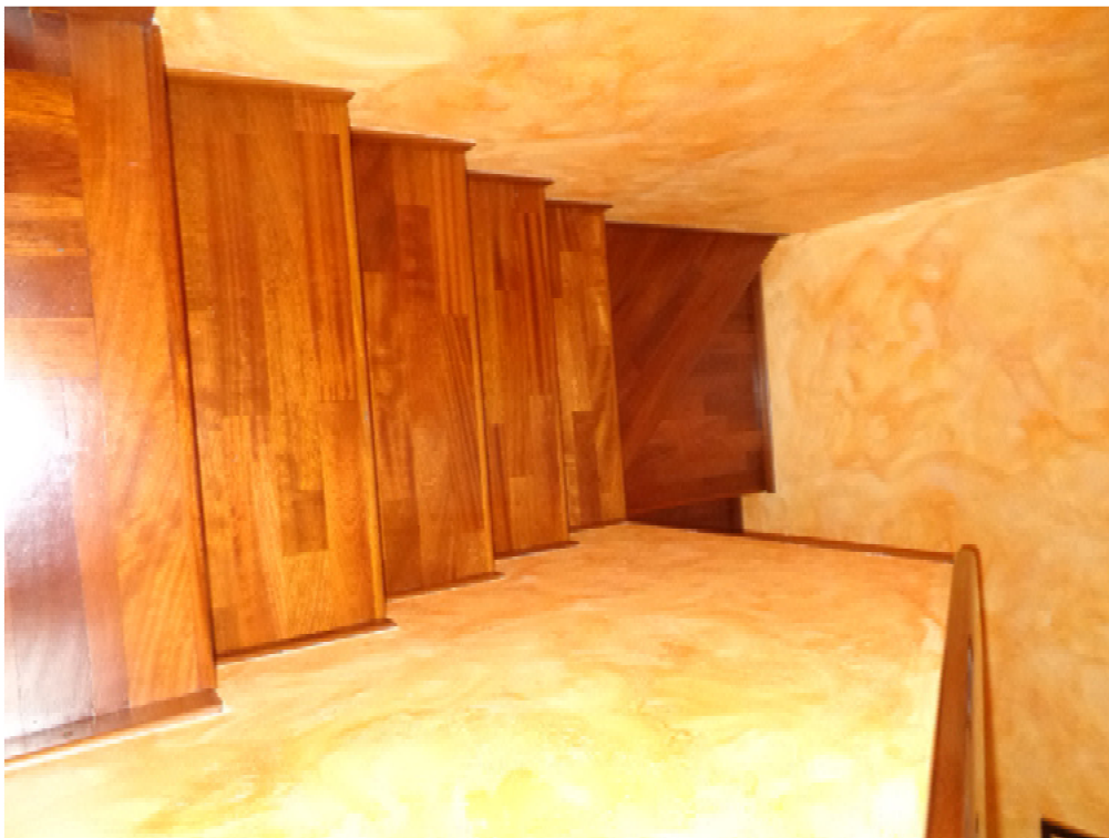
22. veduta dal basso della scala di accesso al sottotetto