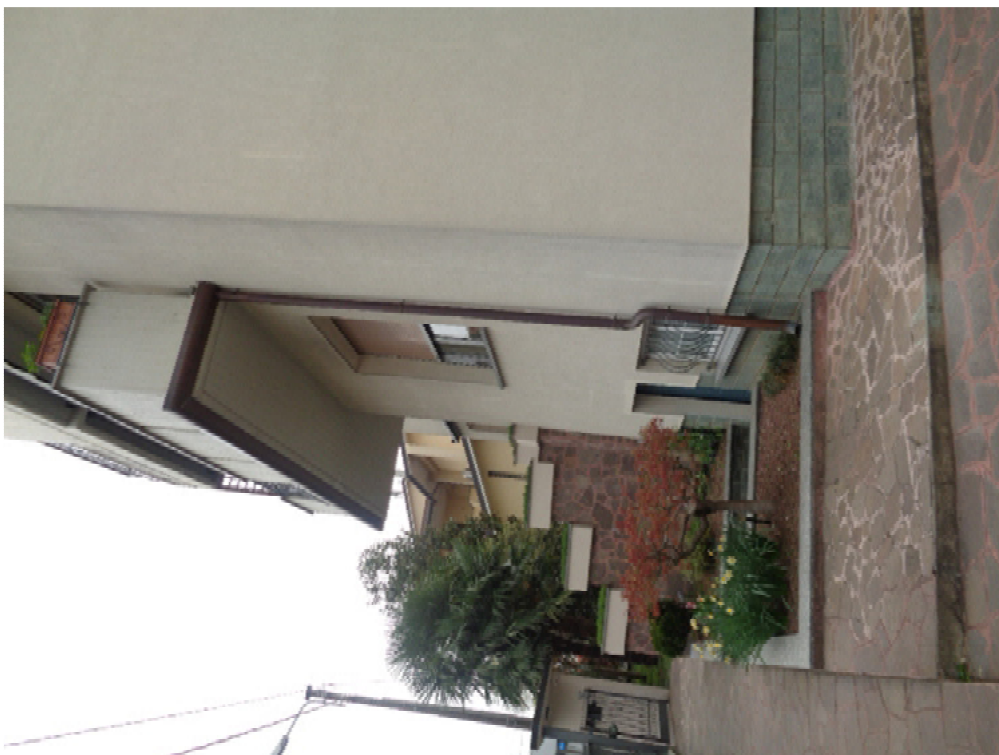
6. veduta angolare dell'edificio