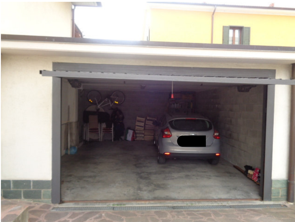
46. l'interno dell'autorimessa