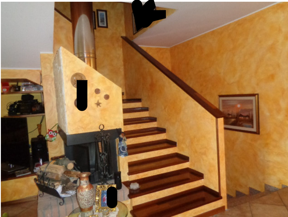
19. la scala di accesso al sottotetto