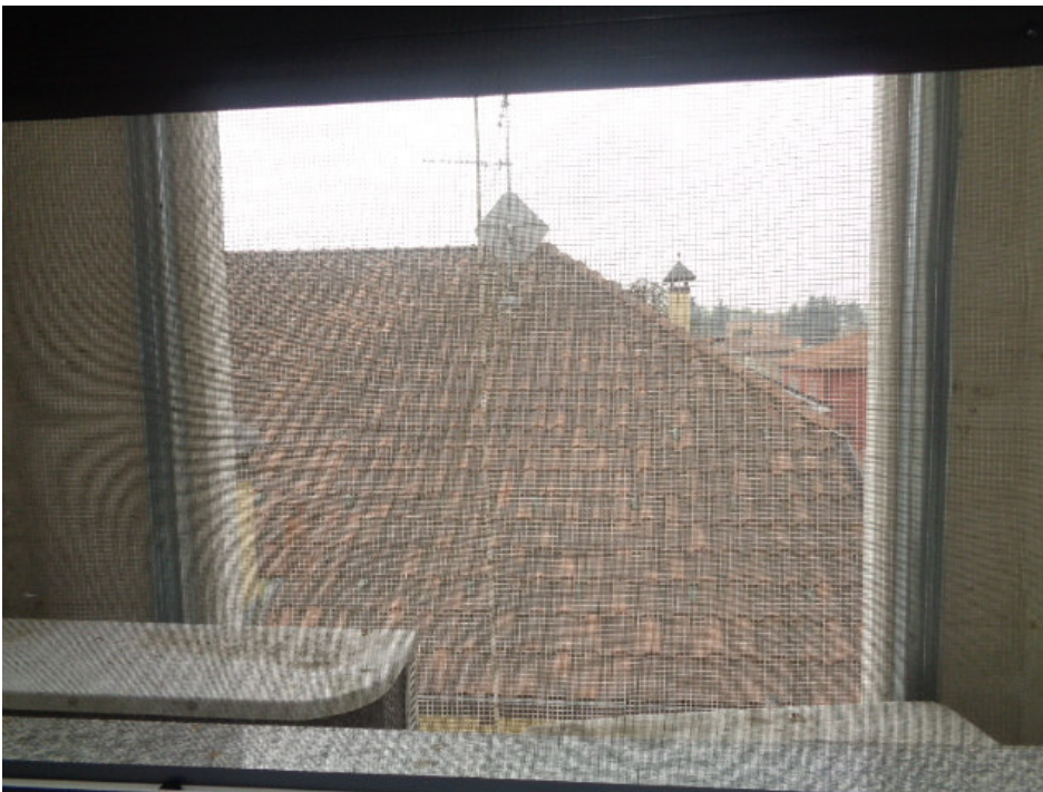
30. la finestra della camera da letto singola, affacciatesi su un'intercapedine verticale che circonda il piano sottotetto