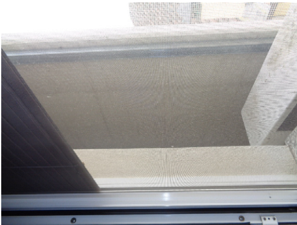
31. particolare dell'intercapedine dalla finestra della camera