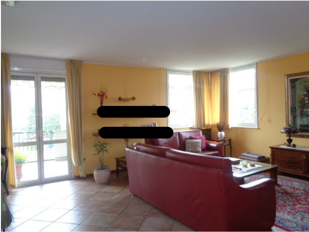
11. veduta del soggiorno