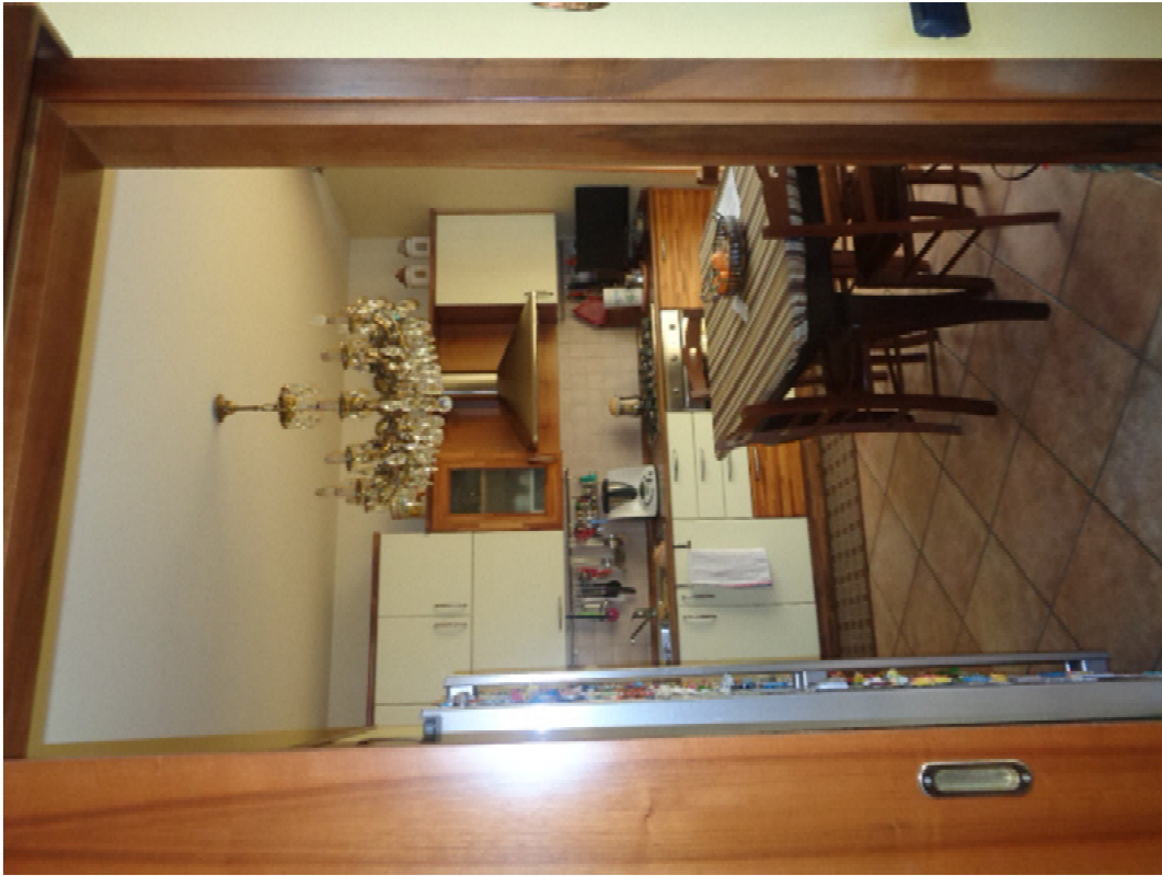
13. la cucina abitabile confinante con la zona di soggiorno che avrebbe dovuto ospitare invece una camera