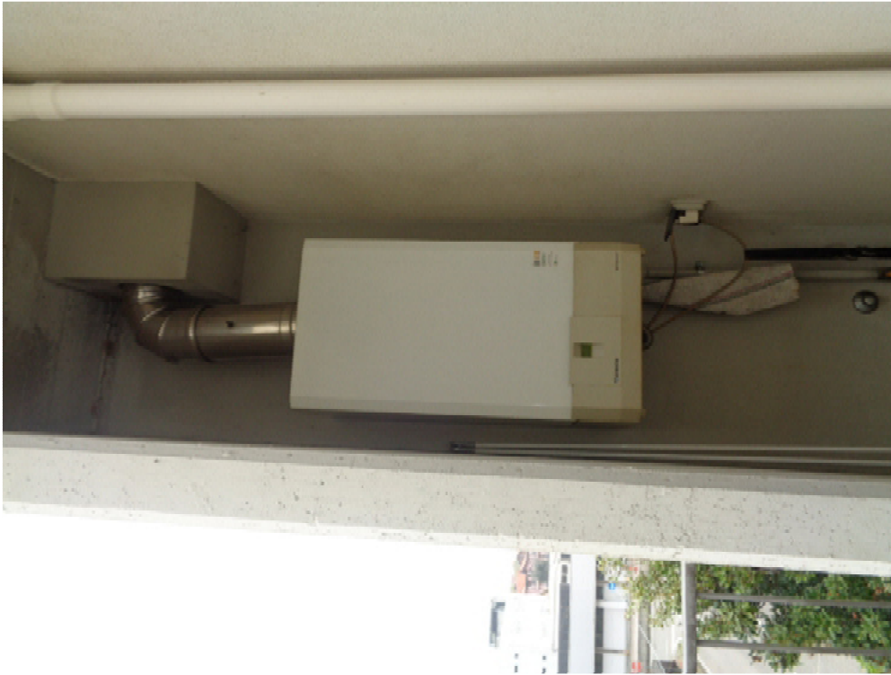
39. la caldaia ubicata in un locale aperto posto sul balcone