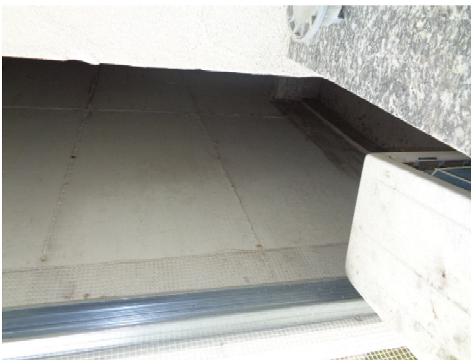
32. l'interno dell'intercapedine