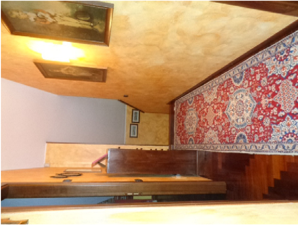
23. il corridoio di disimpegno dei locali nel sottotetto