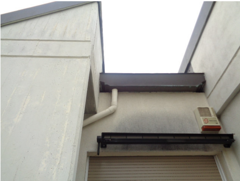
40. l'uscita della camera da letto con l'ingresso al locale contenente la caldaia