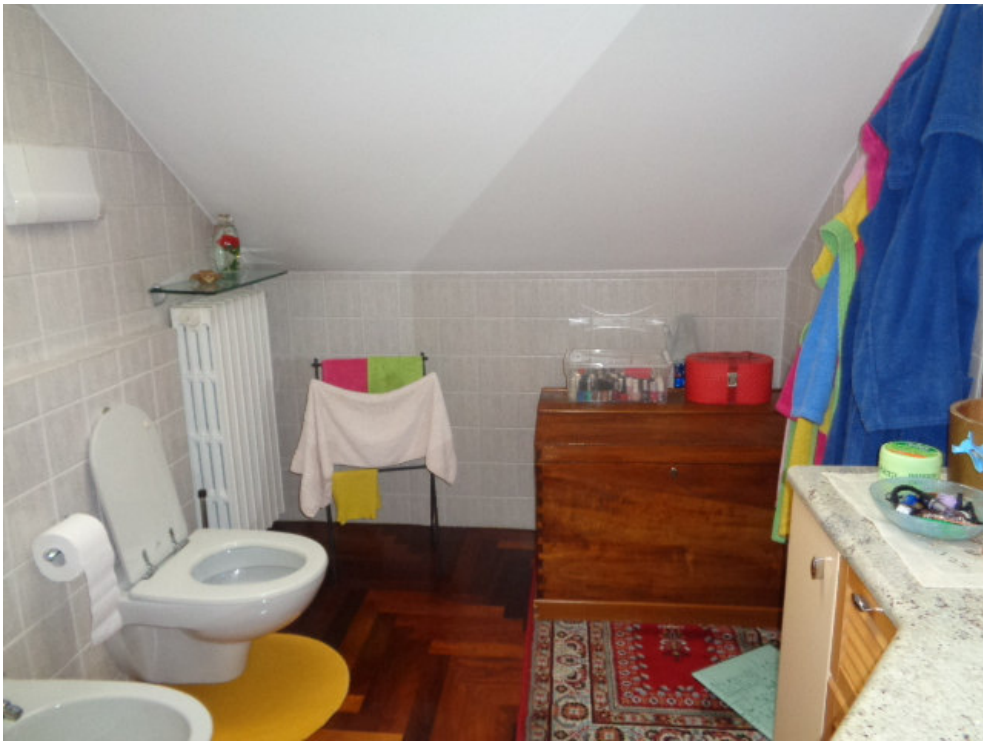
43. l'interno del bagno