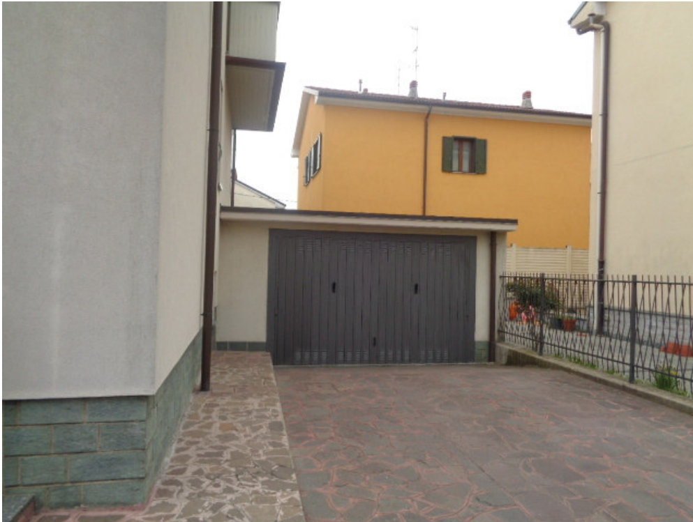
45. vista frontale dell'autorimessa a servizio dell'unità immobiliare pignorata