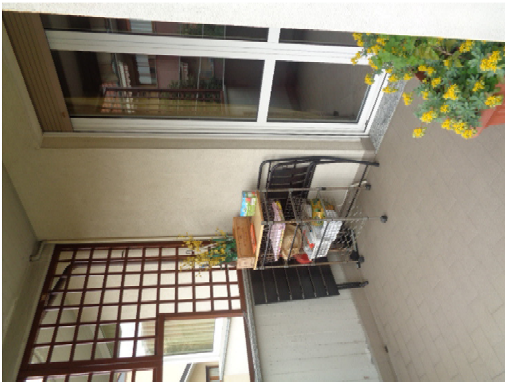
12. il balcone del soggiorno