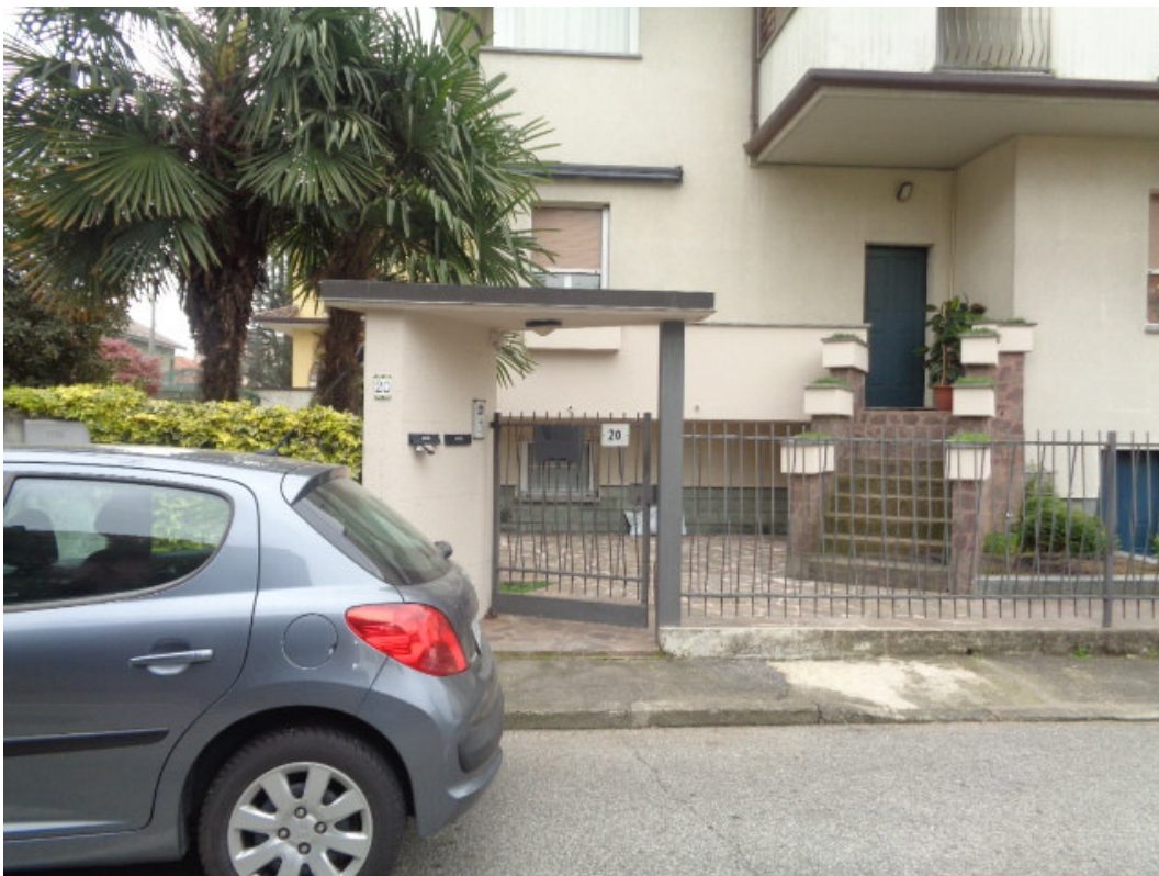
3. l'ingresso all'edificio in cui è sita l'unità immobiliare pignorata, dal civico n. 20 di via Nazario Sauro