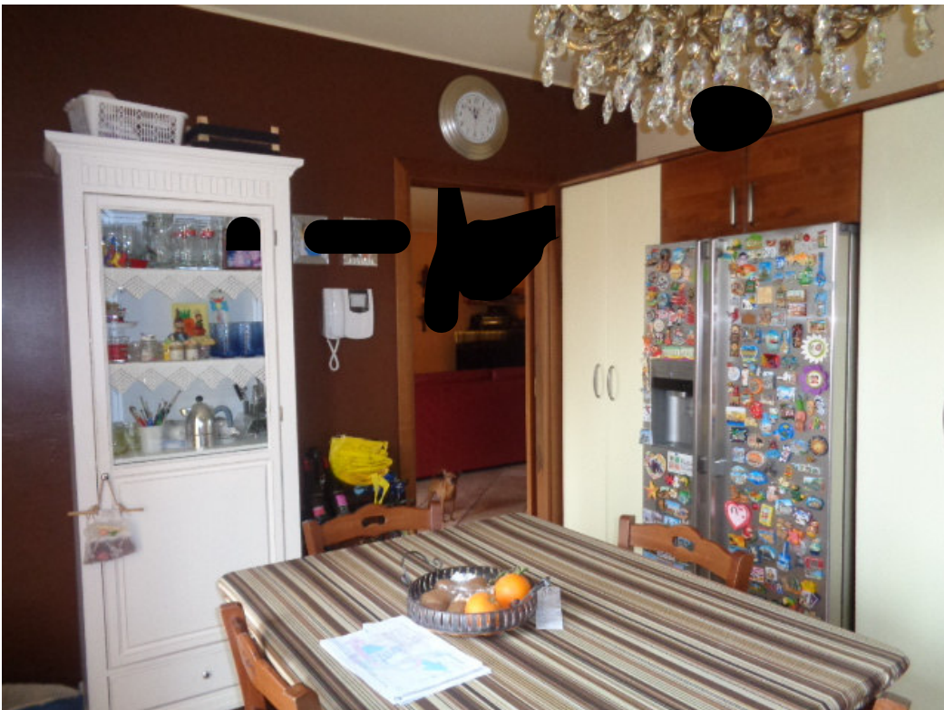
14. l'interno della cucina abitabile