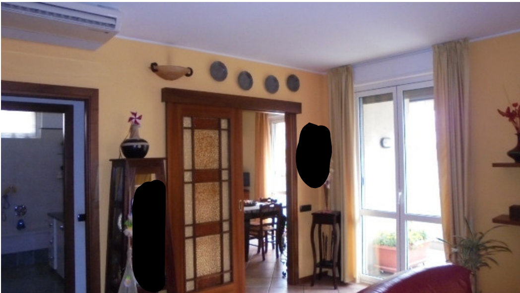
18. veduta generale del soggiorno con la porta di ingresso alla cucina abitabile