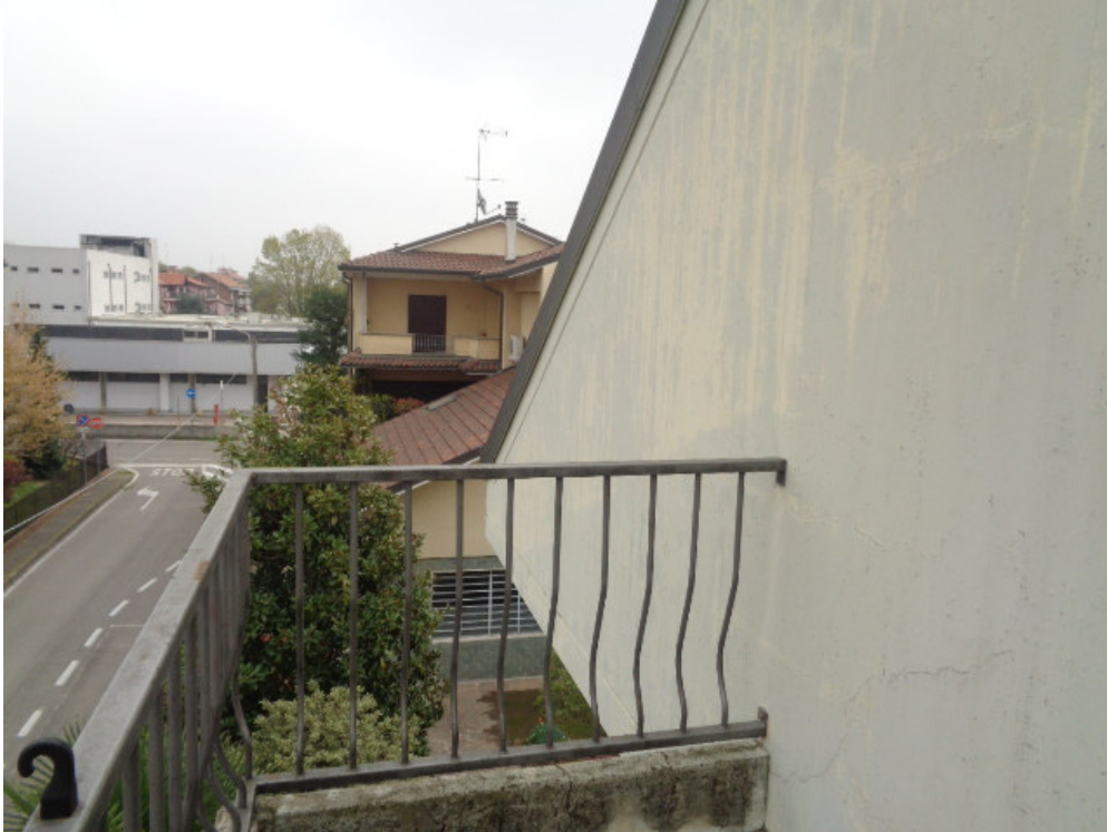
37. affaccio del balcone al piano sottotetto