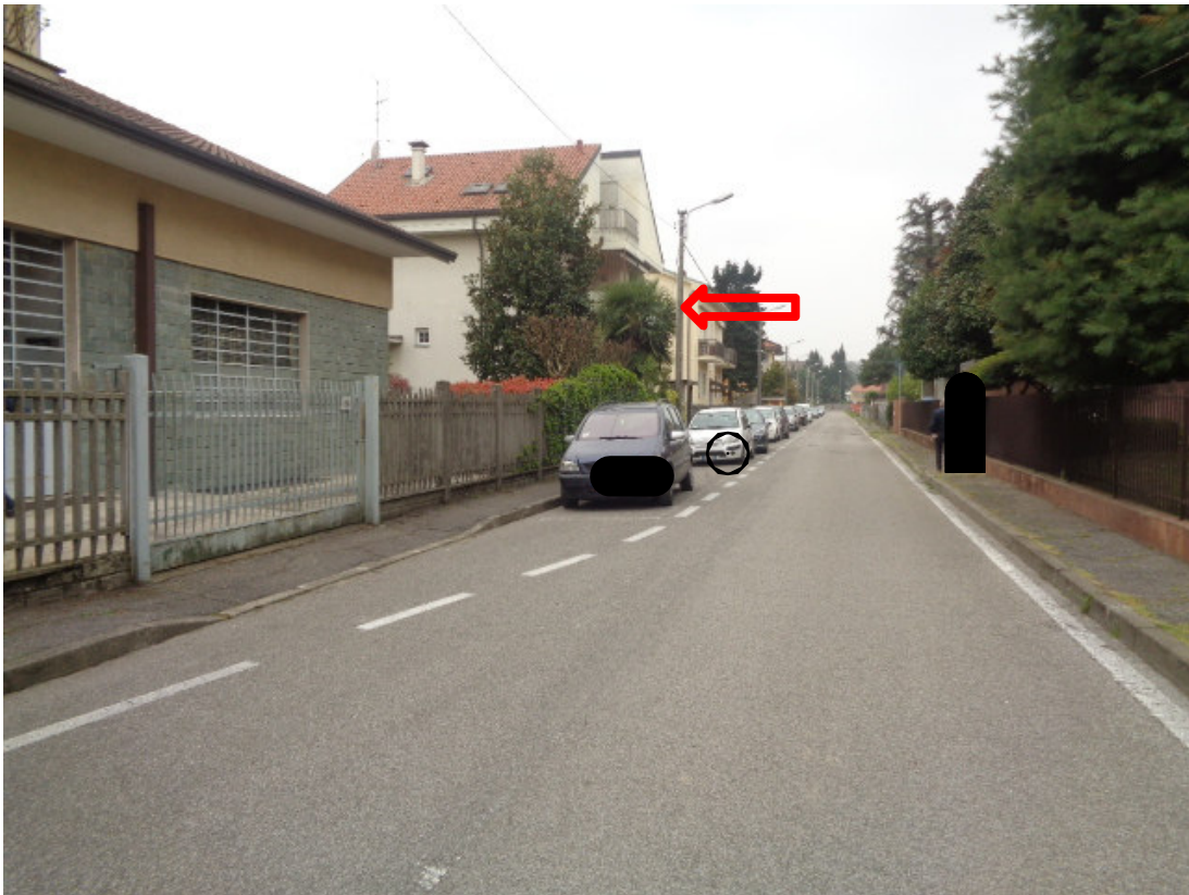
1. veduta prospettica lungo la via Nazario Sauro con individuazione dell'edificio in cui è sita l'unità immobiliare pignorata