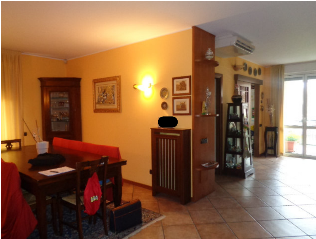
9. l'interno dell'unità immobiliare al piano primo con vista sulla zona pranzo aperta sul soggiorno