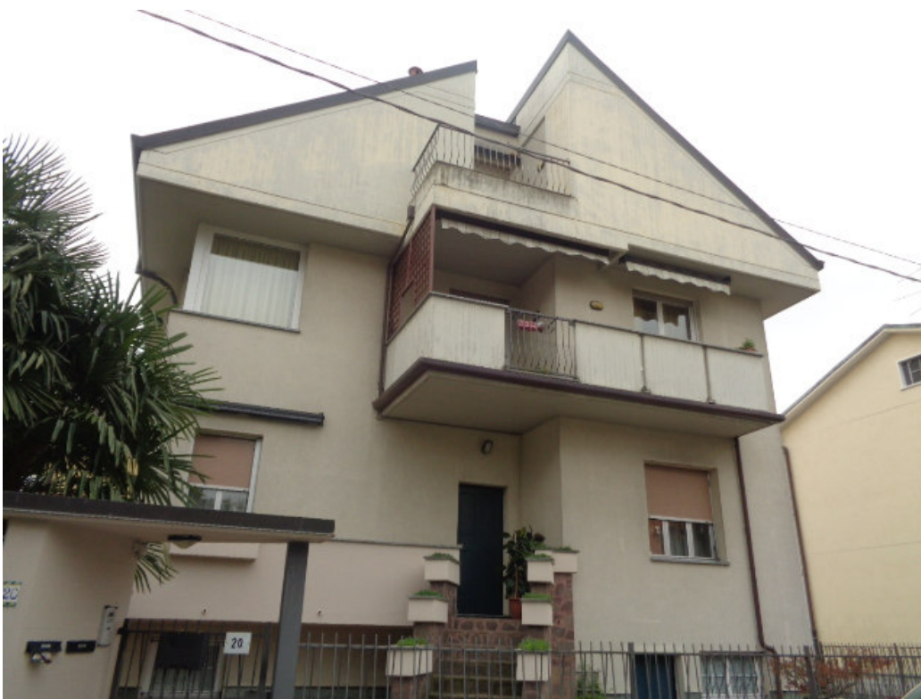
4. il fronte dell'edificio sulla via Nazario Sauro