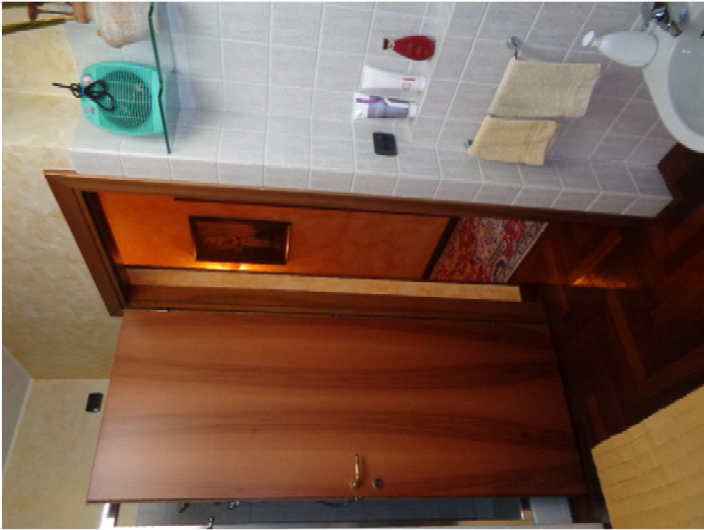
41. l'ingresso del bagno al piano sottotetto