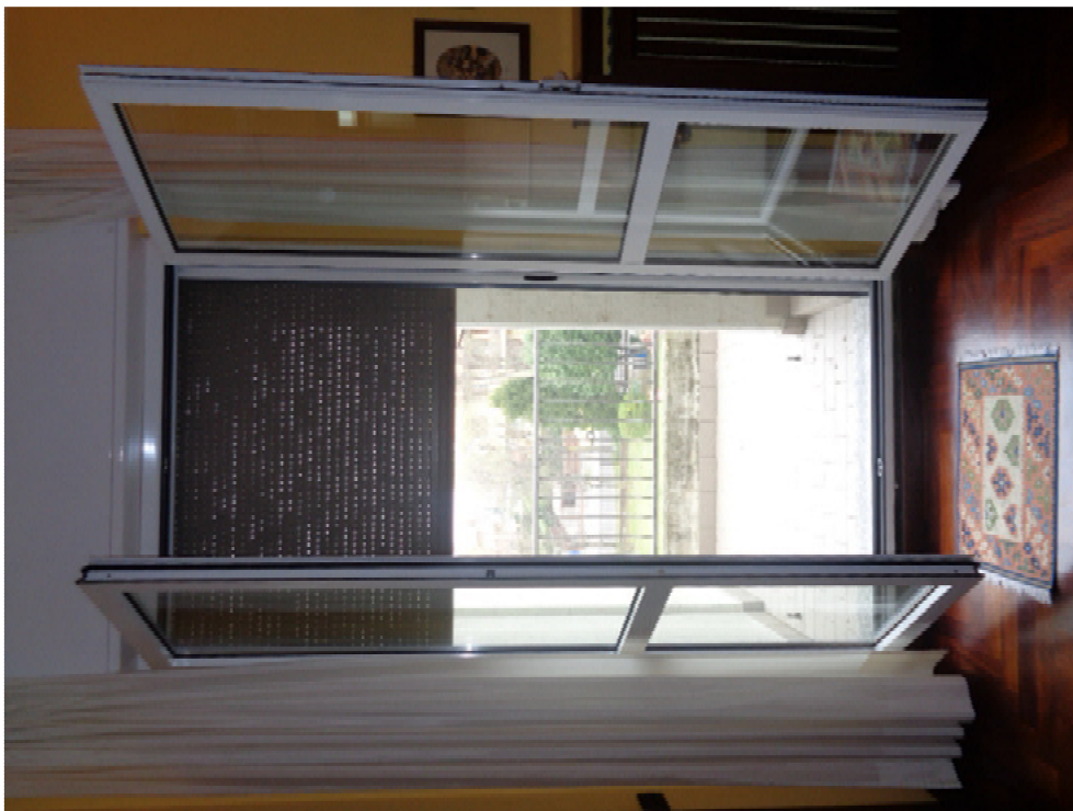
36. la porta finestra della camera da letto matrimoniale dante accesso ad un ampio balcone