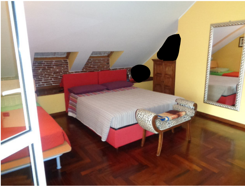
33. la camera da letto matrimoniale