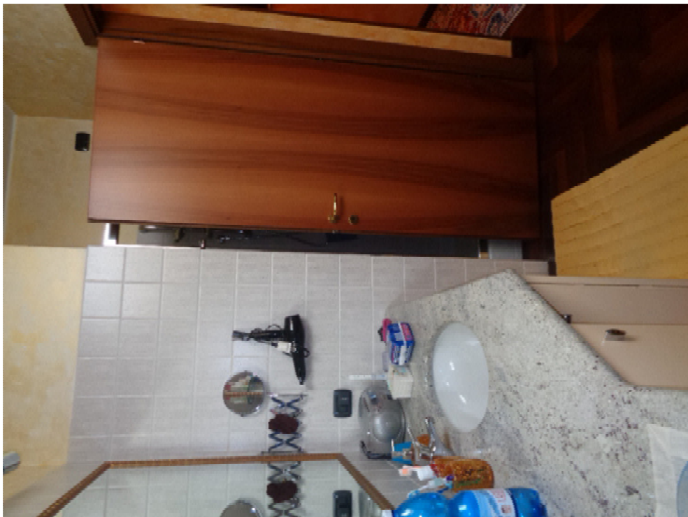
42. l'interno del bagno