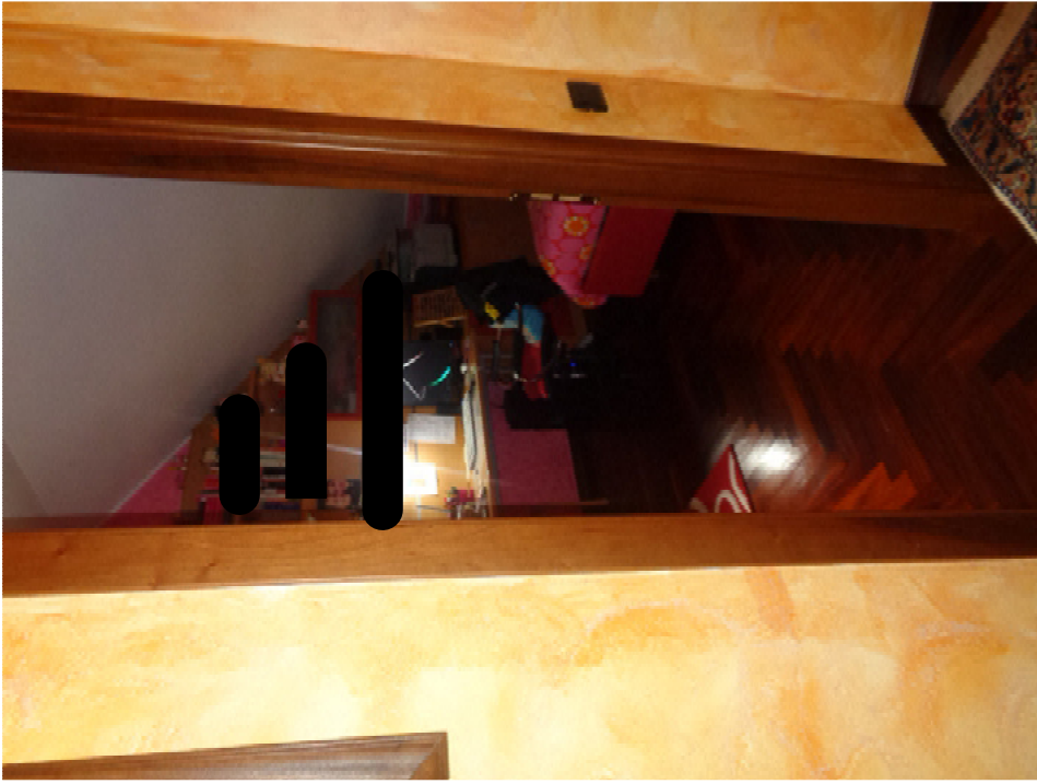
25. l'ingresso alla camera da letto singola