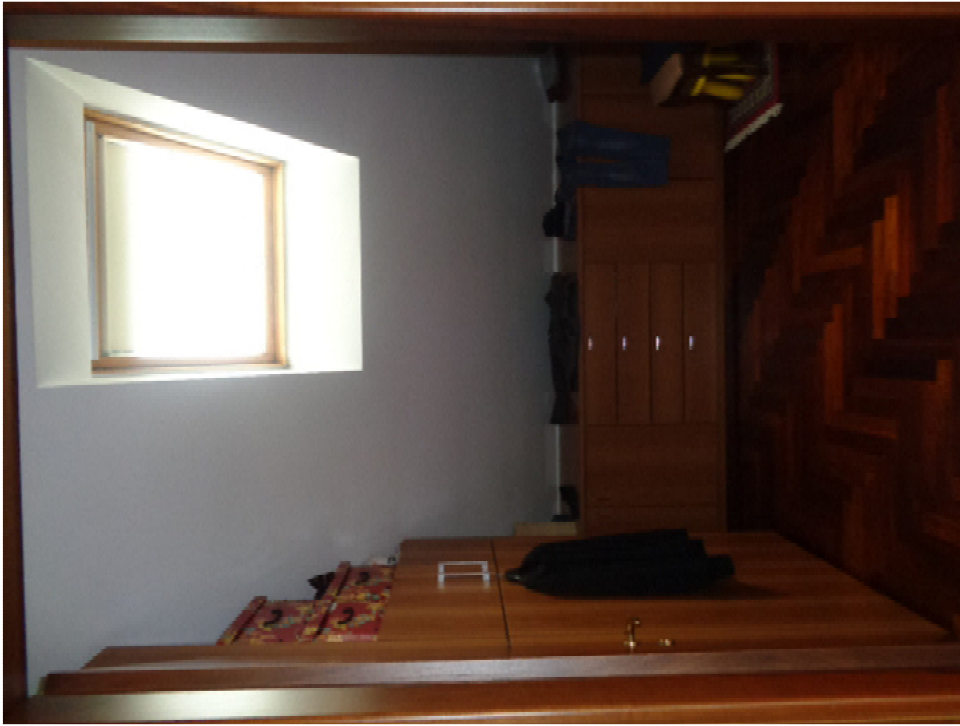
35. l'interno del locale guardaroba