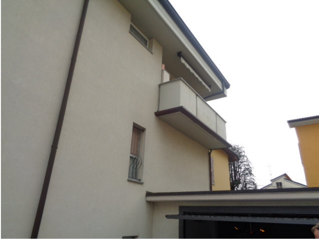
7. prospetto parziale dell'edificio in prossimità dell'autorimessa a servizio dell'unità immobiliare pignorata