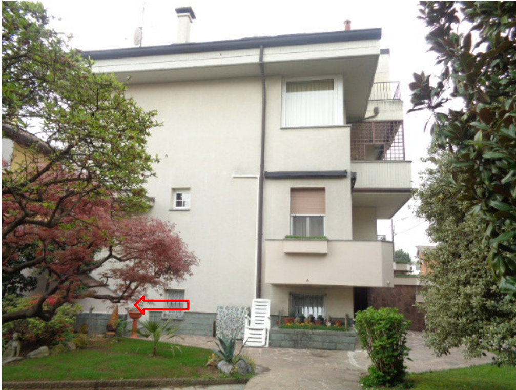
5. veduta laterale interna dell'edificio, con evidenziazione della scala dante accesso all'unità immobiliare pignorata