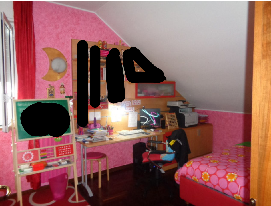
26. l'interno della camera da letto singola