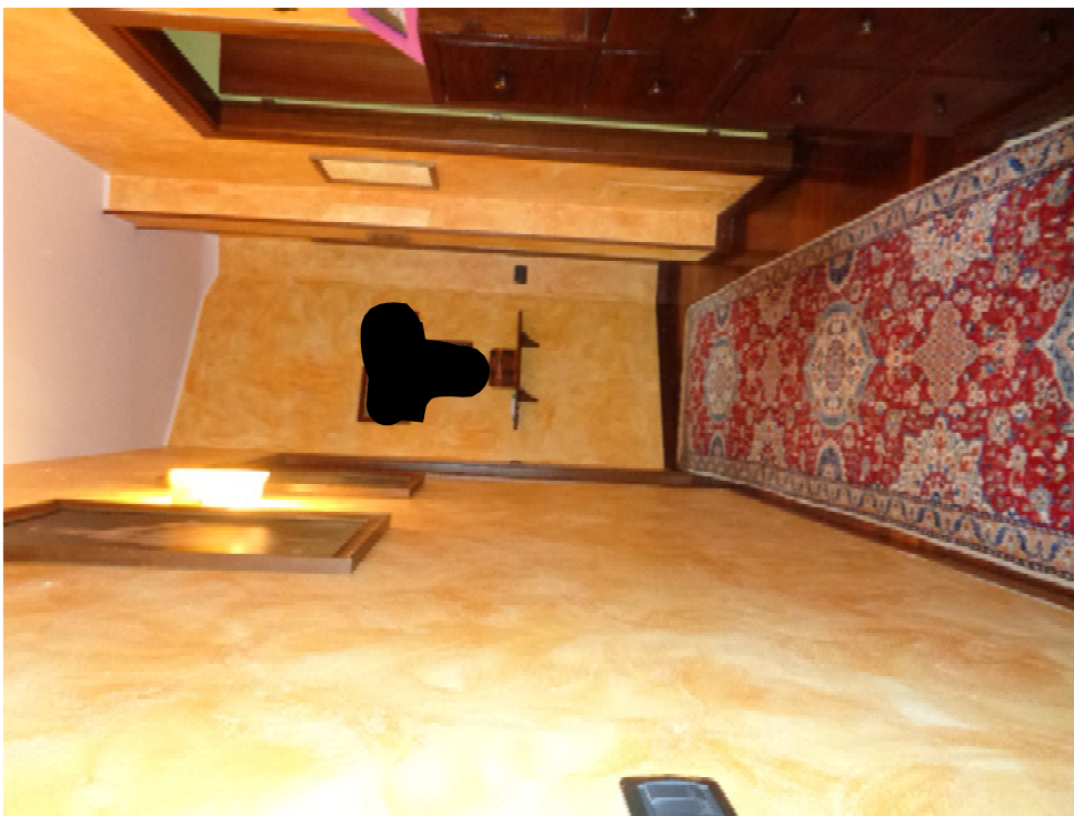
24. veduta del corridoio verso la scala di accesso al sottotetto