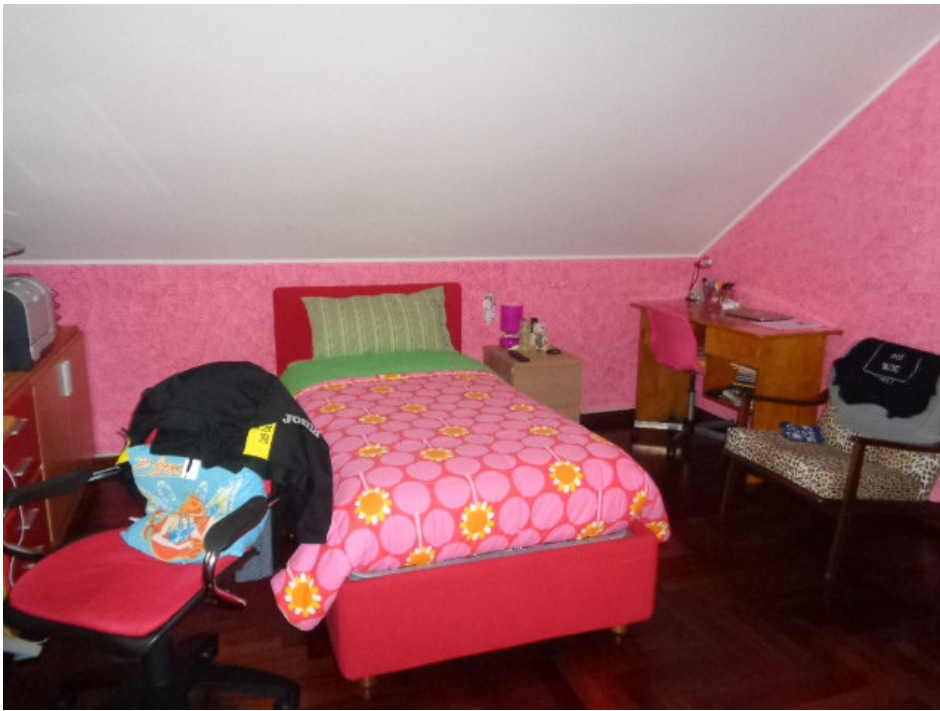
27. dettaglio del lettino singolo