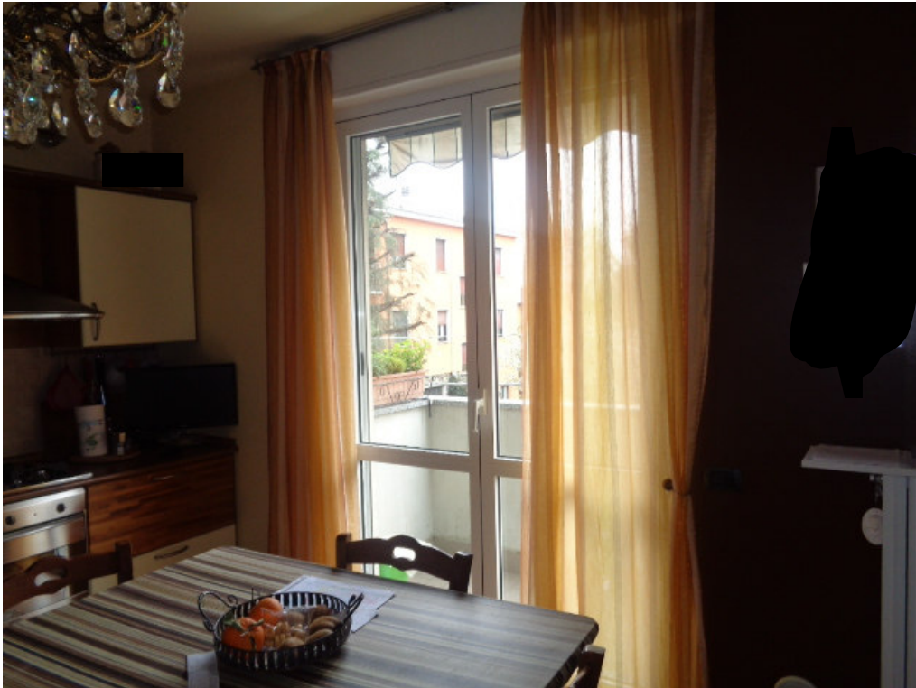
15. l'interno della cucina