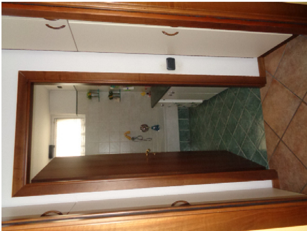
16. l'ingresso al bagno