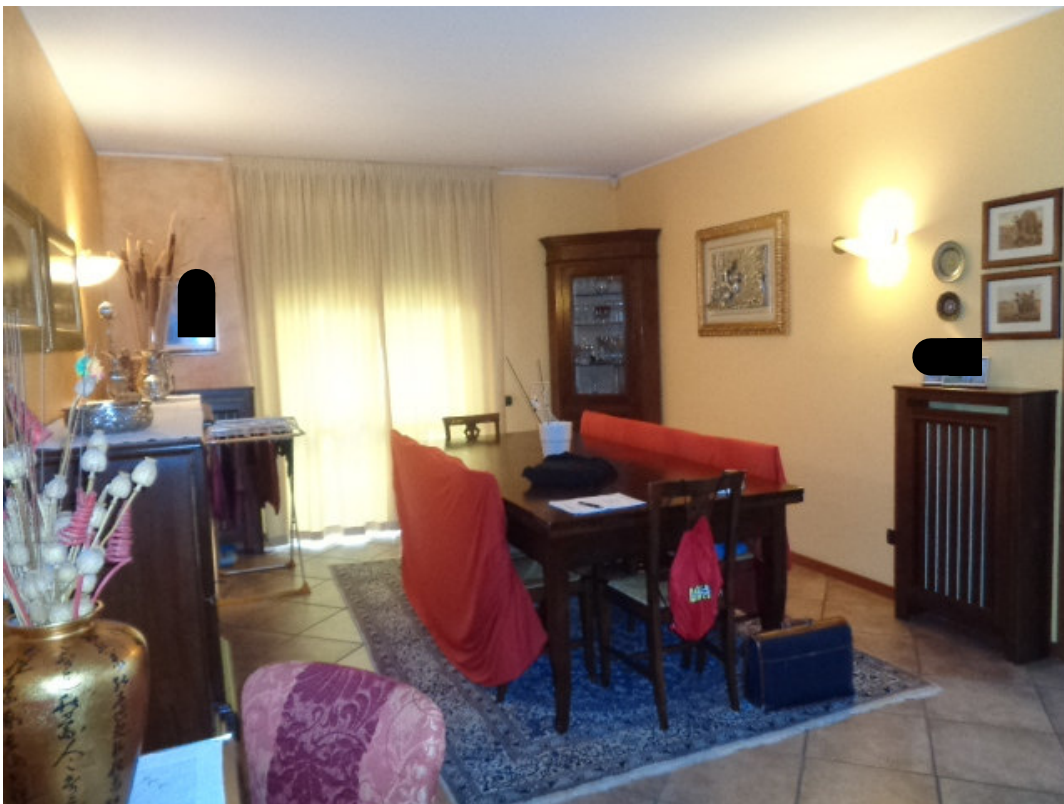
10. veduta della zona pranzo