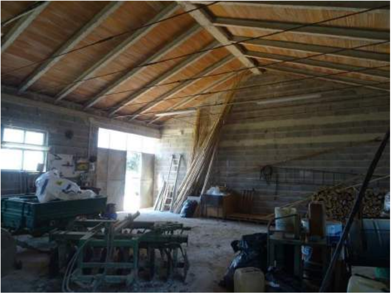
12. Interno, altra vista