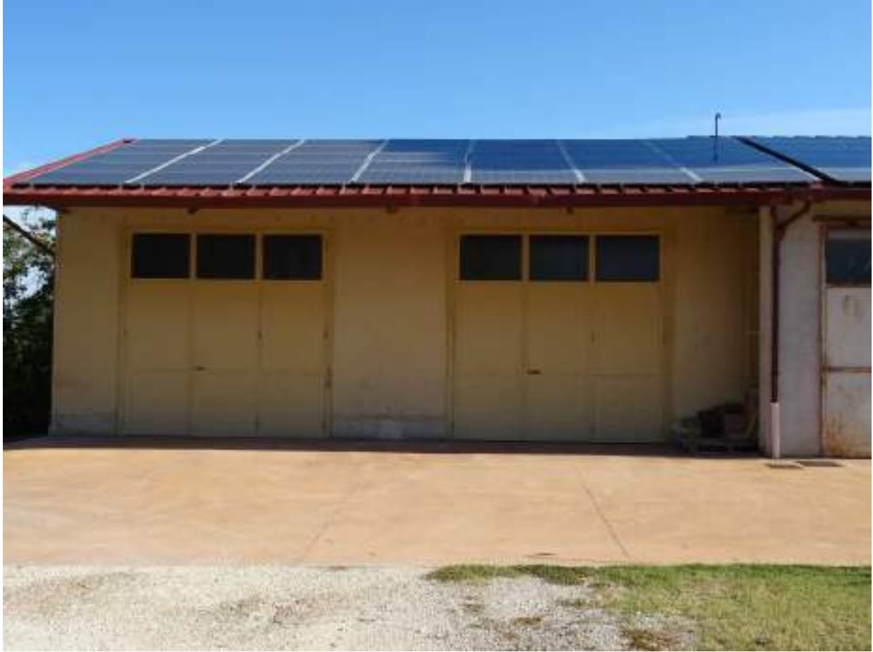
18. Prospetto frontale, da via Chiocco e pannelli fotovoltaici