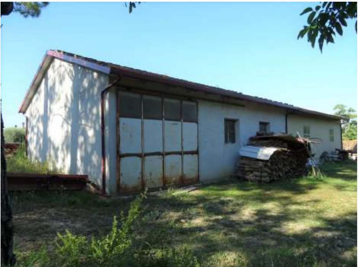
3. Altra vista generale posteriore