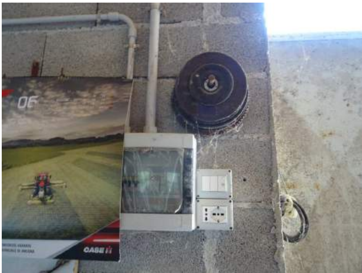
16. Quadro e presa elettrica