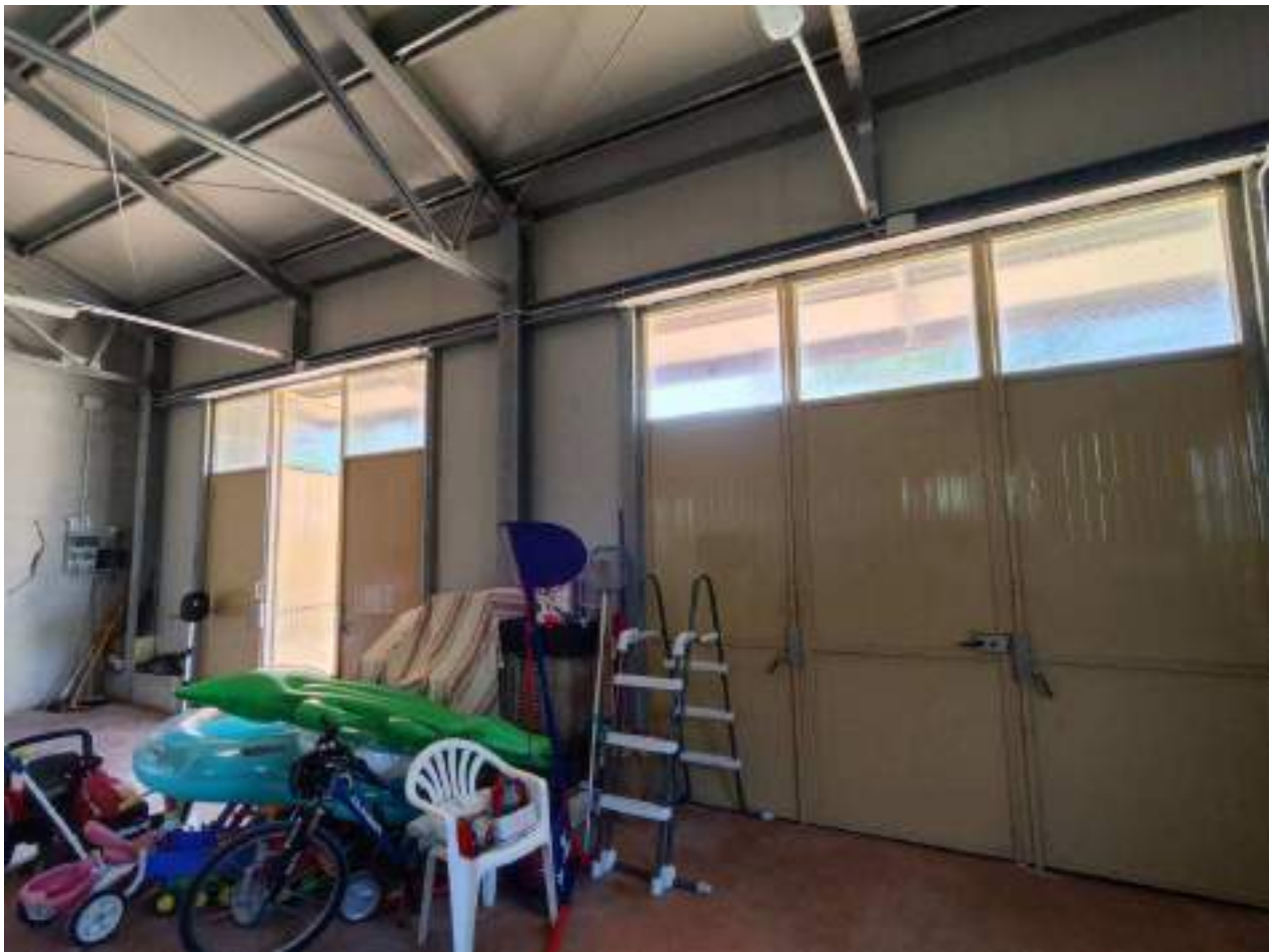
22. Interno, altra vista