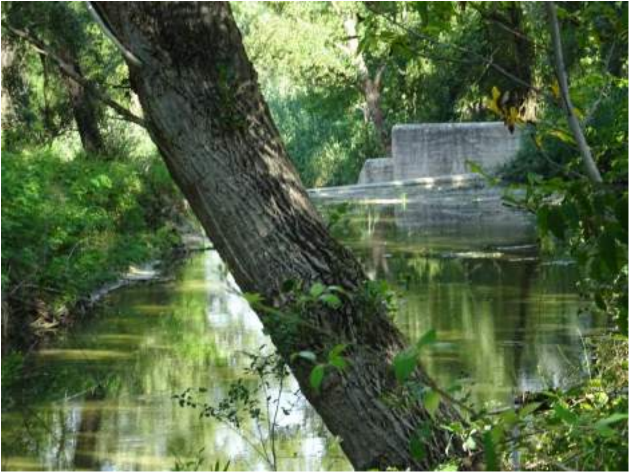
119. Fiume Misa