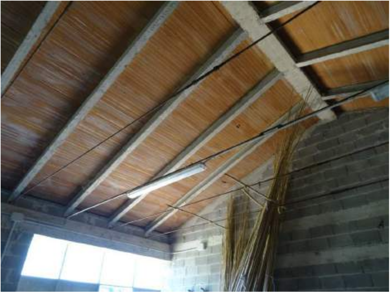
14. Prospetto laterale