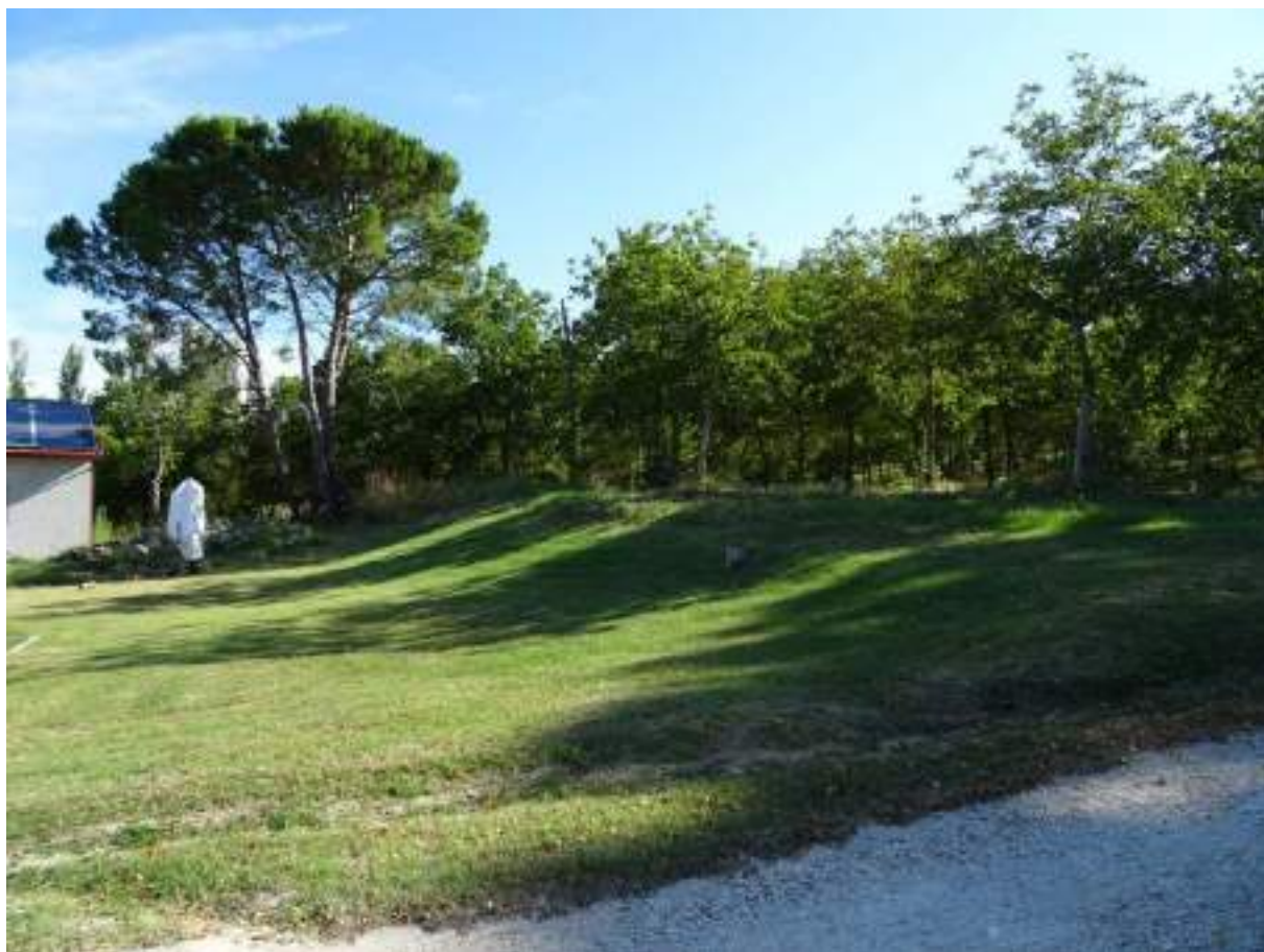
1. Inizio presentazione del compendio dei 22 terreni, a partire dai fabbricati della medesima proprietà

Documentazione fotografica dei n. 22 terreni in Serra de' Conti (AN) C.T. fg. 8, partt. 32, 38, 43, 49, 50, 51, 60, 196, 199, 207, 210, 274, 1141, 1145, 1148, 1152, 1285, 1286, 1287, 1288, 1289, 1290.