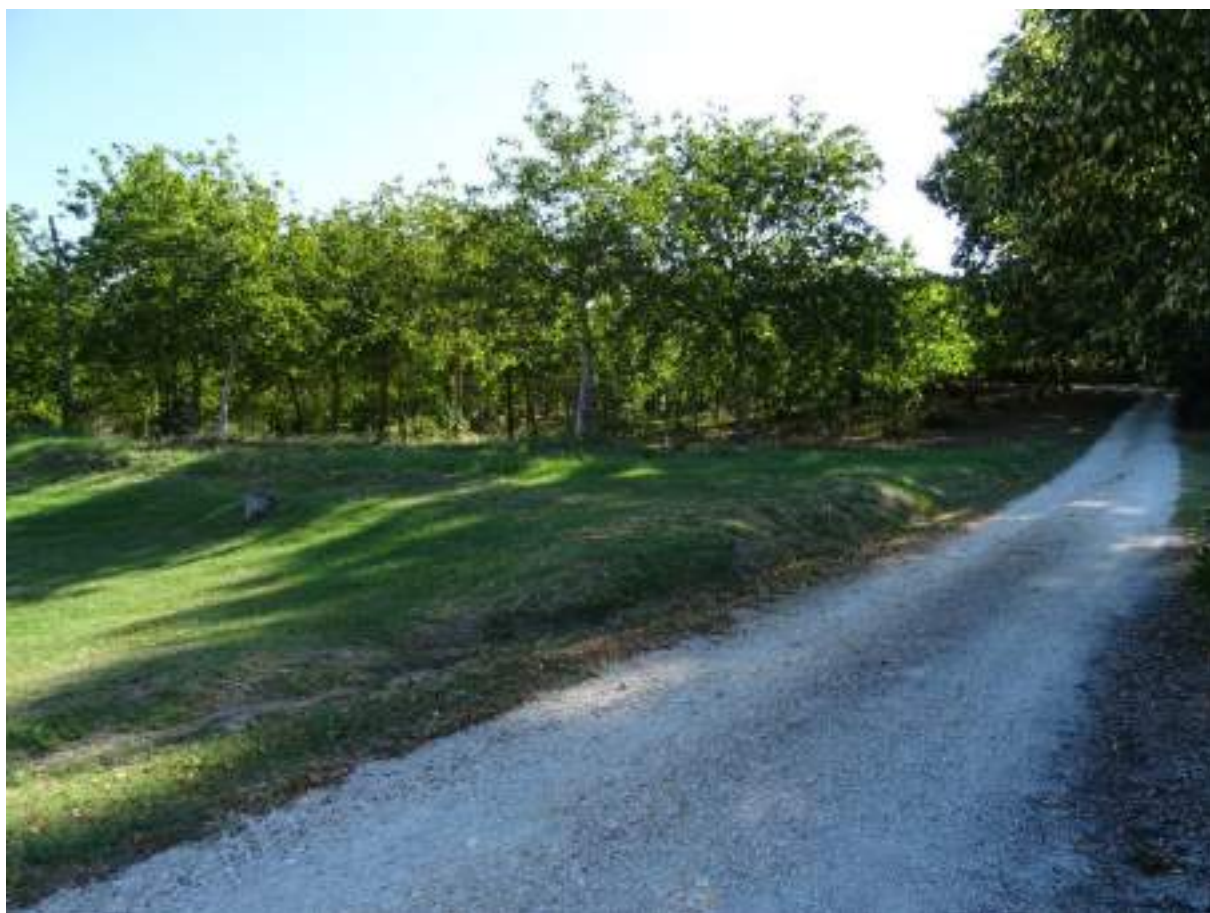
2. Via Chiocco