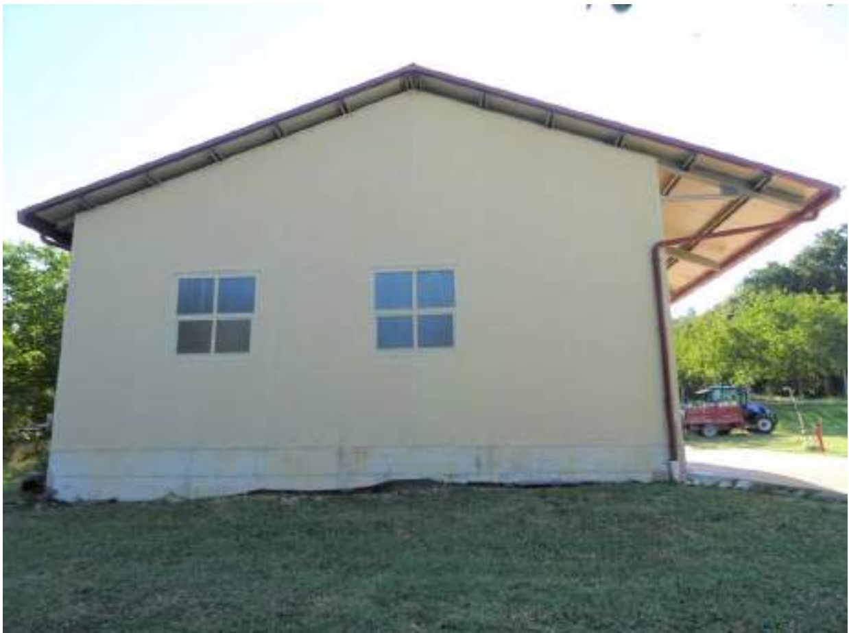
19. Prospetto laterale