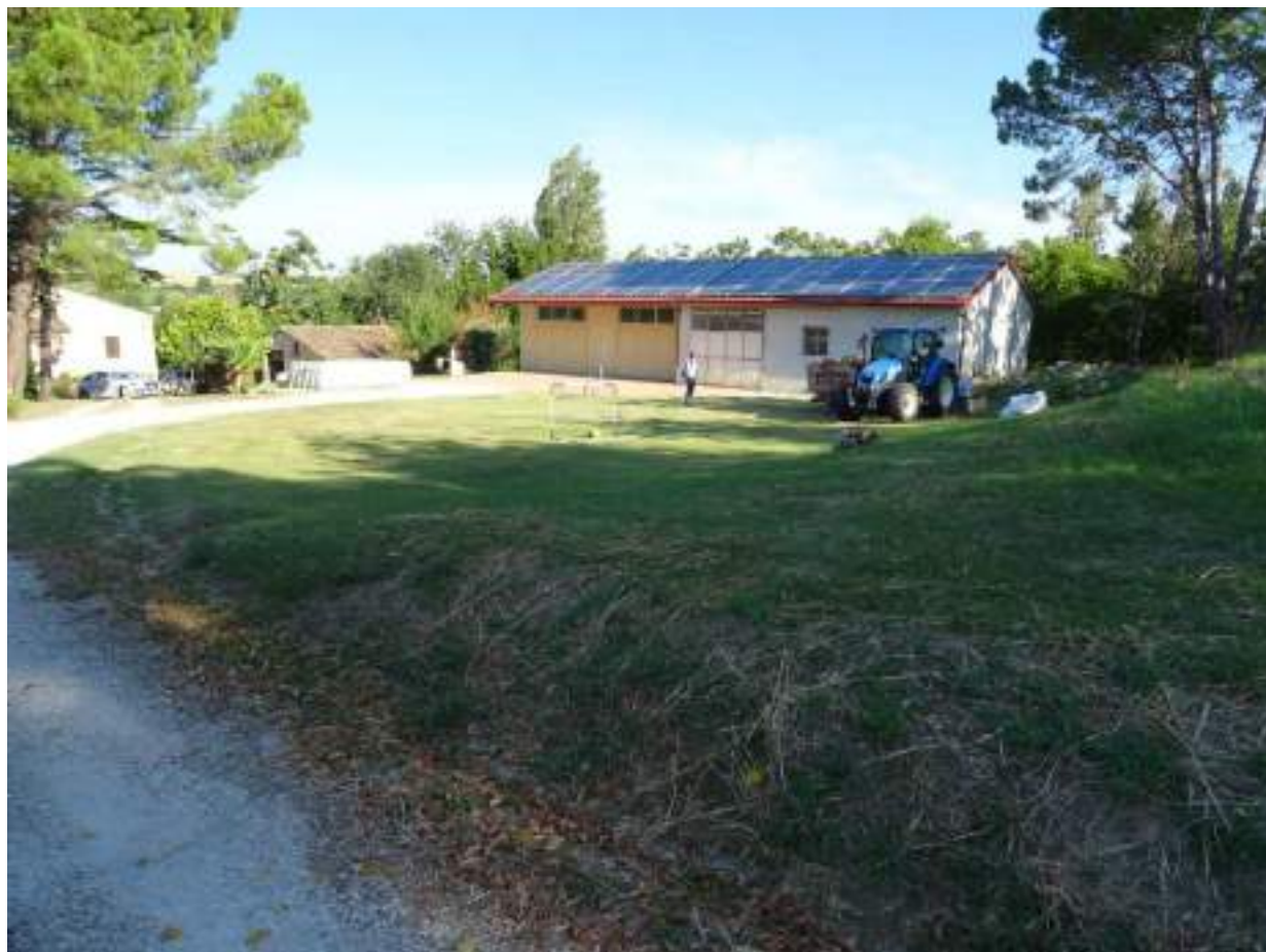
4. Corte vista da via Chiocco