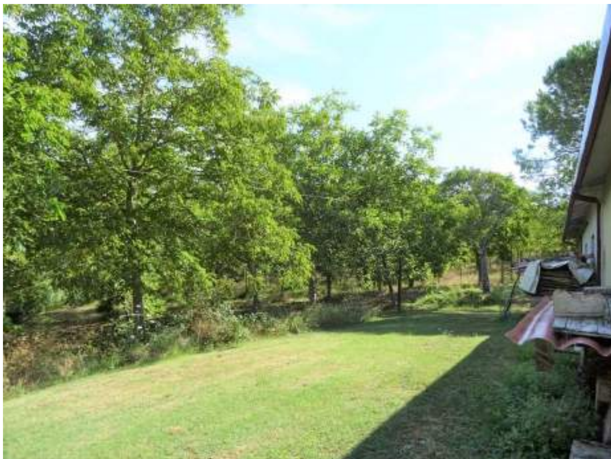
5. Corte, vista posteriore