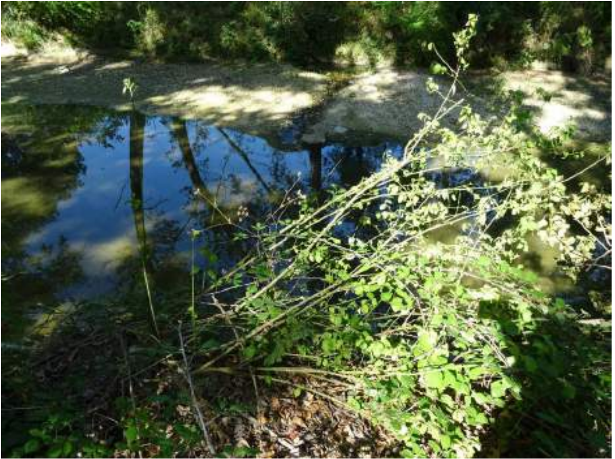
121. Fiume Misa