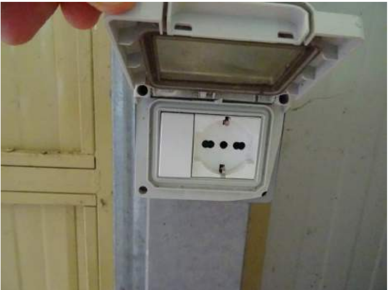
27. Presa elettrica