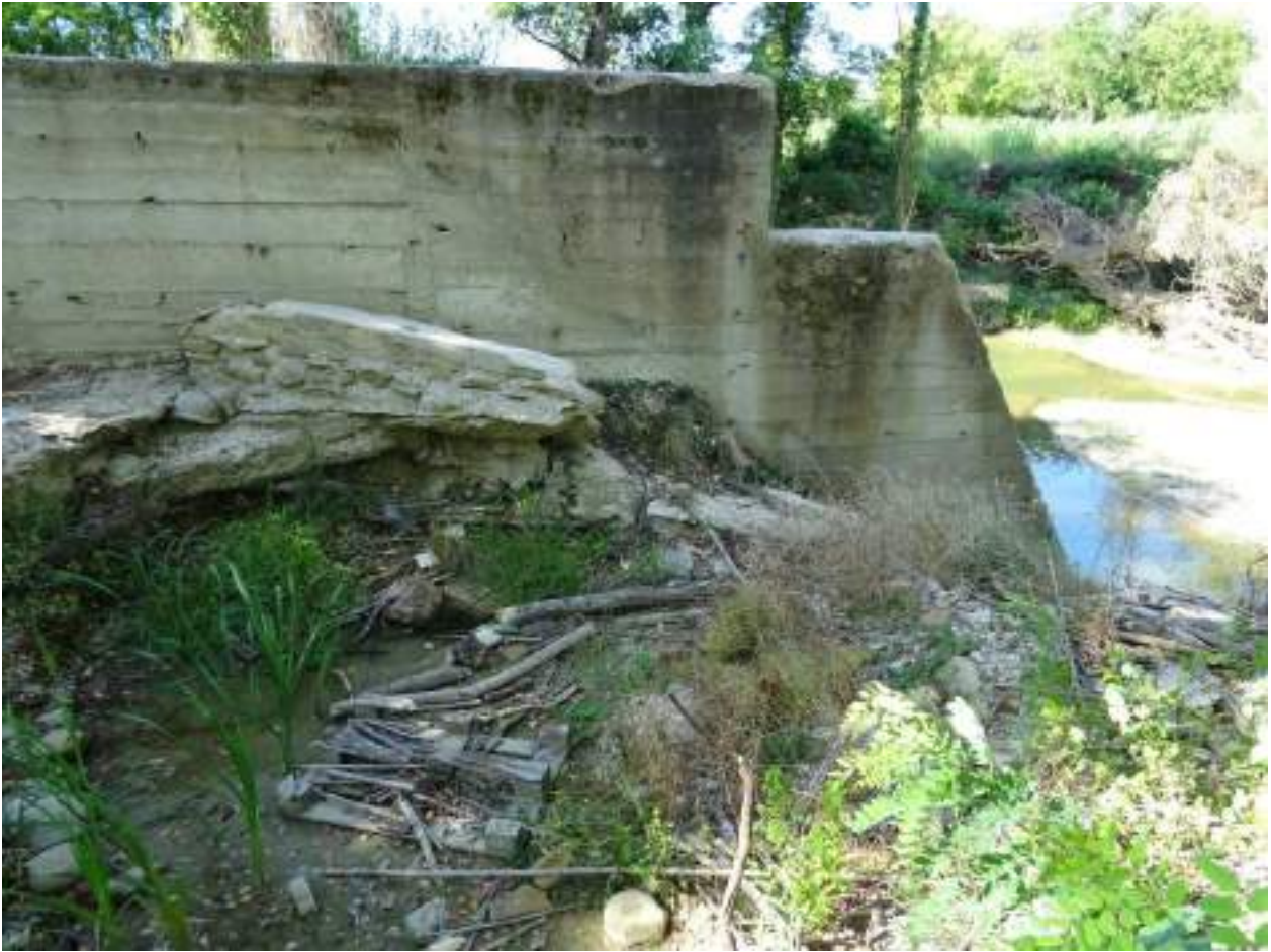
109. Fiume Misa