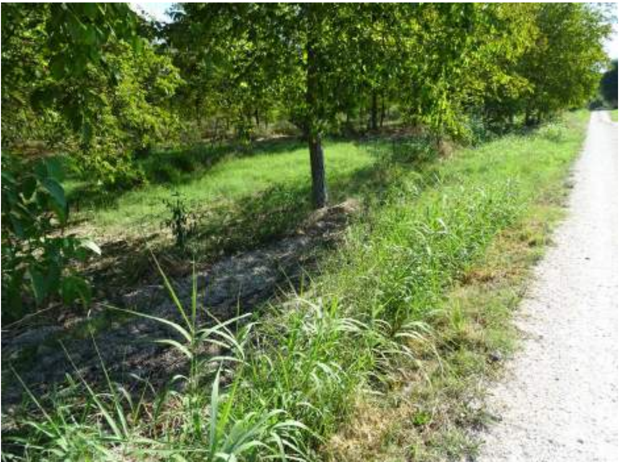
136. Via Chiocco