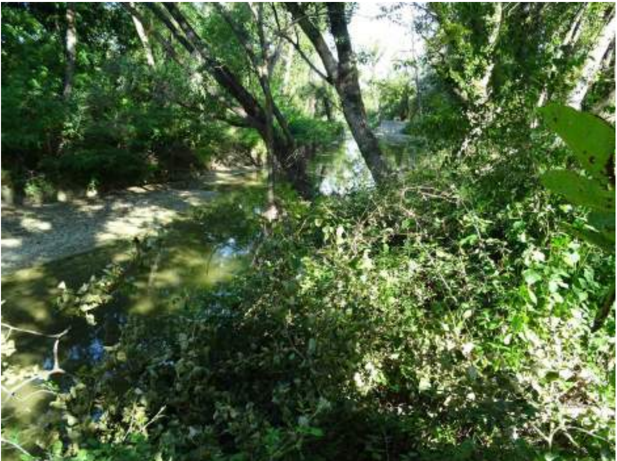
120. Fiume Misa