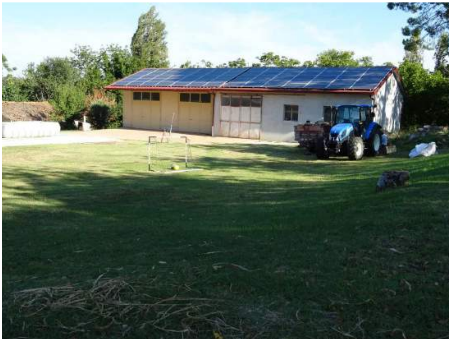
1. Vista generale anteriore, da via Chiocco

Documentazione fotografica dei 2 fabbricati agricoli in Serra de' Conti C.F. fg. 8 part. 1150 subb. 10 e 11 e della corte sub. 9 comune ai due precedenti subalterni (perimetro indicato in verde nella planimetria 1:2000)