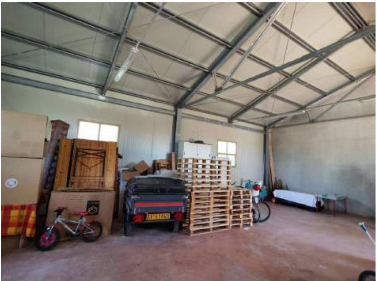
23. Interno, ancora altra vista