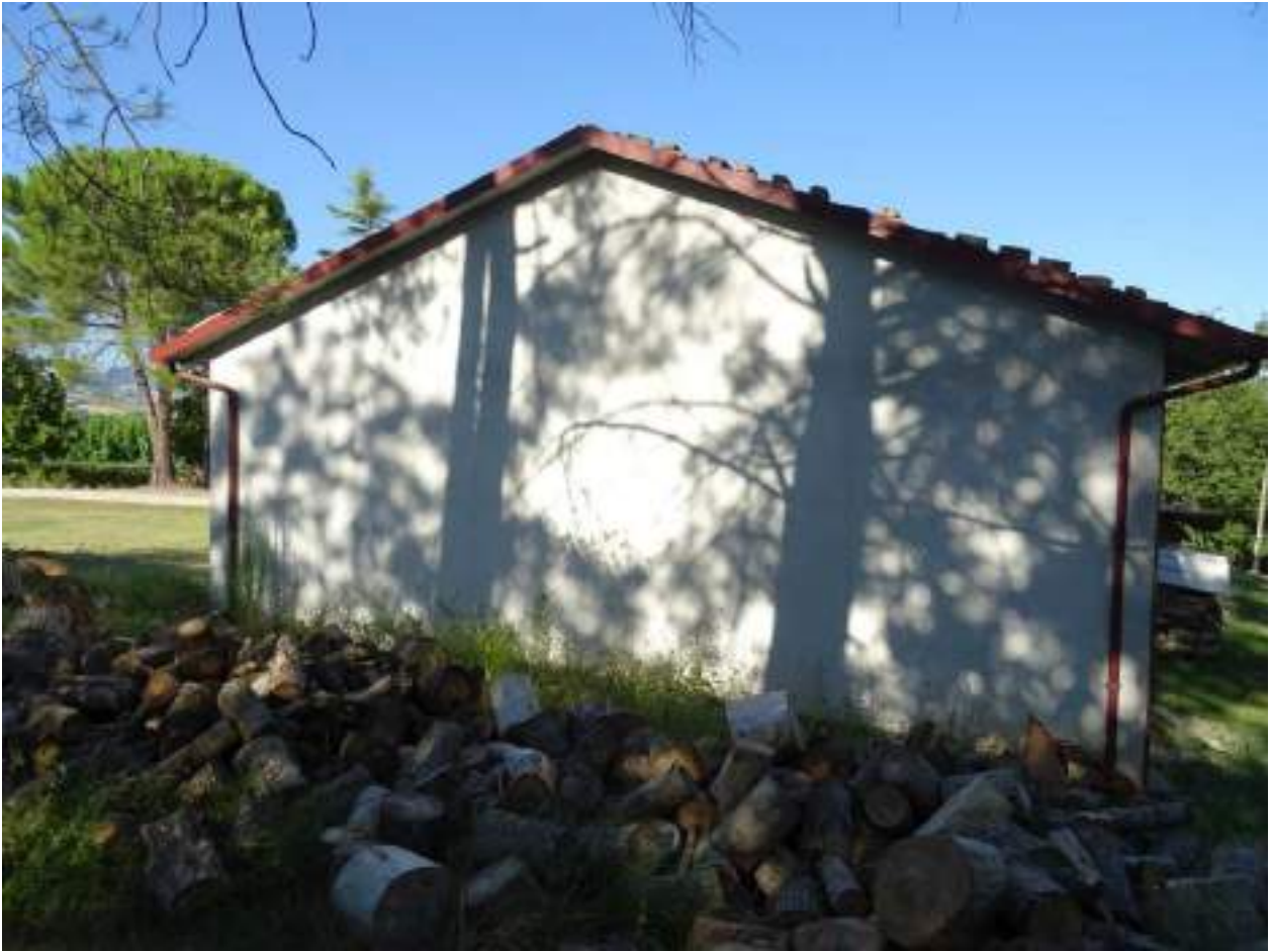
8. Prospetto laterale