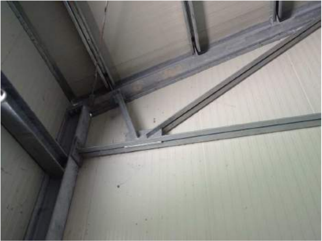
24. Struttura in acciaio e pannellature sandwich metalliche