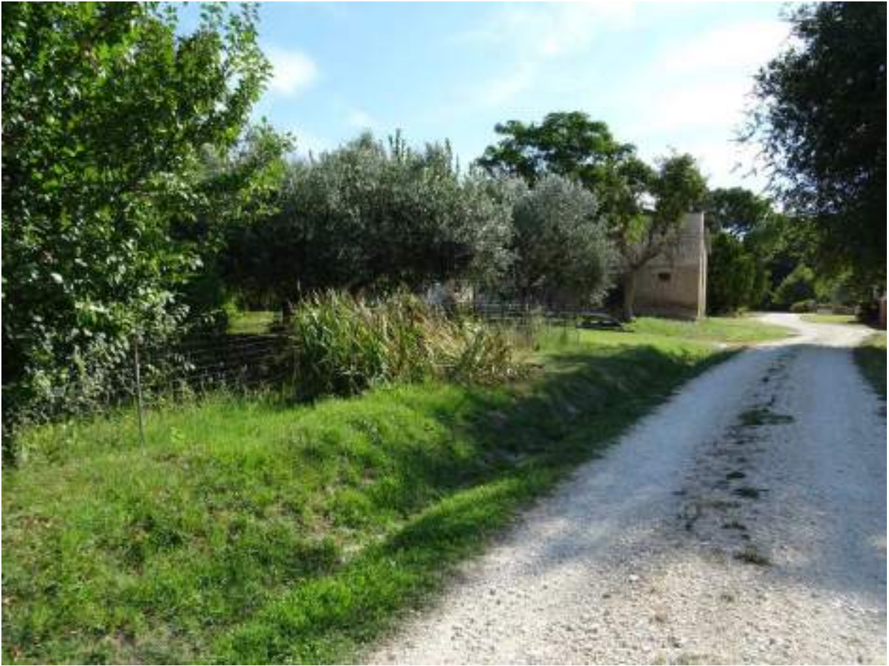
139. Ritorno al punto di partenza, in via Chiocco