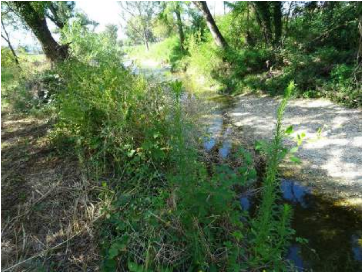
127. Fiume Misa