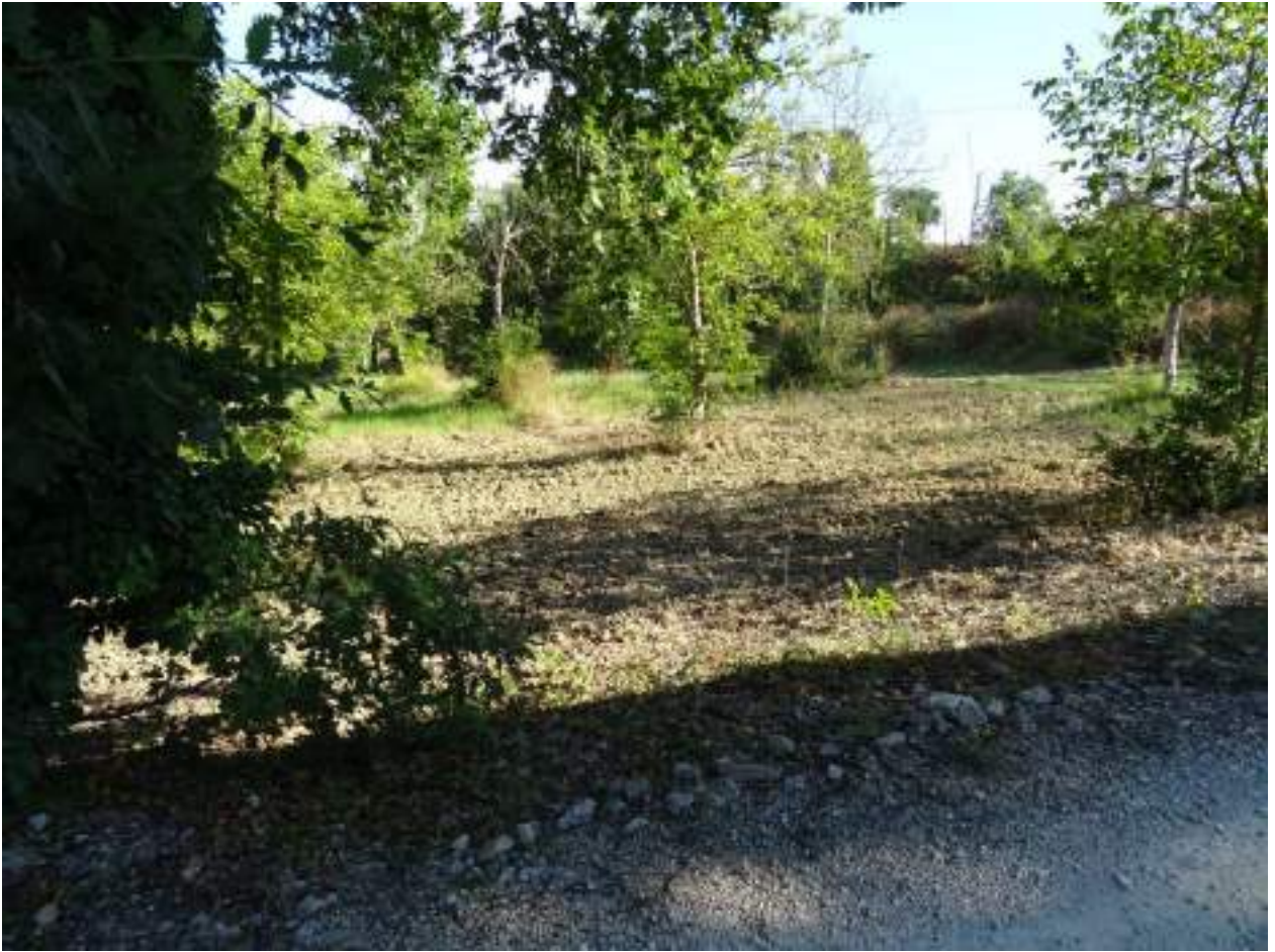
5. Via Chiocco