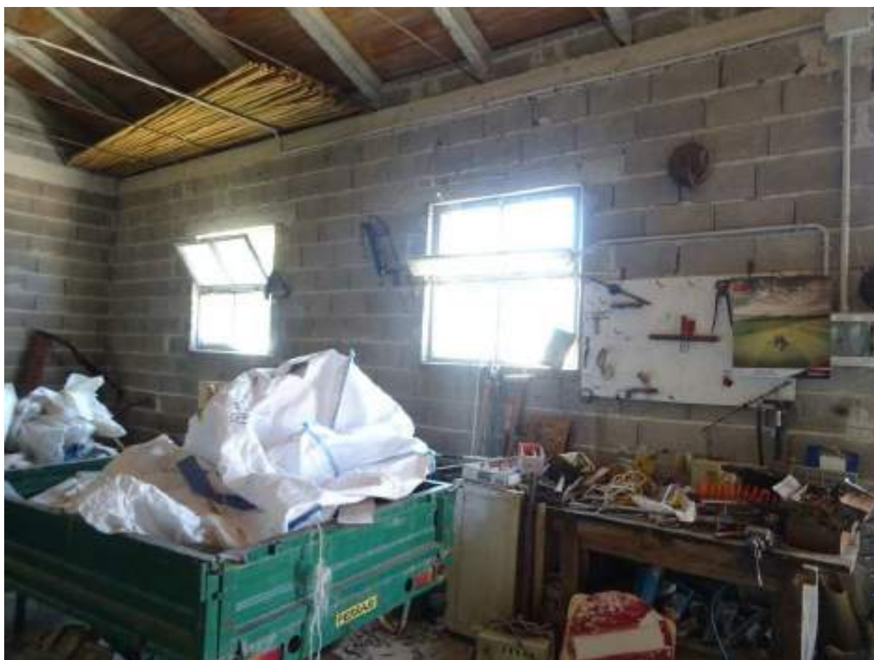
11. Interno, altra vista