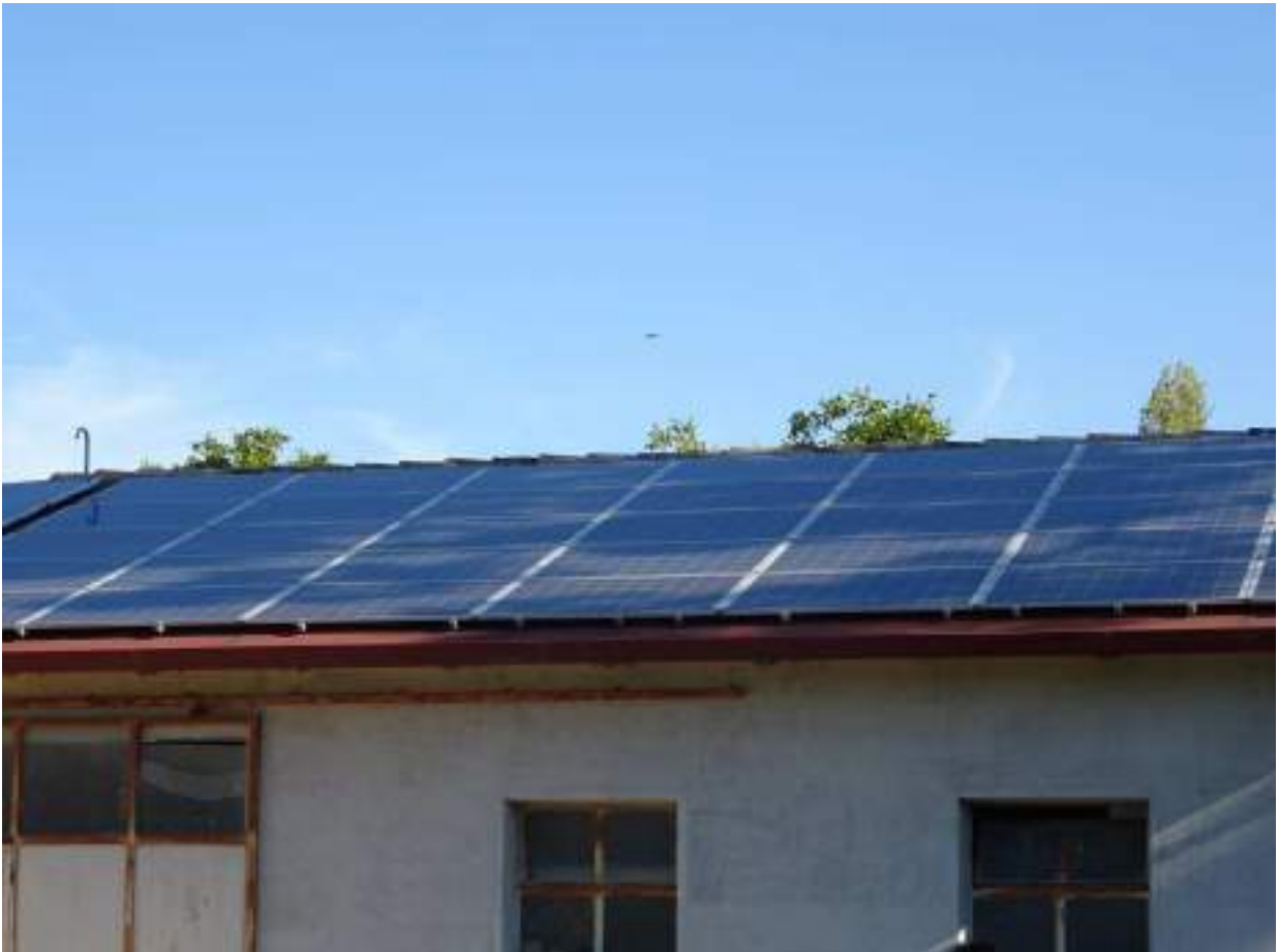
7. Particolare pannelli fotovoltaici