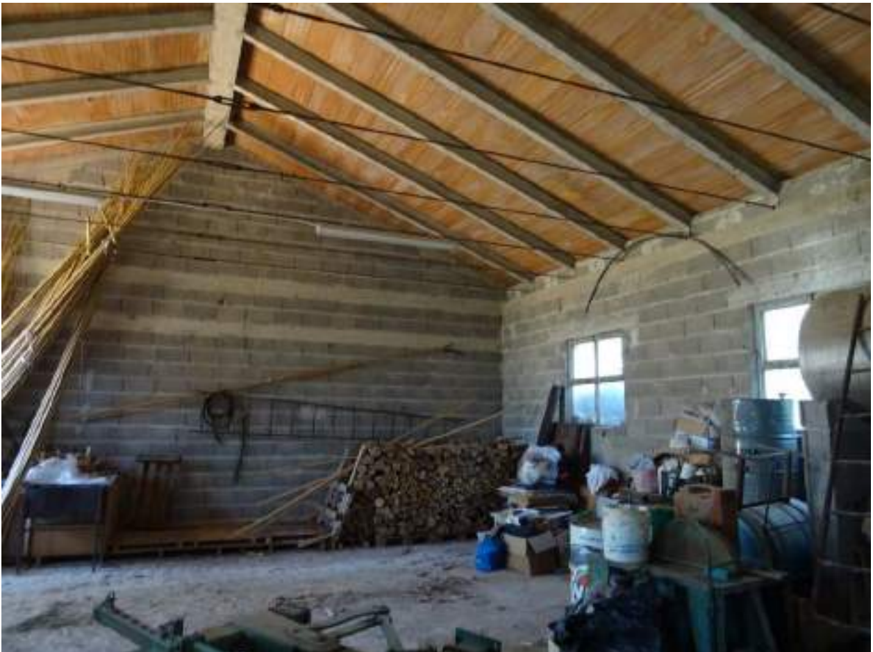
13. Interno, ancora altra vista