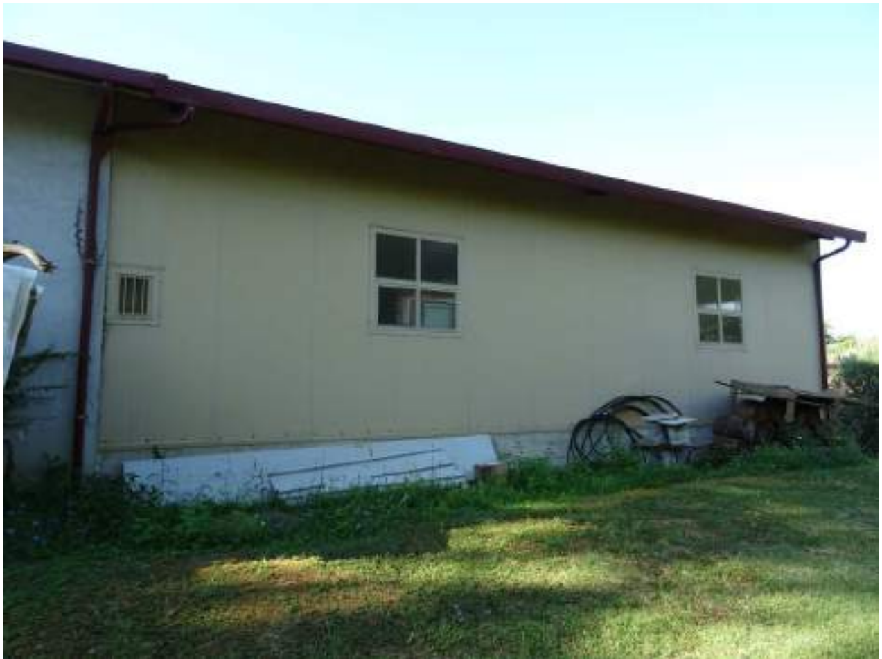
20. Prospetto posteriore