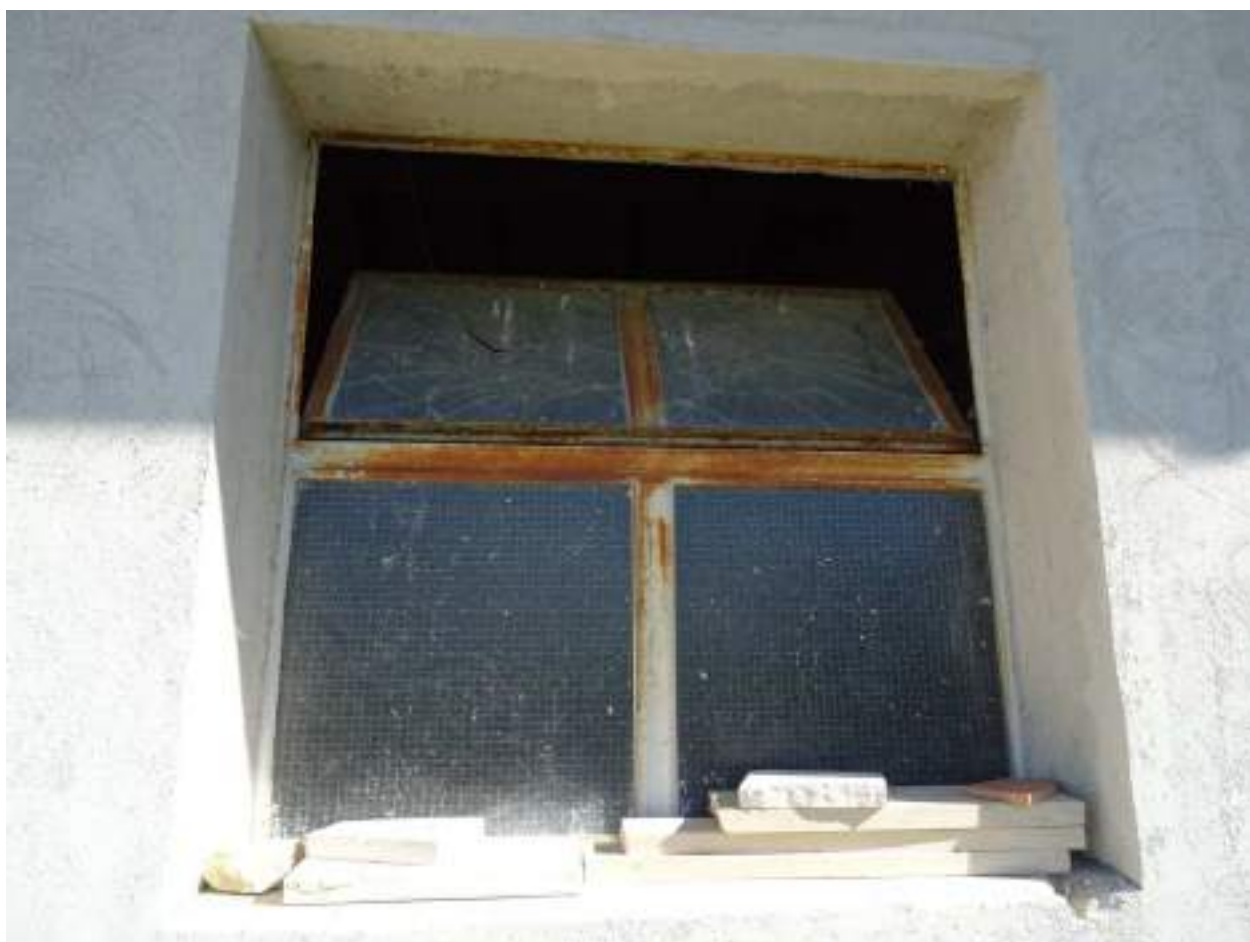
17. Infisso in ferro e vetro retinato