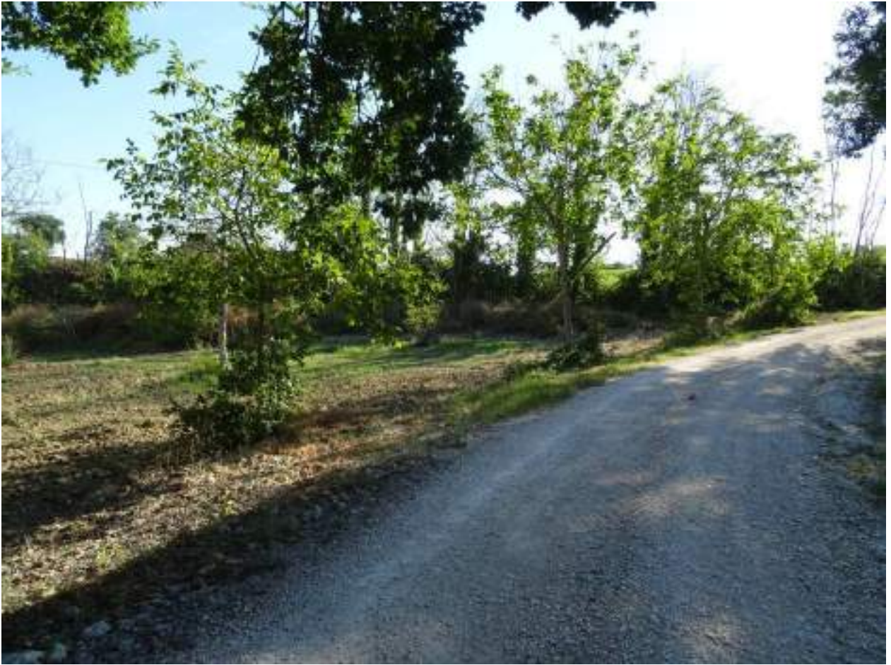
7. Via Chiocco