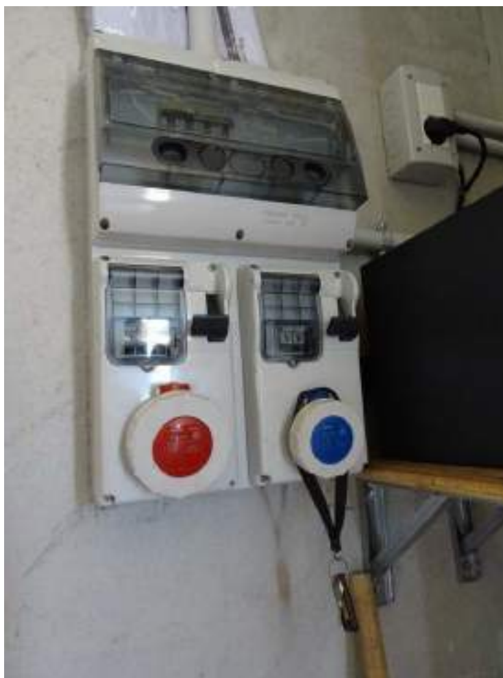
28. Quadro e prese elettriche