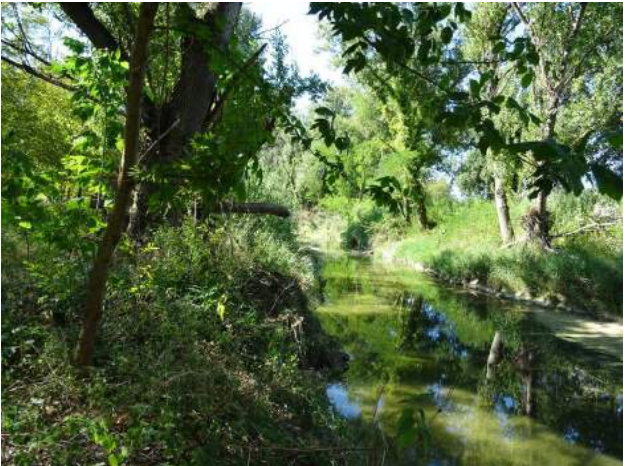
122. Fiume Misa