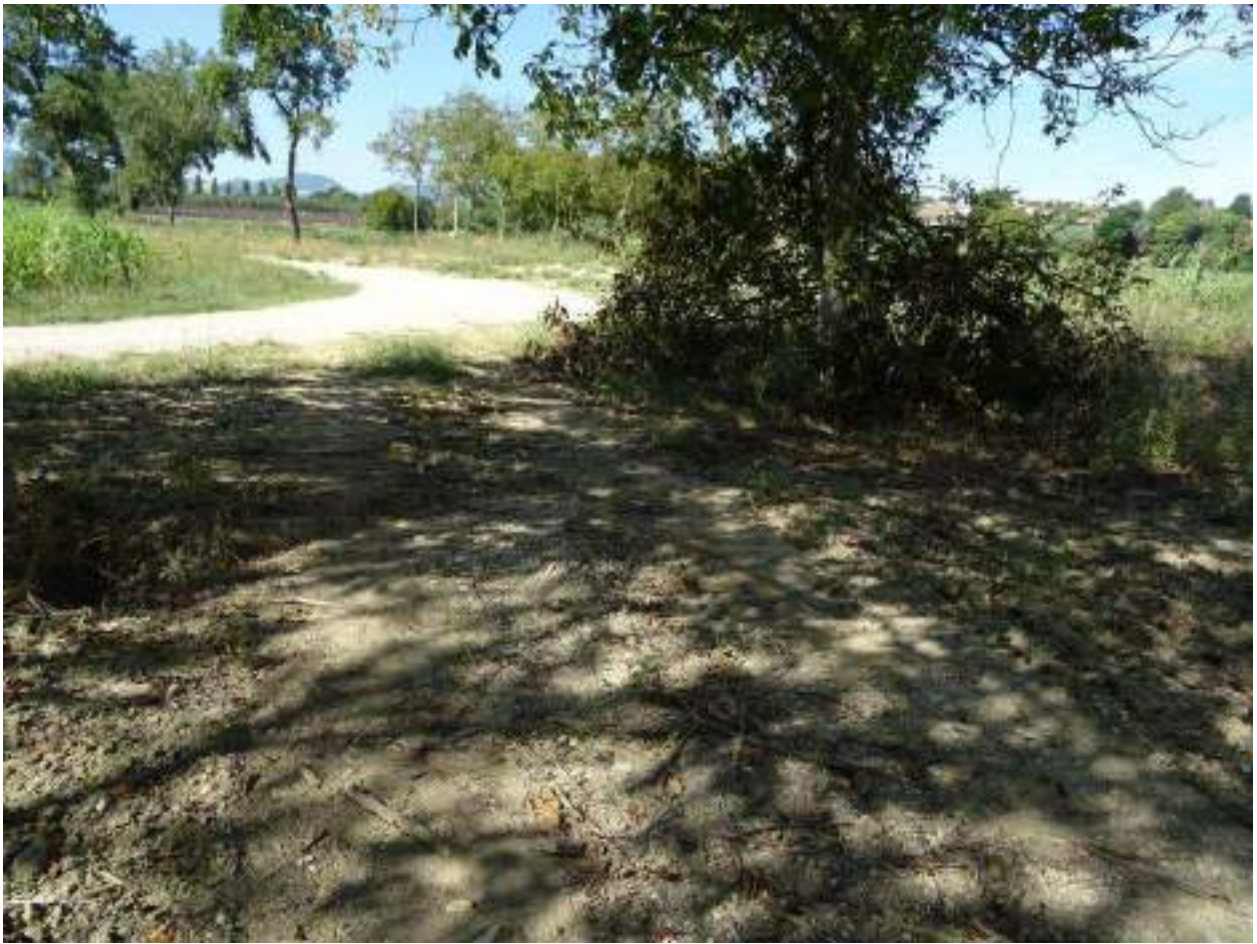
131. Via Chiocco