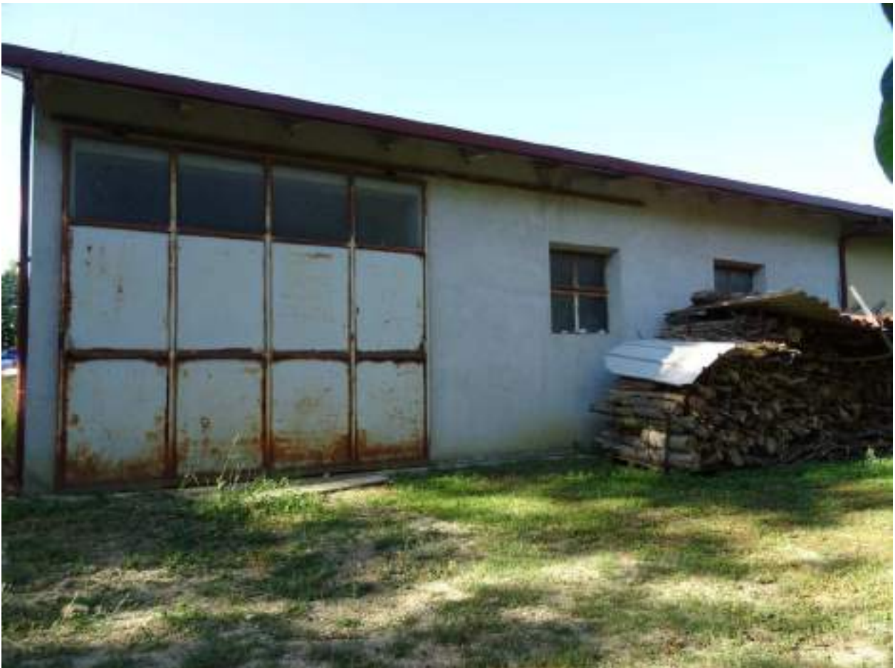
9. Prospetto posteriore