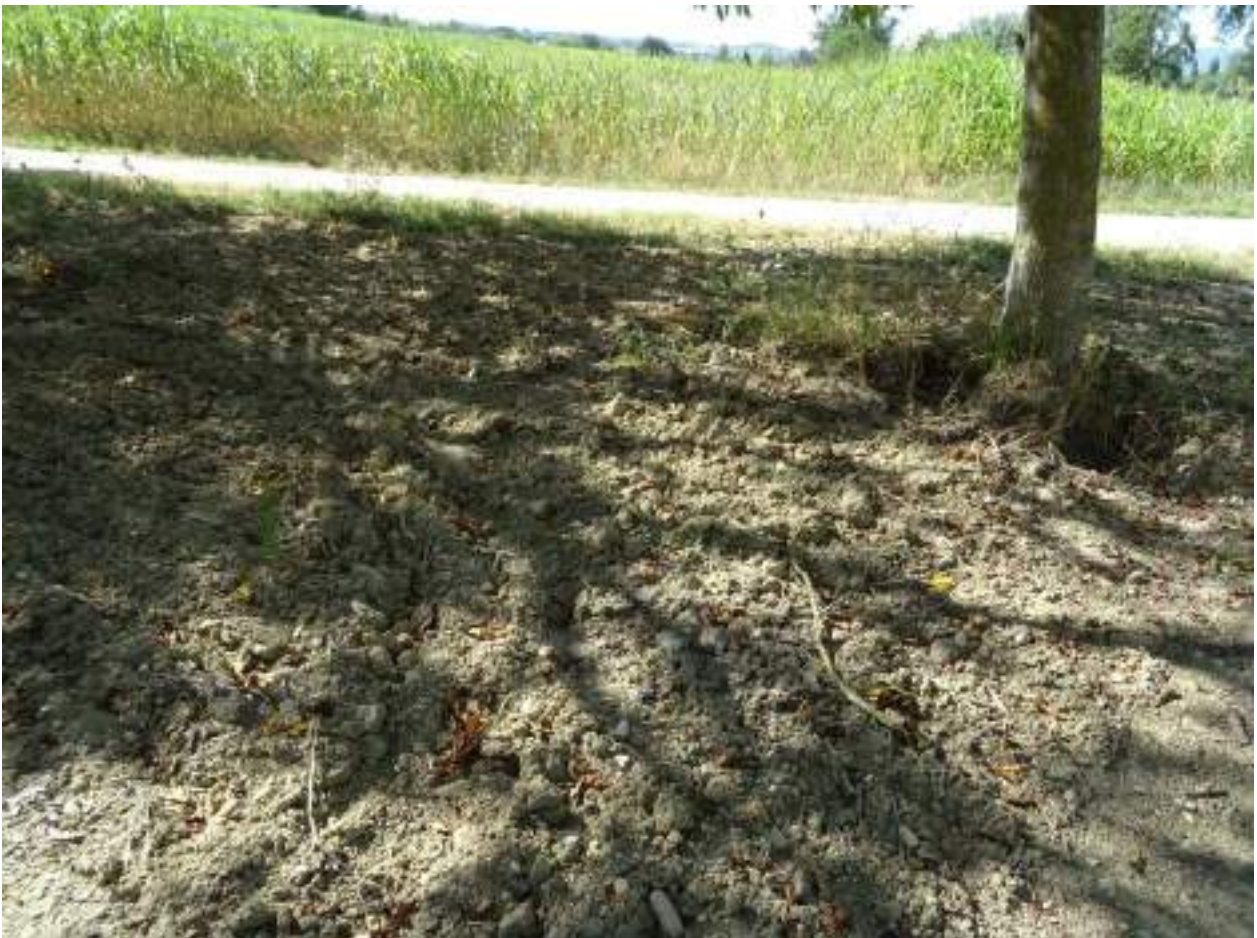
132. Via Chiocco