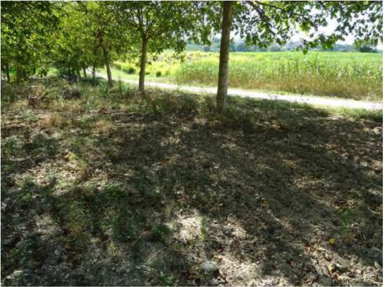
133. Via Chiocco