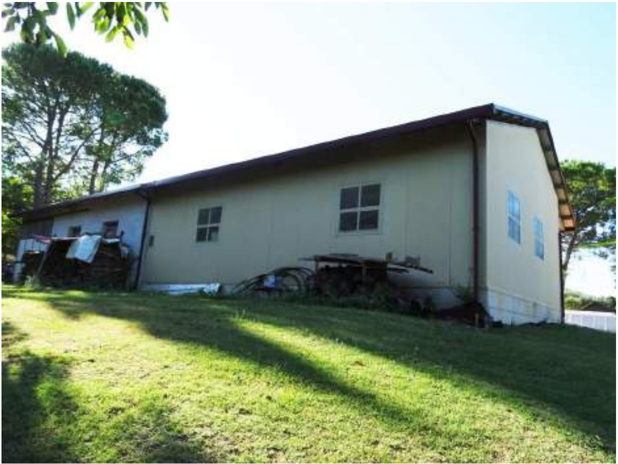
2. Vista generale posteriore