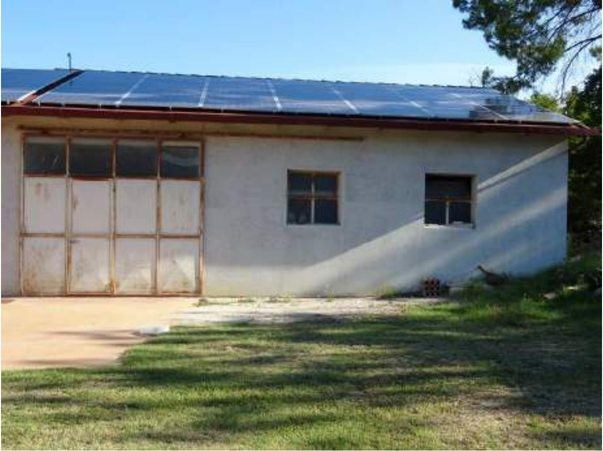
6. Prospetto frontale, da via Chiocco