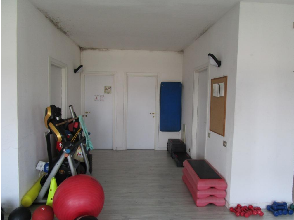
Foto 6 – Vista della sala “area funzionale” (porzione sub 745) verso i locali deposito e servizi igienici, ante rimozione delle attrezzature