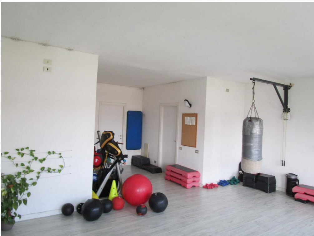
Foto 7 – Vista della sala “area funzionale” (porzione sub 745) verso i locali deposito e servizi igienici, ante rimozione delle attrezzature