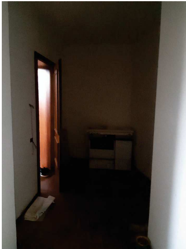
LOTTO 1: INGRESSO