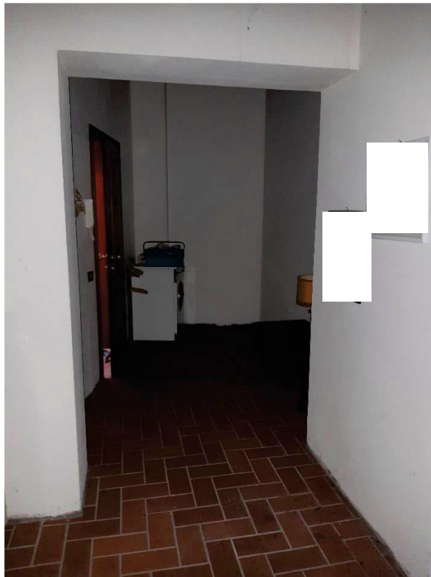
LOTTO 2 INGRESSO