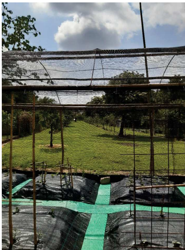
TERRENO FG 5 MAPP 414