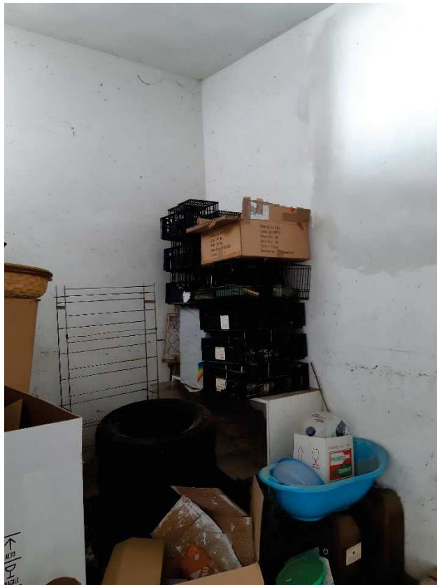
LOTTO 1 CANTINA