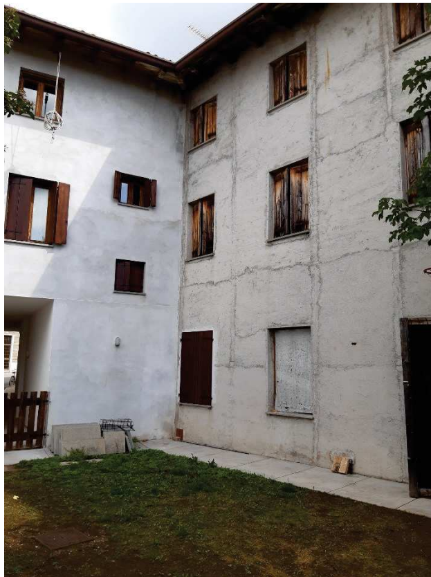
LATO OVEST SU CORTE COMUNE