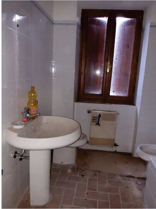
LOTTO 1 BAGNO