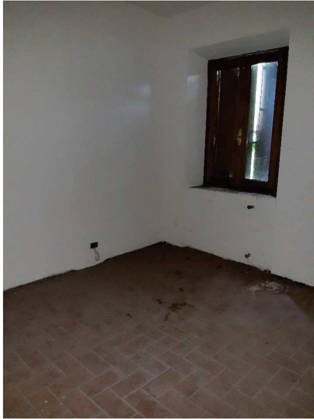
LOTTO 1 CAMERA