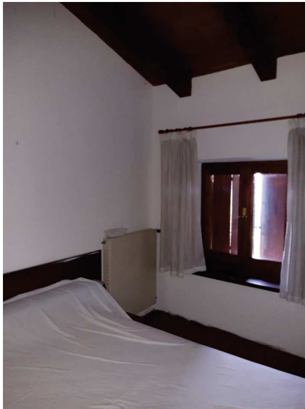
LOTTO 2 CAMERA