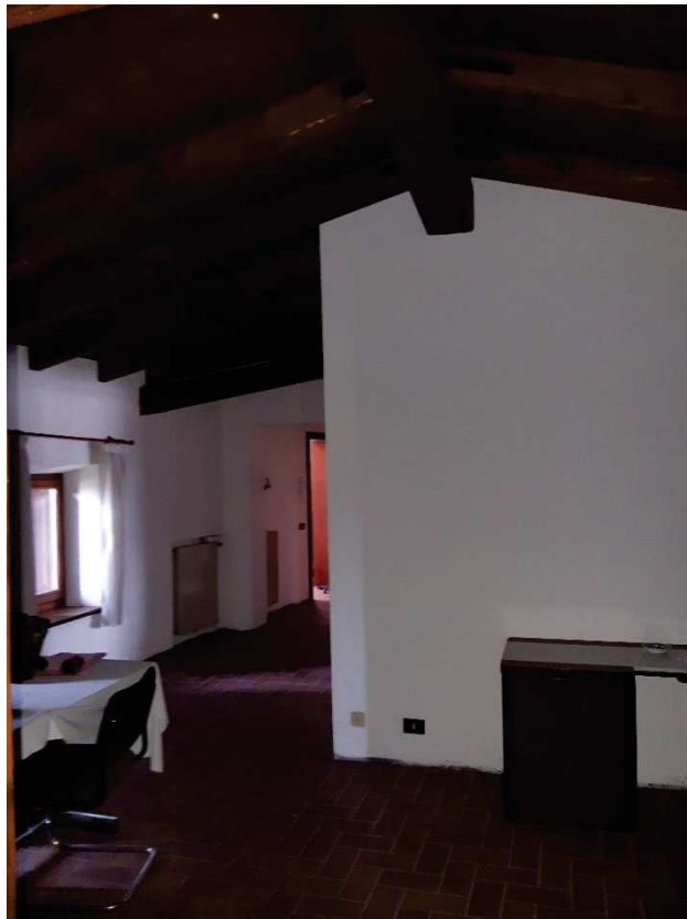
LOTTO 2 SOGGIORNO