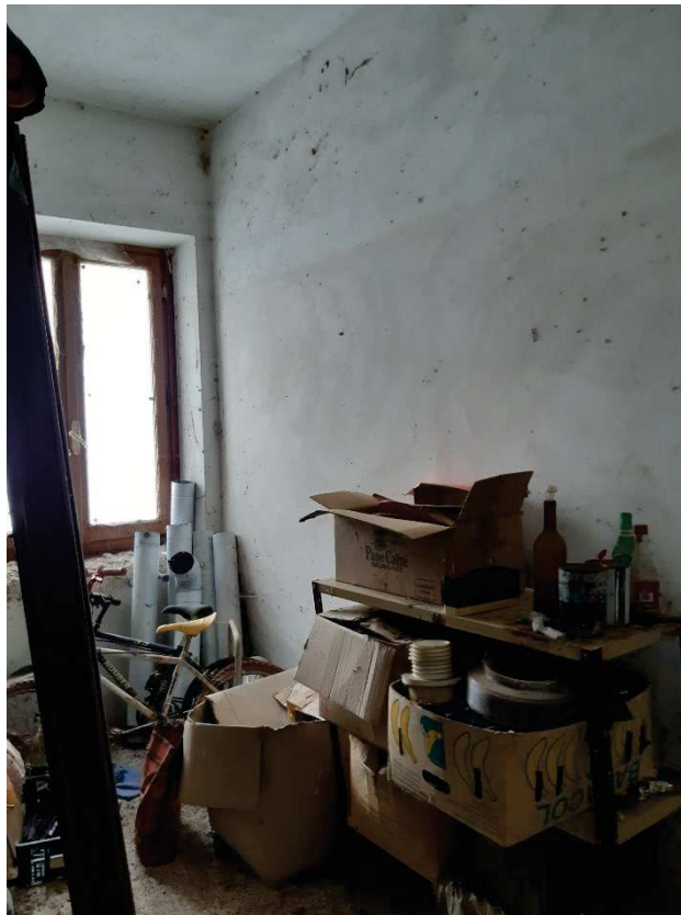
LOTTO 2 DEPOSITO