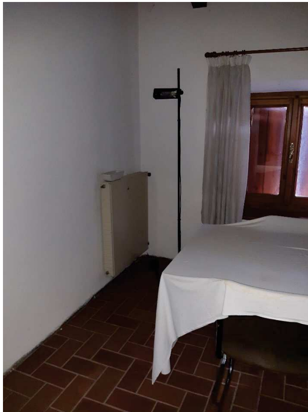
LOTTO 2 CAMERA