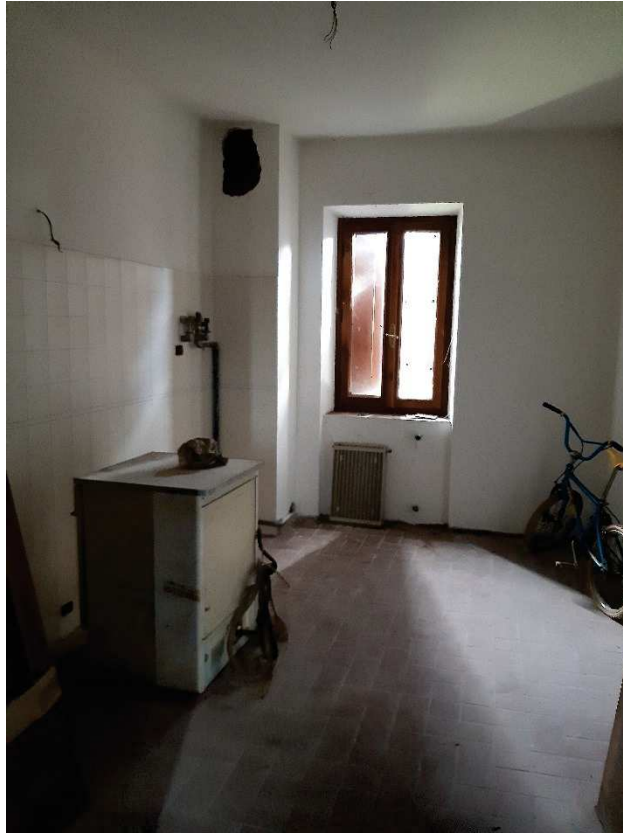
LOTTO 1 CUCINA