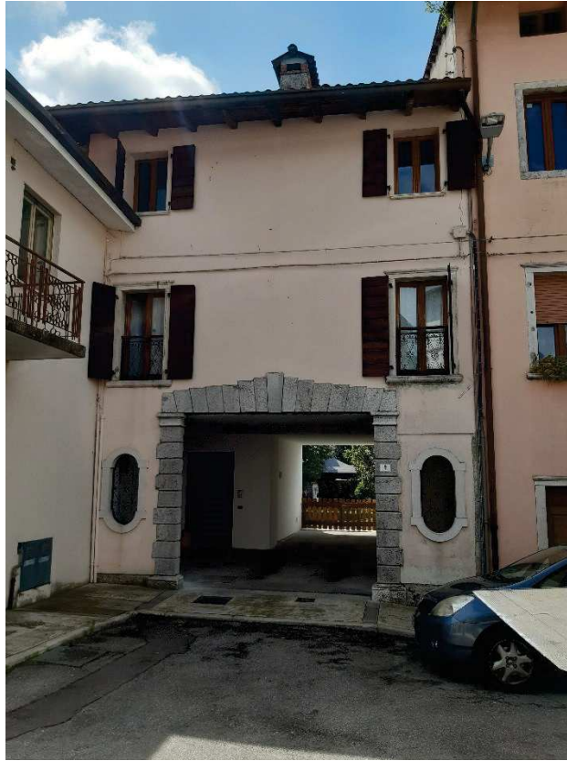
LATO NORD FRONTE STRADA