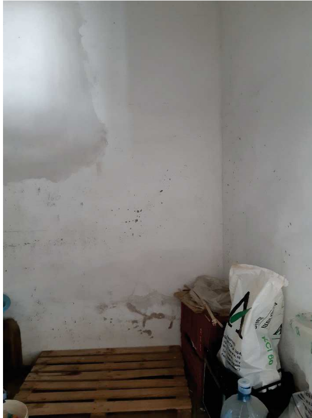
LOTTO 1 CANTINA