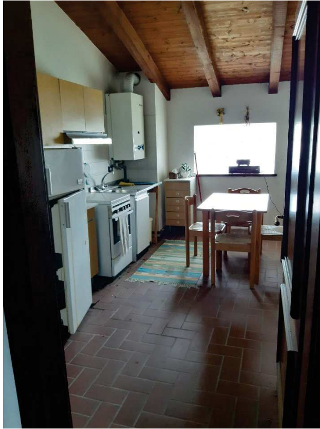
LOTTO 2 CUCINA