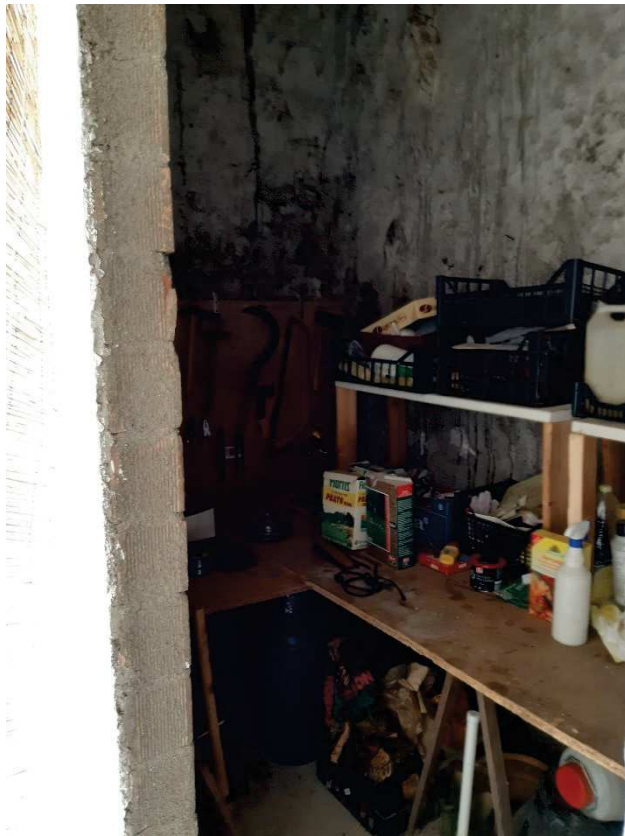
LOTTO 2 DEPOSITO