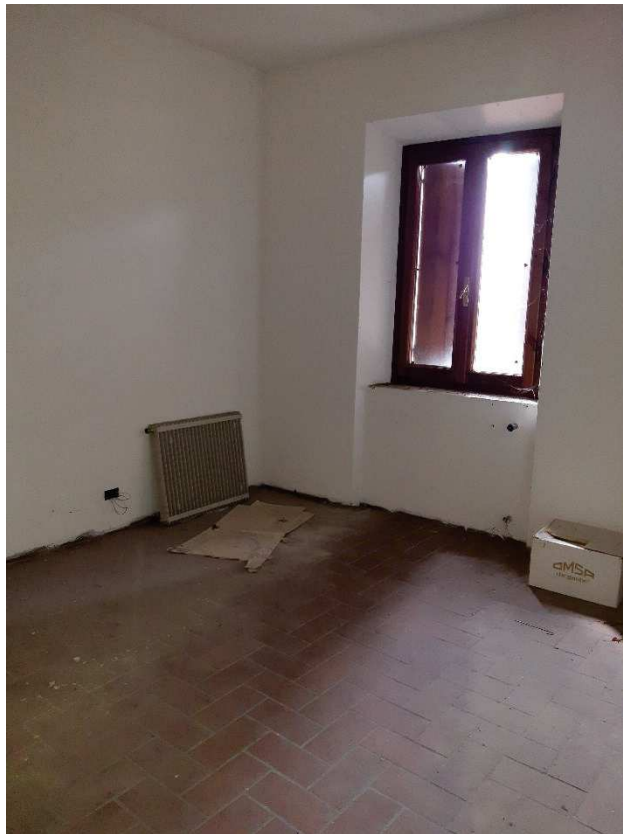
LOTTO 1 SOGGIORNO