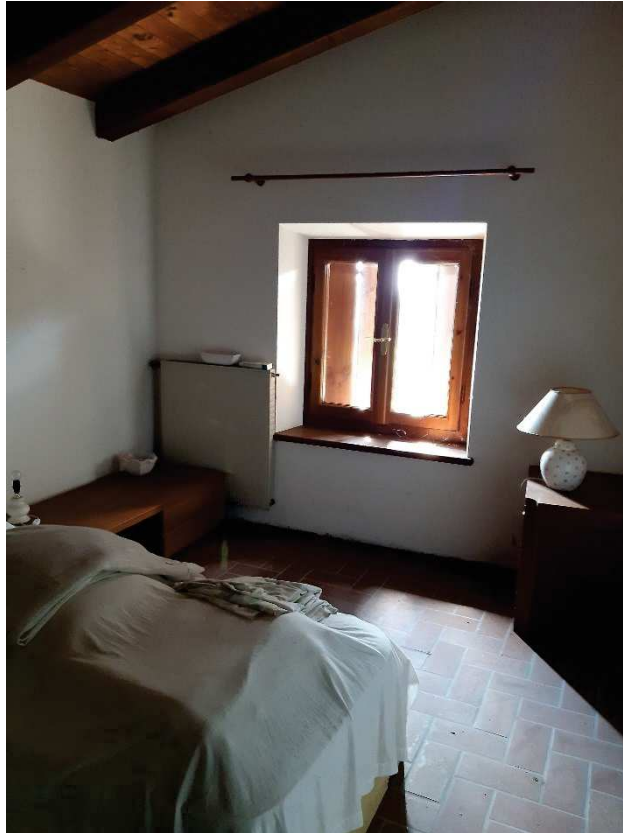
LOTTO 2 CAMERA