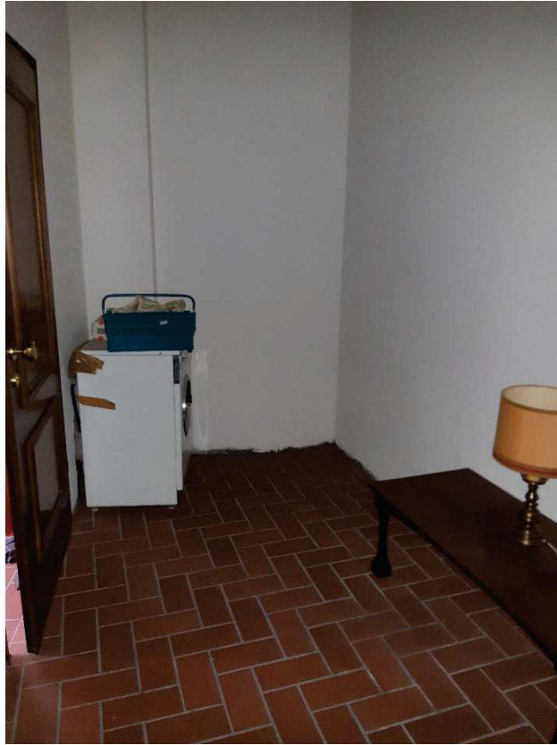
LOTTO 2 INGRESSO