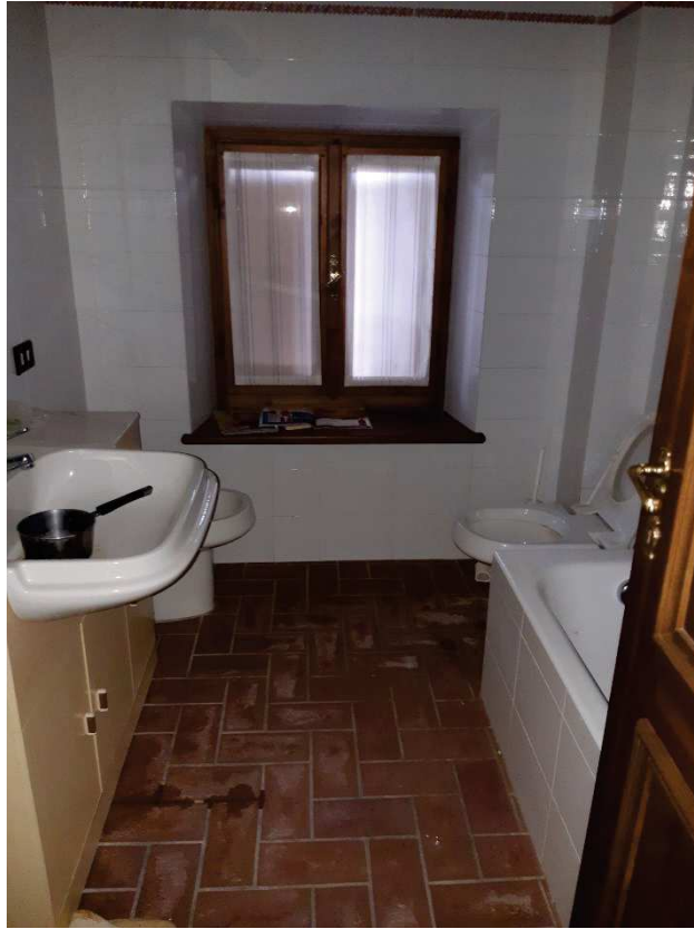
LOTTO 2 BAGNO