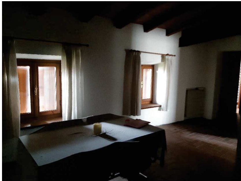
LOTTO 2 SOGGIORNO