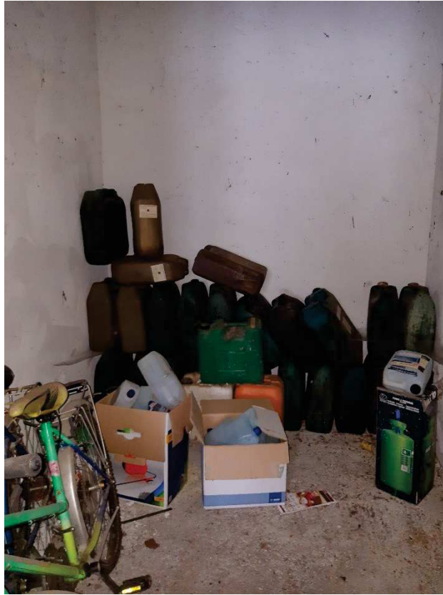
LOTTO 2 DEPOSITO