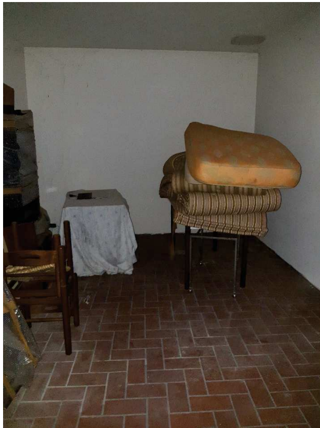
LOTTO 1 CAMERA