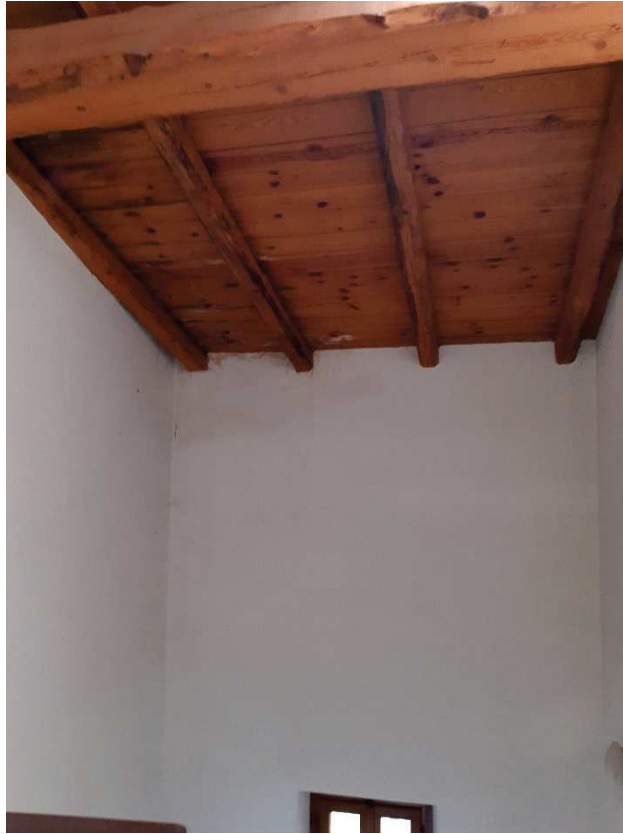
PARTICOLARE INFILTRAZIONI SU VANO SCALA COMUNE