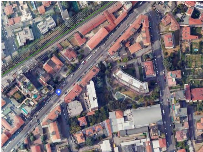
Inquadramento territoriale - vista dell'area e individuazione fabbricato e accesso