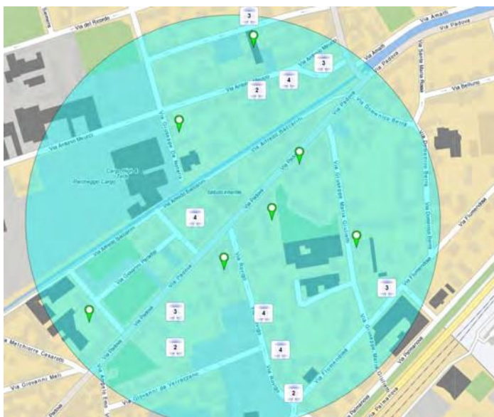
a cura dell'Agencia delle Entrate - vendite dichiarate: gennaio 2024 - giugno 2024