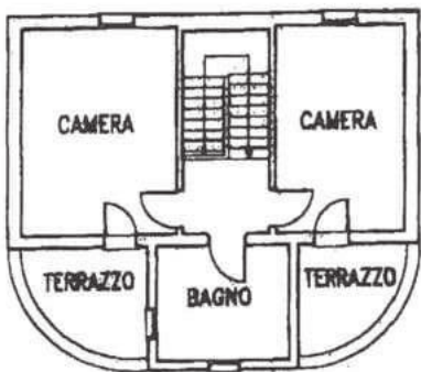
PIANTA PIANO PRIMO H= 3.05 SCALA 1:200

PLANIMETRIA scala 1:2000 FOGLIO 22 MAP. 1081