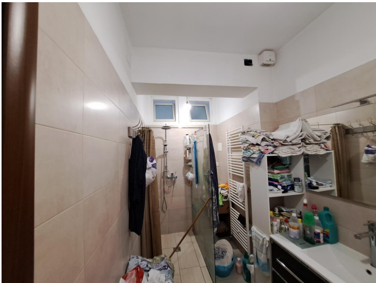
Foto n° 10 – Lotto 1 - Comune di Pinzano al Tagliamento (PN) – Località Valeriano - Foglio 12 m.le 610 sub 4 – Veduta della porzione nord del bagno al piano terra.