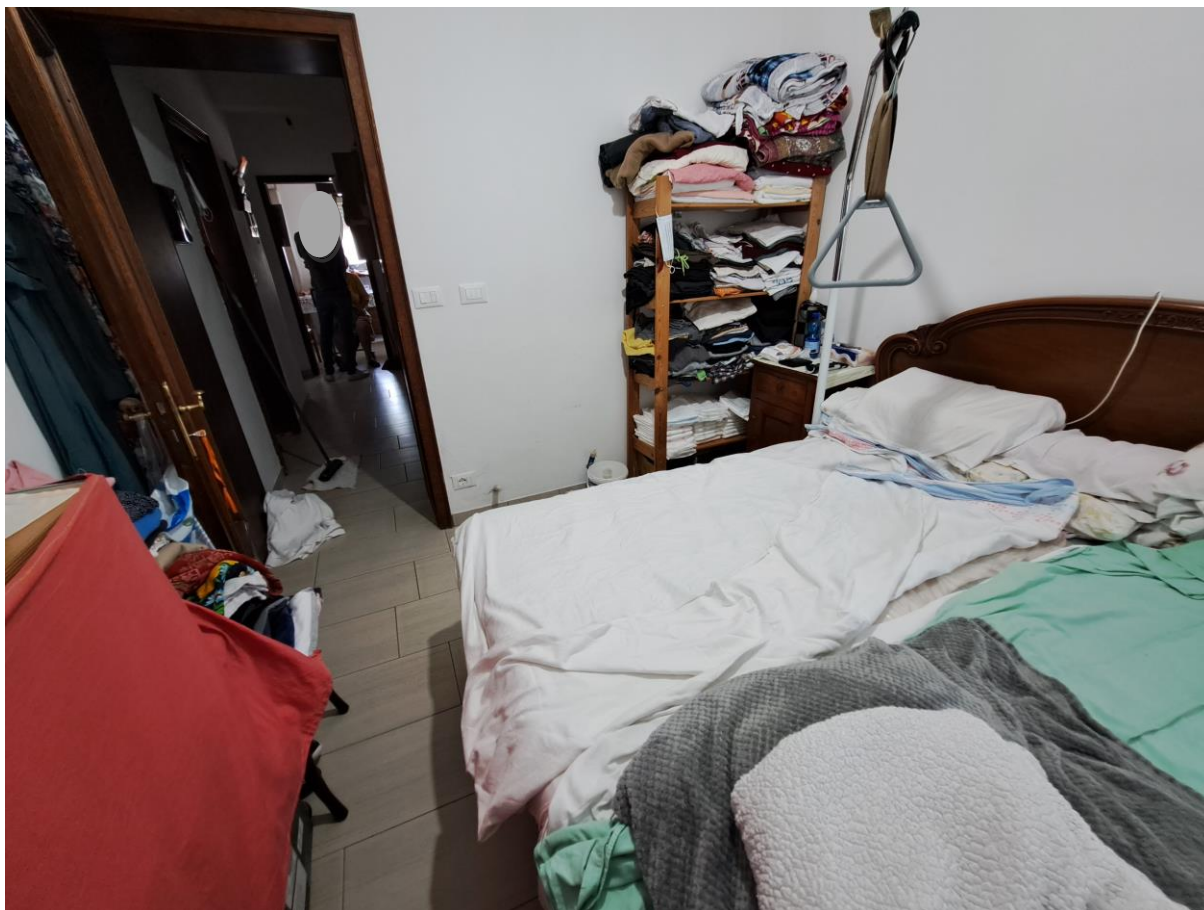
Foto n° 13 – Lotto 1 - Comune di Pinzano al Tagliamento (PN) – Località Valeriano - Foglio 12 m.le 610 sub 4 – Veduta interna, da posizione sud, della camera di cui alla foto precedente.