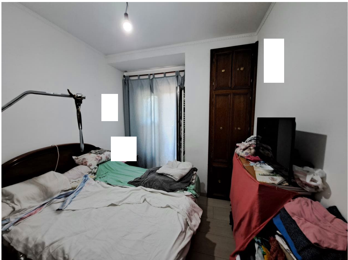
Foto n° 12 - Lotto 1 - Comune di Pinzano al Tagliamento (PN) - Località Valeriano - Foglio 12 m.le 610 sub 4 - Veduta, da posizione nord e dal disimpegno, della camera al piano terra.