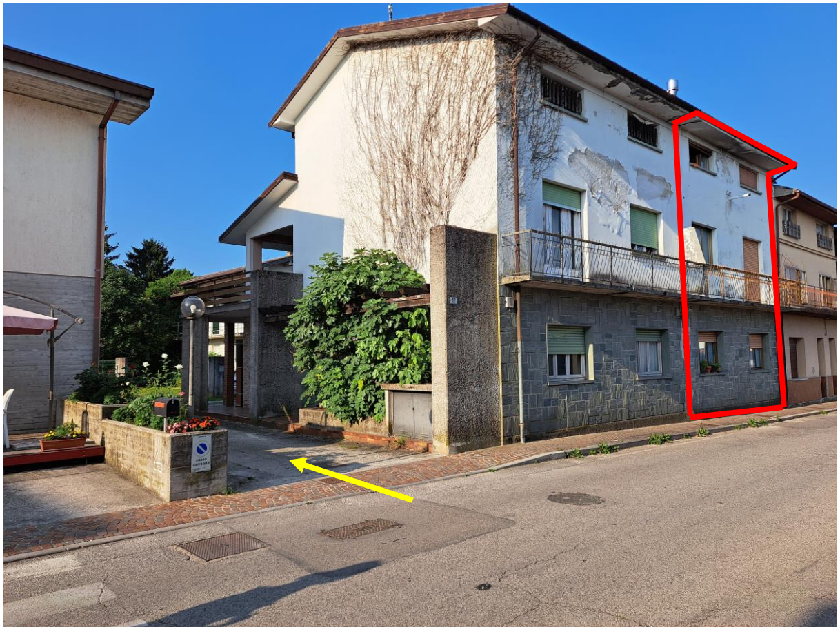
Foto n° 1 – Lotto 1 - Comune di Pinzano al Tagliamento (PN) – Località Valeriano - Foglio 12 m.le 610 sub 4 – Veduta generale, da Via Roma, del fabbricato in linea con evidenziata la porzione pignorata di cui alla presente E.I. L'accesso all'immobile avviene dalla strada laterale di Via Roma (indicata da freccia gialla).