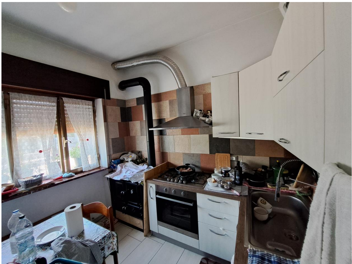
Foto n° 16 – Lotto 1 - Comune di Pinzano al Tagliamento (PN) – Località Valeriano - Foglio 12 m.le 610 sub 4 – Veduta della porzione nord-est del locale ad uso cucina al piano terra, collegato al soggiorno-pranzo di cui alla foto precedente.