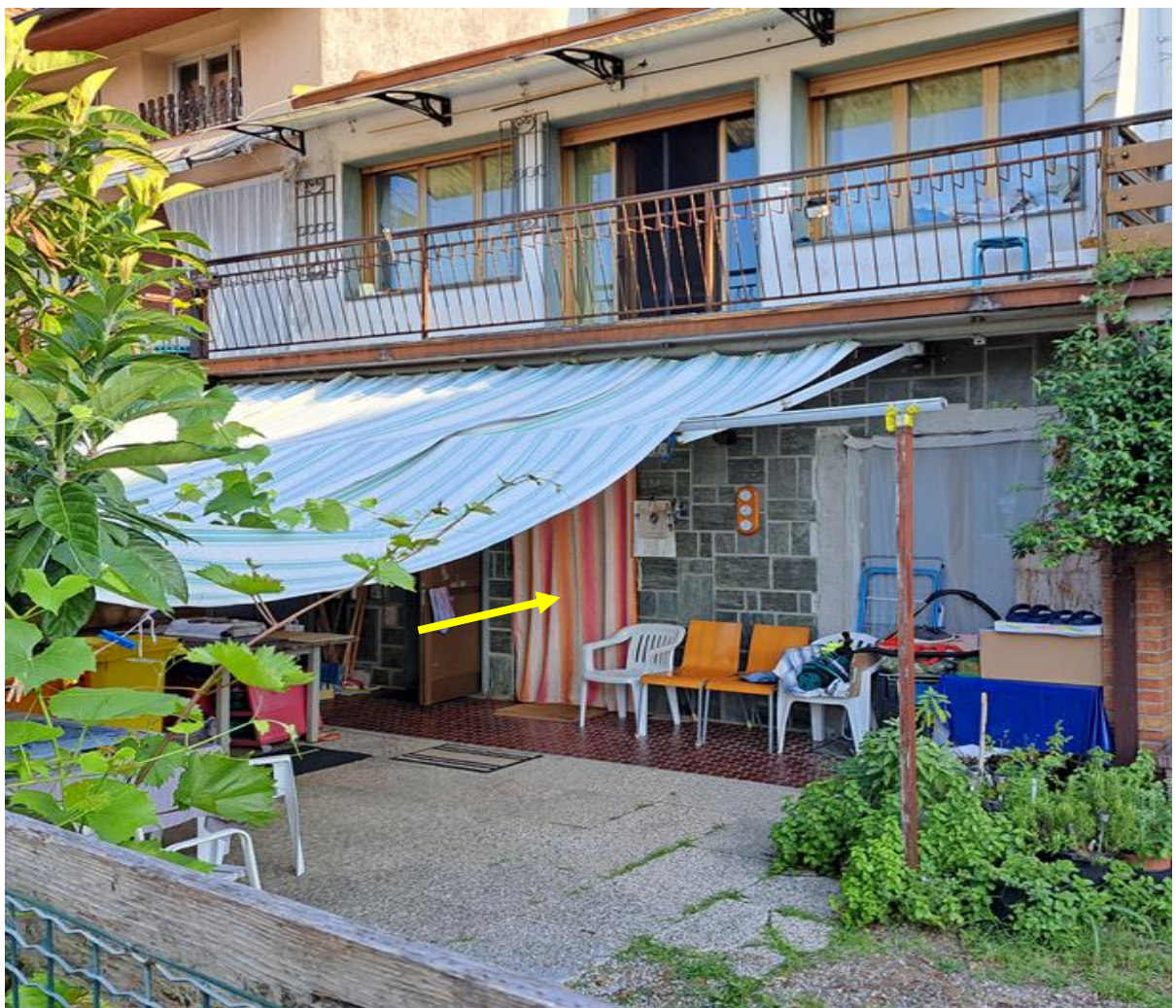
Foto n° 4 – Lotto 1 - Comune di Pinzano al Tagliamento (PN) – Località Valeriano - Foglio 12 m.le 610 sub 4 – Veduta dell'accesso principale al piano terra dell'abitazione.