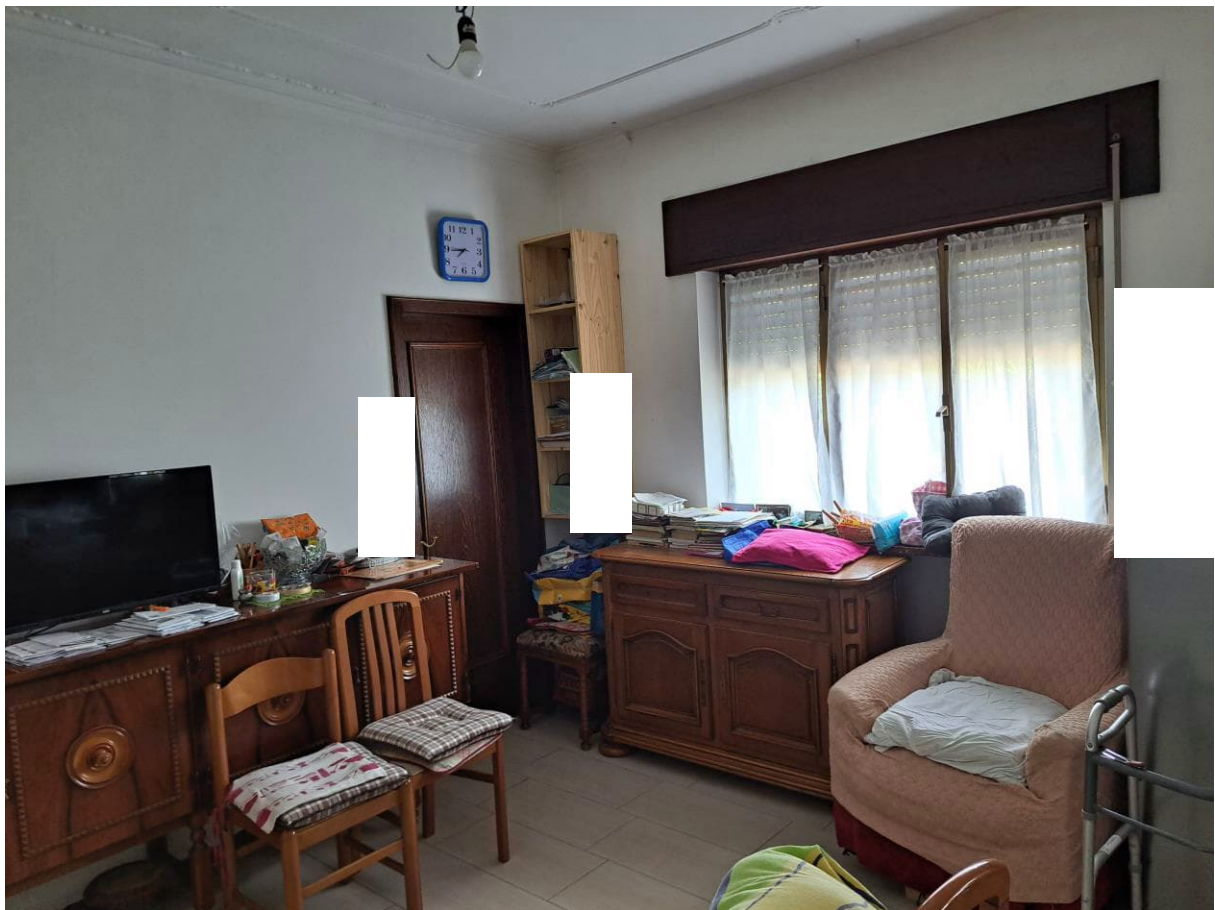
Foto n° 15 – Lotto 1 - Comune di Pinzano al Tagliamento (PN) – Località Valeriano - Foglio 12 m.le 610 sub 4 – Veduta della porzione nord-ovest del locale soggiorno-pranzo al piano terra.