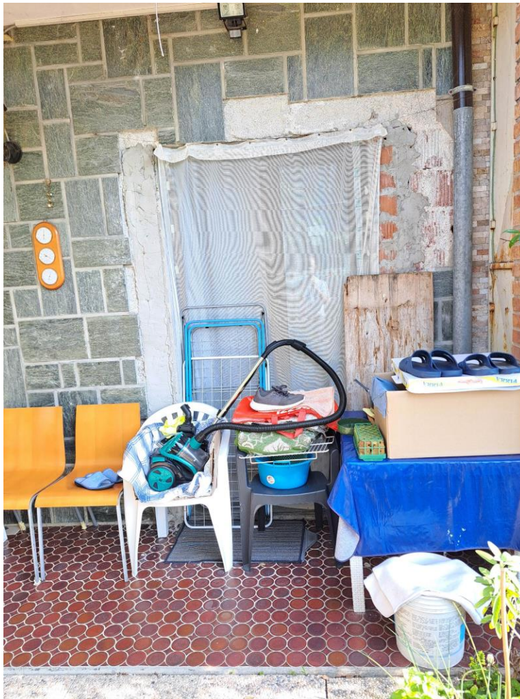
Foto n° 5 - Lotto 1 - Comune di Pinzano al Tagliamento (PN) - Località Valeriano - Foglio 12 m.le 610 sub 4 - Veduta, dall'area di pertinenza, di porzione sud-est del fabbricato al piano terra. Al centro l'originaria finestra della camera, poi modificata in porta.