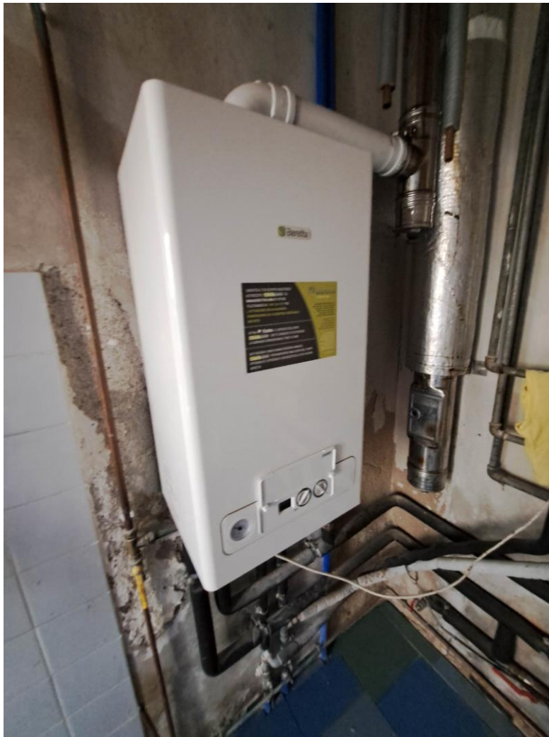
Foto n° 7 – Lotto 1 - Comune di Pinzano al Tagliamento (PN) – Località Valeriano - Foglio 12 m.le 610 sub 4 – Particolare della caldaia a gas metano presente nel locale centrale termica.