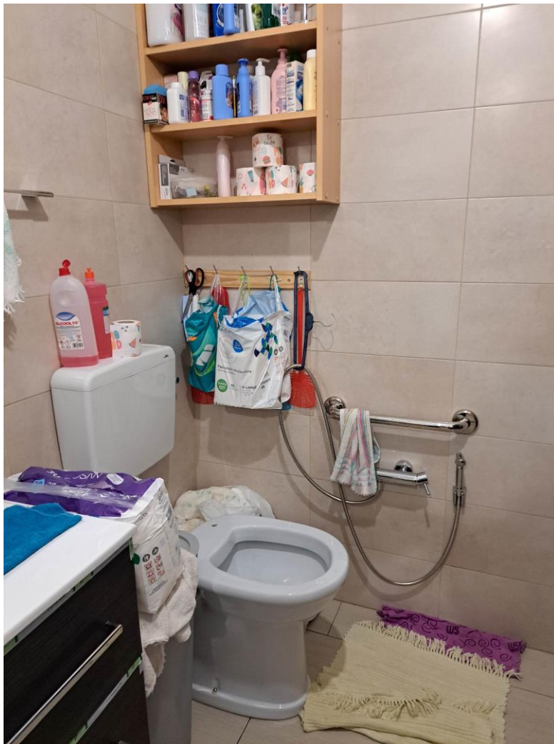
Foto n° 11 - Lotto 1 - Comune di Pinzano al Tagliamento (PN) - Località Valeriano - Foglio 12 m.le 610 sub 4 - Particolare della porzione sud-est del bagno di cui alla foto precedente.