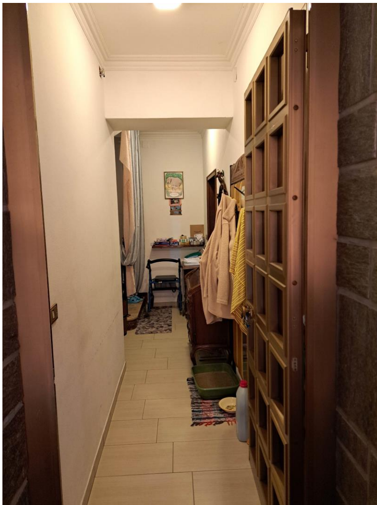
Foto n° 8 – Lotto 1 - Comune di Pinzano al Tagliamento (PN) – Località Valeriano - Foglio 12 m.le 610 sub 4 – Veduta, da posizione sud e dall'entrata, del corridoio di ingresso dell'abitazione al piano terra.