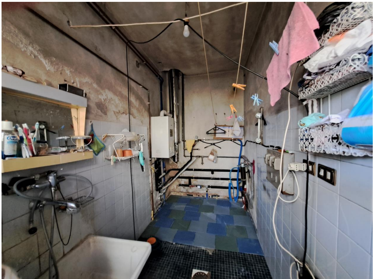
Foto n° 6 - Lotto 1 - Comune di Pinzano al Tagliamento (PN) - Località Valeriano - Foglio 12 m.le 610 sub 4 - Veduta interna del vano uso centrale termica.