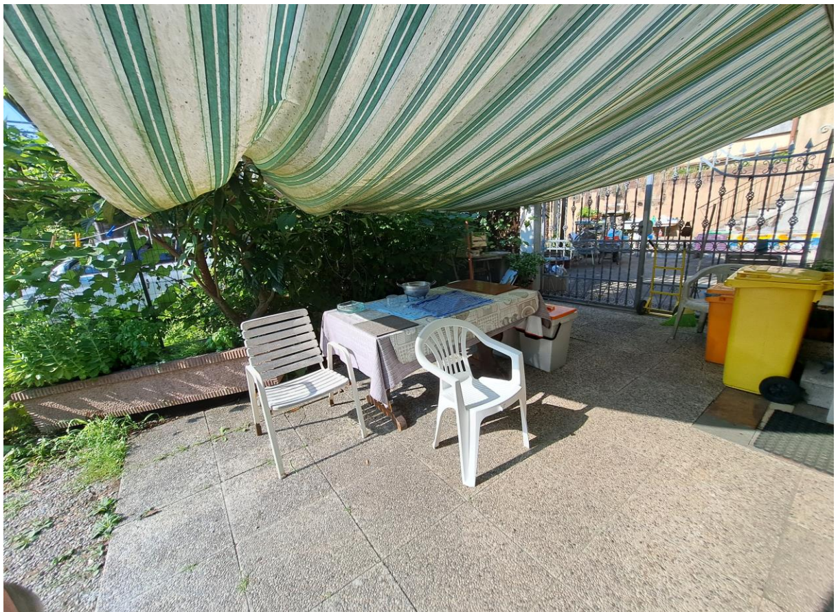
Foto n° 3 – Lotto 1 - Comune di Pinzano al Tagliamento (PN) – Località Valeriano - Foglio 12 m.le 610 sub 4 – Particolare della porzione sud-ovest della piccola area esterna di pertinenza del fabbricato.