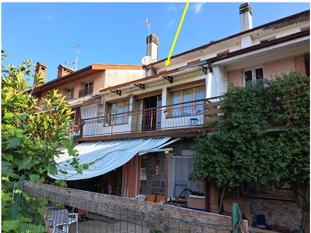
Foto n° 2 – Lotto 1 - Comune di Pinzano al Tagliamento (PN) – Località Valeriano - Foglio 12 m.le 610 sub 4 – Particolare del fronte sud del fabbricato esecutato, posto su tre piani; in primo piano l'area esterna di pertinenza, alla quale si accede passando attraverso l'area di altrui proprietà.