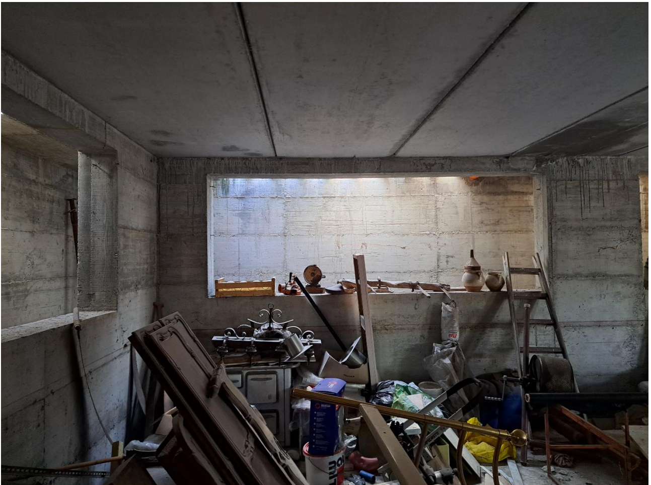
Foto n° 38 Lotto 2 - 17/07/2023 – Comune di Pinzano al Tagliamento (PN) – Località Valeriano - Foglio 12 m.le 2033 sub 6 – Piano interrato: veduta di porzione nord est dello stesso locale.