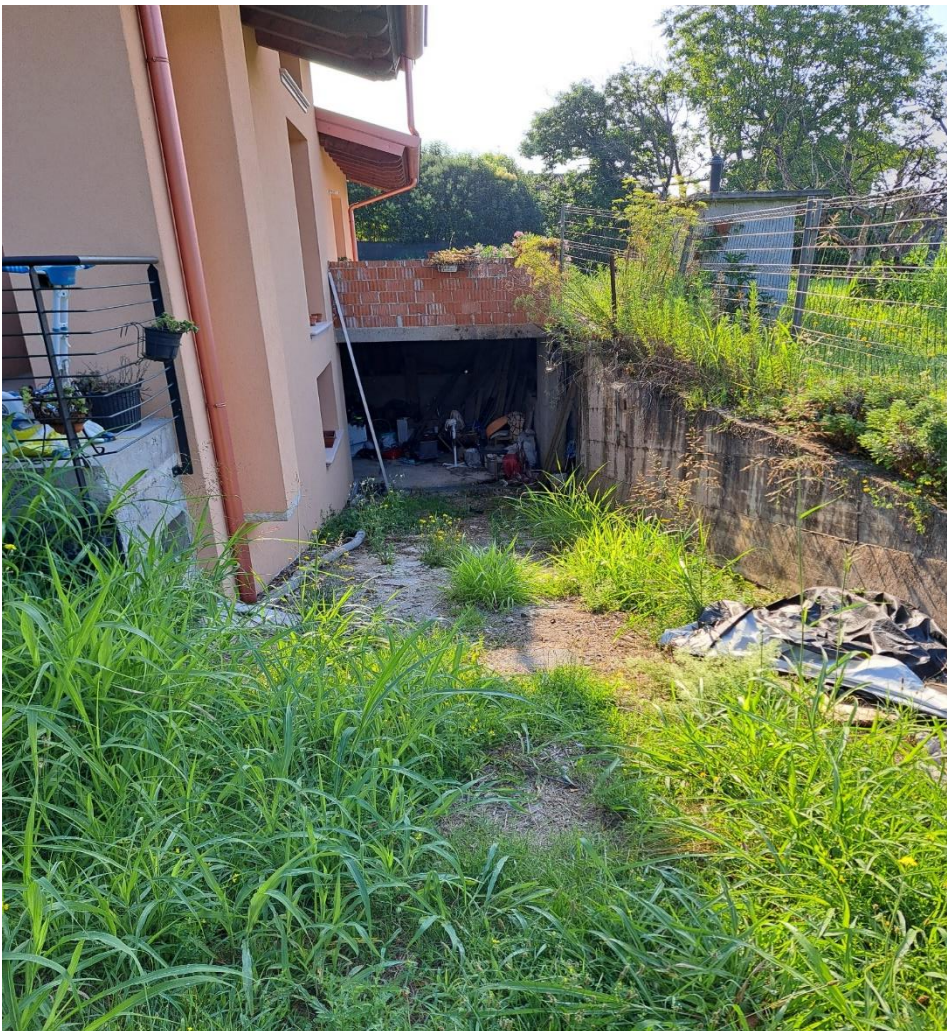
Foto n° 34 Lotto 2 - 17/07/2023 – Comune di Pinzano al Tagliamento (PN) – Località Valeriano - Foglio 12 m.le 2033: veduta della rampa d'accesso al portico e all'autorimessa del piano interrato.