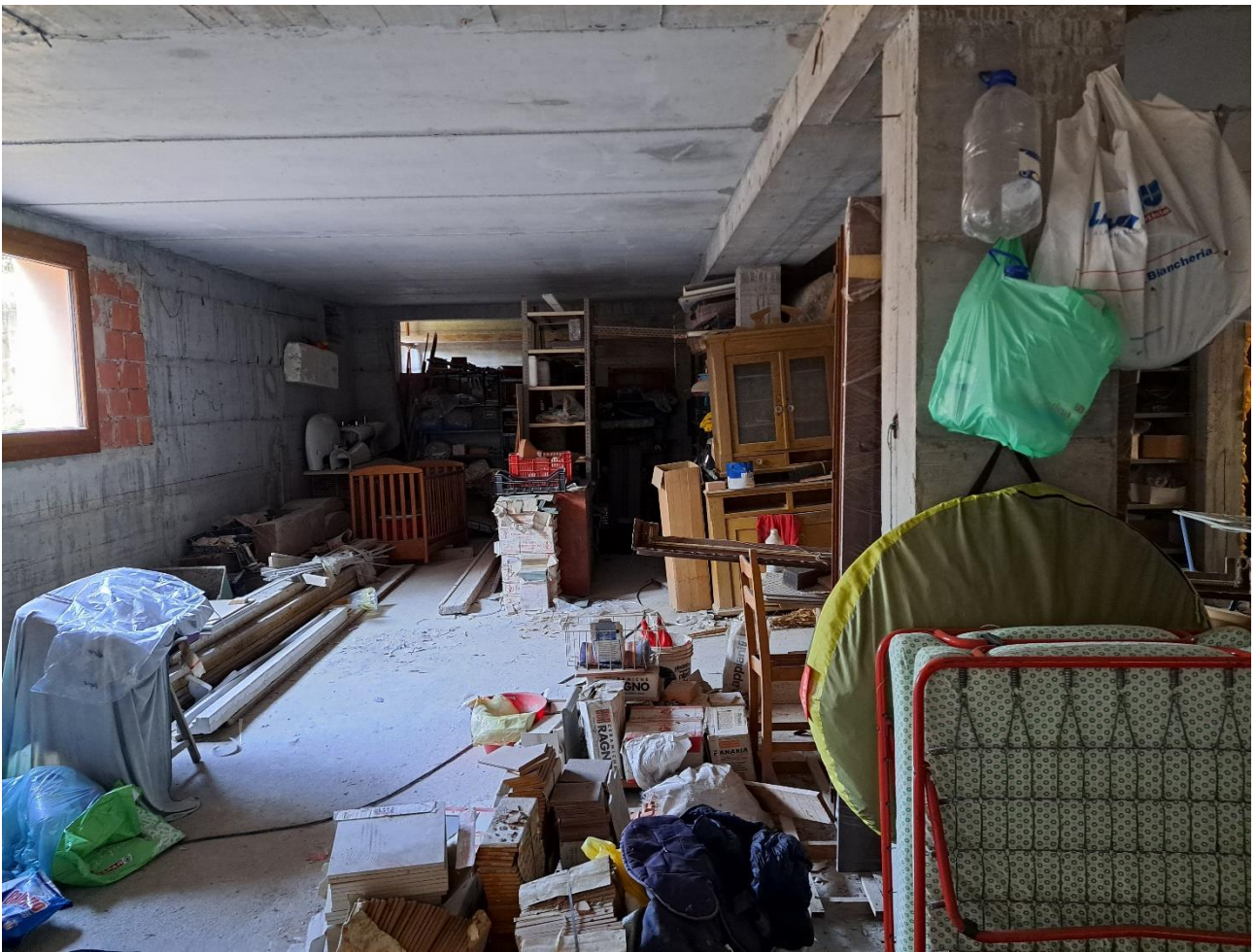
Foto n° 33 Lotto 2 - 17/07/2023 – Comune di Pinzano al Tagliamento (PN) – Località Valeriano - Foglio 12 m.le 2033 sub 6: veduta di porzione sud ovest dello stesso locale destinato ad autorimessa.