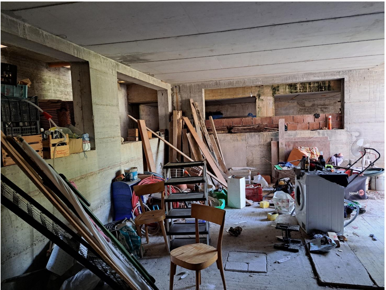
Foto n° 37 Lotto 2 - 17/07/2023 – Comune di Pinzano al Tagliamento (PN) – Località Valeriano - Foglio 12 m.le 2033 sub 6 – Piano interrato: veduta di porzione sud est del locale destinato a portico.