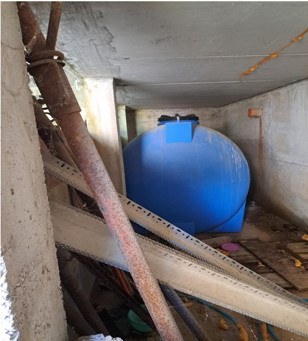
Foto n° 36 Lotto 2 - 17/07/2023 - Comune di Pinzano al Tagliamento (PN) - Località Valeriano - Foglio 12 m.le 2033 sub 6: veduta interna del vano di cui alla foto precedente.