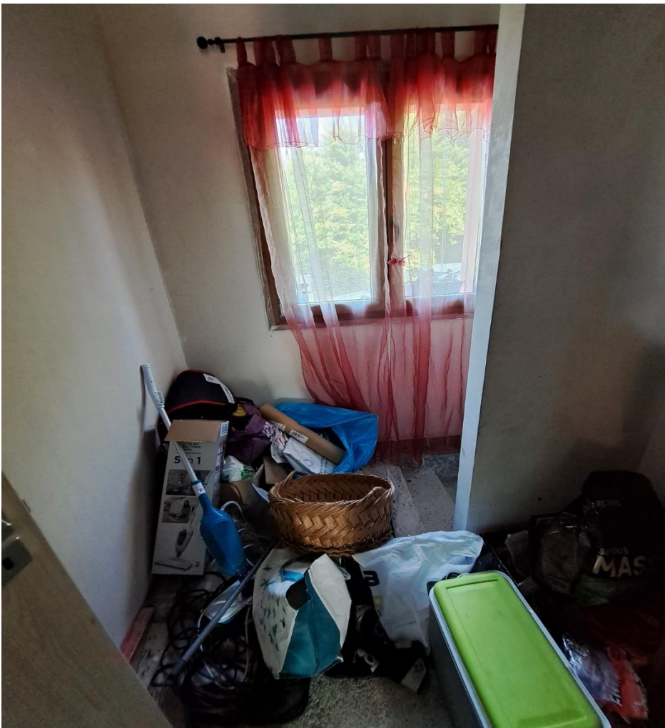
Foto n° 29 Lotto 2 - 17/07/2023 - Comune di Pinzano al Tagliamento (PN) - Località Valeriano - Foglio 12 m.le 2033 sub 5 - Piano terra: particolare dell'accesso al vano scale che porta al piano interrato.