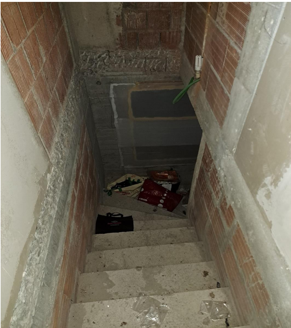
Foto n° 30 Lotto 2 - 17/07/2023 - Comune di Pinzano al Tagliamento (PN) - Località Valeriano - Foglio 12 m.le 2033: veduta del vano scale che conduce al piano interrato.