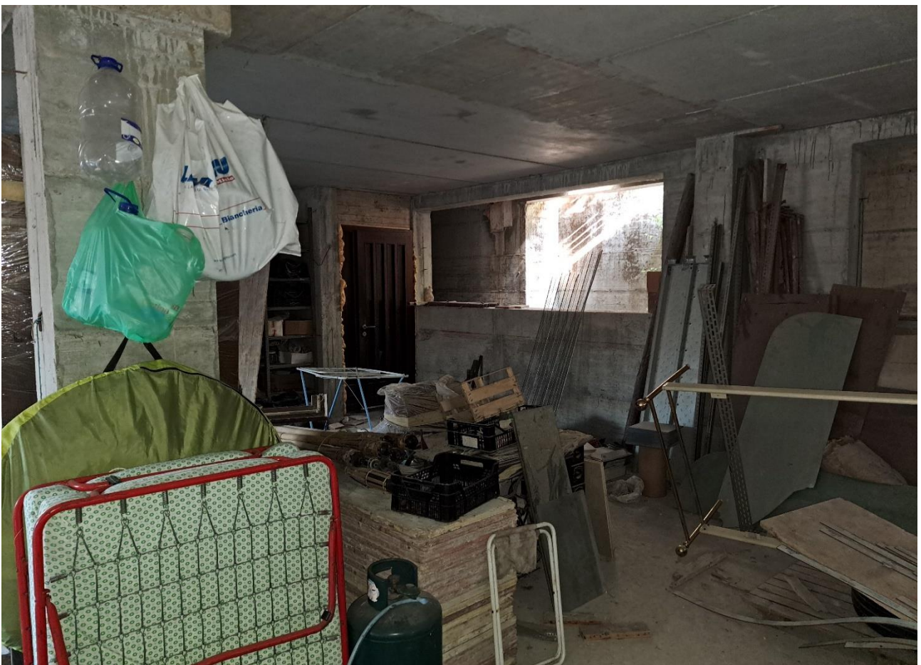
Foto n° 32 Lotto 2 - 17/07/2023 - Comune di Pinzano al Tagliamento (PN) - Località Valeriano - Foglio 12 m.le 2033 sub 6 - Piano interrato: porzione nord ovest dell'autorimessa; sullo sfondo la porta di accesso interna.