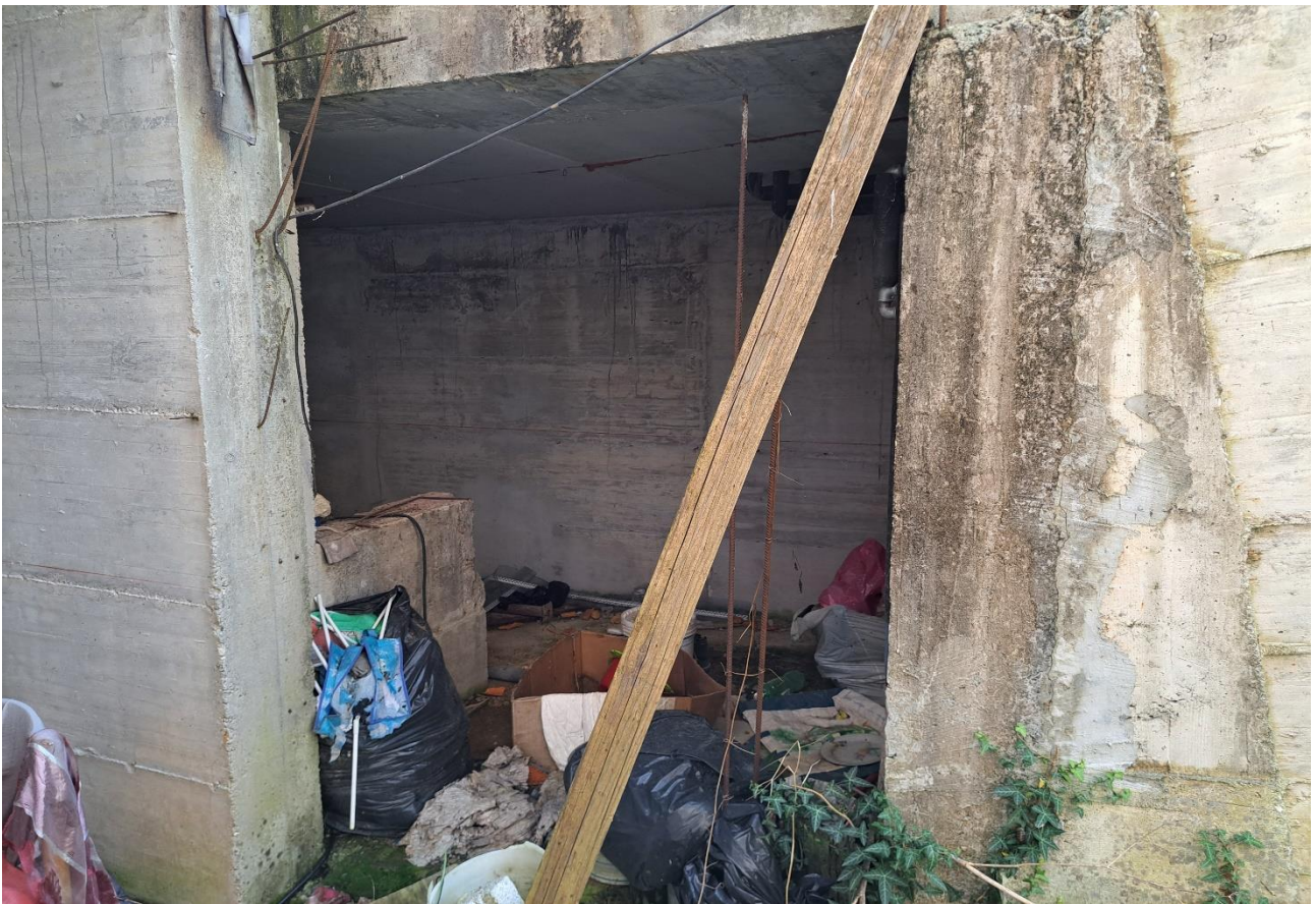
Foto n° 35 Lotto 2 - 17/07/2023 – Comune di Pinzano al Tagliamento (PN) – Località Valeriano - Foglio 12 m.le 2033 sub 6 – Piano interrato: particolare dell'accesso al vano posto a sud.