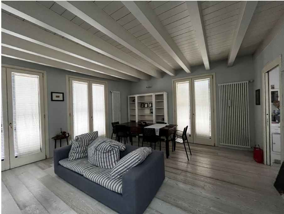
Immagine 10. Vista del locale soggiorno su cui si apre anche lo spazio cottura.