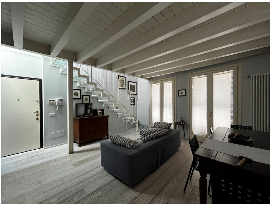
Immagine 9. Vista dell'ingresso dall'interno del soggiorno.