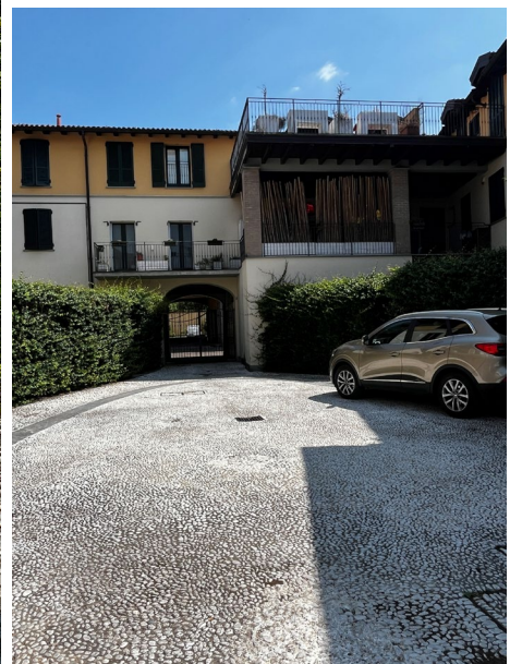
Immagini 1 e 2. Vista della facciata di testa e del giardino interno che gira attorno agli edifici e porta di accesso alle scale.