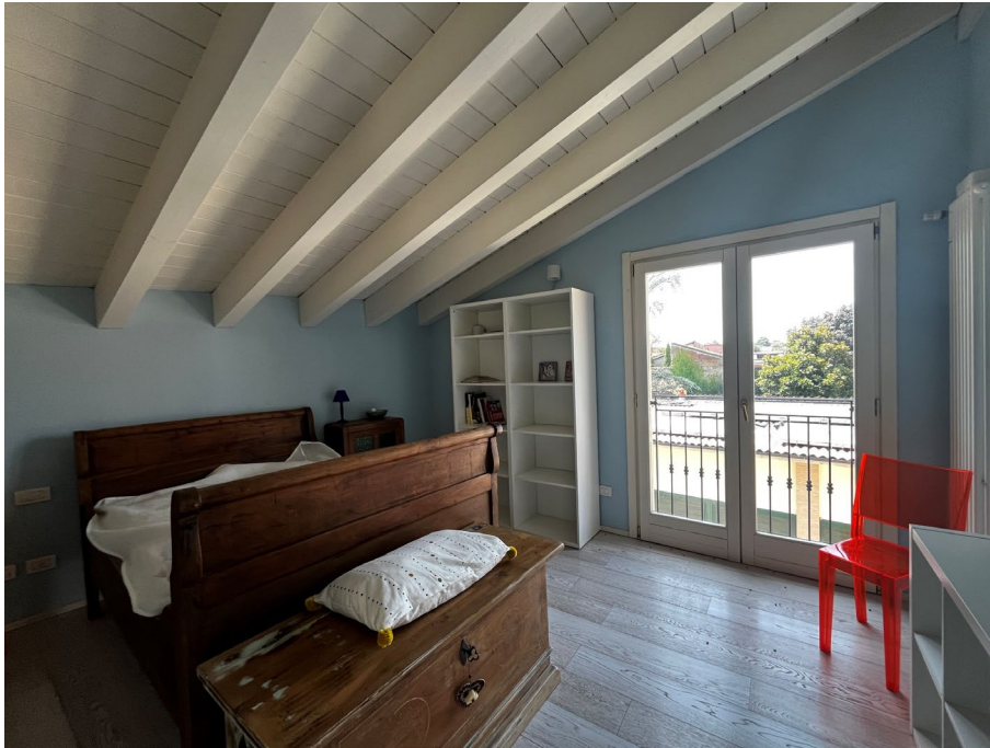
Immagine 16. Uno degli spazi al livello superiore.