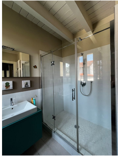
Immagini 12 e 13. Il bagno aerato e illuminato naturalmente con doccia.