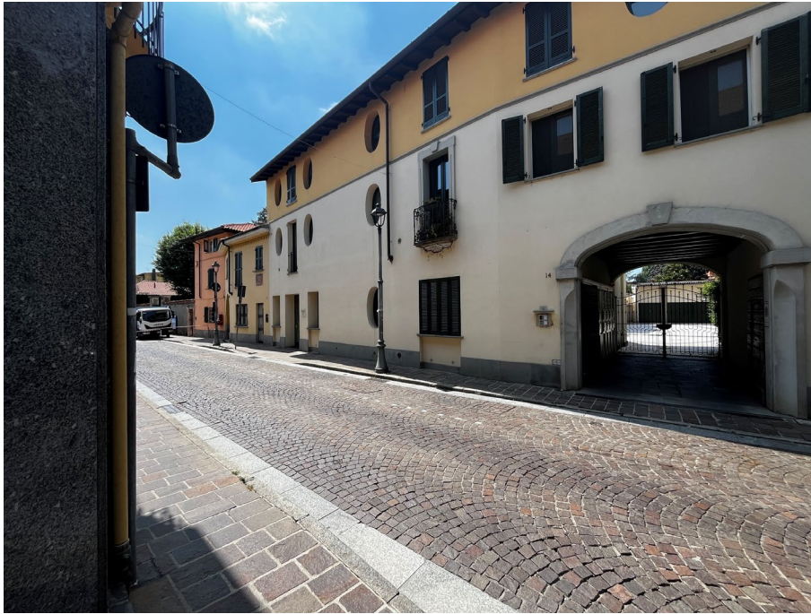
Immagine 0. Vista del fabbricato: si tratta di una tipologia di case a schiera divise in appartamenti con un ingresso comune al giardino che precede percorsi separati per ogni scala.