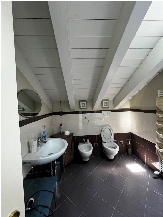
Immagine 18. L'altro spazio al livello superiore.