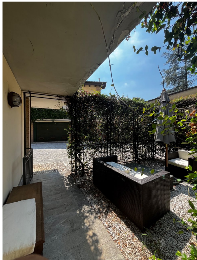
Immagini 5 e 6. Vista della porzione esterna sui cui è attiva una servitù di passo a favore della proprietà oggetto di valutazione per raggiungere l'ingresso e la scala ed arrivare al primo piano.