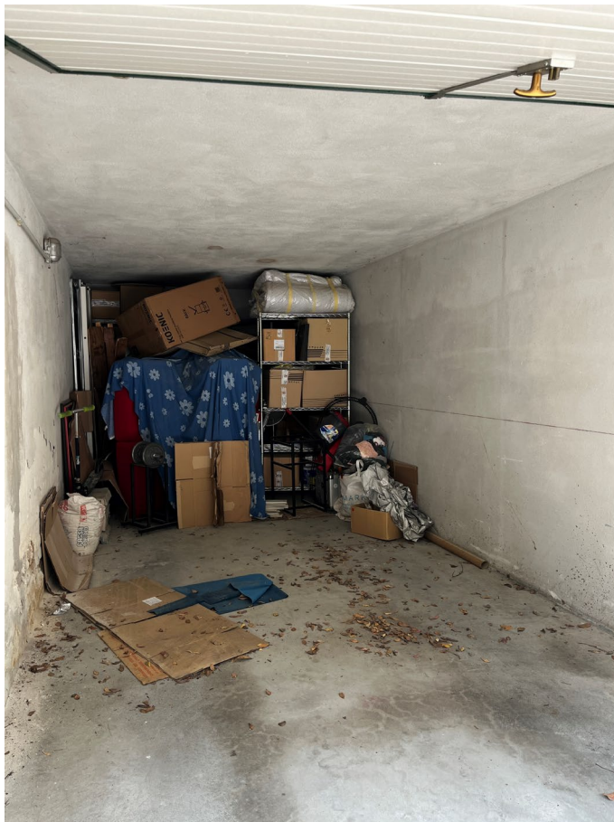
Immagine 20. L'autorimessa.