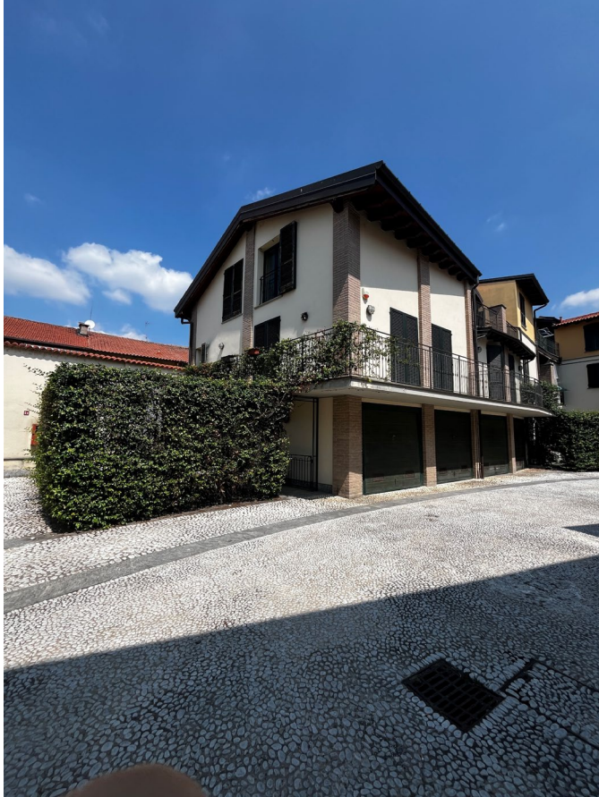
Immagine 4. Vista della porzione di fabbricato a corte in cui si trova l'unità oggetto di valutazione.