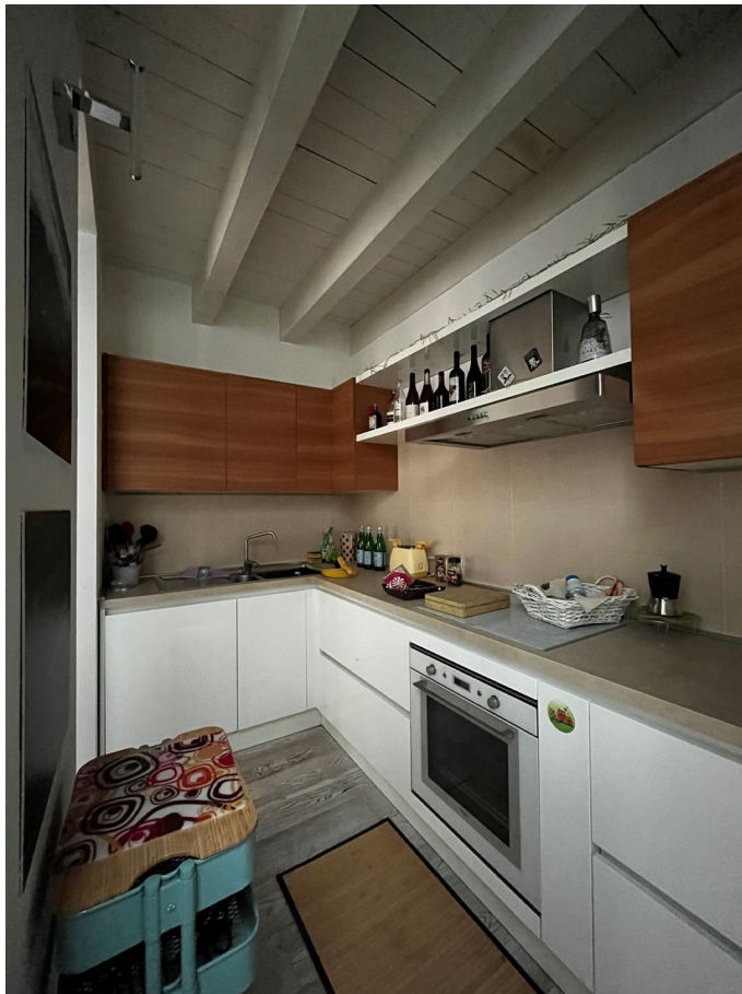
Immagine 11. Vista dello spazio cottura.