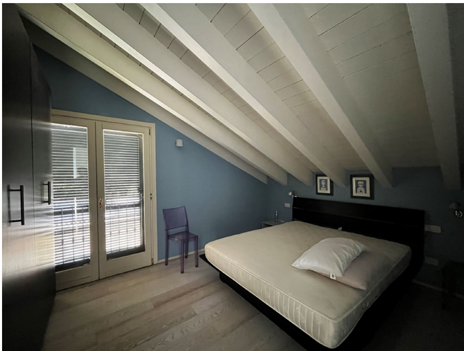
Immagine 17. L'altro spazio al livello superiore.