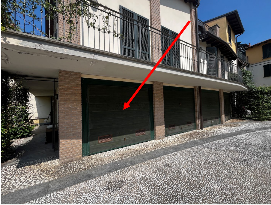
Immagine 19. La posizione dell'autorimessa pertinenziale all'unità abitativa.