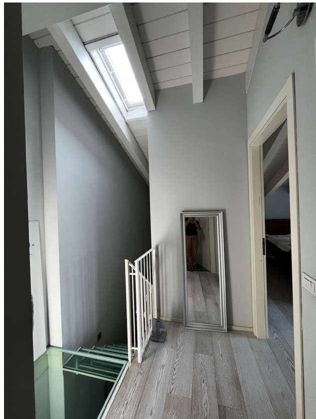
Immagini 14 e 15. La scala interna e lo sbarco al livello superiore (si tratta di uno spazio tipo pertinenza diretta, non costituente superficie abitabile (nel senso urbanistico del termine), sebbene abbia le finiture e le dotazioni adatte ad essere abitato.