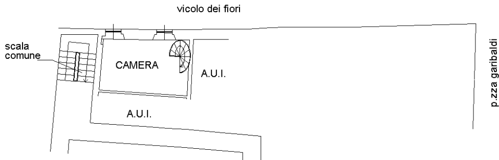
PIANTA PIANO SECONDO H.=Mt.2.77