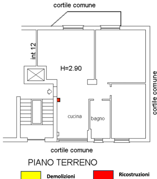
Estratto da planimetria catastale presentata il 29/05/2005

In occasione del sopralluogo esperito in data 22 marzo 2024 l'unità immobiliare sottoposta a esecuzione forzata è risultata non conforme alla planimetria catastale depositata in data 29/06/2005; nella stessa non è stata riportata la canna fumaria presente sullo stralcio planimetrico allegato al nulla osta del '57.