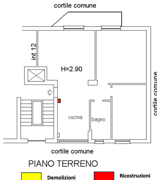
Estratto da planimetria catastale presentata il 29/05/2005