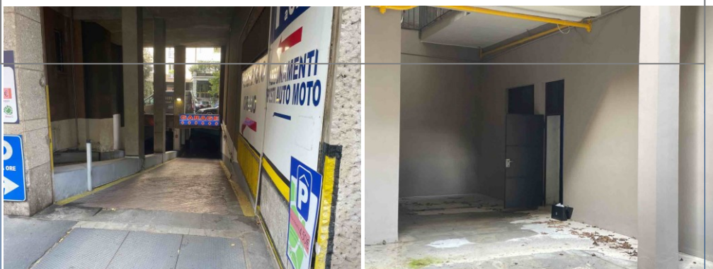
Via San Vittore 38/A con accesso da Via Bandello 4

unità immobiliari in Milano via G. Washington 49