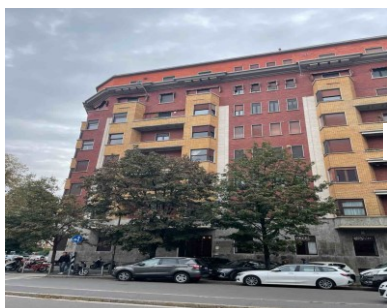
Via Washington 49