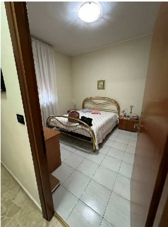
14. Vista di una camera.