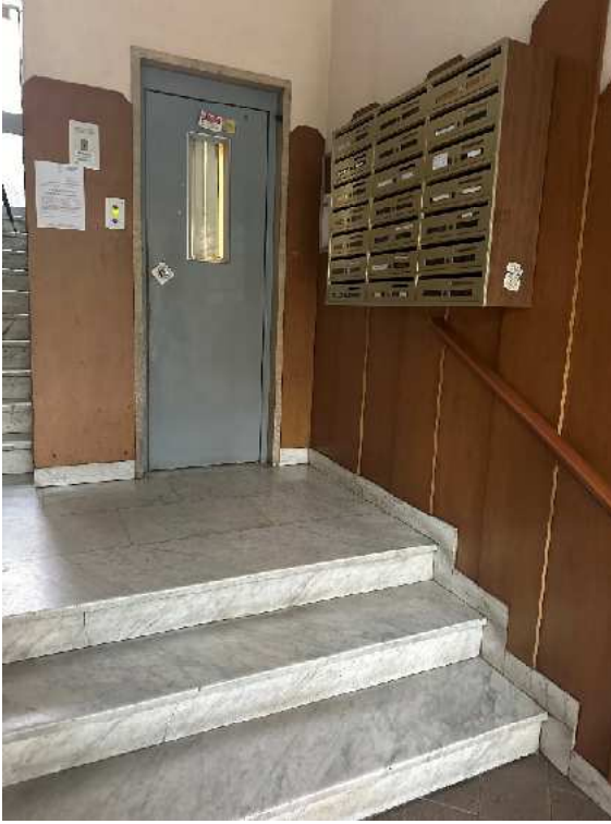
5. Vista delle scale condominiali e dell'ascensore.