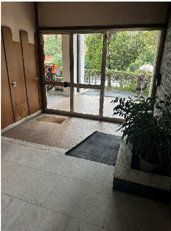
4. Vista dell'ingresso dello stabile.