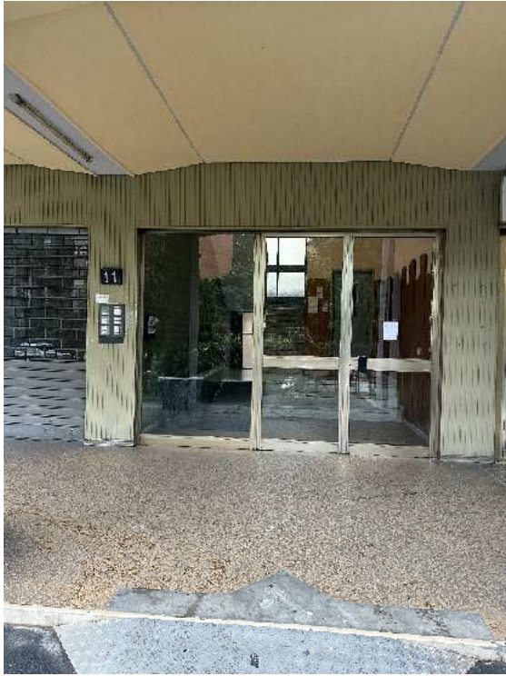
3. Rilievo fotografico del contesto. Vista dell'accesso su strada.