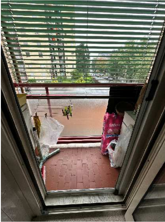
9. Vista del balconcino della cucina.