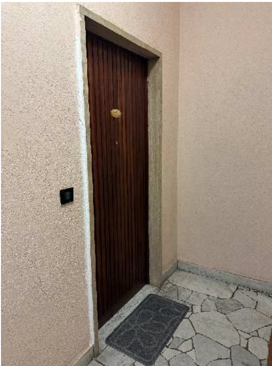
6. Individuazione della porta di accesso all'alloggio.