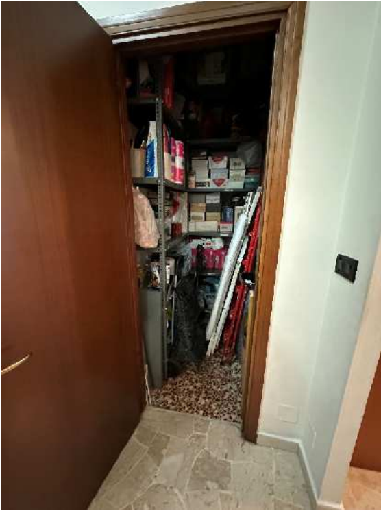
13. Vista del ripostiglio.