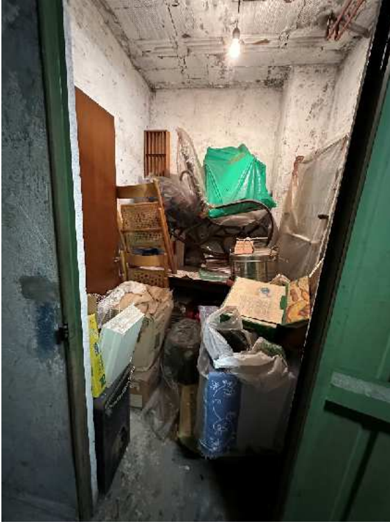
19. Vista interna della cantina.