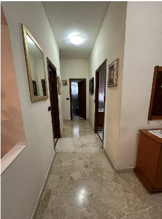
12. Vista del corridoio.