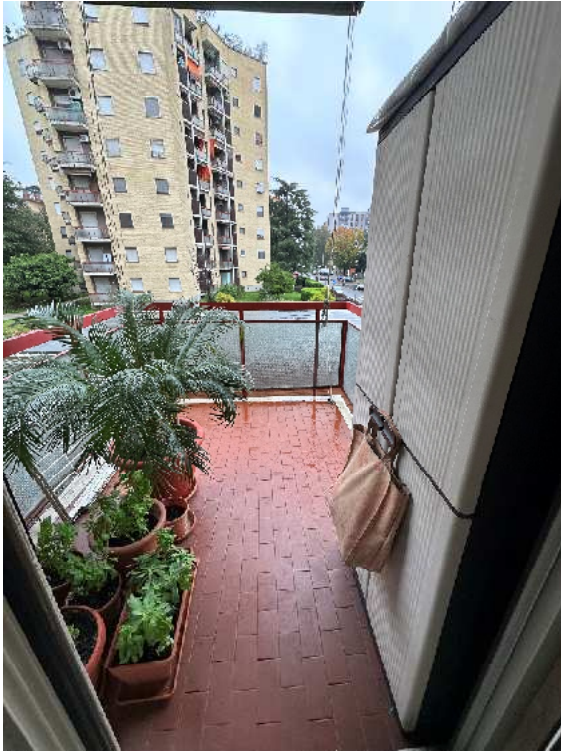
11. Vista del balcone del soggiorno.