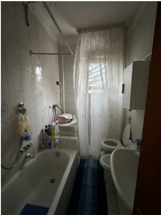
15. Vista del bagno.