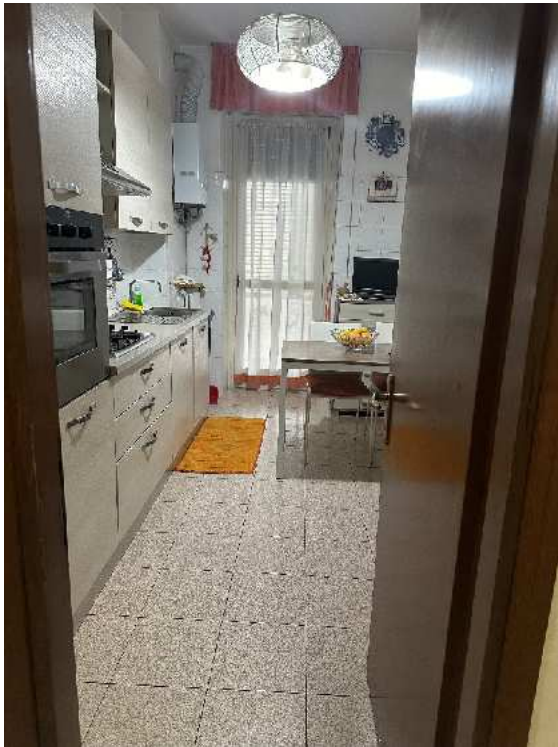
8. Vista della cucina.