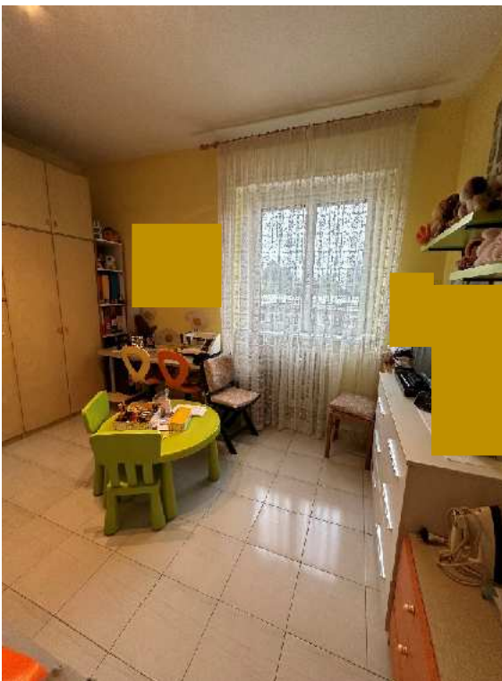
16. Vista dell'altra camera.