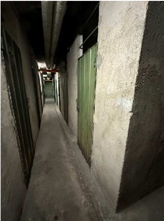
18. Individuazione della cantina.