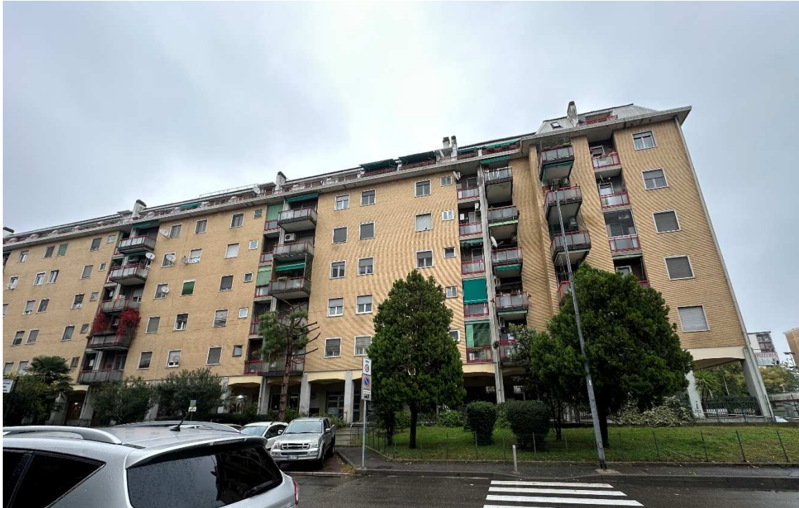
1. Rilievo fotografico del contesto. Vista della facciata principale con indicazione degli affacci dell'immobile.