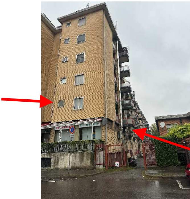
2. Rilievo fotografico del contesto. Vista della facciata secondaria con indicazione degli affacci dell'immobile.