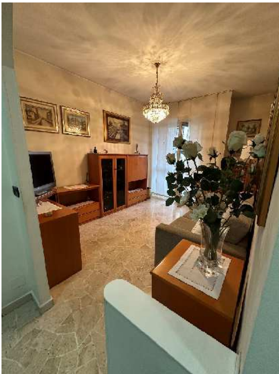
10. Vista del soggiorno.