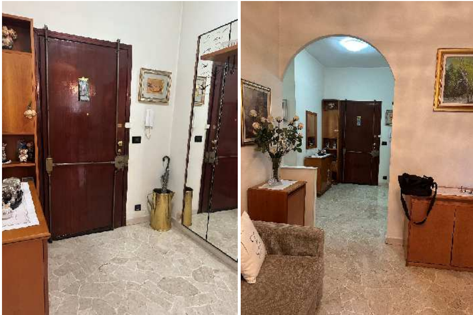
7. Vista della porta di accesso e dell'ingresso.