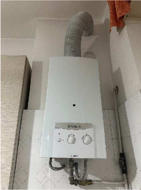
17. Dettaglio della caldaia per la produzione dell'acqua calda.