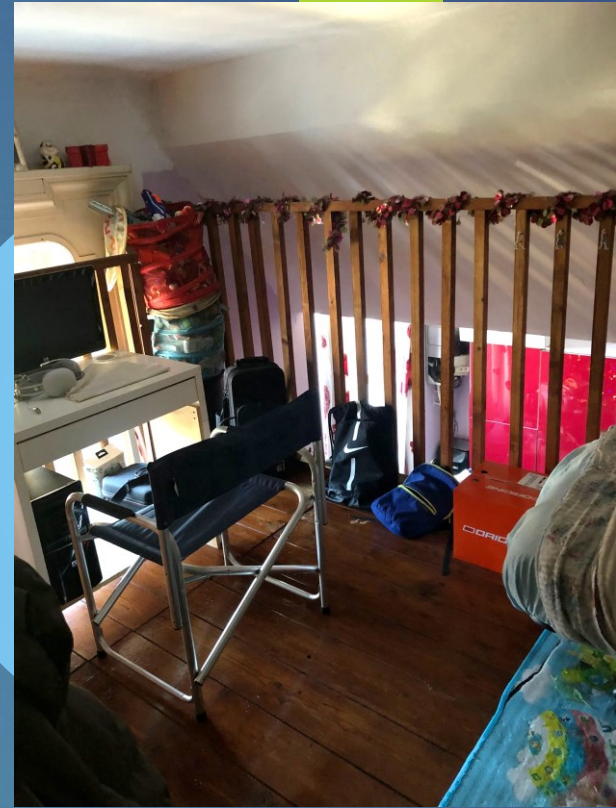
Viste interne: soppalco zona giorno