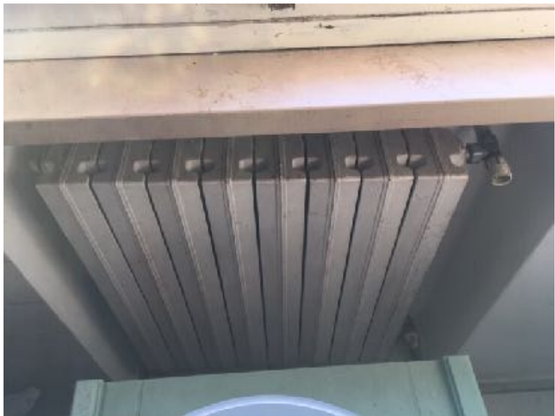
Particolare stato manutenzione serramenti esterni