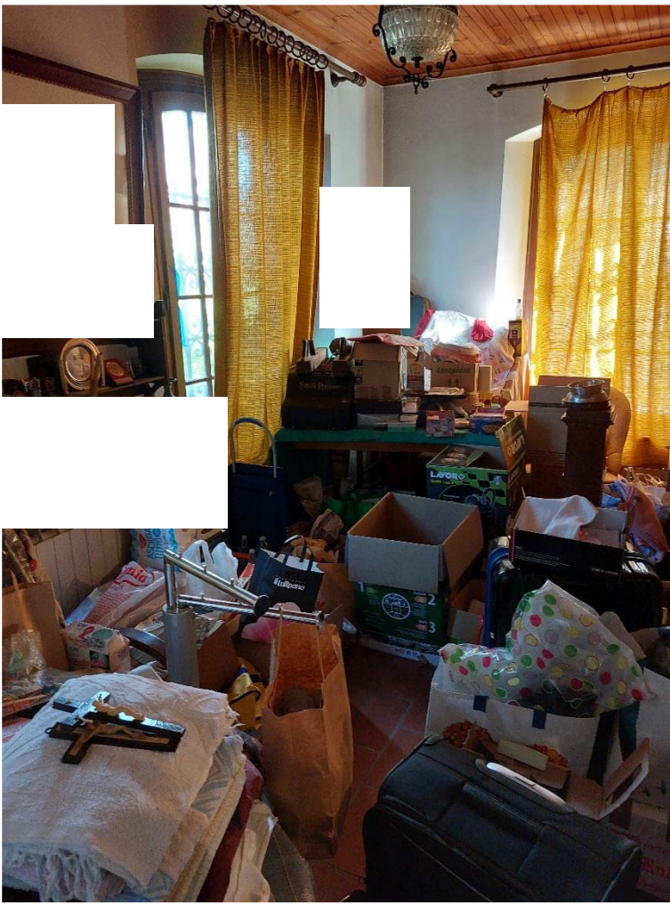
Foto n° 25 – Lotto 2 – 22/08/2022 - Comune di Porcia – Foglio 13 – mappale 700 sub 1 – Veduta interna, da posizione sud-ovest, della stanza di lavoro posta al piano terra.