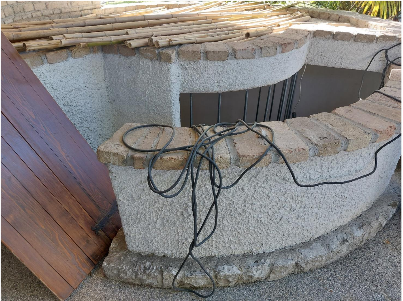
Foto n° 7 - Lotto 2 - 22/08/2022 - Comune di Porcia - Foglio 13 - mappale 700 - Particolare del secondo silo nella parte di accesso alla scala che porta al piano interrato.