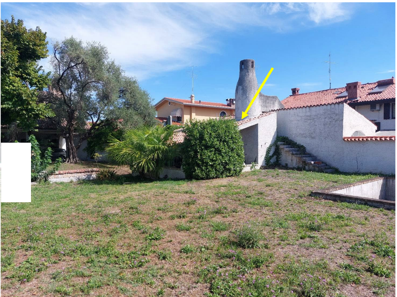
Foto n° 10 – Lotto 2 – 22/08/2022 - Comune di Porcia – Foglio 13 – mappale 755 – Veduta, da posizione sud-ovest, della tettoia, deposito e legnaie del mappale 755 sub1; in tale fabbricato è compresa anche l'unità 755 sub 2 che però non è accessibile, in quanto ha l'unico accesso ad est e viene utilizzata dai vicini (non eseguiti).