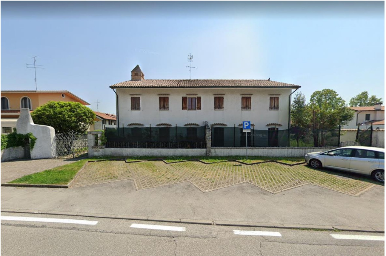
Foto n° 1 – Lotto 2 – Comune di Porcia – Foglio 13 – mappale 700 – Veduta dell'abitazione pignorata da via C. Colombo. Sulla sinistra gli accessi (pedonale e carrabile) all'abitazione; sulla destra vi è altro accesso pedonale ai locali uso ufficio.