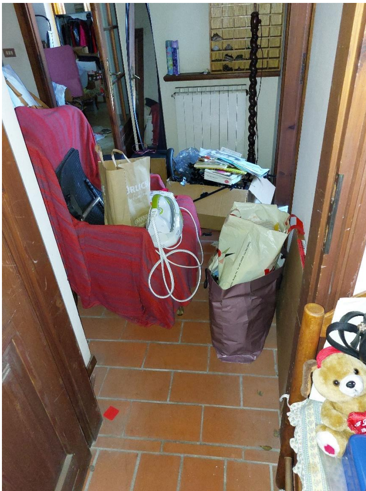
Foto n° 26 – Lotto 2 – 22/08/2022 - Comune di Porcia – Foglio 13 – mappale 700 sub 1 – Particolare, da posizione est, dell'accesso interno ai vani uso ufficio identificati dal sub 2. Gli uffici hanno anche un altro accesso indipendente esterno, in posizione nord-ovest.