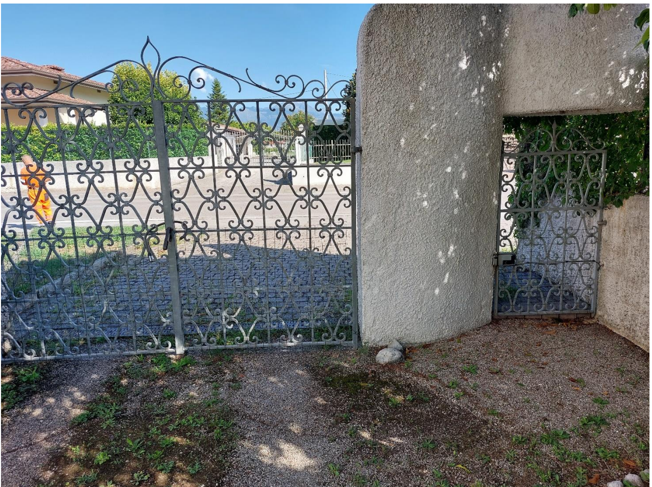
Foto n° 2 – Lotto 2 – 22/08/2022 - Comune di Porcia – Foglio 13 – mappale 700 – Particolare, dall'interno dell'area di pertinenza, dei cancelli d'accesso all'abitazione e al mappale 755.