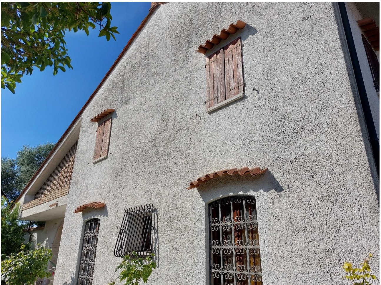
Foto n° 4 - Lotto 2 - 22/08/2022 - Comune di Porcia - Foglio 13 - mappale 700 - Veduta della facciata laterale est dell'abitazione.