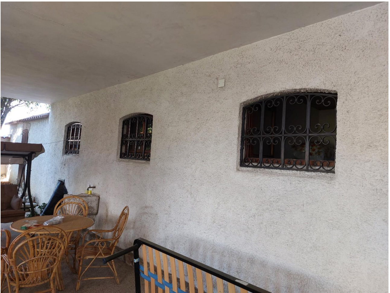
Foto n° 17 - Lotto 2 - 22/08/2022 - Comune di Porcia - Foglio 13 - mappale 700 sub 1 - Ritornati all'abitazione principale, particolare della zona portico, prospiciente all'entrata del piano terra.