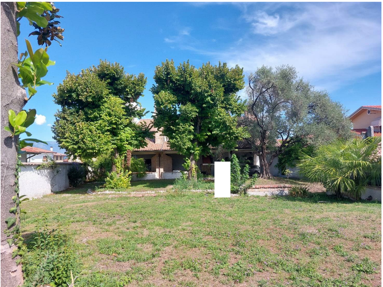
Foto n° 5 – Lotto 2 – 22/08/2022 - Comune di Porcia – Foglio 13 – mappale 700 – Veduta della facciata sud dell'abitazione e del giardino di pertinenza, che comprende anche il mappale 755.