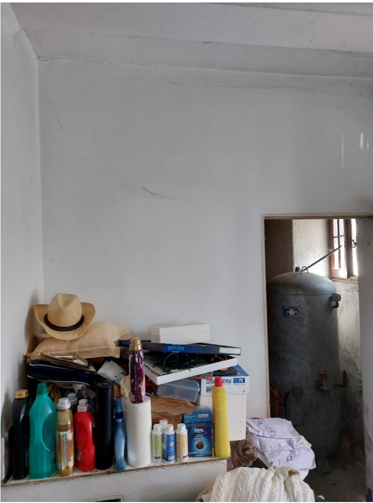
Foto n° 21 - Lotto 2 - 22/08/2022 - Comune di Porcia - Foglio 13 - mappale 700 sub 1 - Particolare, da posizione sud e dal vano uso lavanderia, dell'accesso al locale centrale termica.