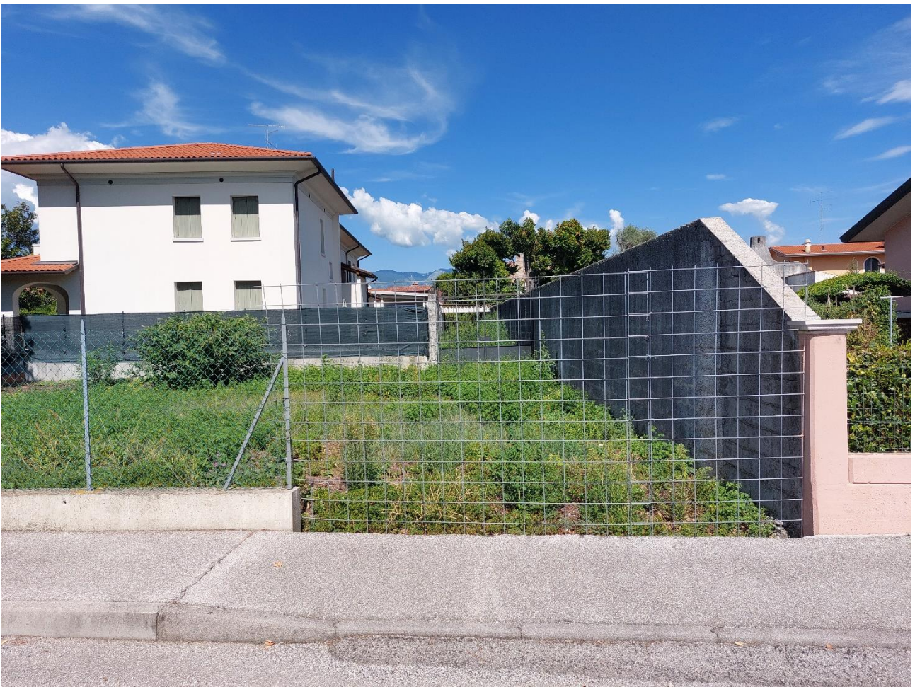
Foto n° 15 – Lotto 2 – 22/08/2022 - Comune di Porcia – Foglio 13 – mappale 715 – Veduta, da via G. da Verrazzano, della porzione sud-est del terreno, completamente recintato e attualmente incolto.