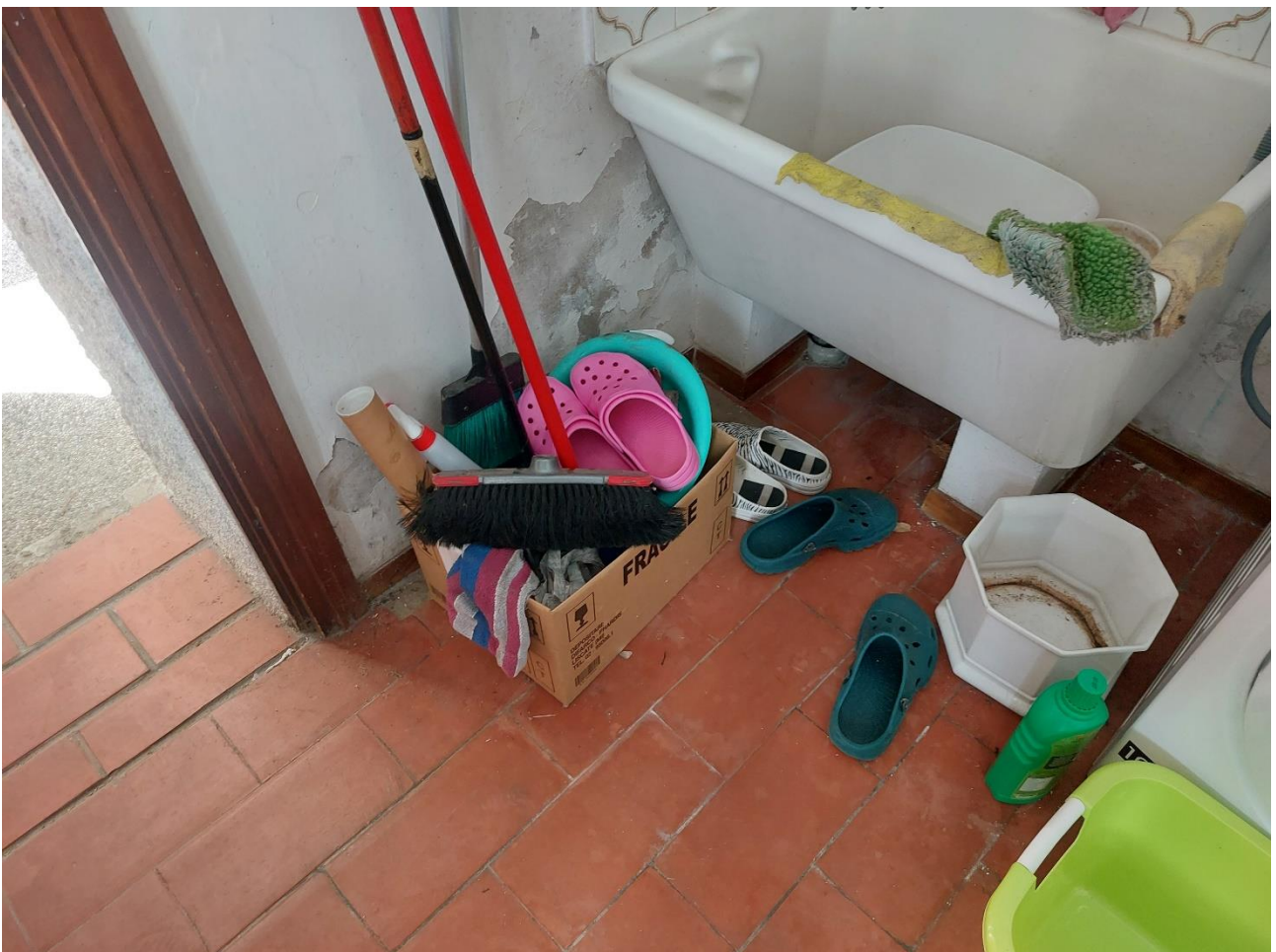
Foto n° 20 – Lotto 2 – 22/08/2022 - Comune di Porcia – Foglio 13 – mappale 700 sub 1 – Particolare di pavimento e pareti dello stesso vano di cui alla foto precedente; si notano infiltrazioni di umidità.