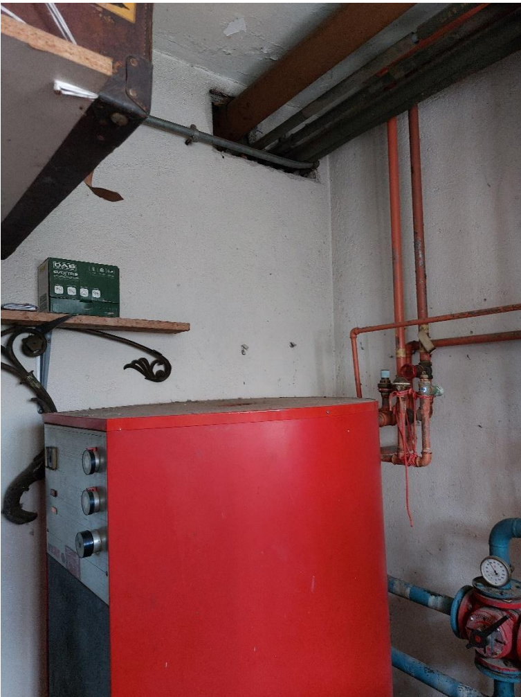
Foto n° 22 - Lotto 2 - 22/08/2022 - Comune di Porcia - Foglio 13 - mappale 700 sub 1 - Veduta interna del locale uso centrale termica.