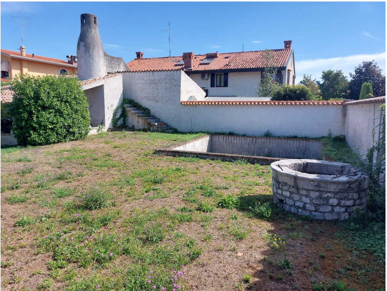
Foto n° 11 – Lotto 2 – 22/08/2022 - Comune di Porcia – Foglio 13 – mappale 755 – Veduta di porzione sud-est della particella 755 e dei manufatti presenti nell'area di pertinenza.