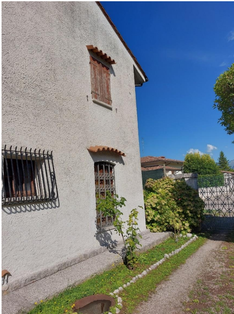
Foto n° 3 - Lotto 2 - 22/08/2022 - Comune di Porcia - Foglio 13 - mappale 700 - Particolare del vialetto carrabile interno che conduce all'autorimessa.