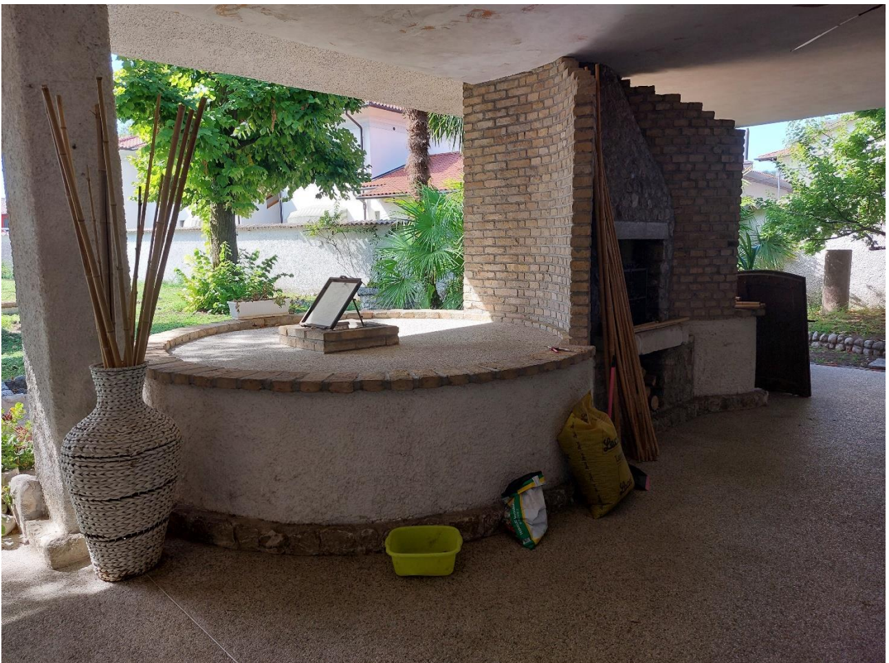
Foto n° 6 – Lotto 2 – 22/08/2022 - Comune di Porcia – Foglio 13 – mappale 700 – Particolare di uno dei due silos abbattuti e chiusi con copertura, posti sotto il portico dell'abitazione; uno dei silos è accessibile e adibito a deposito.