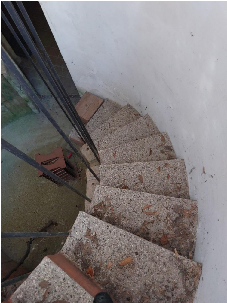
Foto n° 8 - Lotto 2 - 22/08/2022 - Comune di Porcia - Foglio 13 - mappale 700 - Particolare della scala che conduce al piano interrato del silo di cui alla foto precedente e all'entrata del vano uso cantina.