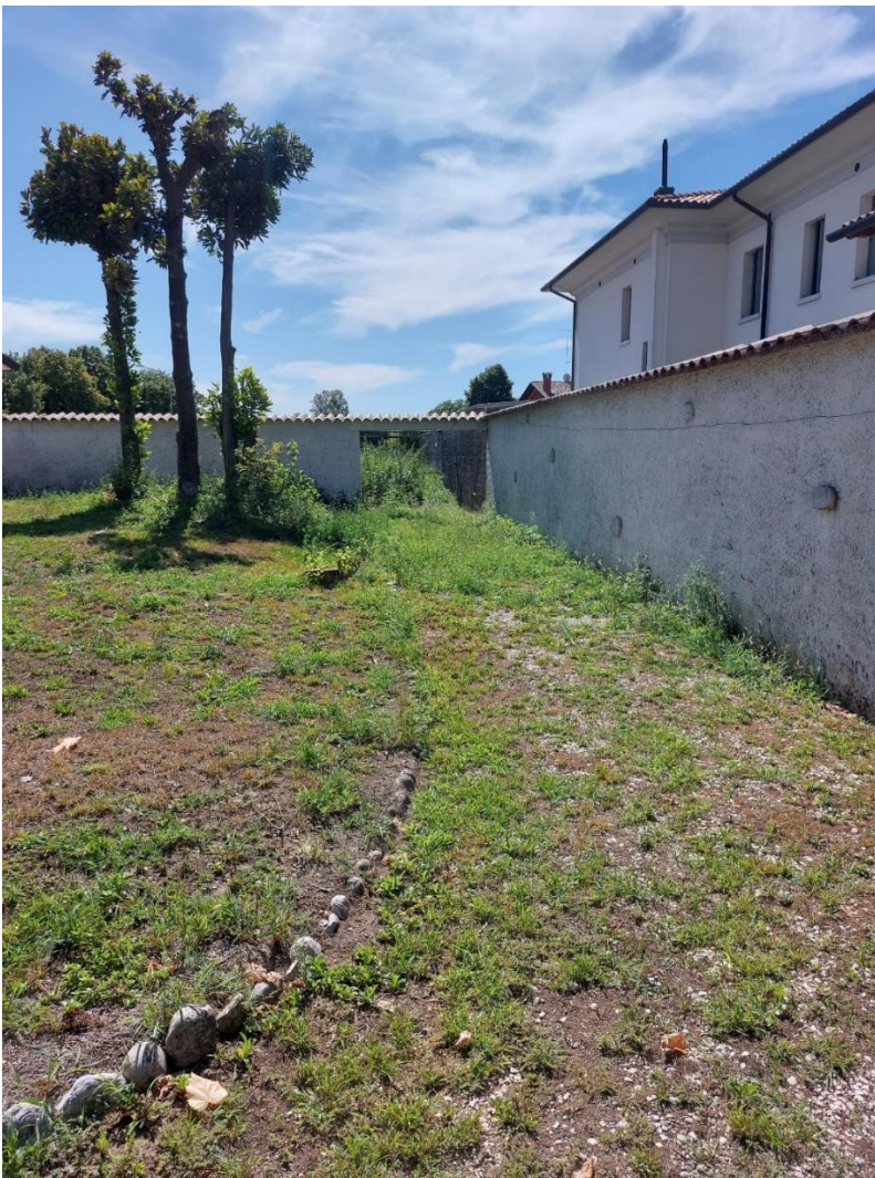
Foto n° 13 – Lotto 2 – 22/08/2022 - Comune di Porcia – Foglio 13 – mappale 700 – Veduta del giardino di pertinenza dell'abitazione in prossimità del confine ovest con altrui proprietà; sullo sfondo, al centro della foto, si nota l'accesso alla stradina, facente parte del mappale 700, che porta al terreno identificato dal mappale 715.