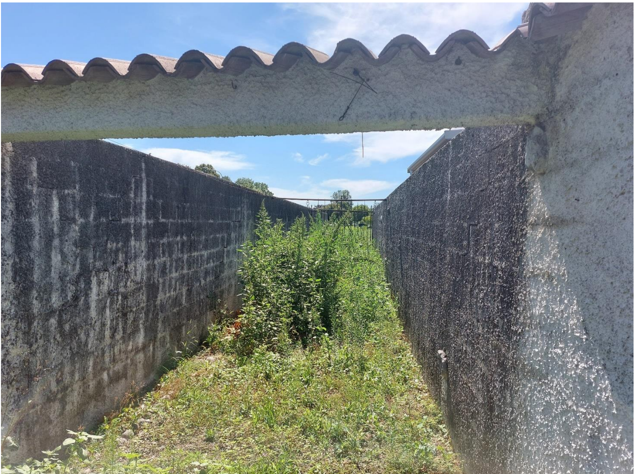
Foto n° 14 – Lotto 2 – 22/08/2022 - Comune di Porcia – Foglio 13 – mappale 700 – Particolare della stradina di accesso al terreno mappale 715, il quale ha una più agevole entrata da Via G. da Verrazzano.