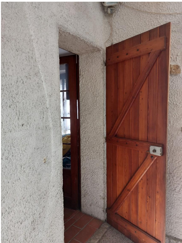
Foto n° 18 - Lotto 2 - 22/08/2022 - Comune di Porcia - Foglio 13 - mappale 700 sub 1 - Particolare dell'entrata del piano terra dell'abitazione, dove si trovano una lavanderia, la centrale termica, un corridoio e una stanza adibita a deposito.