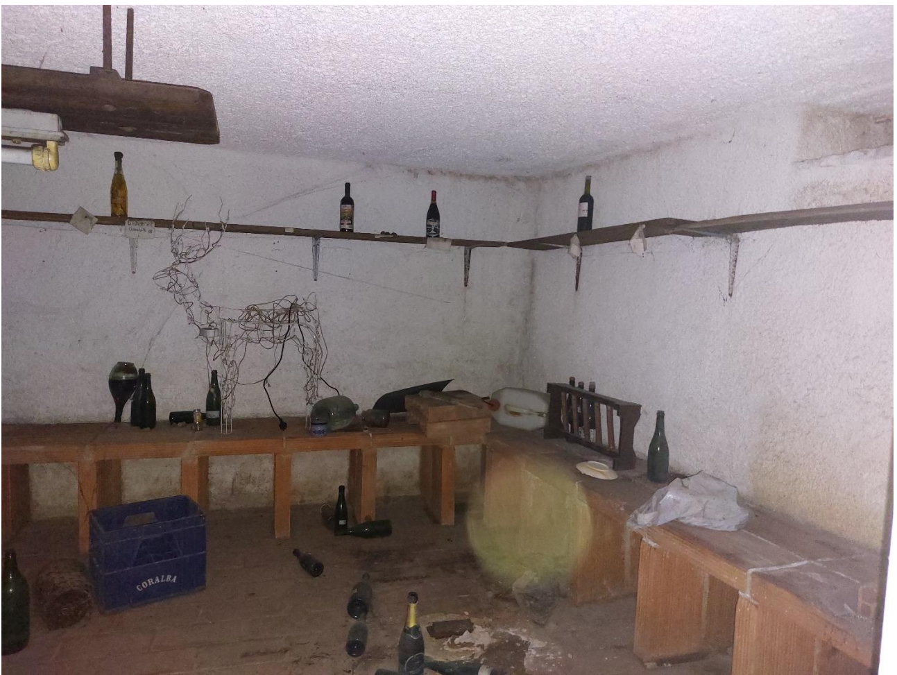
Foto n° 9 – Lotto 2 – 22/08/2022 - Comune di Porcia – Foglio 13 – mappale 700 – Veduta interna della cantina posta al piano interrato.