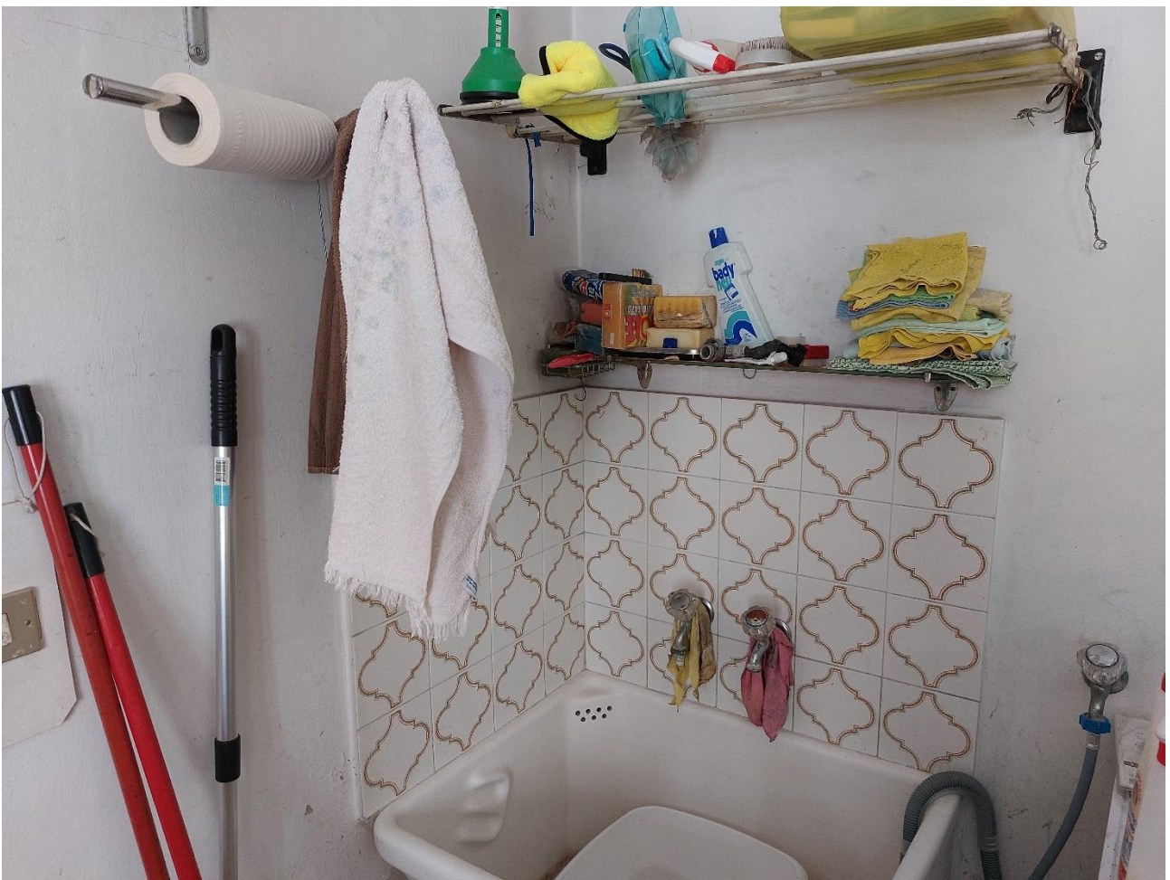
Foto n° 19 – Lotto 2 – 22/08/2022 - Comune di Porcia – Foglio 13 – mappale 700 sub 1 – Particolare del primo vano del piano terra, ad uso lavanderia.