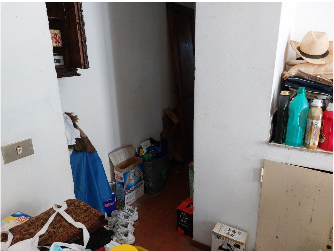
Foto n° 23 - Lotto 2 - 22/08/2022 - Comune di Porcia - Foglio 13 - mappale 700 sub 1 - Veduta, da posizione sud-est e dal vano lavanderia, dell'accesso al corridoio che conduce alla stanza lavoro.