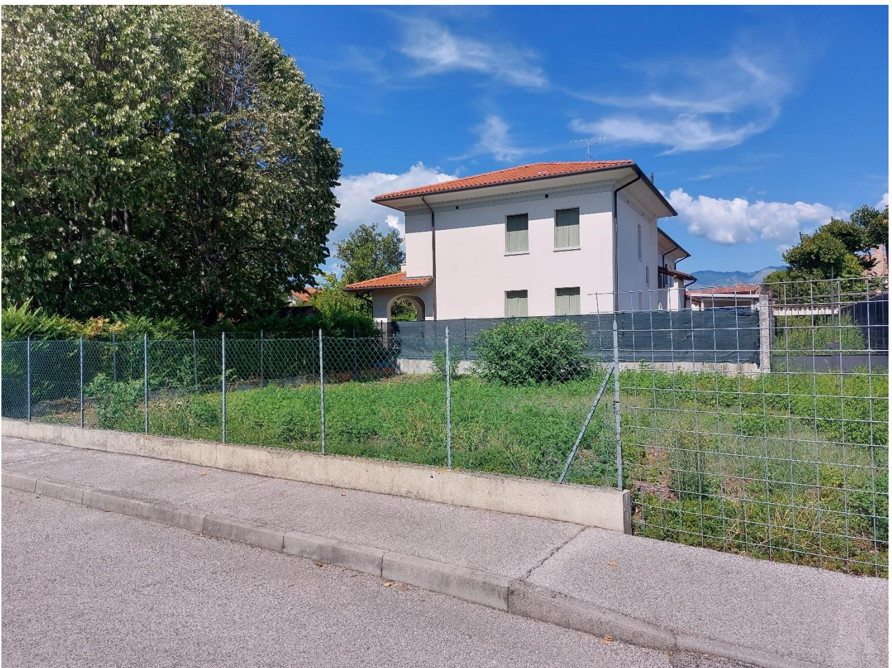
Foto n° 16 – Lotto 2 – 22/08/2022 - Comune di Porcia – Foglio 13 – mappale 715 – Porzione ovest del terreno di cui alla foto precedente.