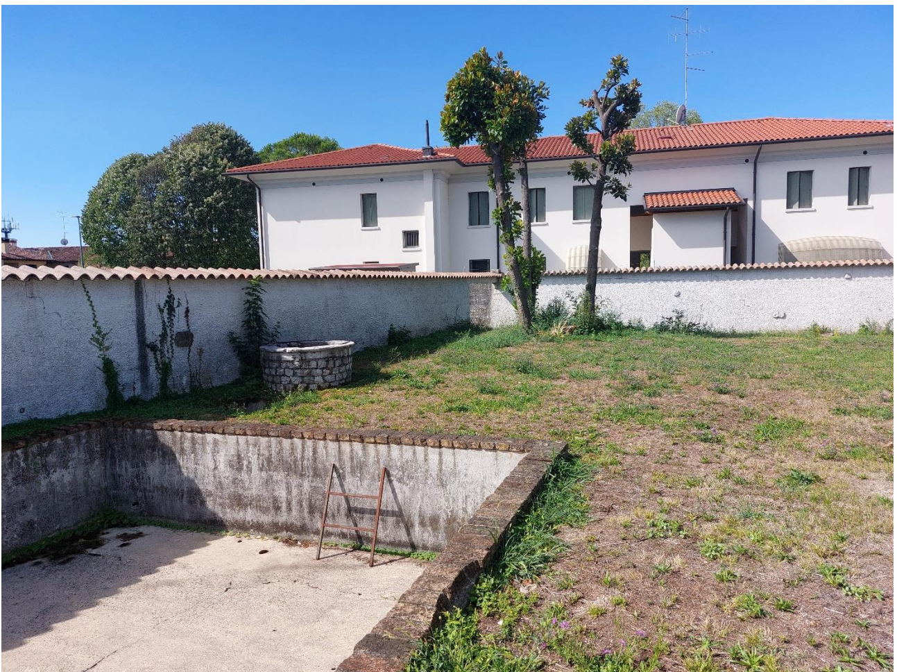
Foto n° 12 – Lotto 2 – 22/08/2022 - Comune di Porcia – Foglio 13 – mappale 755 – Veduta, da posizione opposta, della stessa particella; sullo sfondo, porzione sud-ovest del giardino che insiste sul mappale 700.