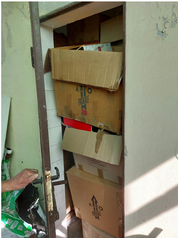
Foto n° 36 – Lotto 1 – 22/08/2022 - Comune di Pordenone – Foglio 11 - mappale 417 sub 4 – Particolare dell'entrata al vano uso WC, in realtà utilizzato come deposito.