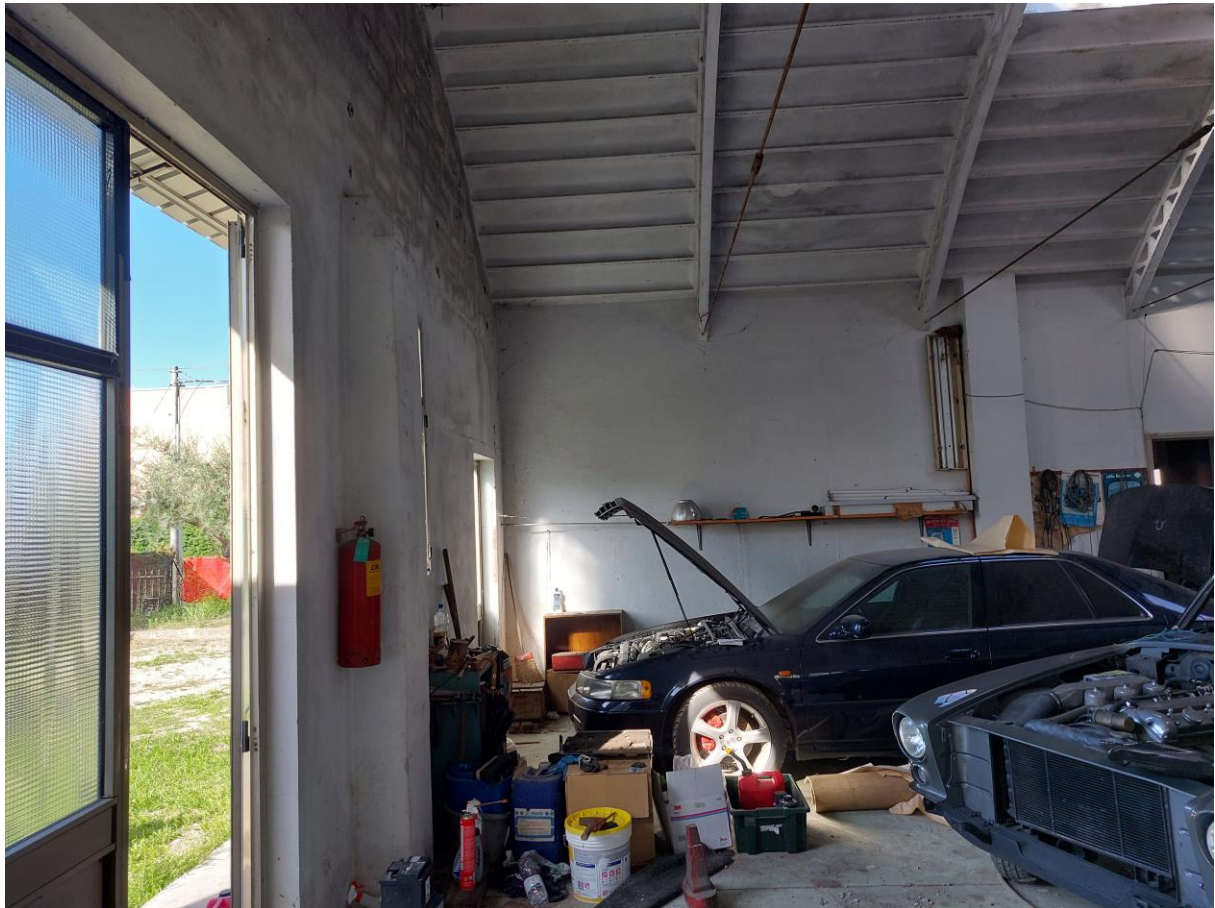
Foto n° 39 - Lotto 1 - 22/08/2022 - Comune di Pordenone - Foglio 11 - mappale 417 sub 4 - Veduta interna, da posizione est, di porzione del capannone uso laboratorio (C/3), in realtà utilizzato come deposito e garage per auto d'epoca.