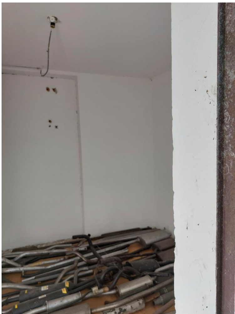
Foto n° 37 - Lotto 1 - 22/08/2022 - Comune di Pordenone - Foglio 11 - mappale 417 sub 4 - Veduta dell'interno del locale utilizzato come deposito di cui alla foto n°35.