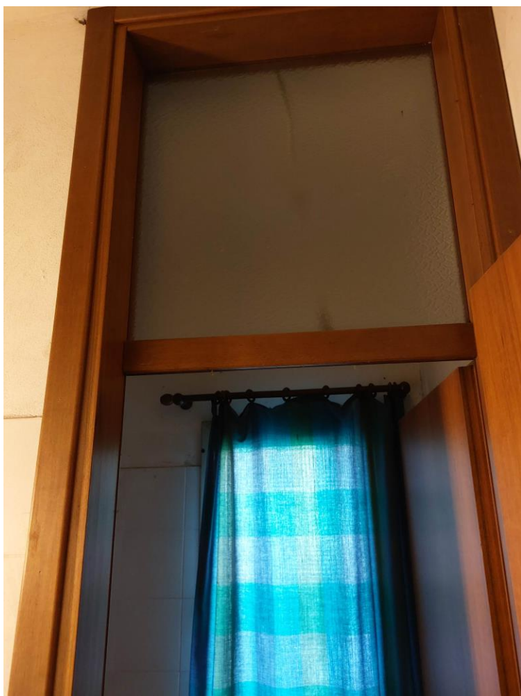
Foto n° 50 - Lotto 1 - 22/08/2022 - Comune di Pordenone - Foglio 11 - mappale 417 sub 1 - Particolare, da posizione est, della porta con sopraluce nel vano di cui alla foto precedente.