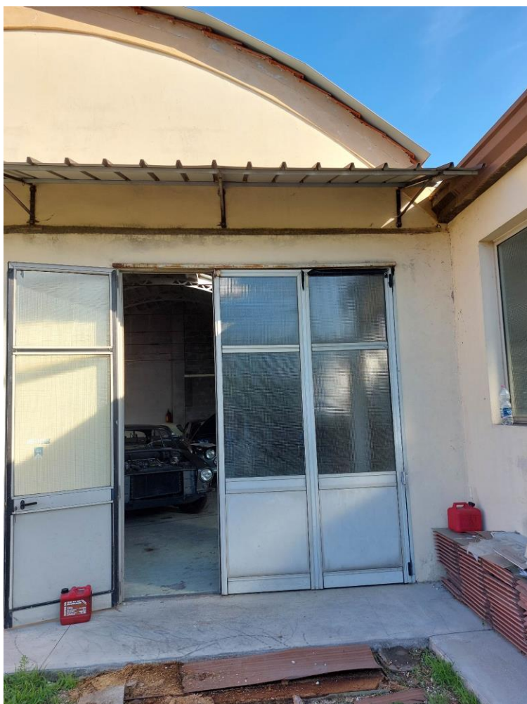
Foto n° 38 - Lotto 1 - 22/08/2022 - Comune di Pordenone - Foglio 11 - mappale 417 sub 4 - Ritornati all'entrata principale del capannone, veduta della stessa da posizione sud.