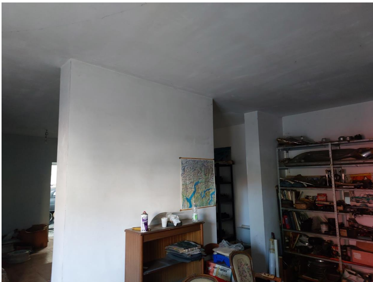
Foto n° 47 - Lotto 1 - 22/08/2022 - Comune di Pordenone - Foglio 11 - mappale 417 sub 1 - Veduta della porzione sud-est del secondo ufficio.