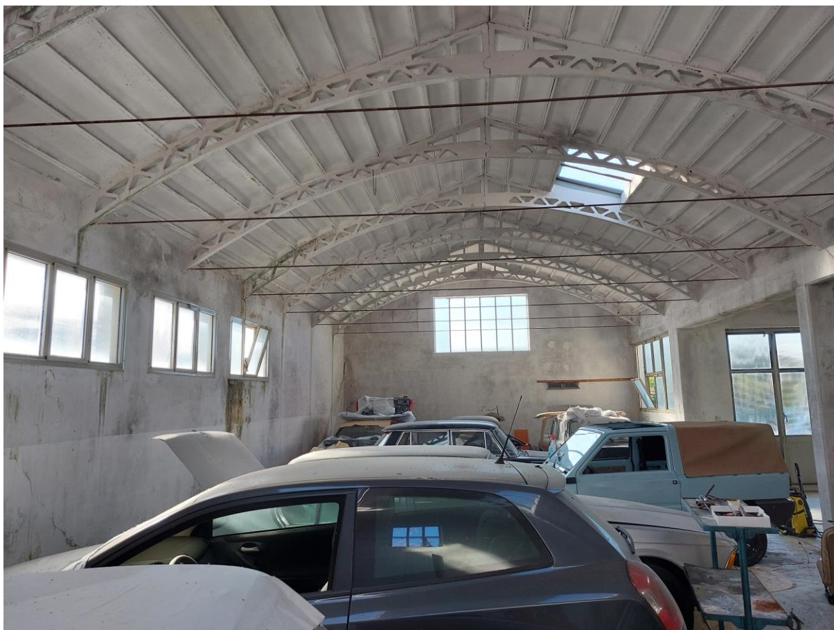
Foto n° 43 – Lotto 1 – 22/08/2022 - Comune di Pordenone – Foglio 11 – mappale 417 sub 4 – Veduta interna dello stesso capannone da posizione nord.