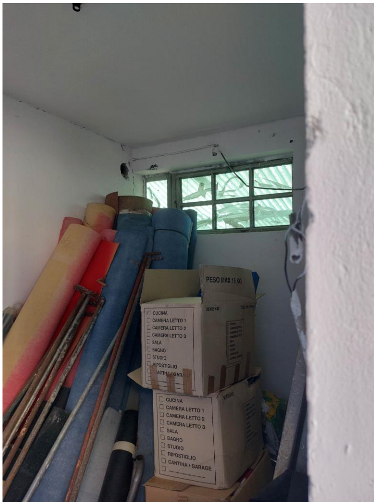
Foto n° 33 – Lotto 1 – 22/08/2022 - Comune di Pordenone – Foglio 11 - mappale 417 sub 4 – Particolare dell'interno del locale di cui alla foto precedente, destinato a deposito.