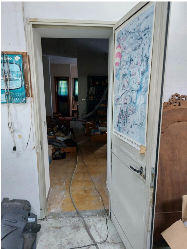
Foto n° 44 – Lotto 1 – 22/08/2022 - Comune di Pordenone – Foglio 11 – mappale 417 sub 4 – Particolare della porta che collega il capannone ai due locali ad uso ufficio del mappale 417 sub 1.