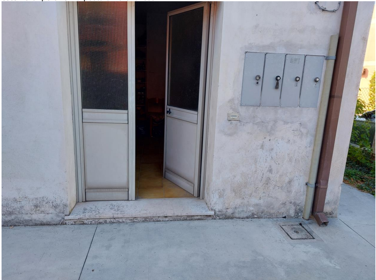
Foto n° 52 - Lotto 1 - 22/08/2022 - Comune di Pordenone - Foglio 11 - mappale 417 sub 1 - Veduta, da posizione nord e dall'esterno, della porta di accesso ai locali uso uffici di cui alle foto precedenti.