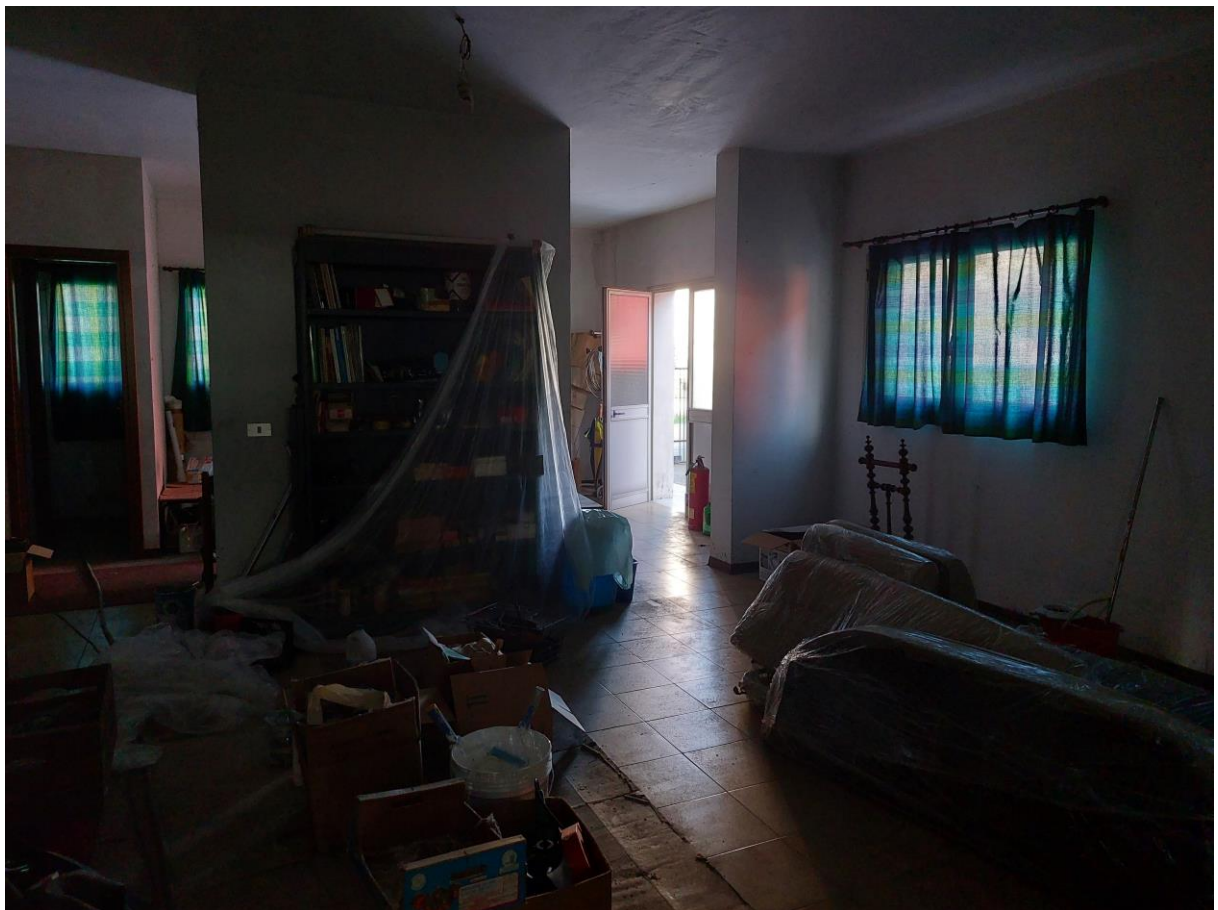
Foto n° 46 – Lotto 1 – 22/08/2022 - Comune di Pordenone – Foglio 11 – mappale 417 sub 1 – Veduta dello stesso vano di cui alla foto precedente; sullo sfondo la porta di accesso dall'area comune esterna di pertinenza posta a nord-ovest.