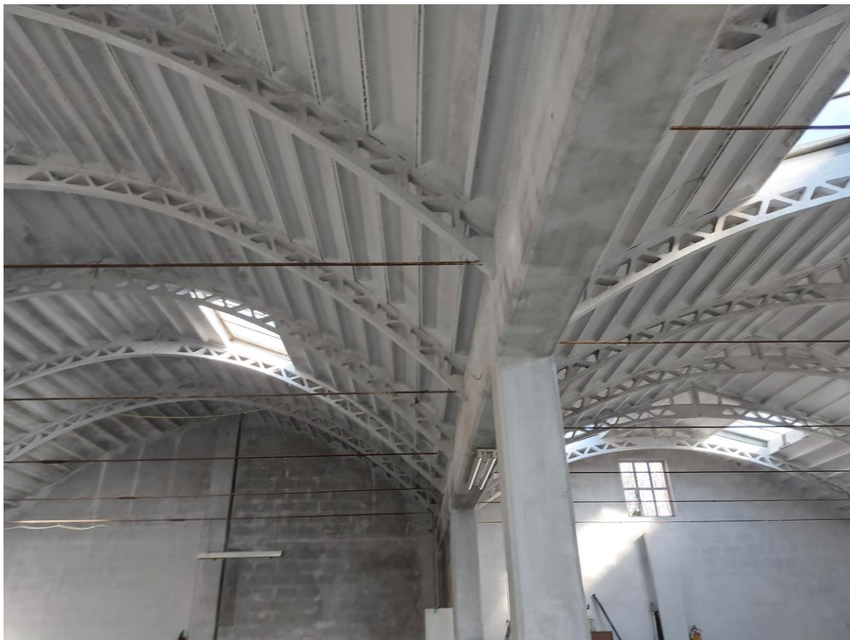
Foto n° 41 – Lotto 1 – 22/08/2022 - Comune di Pordenone – Foglio 11 – mappale 417 sub 4 – Particolare della struttura a volta del tetto.