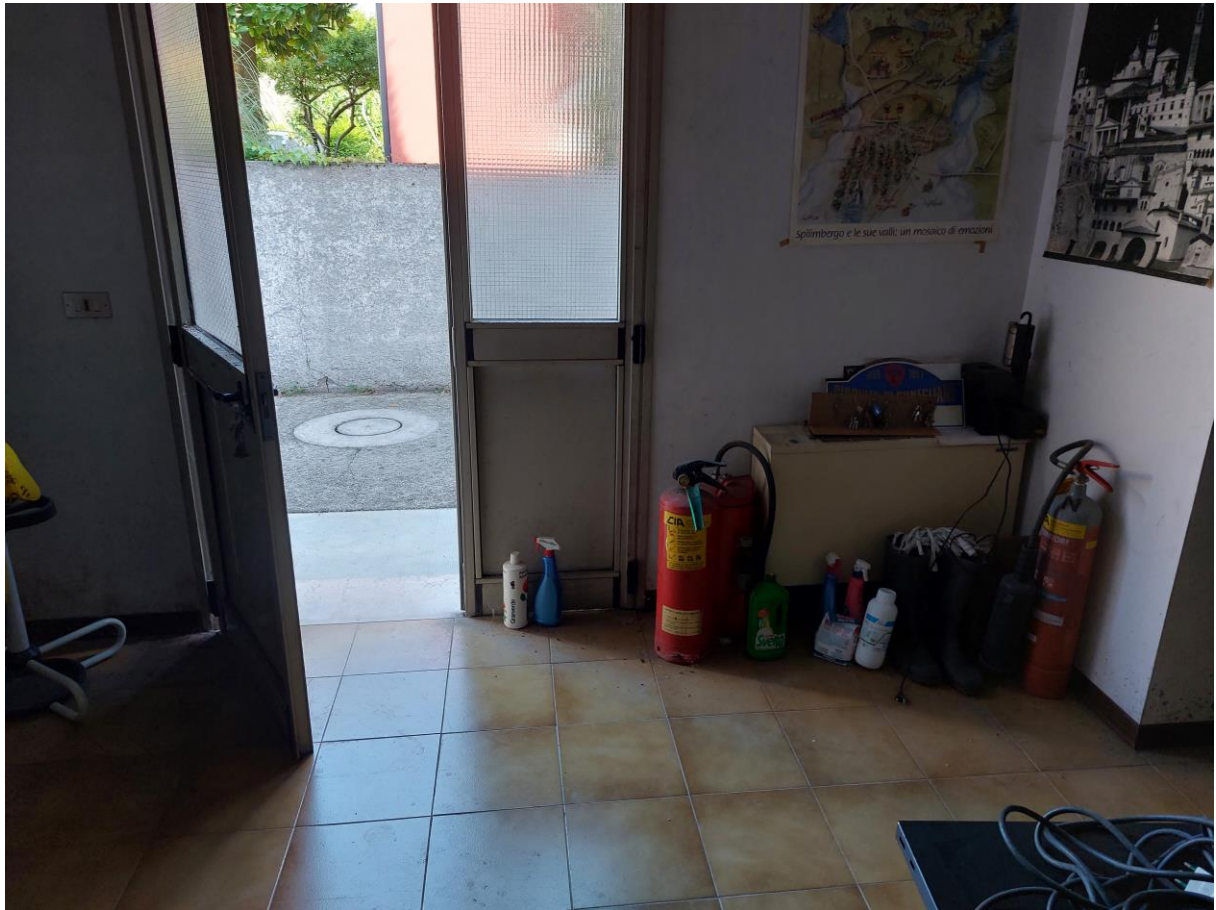
Foto n° 51 - Lotto 1 - 22/08/2022 - Comune di Pordenone - Foglio 11 - mappale 417 sub 1 - Veduta di porzione nord del secondo vano uso ufficio e della porta di accesso dall'area comune esterna di pertinenza posta a nord-ovest.