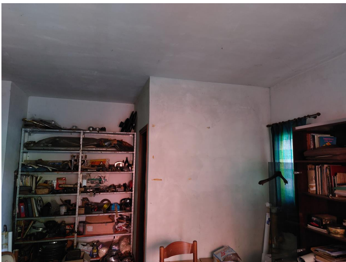
Foto n° 48 - Lotto 1 - 22/08/2022 - Comune di Pordenone - Foglio 11 - mappale 417 sub 1 - Particolare della porzione sud del locale di cui alla foto precedente; al centro si nota la porta di accesso al vano uso WC e lavamani.