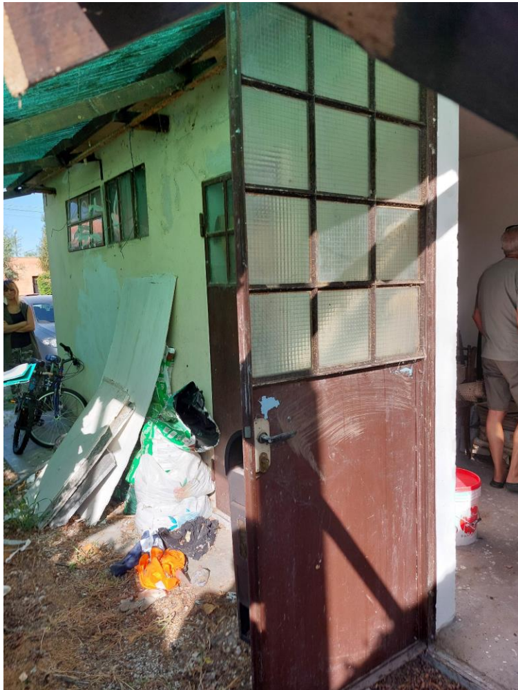
Foto n° 35 – Lotto 1 – 22/08/2022 - Comune di Pordenone – Foglio 11 - mappale 417 sub 4 – Veduta, da posizione sud, dei locali a servizio del capannone, con gli accessi al vano WC (a sinistra) e ad altro locale ad uso deposito (a destra).