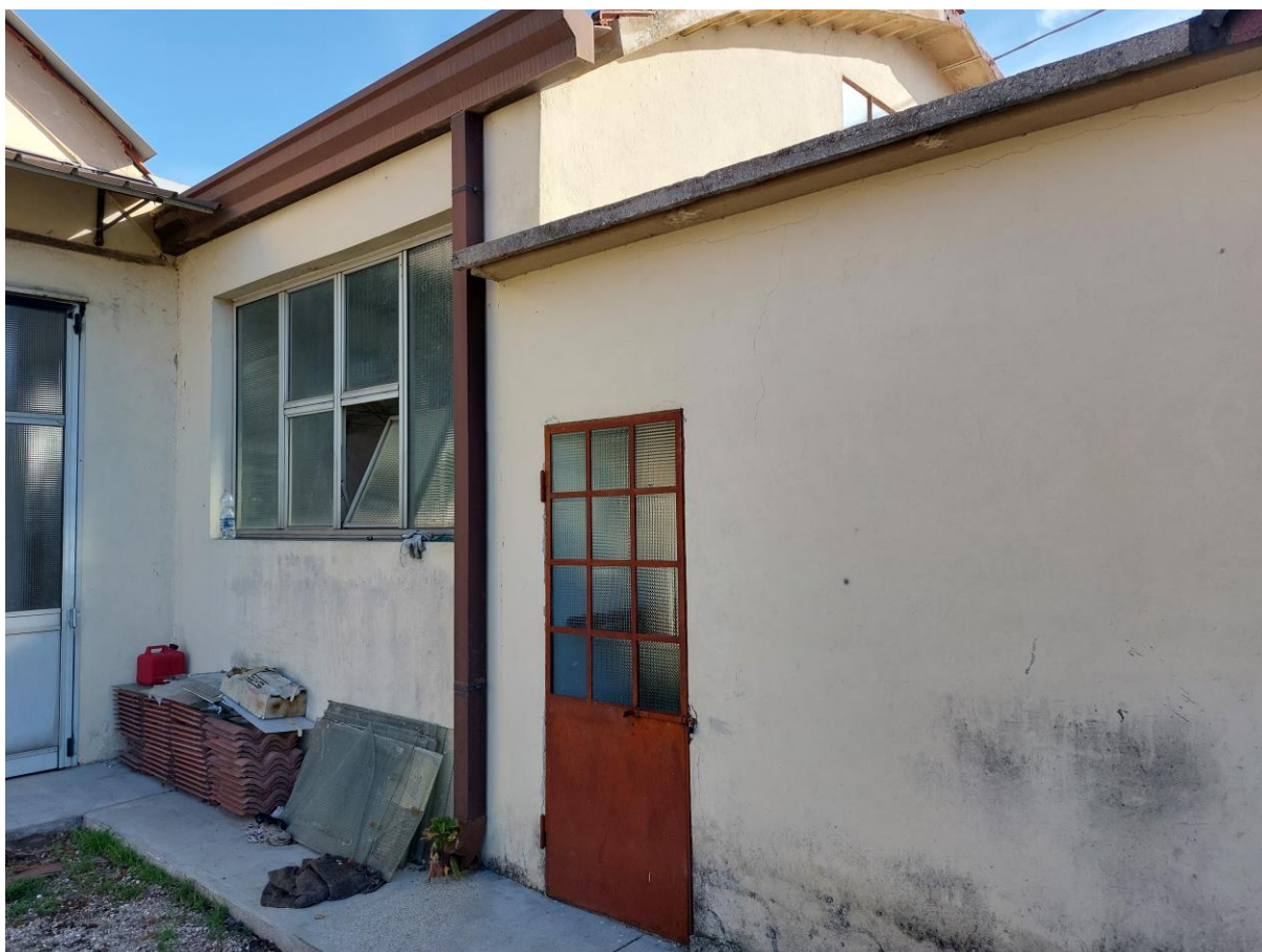
Foto n° 32 – Lotto 1 – 22/08/2022 - Comune di Pordenone – Foglio 11 – mappale 417 sub 4 - Particolare dell'accesso ad uno dei locali di servizio di cui alla foto precedente.