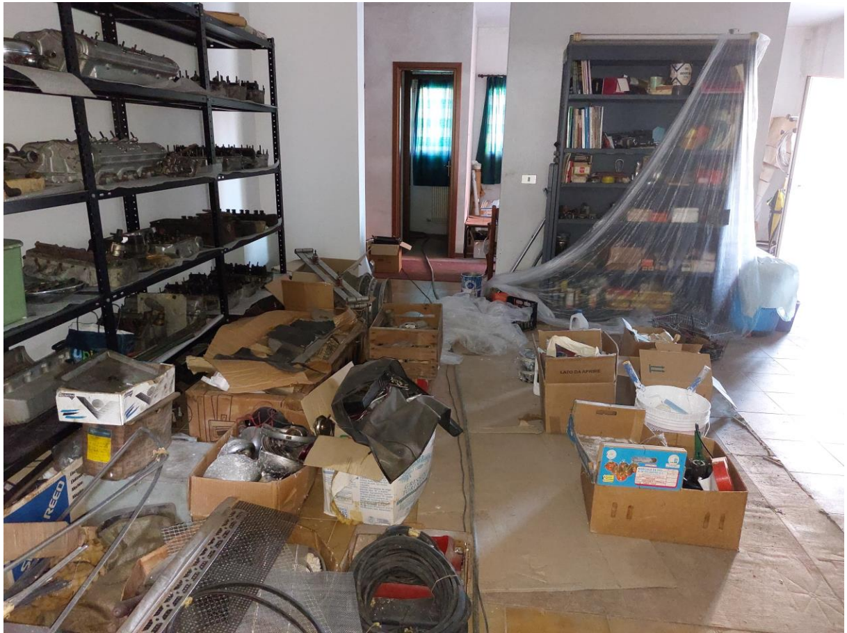
Foto n° 45 – Lotto 1 – 22/08/2022 - Comune di Pordenone – Foglio 11 – mappale 417 sub 1 – Veduta della porzione sud-ovest del primo locale di cui alla foto precedente, in realtà destinato a deposito.