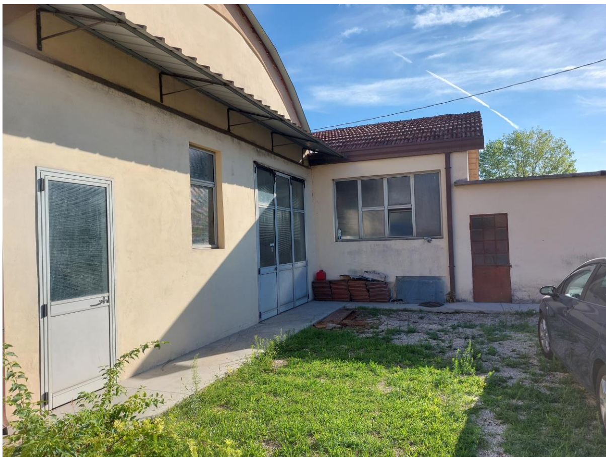
Foto n° 31 – Lotto 1 – 22/08/2022 - Comune di Pordenone – Foglio 11 – mappale 417 sub 4 - Veduta, dall'area comune di pertinenza, degli accessi al capannone uso laboratorio (a sinistra) e a uno dei locali di servizio (a destra).