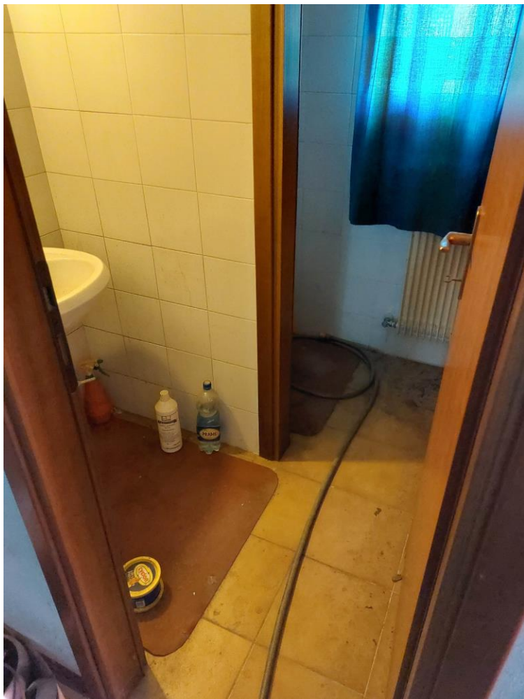
Foto n° 49 - Lotto 1 - 22/08/2022 - Comune di Pordenone - Foglio 11 - mappale 417 sub 1 - Veduta interna del vano uso WC e lavamani.