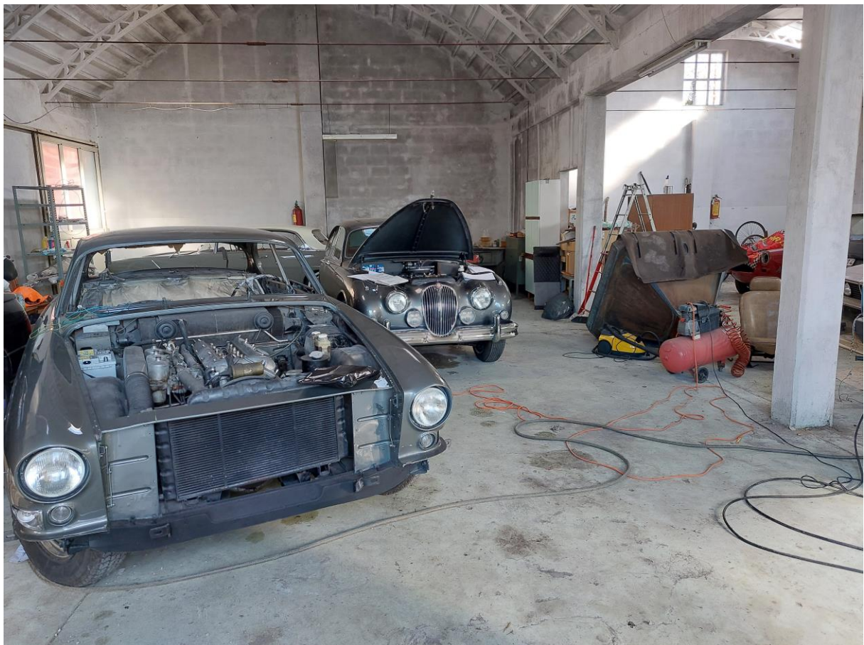
Foto n° 40 - Lotto 1 - 22/08/2022 - Comune di Pordenone - Foglio 11 - mappale 417 sub 4 - Veduta, dall'ingresso principale, della parte centrale del capannone.