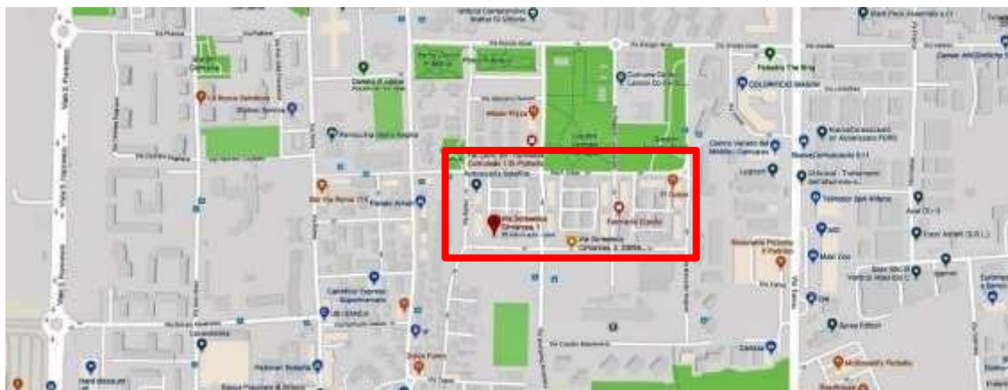
QUARTIERE SATELLITE PLANIMETRIA