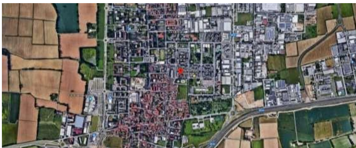
QUARTIERE SATELLITE VISTA DA ALTO