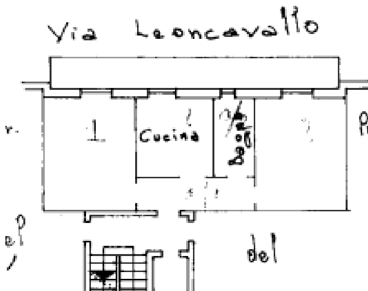
STRALCIO PLANIMETRIA CATASTALE