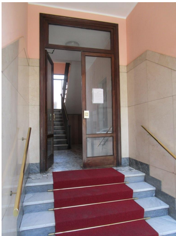
Foto 3 – Vista e inquadramento da via Zuretti, dell'unità immobiliare