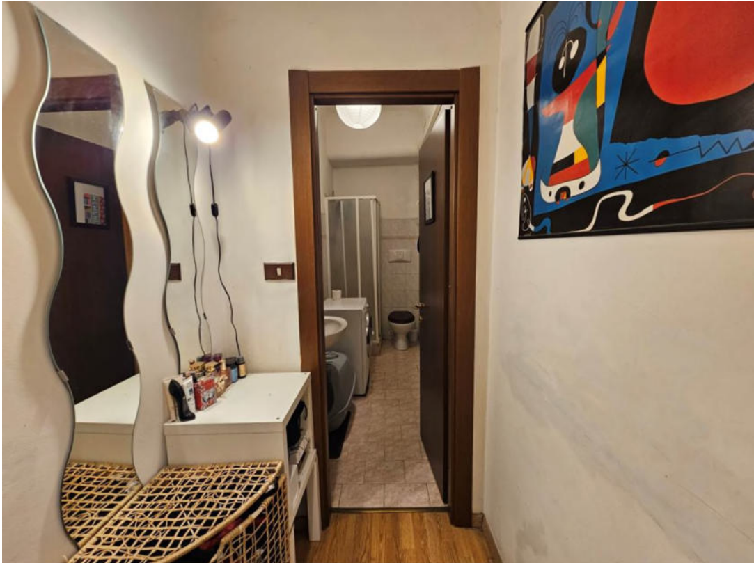
Disimpegno (vista verso il bagno)