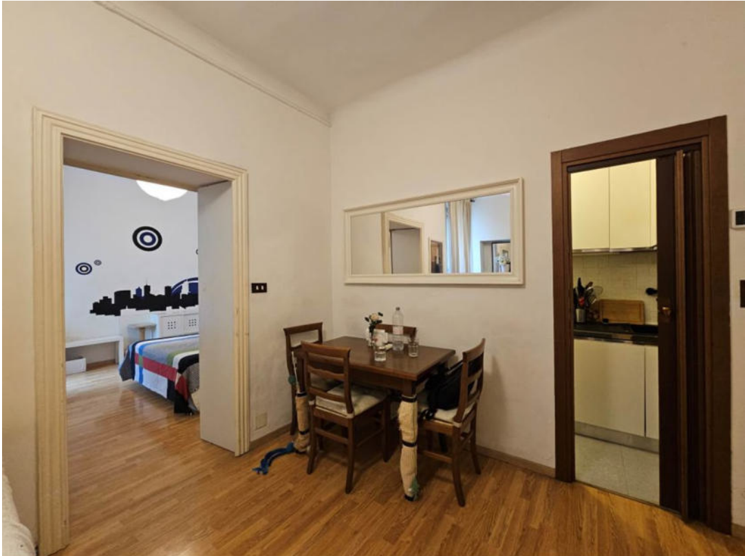
Spazio giorno, vista verso la zona cottura