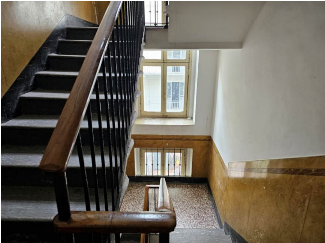
Scala comune di accesso