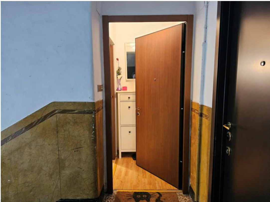
Vista verso l'ingresso