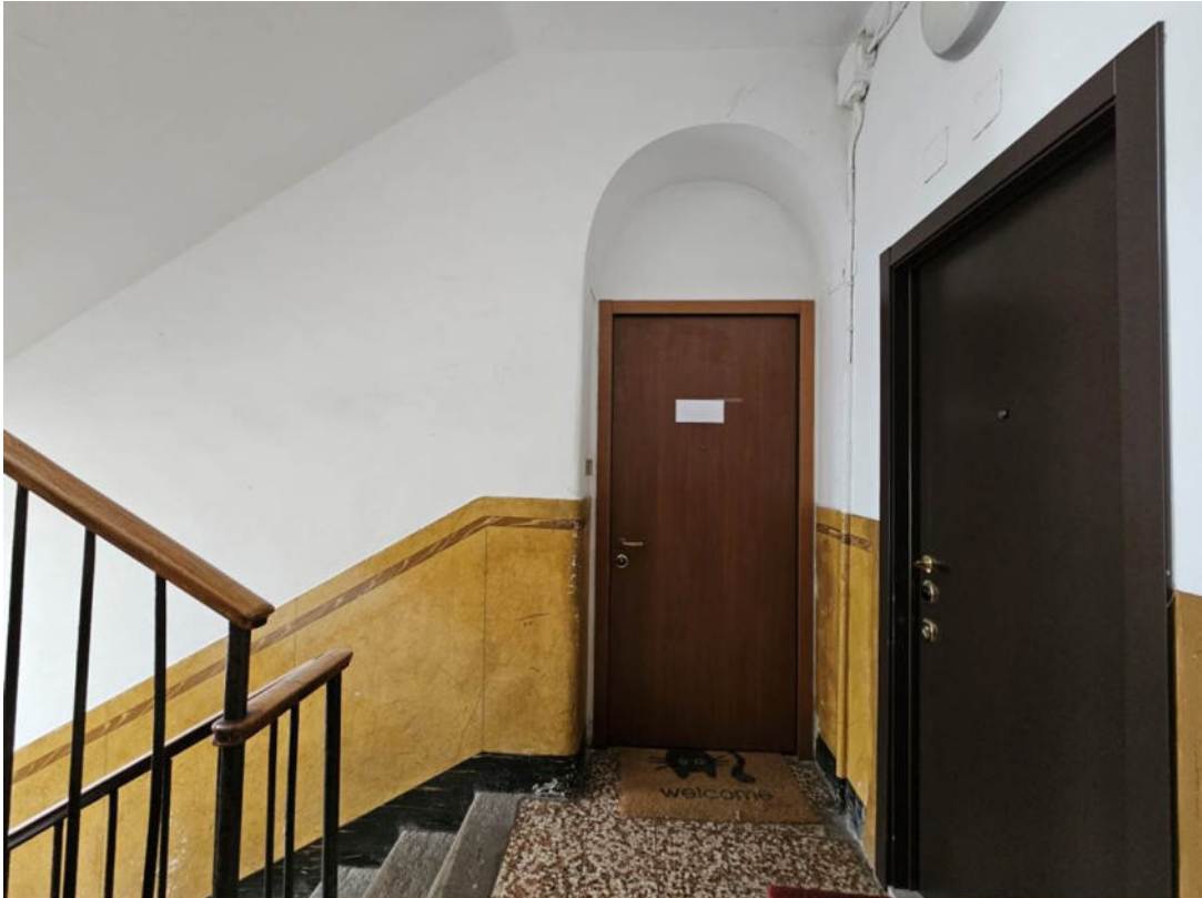
Pianerottolo di ingresso