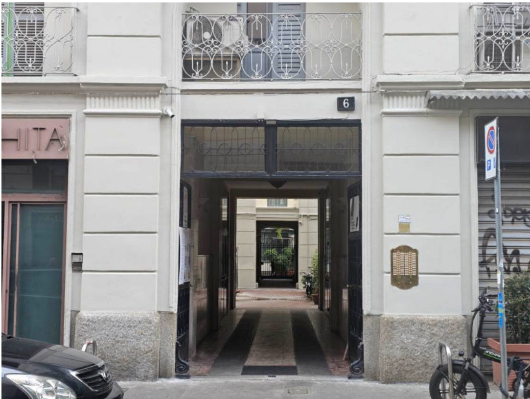
Viste esterne del complesso immobiliare