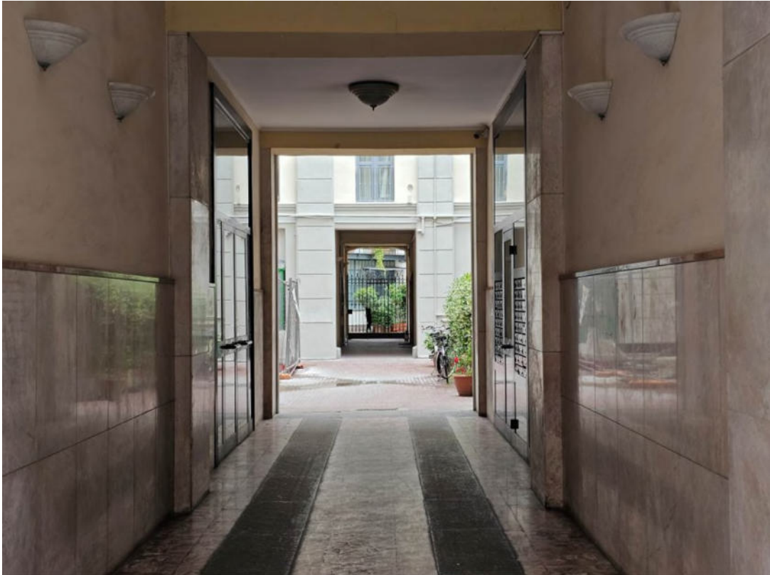
Androne di accesso