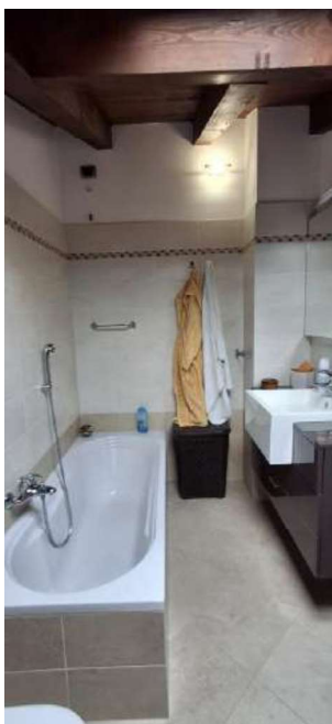
BAGNO ABUSIVO SOTTOTETTO