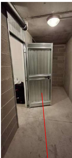
CANTINA DEL SUB 44