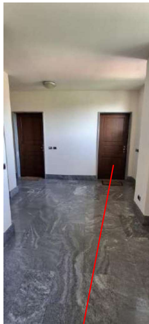
INGRESSO SUB 44