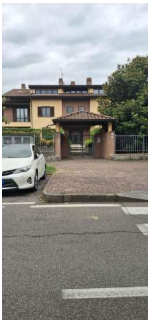
VIA PALERMO, 4

RODANO (MI) – VIA PALERMO, 4 – DATA SOPRALLUOGO 15/05/2025 + 03/06/2025 APPARTAMENTO P.1/2/S1 - FG. 5, PART. 925, SUB. 44