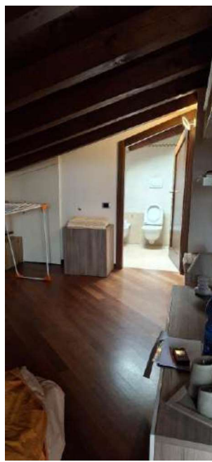
CAMERA ABUSIVA SOTTOTETTO