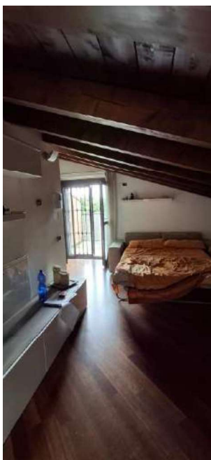
CAMERA ABUSIVA SOTTOTETTO