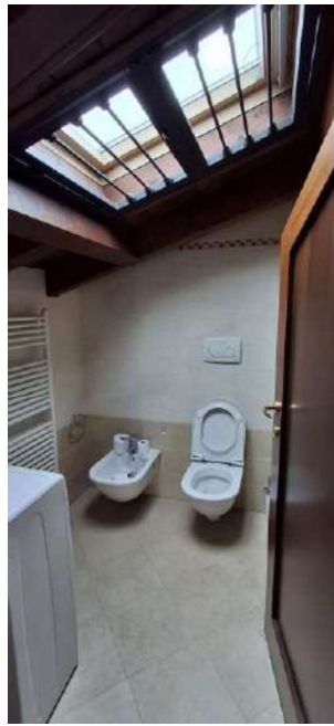
BAGNO ABUSIVO SOTTOTETTO