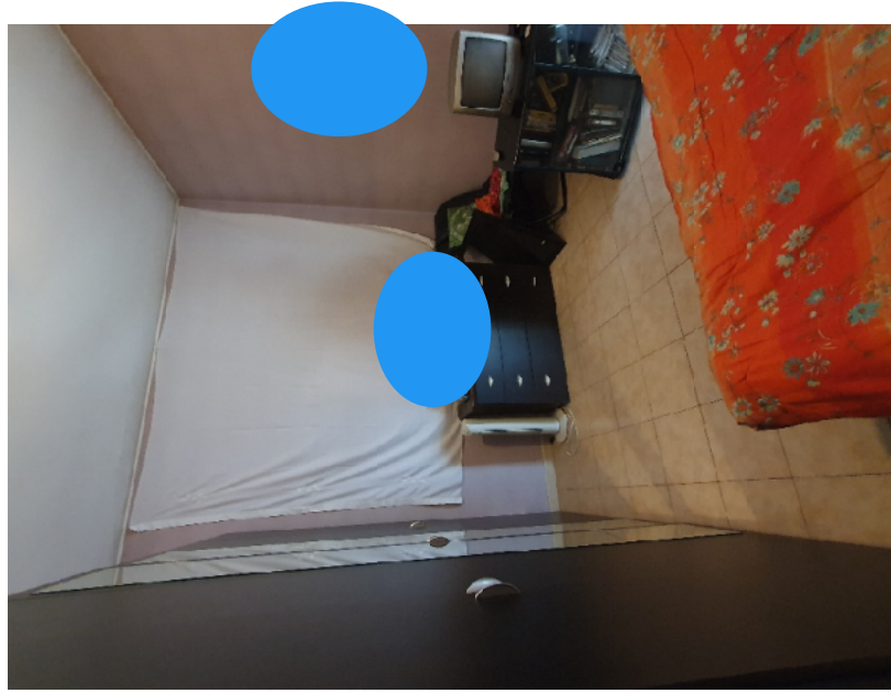
PORTA DI INGRESSO - CITOFONO