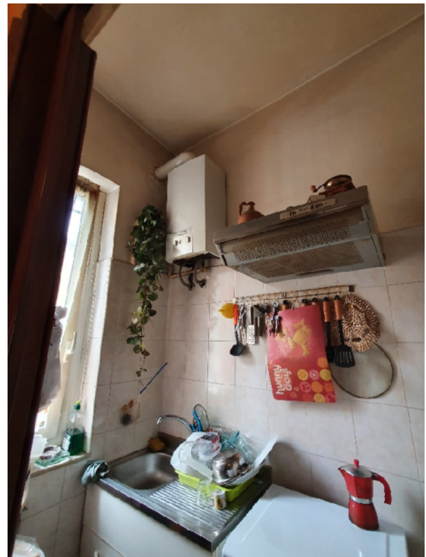
SCALDA ACQUA - CAPP