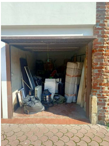
BOX SUB 706