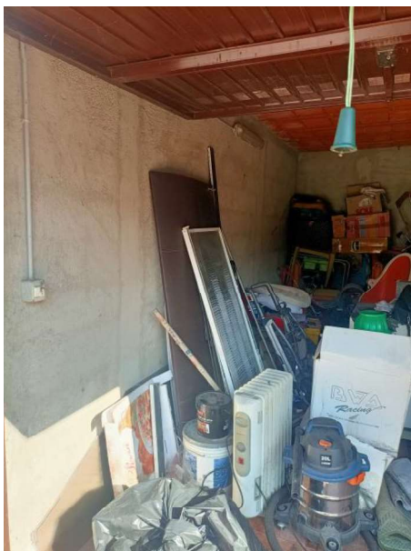
BOX SUB 706