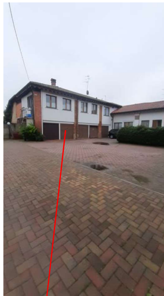
BOX SUB 706