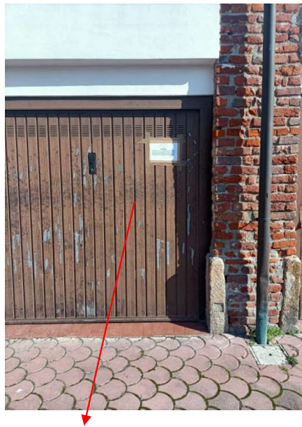
SUB 796 SARACINESCA INGRESSO