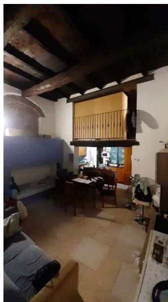
LOCALE LABORATORIO USATO ABUSIVAMENTE COME SOGGIORNO/LETTO