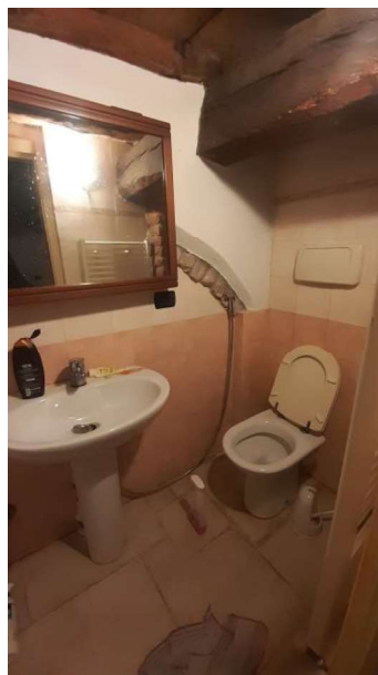
RIPOSTIGLIO IN QUOTA ATTREZZATO A WC ABUSIVO