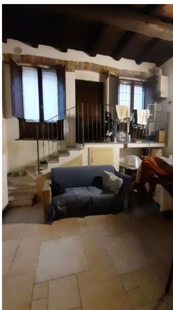
LOCALE LABORATORIO USATO ABUSIVAMENTE COME SOGGIORNO/LETTO