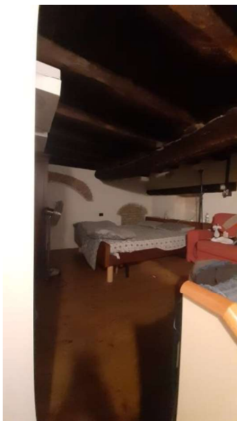
RIPOSTIGLIO IN QUOTA USATO ABUSIVAMENTE COME CAMERA