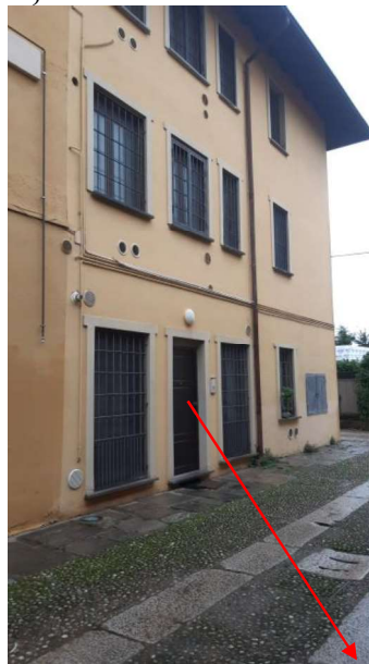
INGRESSO LABORATORIO SUB 709