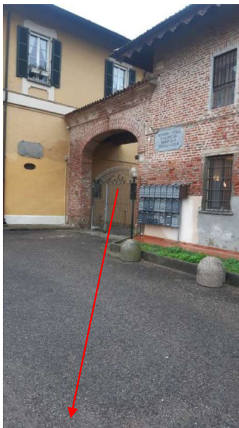
VIA BUDRIO 40

MILANO (MI) – VIA BUDRIO , 40/42 – DATA SOPRALLUOGO 17/10/2024 BOX P.T - FG. 367, PART. 95, SUB. 706