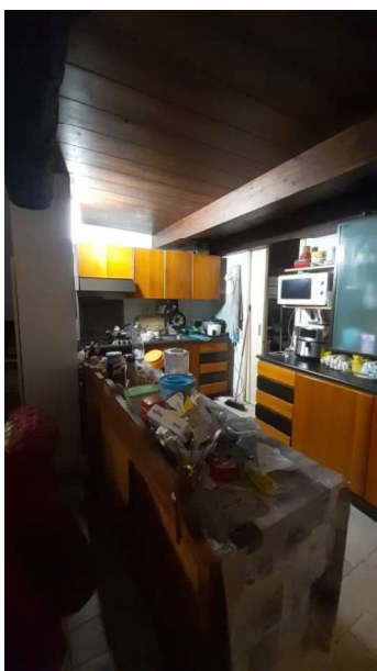
ZONA COTTURA ABUSIVA