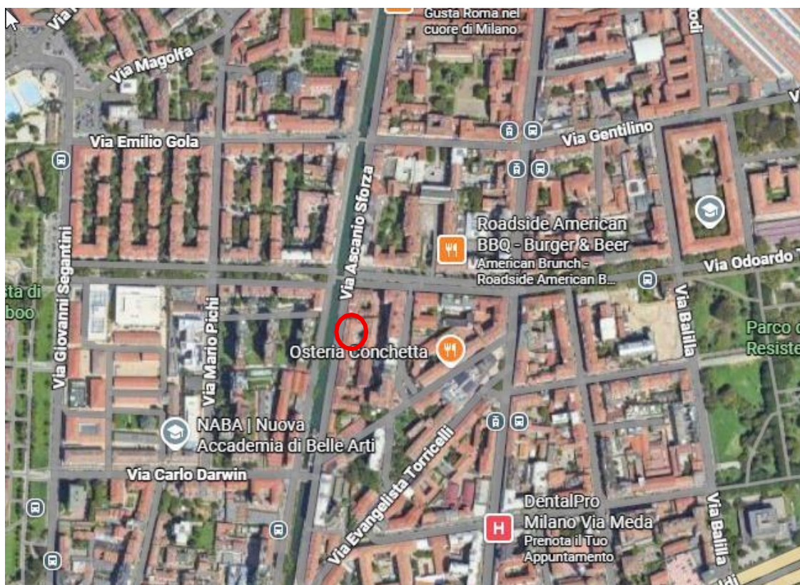
Viste da google maps

La vicinanza ai Navigli conferisce al contesto un'elevata attrattività residenziale e turistica, pur comportando in alcune fasce orarie un discreto livello di traffico veicolare e pedonale